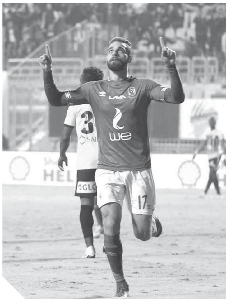
«السولية»، يتألق ويستعيد مستواه

على صعيد آخر، ينتظم في التدريبات الجماعية الرباعي أحمد فتحى ومروان محسن والمغربي وليد أزارو وصالح جمعة لاعبي الفريق بعد أن تعافى الرباعي من الإصابات العضلية التي اشتكا منها.. ويعقد الرباعي جلسة مع لاسارتى للتأكد من جاهزيتهم وإمكانية مشاركتهم في لقاء الداخلية.