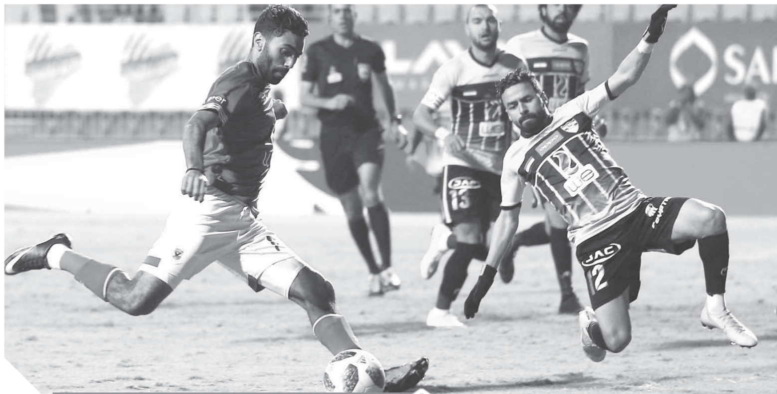
«الشحات»، لم يقدم المستوى المطلوب في آخر 3 مباريات