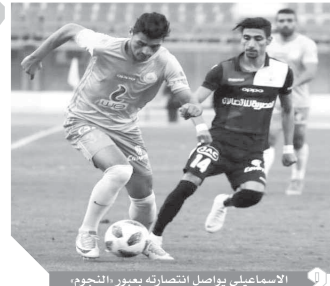
الإسماعيلي يواصل انتصاراته بعبور «النجوم»