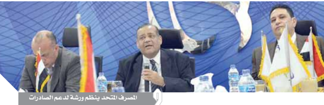
المصرف المتحد ينظم ورشة لدعم الصادرات

ورصد شنواوى 5 تحديات تواجه تنمية التجارة وزيادة حجم الصادرات المصرية عالمياً أهمها: الشحن - صعوبة النقل - اللوجيستيات - مشكلة التمويل وضمان مخاطر التصدير، لهذا كان المصرف المتحد معنى بجرتية ضمان مخاطر الصادرات وربطها بقرار التمويل السابق والتالى على الشحن.