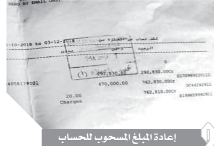
إعادة المبلغ المسحوب للحساب

فيه عملية اختفاء المبلغ إلى وجود تشابه بين الاسمين، اسم مفوض الشركة، واسم العميل الذي قام بالسحب، وهو تبرير جديد بعد التبرير الأول وهو تشابه في أرقام الحسابات، وهذا ما يطرح تساؤلات عديدة تنمى للعملاء.. وكيف يقع العملاء في بنك يحدث فيه مثل