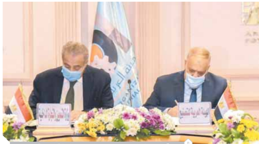
توقيع بروتوكول تعاون بين وزارة التموين والهيئة العربية للتصنيع

أكد المركز الإعلامي لمجلس الوزراء أن جميع السلع التموينية، سواء المطروحة بالمجمعات الاستهلاكية أم بحال البقالة التموينية أم بفروع جمعيتي، بما فيها الزيت، آمنة وسليمة تماماً، وتخضع للفحص والرقابة من قبل الجهات المعنية، للتأكد من مدى الالتزام بالاشتراطات التموينية والصحية الخاصة بالسلع، مع اتخاذ كل الإجراءات القانونية حال رصد أية مخالفة. وأوضحت الحكومة أن هناك مخزوناً استراتيجياً من السلع الأساسية لدى المنافذ التموينية، يكفي احتياجات المواطنين عدة أشهر مقبلة، مثل: الزيت، والسكر، والأرز، والمكرونة، والبقوليات، والشاي، وغيرها من السلع التي يتم صرفها لأصحاب البطاقات التموينية شهرياً، فضلاً عن طرح الوزارة كميات كبيرة من السلع المختلفة ليختار منها المواطن صاحب بطاقة الدعم وفقاً لاحتياجات أسرته وكذلك لعدد الأفراد المقيدين على بطاقة الدعم الخاصة به. من ناحية أخرى وقع، أمس، كل من الدكتور على المصيلحي، وزير التموين، والفريق عبدالمنعم