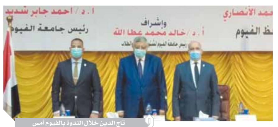
تاج الدين خلال الندوة بالفيوم أمس

أكد الدكتور محمد عوض تاج الدين، مستشار الرئيس لشئون الصحة والوقاية، أن فيروس كورونا مرض صعب وسريع الانتشار. وأشار تاج الدين، في ندوة بجامعة الفيوم، أمس الاثنين، إلى أن الحماية الشخصية هي الوسيلة الوحيدة المؤثرة للوقاية من المرض، من خلال اتباع الإجراءات الاحترازية والنظافة الشخصية، والحفاظ على التباعد الاجتماعي. وشدد مستشار الرئيس على ضرورة الحذر خلال الفترة المقبلة، لأن الأزمة لا تزال مستمرة، رغم تراجع أعداد المصابين بفيروس كورونا. وأشار تاج الدين بالخطوات التي قامت بها الدولة بمجرد إعلان منظمة الصحة العالمية عن فيروس كورونا كوفيد-١٩، ومنها: