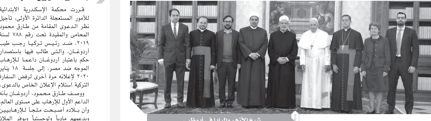
شيخ الأزهر والبايا فى أبو ظبى

التنوع البشرى ثقافياً ودينيًا. وقال قداسة البابا فرنسيس إن وثيقة الأخوة الإنسانية كانت حلماً بعيداً، ولكن بمشيئة الرب أصبحت حقيقة وواقفاً، مطالباً أعضاء اللجنة ببذل المزيد من الجهد لترجمة هذه الوثيقة التاريخية إلى برامج وتشريعات ومبادرات تسهم بحق فى نشر المحبة والأخوة بين الناس، مضيفاً أن بيت العائلة الإبراهيمية فكرة عميقة تجسد الأخوة الإنسانية التى نسعى إليها جميعاً. وأكد فضيلة الإمام الأكبر و قداسة بابا الفاتيكان تقديرهما للاهتمام العالمى بوثيقة الأخوة الإنسانية، معربين عن تقديرهما لدعم الرئيس عبد الفتاح السيسى رئيس جمهورية مصر العربية، لجهود الأزهر الشريف فى العمل على تحقيق الأخوة الإنسانية والتسامح وترسيخها واقعياً بين الناس، كما أعربا عن تقديرهما لرعاية ودعم صاحب السمو الشيخ محمد بن زايد آل نهيان ولي عهد أبوظبي، للوثيقة ولجنة الدولية المنوطة بتحقيق أهدافها، وتدليل كافة الصعاب من أجل تحقيق أهدافها المنشودة.