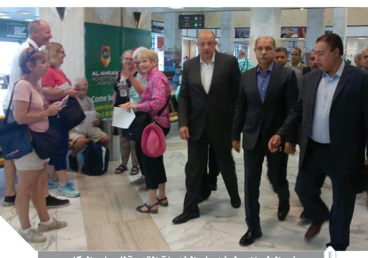
وزير الطيران يطمئن على الخدمات المقدمة للسياح والركاب