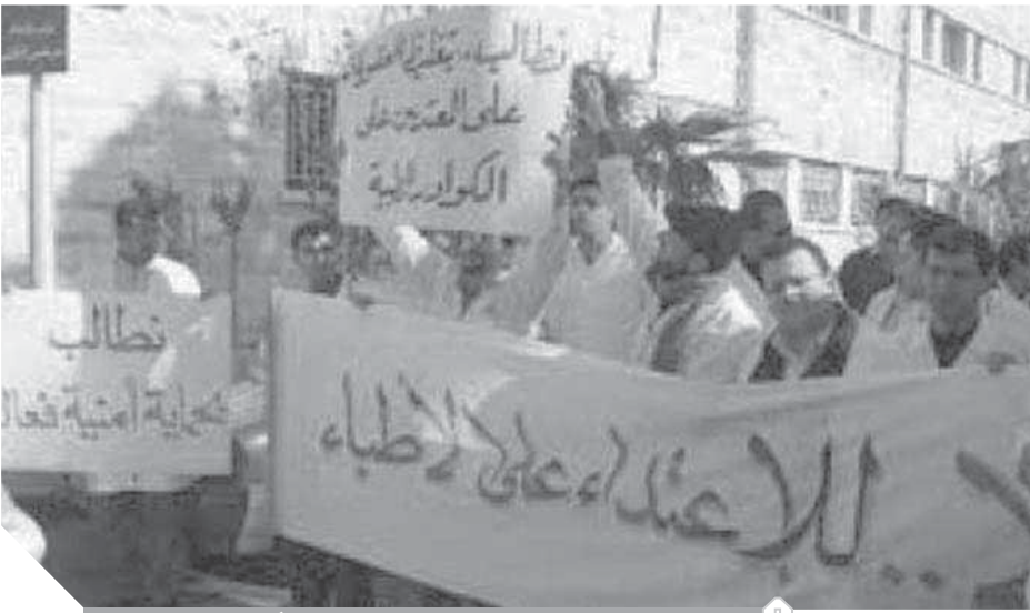
مطلوب قانون يجرم الاعتداء على الأطباء

رئيس لجنة «الحق في الصحة»: وقف الاعتداء على الأطباء يحتاج إلى توفير المستلزمات الطبية