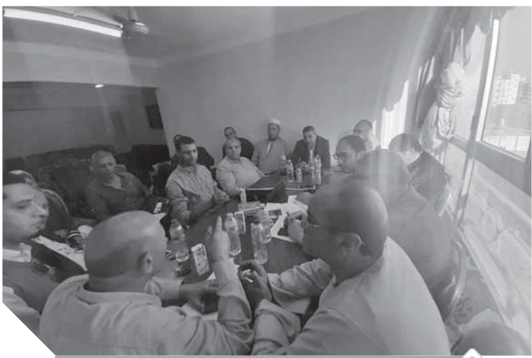
لجنة الوفد بكفر الشيخ أثناء الاجتماع