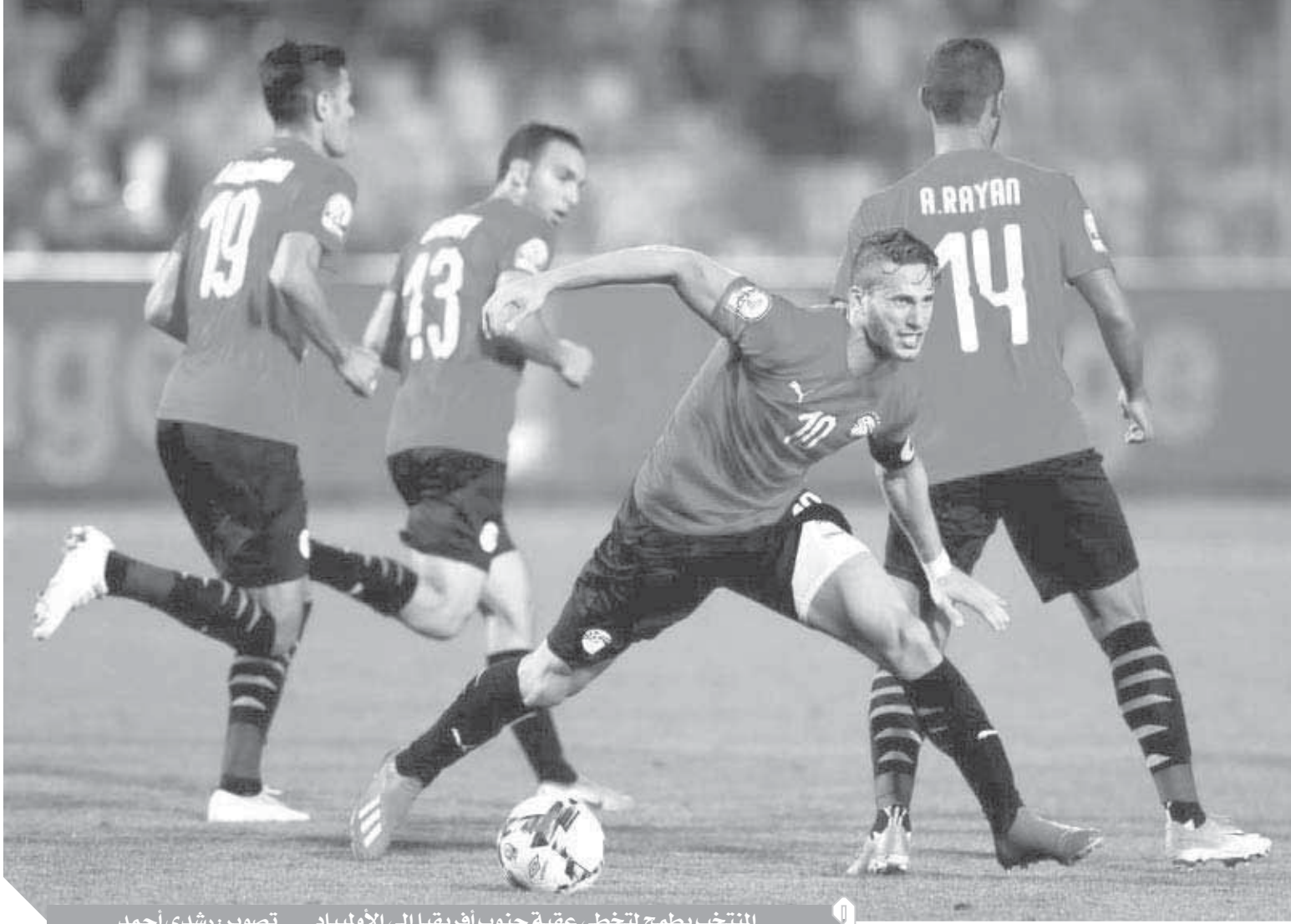
المنتخب يطمح لتخطى عقبة جنوب أفريقيا إلى الأولمبياد

وتابع: «تلقينا هدفًا واحدًا فى دور المجموعات، وهذا مؤشر جيد لنا وسيساعدنا فى الدور المقبل ونعلم قوة خط هجوم المنتخب المصرى، لكننا سنركز على تجنب الأخطاء كما فعلنا فى مباراة نيجيريا اليوم، حيث تمكنا من إيقاف خطورتهم الهجومية».