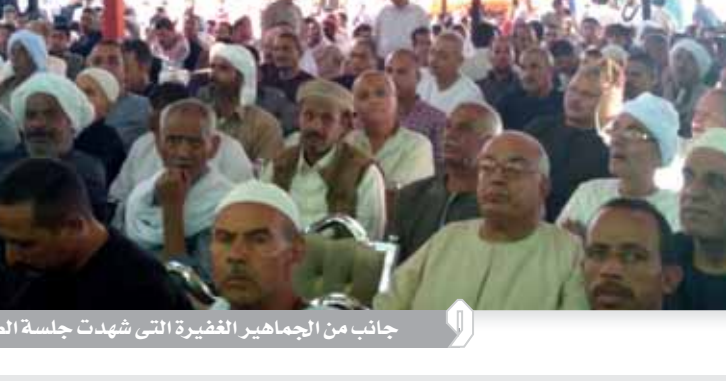
جانب من الجماهير الغفيرة التي شهدت جلسة الصلح