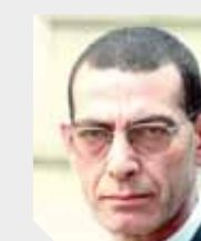
وجدى زين الدين يكتب؛