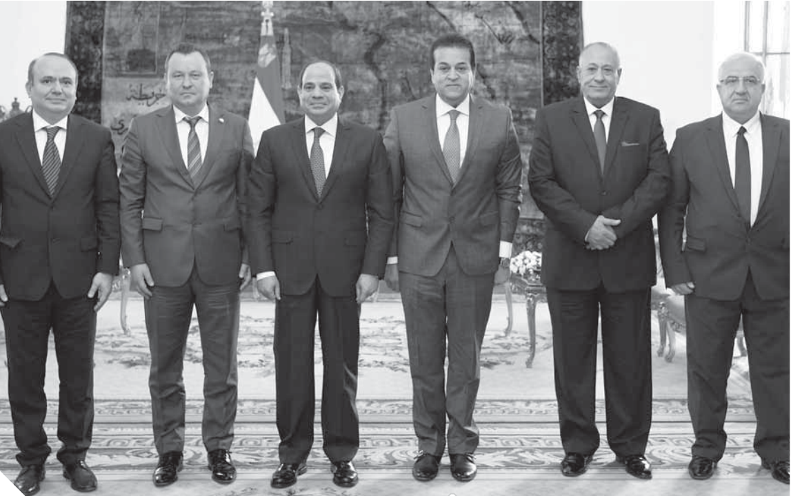
الرئيس وسط وفد جامعة الدراسات الاقتصادية برومانيا

كما ونوعاً، والتي ساهمت بشكل حاسم فى تحسين الخدمات المقدمة للمواطنين المصريين وإعادة رسم الخريطة التنموية لمصر وفتح آفاق المستقبل فى جميع المجالات. كما أشار مستوفى جامعة بوخارست إلى الدور المؤثر والملموس للسياسى فى تعزيز العلاقات الثنائية بين مصر ورومانيا وتعميق قيمتها، لا سيما على المستوى الأكاديمى والثقافى، مشيداً فى هذا الإطار بالاهتمام والجهود الحثيثة للرئيس للتطوير