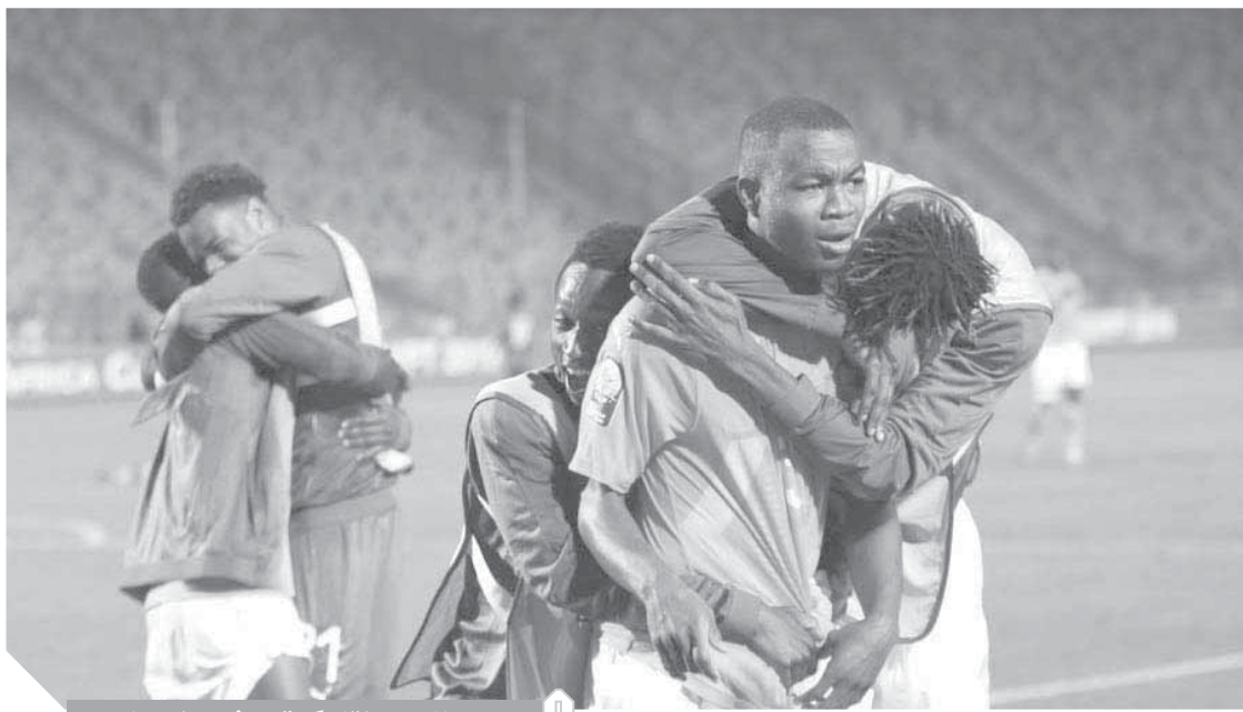
جانب من لقاء كوت ديفوار وزامبيا

وأتم: «ما أود قوله والتأكيد عليه قبل مواجهة كوت ديفوار أننا سنلعب اللقاء وكأنه مباراة نهائية، وهذا ما سأتقله للاعبين فى المحاضرات التى تسبق اللقاء».