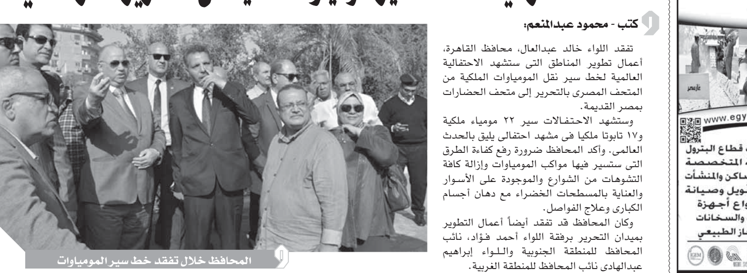
المحافظ خلال تفقد خط سير الموميوات