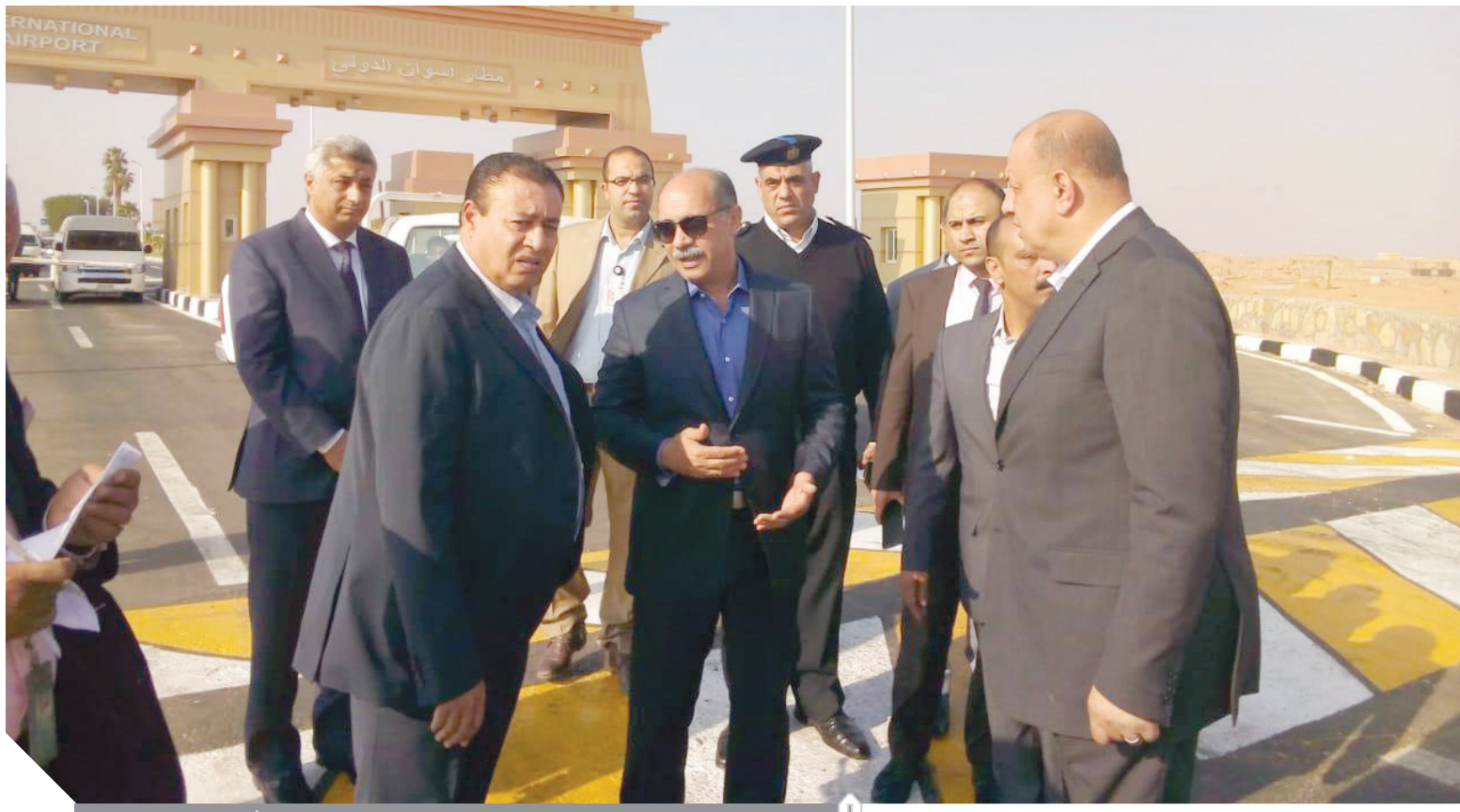
الفريق يونس المصري واللواء وائل النشار خلال تفقد مطار أسوان