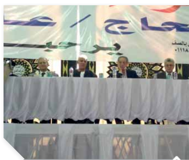
الجمال والقيادات الأمنية خلال جلسة إنهاء الخصومة

● وتبقى كلمة: نهني وزارة النقل والمواصلات بوصول الدفعة الأولى من الجرارات الأمريكية يوم ٢٩ من الشهر الحالى من أجل تطوير هذا المرفق الهام والحيوى ليحول من مقبرة المواطن والشوارع إلى هيئة تزويج أو تدمير.. وأخيراً: لا شكر على واجب معالي الوزير.