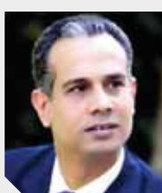
محمد مهاد يكتب؛

خلال تقاتلهم عبر خطوط السكة الحديد. وأعلن وزير النقل خلال لقائه بعدد من الركاب مواقف القيادة السياسية على تطوير قطار أبوقير وتحويله إلى مترو، وذلك ضمن خطة تطوير منظومة النقل بمحافظة الإسكندرية. وأشار إلى التعاقد مع استشارى على لإعداد التصميمات ومستندات الطرح الخاصة بالمشروع الذى تصل تكلفته إلى ١,٥ مليار يورو.