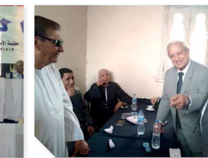
مدينة وسفير نور وابطاظة والجمال خلال جلسة إنهاء الخصومة الثارية