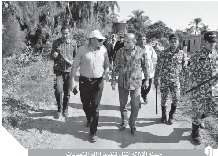
حملة الإزالة أثناء تنفيذ إزالة التعدييات