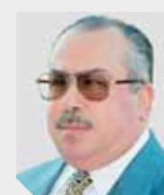
عباس الطرابيلى يكتب؛