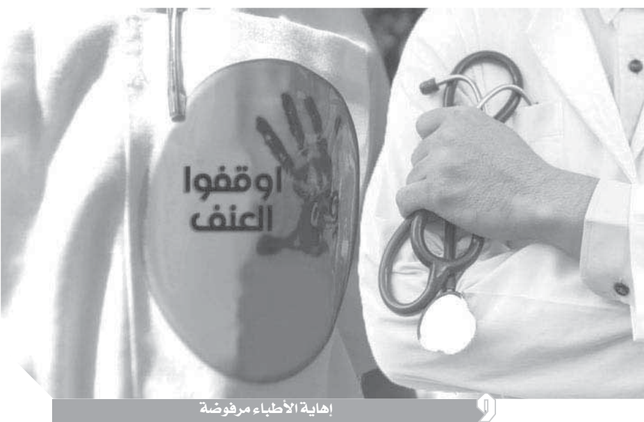
إهانة الأطباء مرفوضة

رئيس لجنة «الحق في الصحة»: وقف الاعتداء على الأطباء يحتاج إلى توفير المستلزمات الطبية