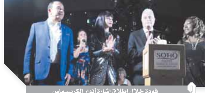
فودة خلال إطلاق إشارة أنوار الكريسماس

كتب - محمود عبدالنعم ويساعمر: أطلق اللواء خالد فودة، محافظ جنوب سيناء، إشارة البدء لانطلاق مهرجان الإنشاءة السنوى، بمنطقة سوهو سكوير بمدينة شرم الشيخ، وسط حضور مئات السائحين من مختلف الجنسيات الذين استمتعوا بالأضائة المبهرة والألعاب النارية والفرقار الفنية العالمية المتعددة، ورحب محافظ جنوب سيناء خلال الحفل بجميع المشاركين والحضور في المهرجان وفي