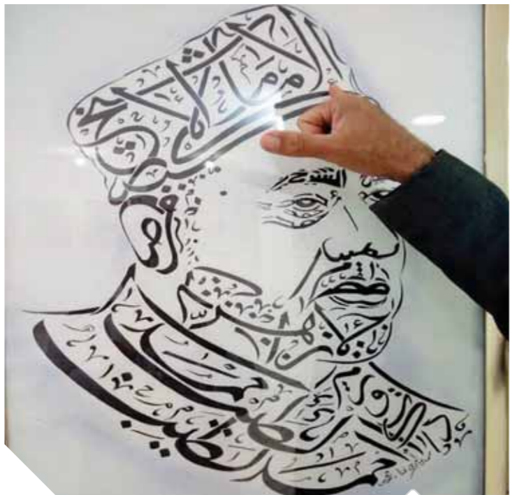
بورتريه من حروف كلمة مصر والطيب لشيخ الأزهر