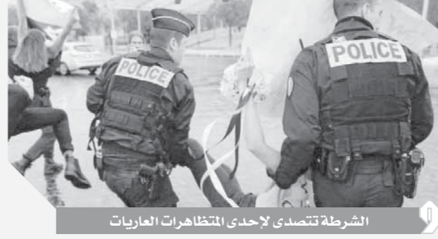
الشرطة تتصدى لإحدى المظاهرات العاريات

لكن قوات الشرطة حالت دون وصولهن للموكب، وتنتمي النساء العاريات إلى حركة «هين»، وهي حركة نسوية متشددة تتخذ من باريس مقراً لها، وغالباً ما تنظم احتجاجات صادمة لرفض التمييز ضد المرأة، والعنصرية، وغيرها من القضايا الاجتماعية والسياسية. وأثار الحادث التساؤلات حول الترتيبات التي تتخذها السلطات الفرنسية لتأمين هذا الحدث العالمي.