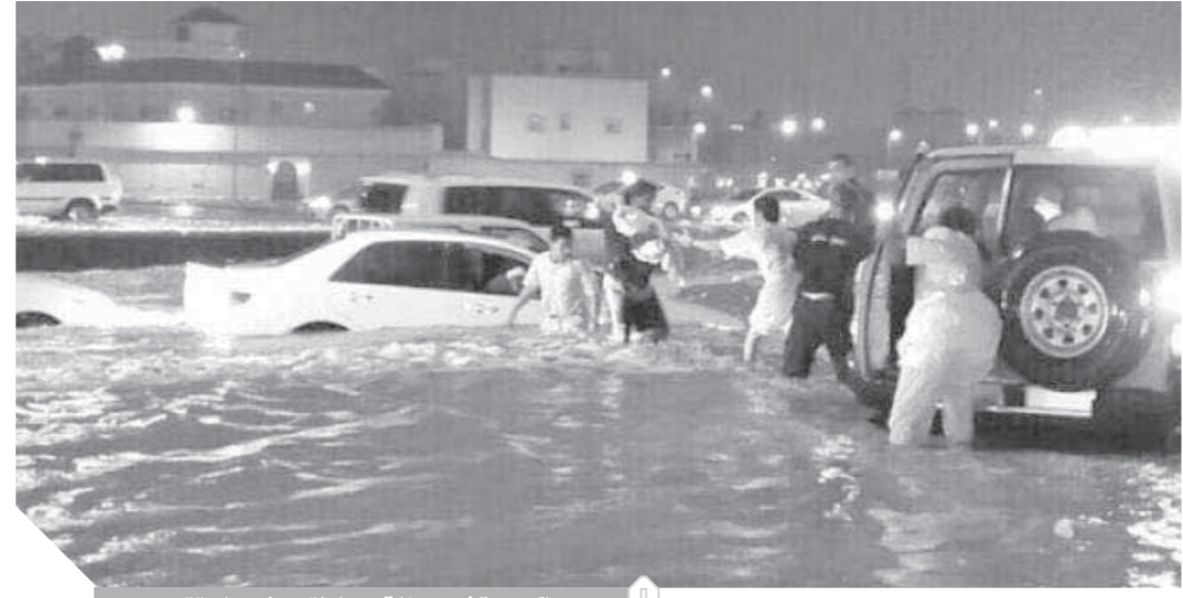
الكويت تشهد حالة من الطقس غير المستقر

مطارات دول مجاورة بسبب سوء الأحوال الجوية. وكان مجلس الوزراء الكويتي قرر تعطيل كافة الوزارات والدوائر والمؤسسات الحكومية والكليات والمدارس الحكومية والخاصة، في ثالث إجراء من نوعه خلال أسبوع بسبب الأحوال الجوية، كما تم تعطيل الدراسة مرتين خلال الأسبوع الأخير، الأولى يوم الثلاثاء الماضي، والثانية الأحد، إثر الأحوال الجوية السيئة. حيث تشهد الكويت منذ الأربعاء، حالة من الطقس غير المستقر وهطول أمطار خفيفة إلى متوسطة مع انخفاض الرؤية الأفقية في بعض المناطق، وسط تحذيرات بضرورة البقاء في المنازل إلا في الحالات الطارئة.