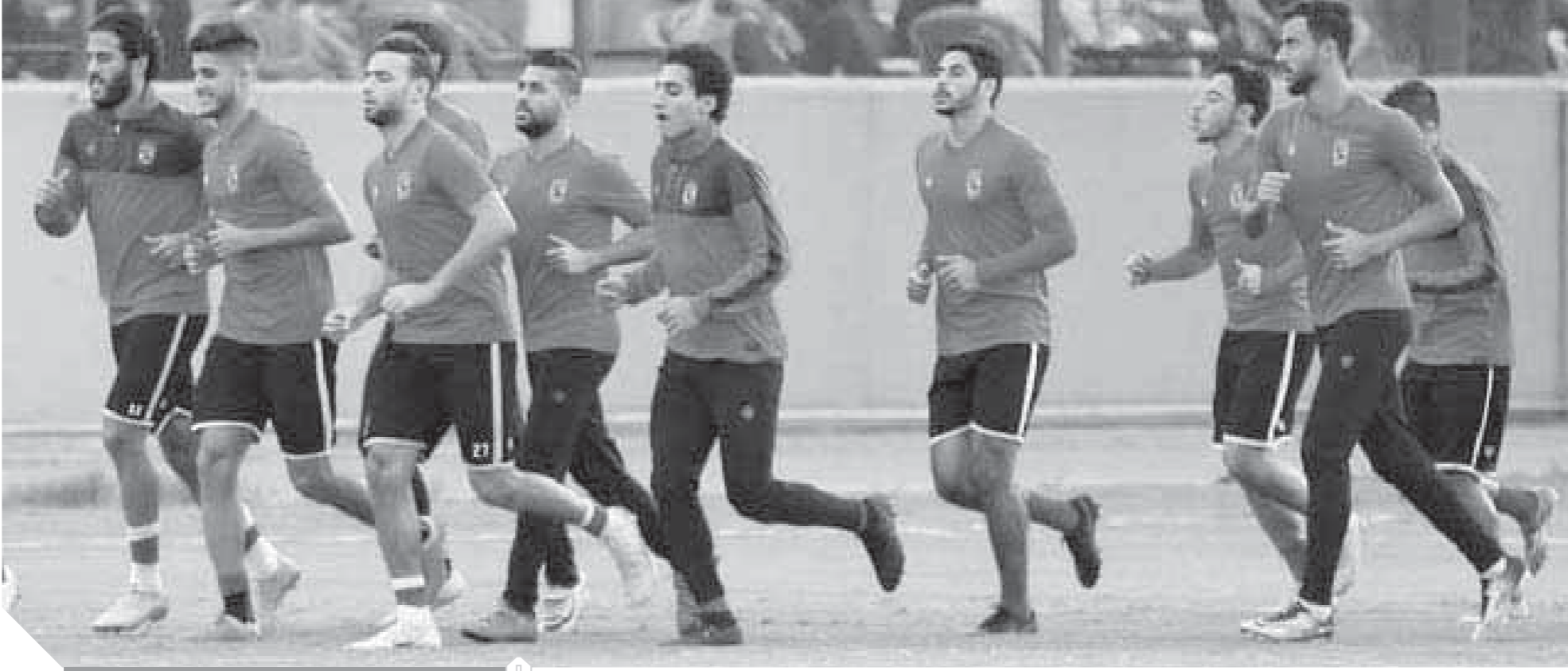
فريق الأهلى ينتظر تغييرات بالجملة