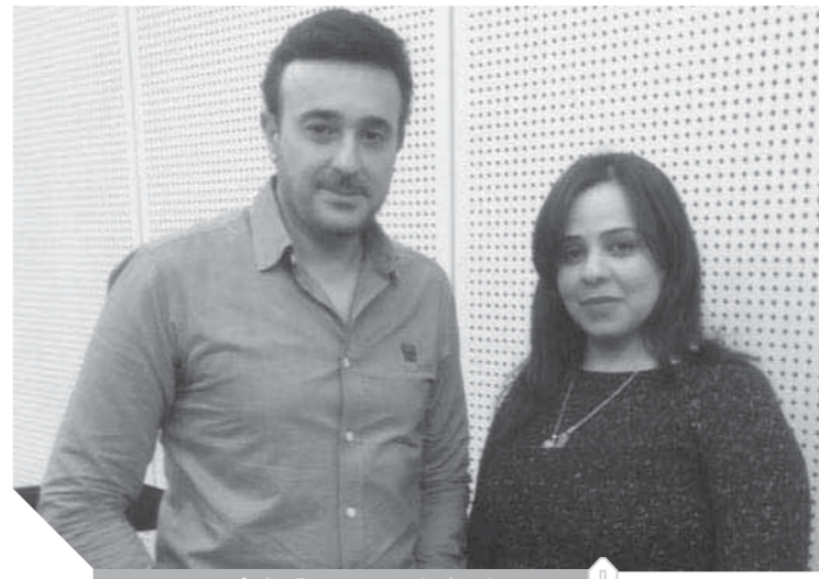
صابر الرباعي مع محررة «الورد»