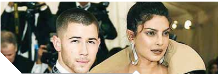
ثنائى هوليوود بريانكا وجوناس