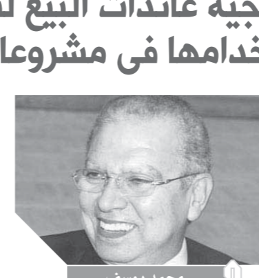
تحقيق: حنان عثمان

لأصولها دون أن يكون له عائذ على أعمالها وإن التشغيل أولى من خلاله يمكن للشركات جردلة الديون وسدادها على مراحل من حصيلة الإنتاج. ويرى اللواء محمد يوسف رئيس مجلس إدارة الشركة القابضة للنقل البحري والبري، أن التصرف في الأراضي المملوكة للشركات وغير المستغلة أمر هام جداً، فهي أصول تملكها الشركات ولا بد أن تعود بالنفع عليها. وقال إن التطوير أولاً هو الأهم للشركات، وإذا كانت هناك شركة تملك قطعة أرض سيتم التصرف فيها، فلا بد أن يكون العائد لصالح الشركة ونشاطها، وأضاف أنه وفقاً للقرارات الوزارية كانت حصيلة بيع الأراضي من قبل توجه إلى صندوق إعادة الهيكلة وتم الاتفاق نحو «90%» من حصيلة الصندوق على مرتبات الشركات التابعة للفرز والتسويق نظراً لظروفها الصعبة والآن حصيلة الصندوق صفر.