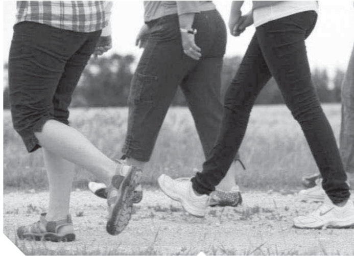
تحديد الهوية برصد طريقة المشي

لم يعد بإمكان اللصوص في الأماكن العامة أو من يقومون بالسطو المسلح على المحلات والبنوك أو أي مكان آخر الفرار بجريمتهم من العقاب مهما أخفوا وجوههم عن كاميرات المراقبة، لأن تقنية جديدة صارت تكشف الهوية من خطوة الشخص أو طريقة السير. فبعد بصمة العين للتعرف على الهوية ونجاح الصين في تطوير وسائل للتعرف على الهويات من خلال وجوه المشاة في الشارع، نجحت مجدداً في تطوير هذا الذكاء الاصطناعي، باستعمال برمجيات متطورة، يمكنها التعرف على الأشخاص وتحديد هوياتهم من خلال شكل أجسامهم وطريقة مشيتهم، وتستعمل هذه التقنية المتطورة في أنظمة المراقبة في شوارع العاصمة بكين ومدينة شنغهاي. التقنية الجديدة طورتها شركة «واتركس»، ويمكن من خلالها تحديد هويات الأشخاص من مسافة تقارب الـ 50 متراً، حتى وإن كانوا لا ينظرون إلى الكاميرا أو كانت وجوههم مخفية، وتعتمد تقنية «واتركس»،