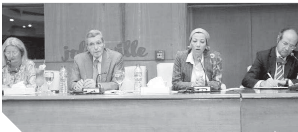
فعاليات الجلسات النقاشية التقنية حول تعميم التنوع البيولوجي

وأوضحت وزيرة البيئة، أن التعاون الوثيق بين الاتحاد الأوروبي ومصر في حماية البيئة من خلال تنفيذ عدد من المشروعات لمواجهة التحديات البيئية، ومنها موضوعات النقل المستدام والاقتصاد الدوار لحماية الموارد الطبيعية، مضيفة أن التحدي الأكبر في عملية دمج البعد البيئي في جميع القطاعات الاقتصادية، ما يسهم في خفض نسب التلوث والحفاظ على الموارد الطبيعية بترشيد الاستهلاك والحفاظ عليها للأجيال القادمة، واستعرضت وزيرة البيئة عدداً من التحديات التي تواجه الاقتصاد الدوار والتنمية المستدامة.