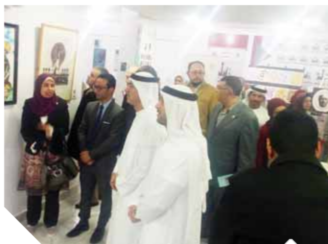
جانب من الحضور فى ملتقى الفنون التشكيلية والخط