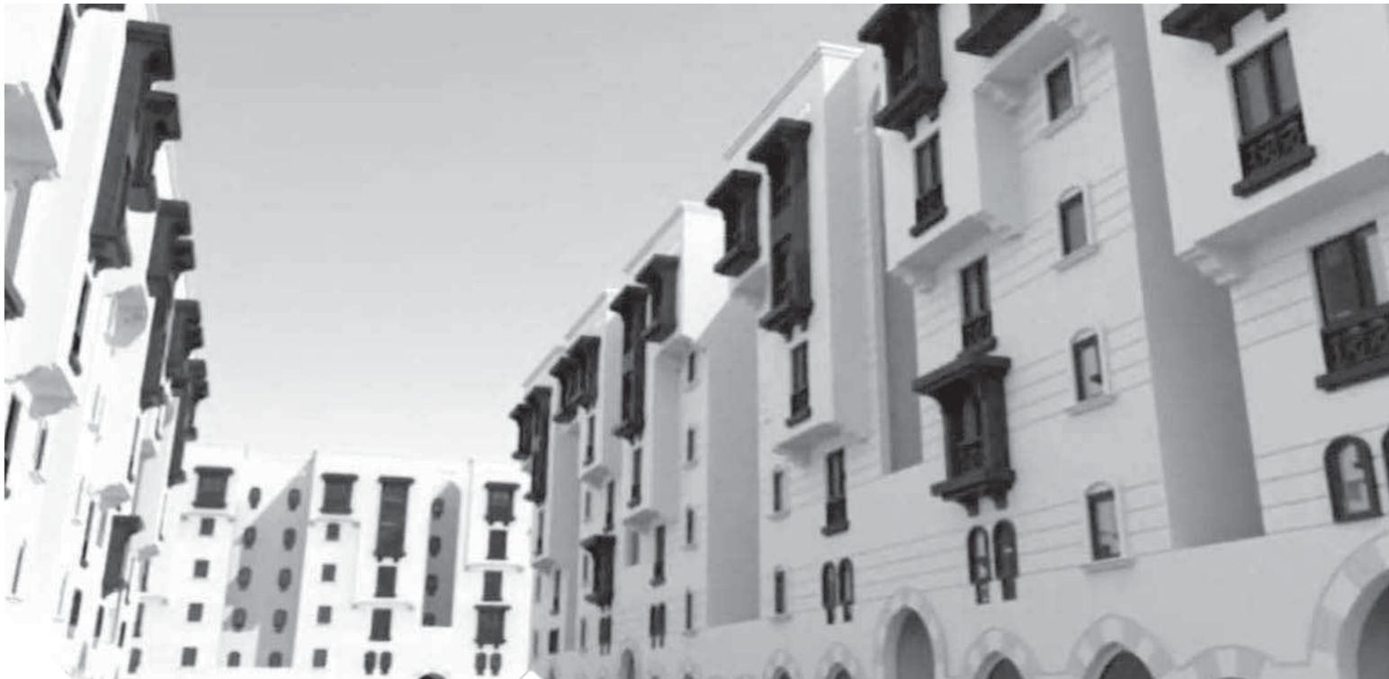
المنطقة بعد انتهاء أعمال التطوير