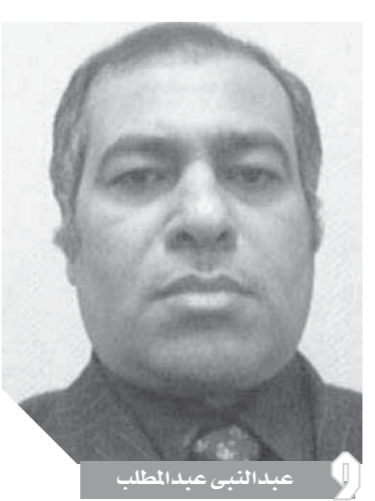
عبد النبي عبد المطلب

تناول الاجتماع مناقشة جوانب الأزمة التي نتجت عن نقص المعروض من محصول البطاطس، والارتفاع الكبير في أسعارها خلال الفترة الماضية، وتم وضع الحلول الكفيلة لعدم تكرارها في المستقبل، وذلك بعد أن عرض ممثلو جمعيات منتجي ومصدري البطاطس أبعاد المشكلة وأسبابها خاصة ما يتعلق بنقص المساحة المزروعة هذا العام من محصول البطاطس، بالإضافة إلى تعرض المحصول لعوامل جوية غير مواتية أدت إلى انخفاض كبير في الإنتاج بالمقارنة بالعام الماضي، وقد وجه رئيس الوزراء بضرورة التعاون بين الحكومة بكافة أجهزتها المعنية، وبين جمعيات المزارعين ومنتجي ومصدري البطاطس، لتفادي تكرار هذه الأزمة من خلال اللجنة التنسيقية للأمن الغذائي والتي تتسق الاتفاق على تشكيلها من عدد من الوزارات والجهات المعنية، وتحقيق التوازن بين العرض والطلب، إضافة إلى قيام وزارة التموين بمطالبة التجار بضخ مخزوناتهم للأسواق في العديد من الفروع والعربات المتقلة بالشوارع وهو ما ساهم في خفض السعر قليلاً.