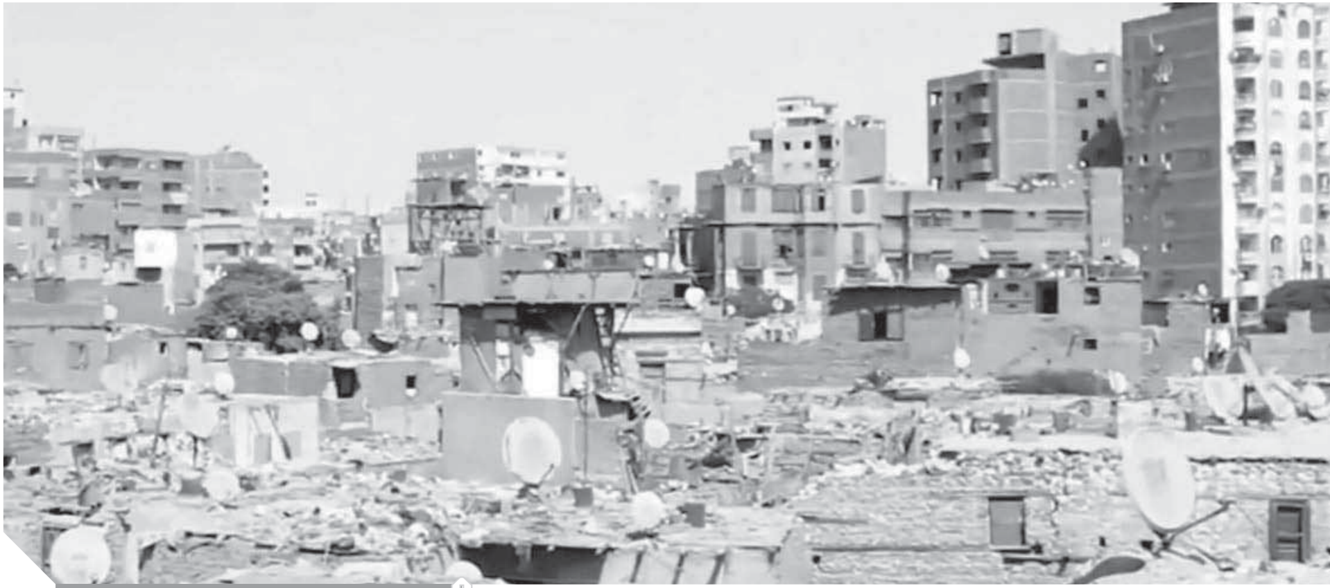
منطقة تل العقارب قبل التطوير

ومع ذلك لا ننطق تماماً مع كل ما ذكر لأننا ما زلنا نثق في القدرة على الفعل العربي إذا توافرت إرادة سياسية حقيقية للأشقاء لتغيير هذا الواقع المؤلم، وهو أمر يدخل في دائرة الممكن وليس مستحيل، رغم تسليمنا بأن هناك العديد من المخاطر التي ما زالت محدقة بخريطة العالم العربي، وقادمة من الشرق والغرب وسيظل وفي مقدمتها «التطرف والإرهاب» الذي يظل علينا براسة التيقن من أن آخر في إطار حرب حقيقية وهذا ما سنحاول إلقاء الضوء عليه في الجزء الرابع والأخير الأسبوع القادم بإذن الله.