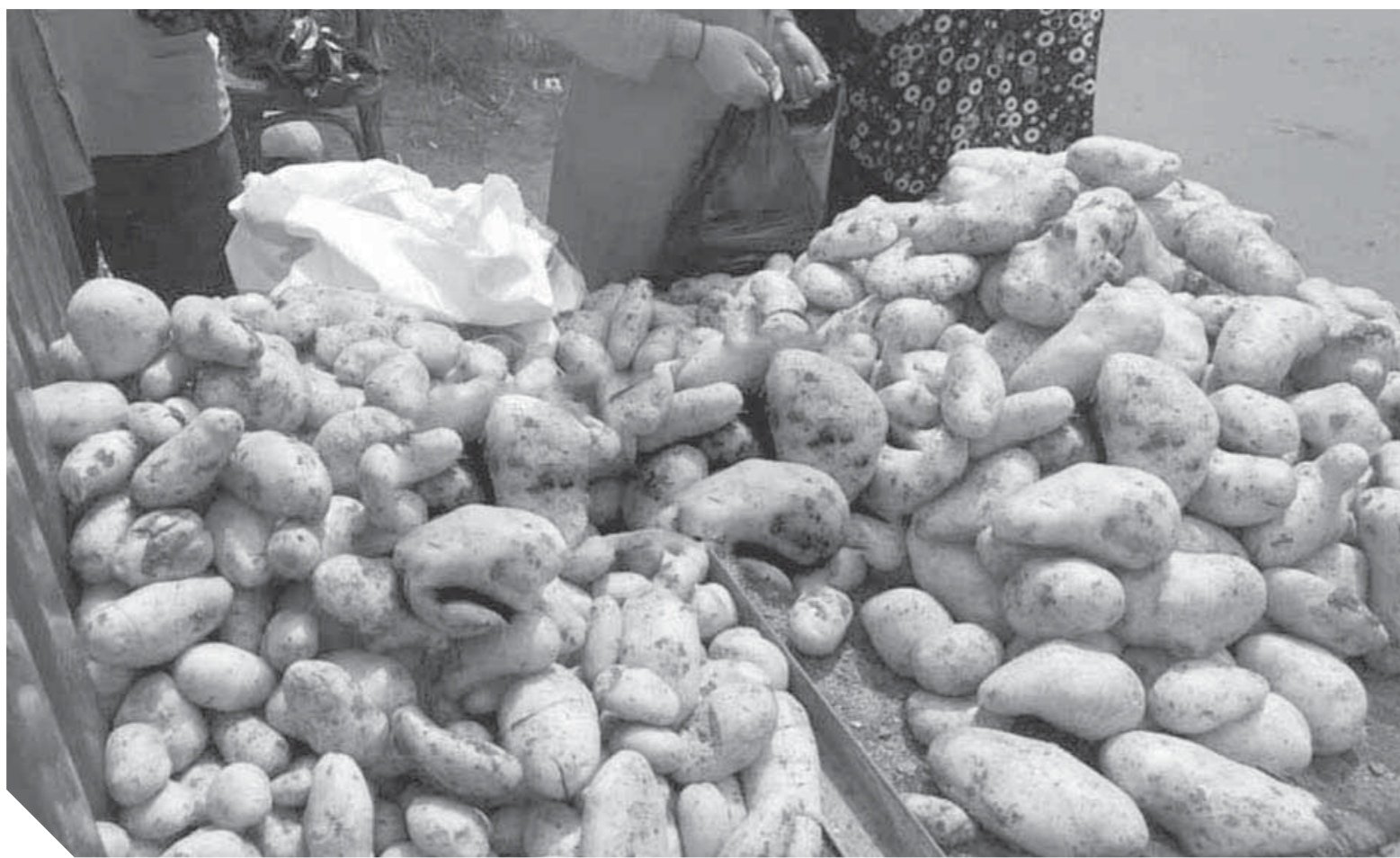
تحقيق: عبدالرحيم أبو شامة

أظهرت البيانات الصادرة عن الجهاز المركزي للتعبئة العامة والإحصاء، استمرار ارتفاع معدل التضخم السنوي للشهر الثالث على التوالي، خلال أكتوبر الماضي ليسجل 17,5% مقابل 15,4% في سبتمبر وأرجعت البيانات السبب في هذا الارتفاع إلى ظاهرة جديدة على المجتمع المصري، وهي ارتفاع أسعار البطاطس حيث شهدت أسعار البطاطس ارتفاعاً غير مسبوق في تاريخ مصر القديم والحديث، جعلها تصدر موائد النقاش بين الأسر، وأصبحت المنهم الرئيسية في ارتفاع معدلات التضخم، بعد أن تجاوز سعرها سعر التلاح المستورد حيث تشير البيانات إلى ارتفاع أسعار البطاطس بنسبة 146,7% خلال شهر أكتوبر 2018 مقارنة بأسعارها في أكتوبر 2017 بينما ارتفعت بنسبة 15,7% في أكتوبر 2018، مقارنة بشهر سبتمبر 2018.