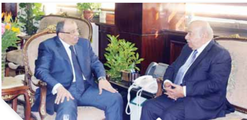
وزير التنمية المحلية يستقبل السفير الكويتي بالقاهرة

شدد السفير محمد الذويخ، سفير دولة الكويت بالقاهرة، على ما يكنه الشعب الكويتي من مشاعر ود أصيلة تجاه مصر وشعبها وقيادتها، معرباً عن استهجانها لأي أصوات شاردة ونشاز، تحاول أن تؤثر على العلاقات المصرية الكويتية، وتمس مكانة مصر وشعبها الأصيل الذي أسهم في نمو ونهضة الكويت، وعایش معها لحظات الفرح، وواجه معها التحديات الجسام، واختلطت دماء الشعبين معاً عبر سنوات طويلة، وأكد السفير، خلال استقبال اللواء محمود شعراوي، وزير التنمية المحلية له بمقر الوزارة، اعتراف الحكومة والشعب الكويتي بما يجعهما بمصر وشعبها من أواصر تاريخية وطيدة وعلاقات وثيقة في مختلف المجالات، وحرص الجانب الكويتي على تعزيز التعاون مع مصر على المستويات كافة، كما عرض السفير الكويتي، خلال اللقاء، أهم الأنشطة والاستثمارات الكويتية المختلفة في المحافظات المصرية، خاصة في منطقة إقليم قناة السويس وسيناء، والتي زادت بشكل مطرد في ظل توجيه القيادة السياسية الكويتية بدعم التعاون مع مصر في المجالات كافة. وأكد السفير الكويتي، أن مصر تعتبر لنا جميعاً خط الدفاع الأول، وحائط الصد عن منطقة الخليج، مؤكداً دور مصر المحوري بالمنطقة باعتبارها ركيزة أساسية لأمن واستقرار الوطن