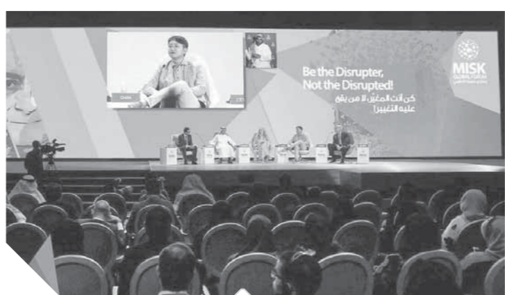
مشهد من مسك العالمي بالرياض

تحية واجبة لإدارة هذا المركز ورئيسه ذي السمة الوطنية الخالصة التي توحي بان الدين لله والوطن للجميع.