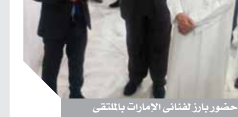
حضور بارز لفنانى الإمارات بالملتقى

ولأسف فتقابة الاعلميين تقف عاجزة عن ضبط المشهد الإعلامى بسبب الصراعات الداخلية ولعدم فهم القائمين عليها، لأسس العمل النقابى وتضارب اختصاصاتهم مع المجلس الأعلى للإعلام وهيئة الوطنية للإعلام، وكنت