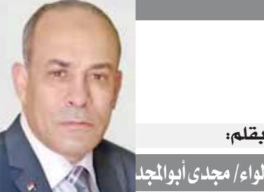
لواء/ مجدى أبوالمجد

وقال: «أغلب أصحاب مزارع الدواجن حالياً عاجزون عن توفير الأعلاف لدواجنهم» وأضاف «بدأت المشكلة بسبب نقص الدولار ومشكلات احتجاز شحنات مستلزمات إنتاج العلف في الموانئ، ثم أعلنت الحكومة أنها أفرجت عن شحنات مستلزمات تصنيع الإعلاف، فهل قام التجار بتخزينها لرفع الأسعار أكثر وأكثر؟!» وتابع، «وزارة التموين والزراعة ومجلس الوزراء نفسه يجب أن يرد على مربي الدواجن ويوضح حقيقة ما يحدث وهل هذه الأزمة ستحل قريباً أم أن المشكلات ستستمر، وأكد أن حل الأزمة الحالية تبدأ بالأفراج عن كميات فول الصويا المحجوزة في الموانئ، وإذا كان هناك مستوردون يقومون بتخزين فول الصويا يجب