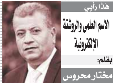
هذا رأيي الاسم العلمي والروشتة الإلكترونية بقلم: مختار محروس

غداً ينطلق الدوري الممتاز لكرة القدم موسم ٢٠٢٢/٢٣ وسط جدب وكثافات على شكل المناقصة في الموسم الجديد بعد ميركاتو صيفي ساخن شهد العديد من المفاجآت والصراع بين الأندية لدعم صفوفها. وكانت السمة المميزة لهذا الموسم هو عودة بعض الأندية الشعبية للصور بقوة خاصة النادي المصري اليوسعدي الذي شهد انتفاضة قوية مع تولي كامل ابوعلى زمام الأمور ورئاسة مجلس إدارة النادي برئاسة زكريا، وتكرّر الأمر في الإسماعيلي ولكن بصورة أقل مما حدث في المصري، فقد حرص مجلس الإدارة على نسيان الخلافات مؤقتاً وحرصوا على دعم الفريق وتغيير تام للدماء.. ولا شك أن الأندية الخاصة وأندية الشركات لعبت دوراً مهماً في إشعال الميركاتو بعد دخوله بقوة مالية في صراع خلف النجوم وتدعيم صفوفها في محاولة لخلق نظام الدوري وكسر احتكار الأهلي والزمالك للبطولات.. وتصدر فريق بيراميدز محاولات التحدي في الموسم الجديد لتطليبي الكرة المصرية بصفقات نارية مؤثرة مع الاحتفاظ بكامل نجومه وتبعية أندية فيوتشر وسيراميكيا. ويبقى الأهلي والزمالك في المقدمة، حيث نجح الزمالك في تموض حرماته من القيد فترتين وضم ١١ لاعباً جديداً، بالإضافة إلى نجاحه في اكتشاف