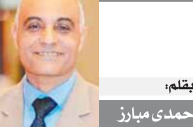
بقلم: حمدي ميارز