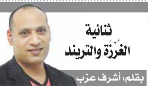
بقلم: أشرف عزب

الشعب المصرى تعاهد مع قواته المسلحة وشرطته بالوفاء صفاء واحدا لمواجهة أى عبث، ويحافظ على بلده وأمنها واستقرارها، ويقتف خلف القيادة السياسية ومؤسسات الدولة لاستكمال بناء الدولة المصرية الحديثة وتحقيق التنمية الشاملة واستكمال مسيرة الإصلاح. لقد خسرت الجماعة الإرهابية كل المعارك التى خاضتها ضد الدولة من إرهاب وشائعات وتحريض على العنف وتشكيك فى قدرات وإمكانيات الدولة.. كل هذه المحاولات من جانب الجماعة انتهت إلى فشل ذريع رغم قيامها بإطلاق مواقيها وقنواتها واستخدام صفحاتها على مواقع التواصل الاجتماعى والوسائط ميديا للتحريض ضد الدولة والدعوة لإشغال النفوس والتخريب، ولكن كل ذلك تبخر أمام وعى الشعب المصرى وتماسكه ومساندته لمؤسسات الدولة والرئيس عبدالفتاح السيسى الذى حمل روحه على كفه لإتخاذ مصر، ويقود مسيرة التنمية والإصلاح الاقتصادى وحقق الإنجازات. الشعب المصرى منته لثوى الشر ويحذر ويدرك المخططات والمؤامرات التى تدبر لمصر من قوى الشر والإرهاب وأعداء الوطن، والتى سيكون مصيرها الفشل، فلن يشارك الشعب المصرى فى دعوات الجماعه وزعزعة الاستقرار، وسيبدد الإخوان ويهدمهم إلى الجحيم لأنه ليس لهم مكان بين المصريين لأنهم يحطون لمؤامرة فاشلة!