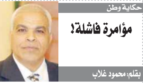
بقلم: محمود غراب

وزيرة التخطيط أن تطالب النمو الاقتصادى وارتقاء التضخم يؤدى إلى ارتفاع مستويات الدين، خاصة فى الأسواق الناشئة، متابعاً أن الزيادة فى أسعار الغذاء والطاقة لها آثار ضارة على الإنفاق ومستويات الدين، موضحة أن ارتفاع الأسعار يدفع الدول الناشئة إلى زيادة الإعانات لتعويض التأثير على الشرائح الضعيفة من السكان، وأضافت السعيد أنه فى الوقت الذى يمكن فيه أن تنقل الحكومات فى الاقتصادات المتقدمة الزيادة فى الأسعار إلى المستهلكين، فإن هذا غير ممكن فى الدول الناشئة، حيث إن نسبة كبيرة من السكان تعيش إما فى حالة فقر أو على حافة الهاوية، وبالتالي فإن خطط الحماية الاجتماعية ضرورية. وأشارت الوزيرة إلى جهود الدولة المصرية لبناء اقتصاد مرين وتعزيز قدرة على التكيف فى ظل الظروف الحالية، مشيرة إلى تبنى برنامج الإصلاح الهيكلى لدنيا لاستهداف القطاع الحقيقى وتطوير دور القطاع الخاص فى الاقتصاد، لا سيما من خلال توجيه الاستثمارات الأجنبية المباشرة، كمحرك رئيسى للصادرات ومصدر للعملة الأجنبية، متابعاً أن التحديات الحالية ساهمت فى تسريع جهود الدولة لدعم قطاع السياحة، كمصدر رئيسى آخر للعملة الأجنبية، مشيرة إلى السعى لزيادة عدد السياح بشكل كبير وإيراداتهم، إلى مستويات غير مسبوقة، المستويات التى تستحقها دولة كمصر.