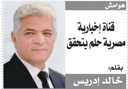
هوامش قناة إخبارية مصرية حلم يتحقق بقلم: خالد إدريس

حلم طالما انتظرت أن يتحقق، ليس بصفتي صحفياً مصرياً يغير على إعلام بلده، بل بصفتي مواطناً مصرياً يعشق تراب وطنه، ويتمنى أن يراه دائماً في مقدمة الصفوف يعطى القمة في كل المجالات بلا مناهس. نعم، كم حلمت أن أرى قناة إخبارية مصرية إقليمية تنقل الأحداث في كل شبر على الكرة الأرضية، وتنقل عنها كل القنوات وكالات الأنباء، وكما أكلتني الغيرة وأنا أرى قنوات إخبارية تنطلق من دول عربية ويتابعها الملايين في كل أرجاء الوطن العربي، وبلغت غيرتي قمته عندما كان المصريون يتابعون الأحداث الساخنة في العالم عبر هذه القنوات. كنت أتساءل أتعجز مصر أم الدنيا رائدة الإعلام في الشرق الأوسط عن إنشاء قناة إخبارية تجذب المشاهدين من كل أنحاء الوطن العربي.. بل والغربي عن طريق المهنية والاحترافية ونحن رواد صناعة الإعلام؟ وكانت سعادتى غامرة عندما أعلن الرئيس عبد الفتاح السيسي، خلال منتدى شباب العالم عام ٢٠١٧ عن الأعداد لإطلاق قناة إخبارية مصرية جديدة، تخاطب الداخل والخارج وتتصدى لكل المؤامرات الإعلامية، التي تشوه وتزيف الحقائق على الأرض المصرية. ومرت سنوات حتى أعلنت الشركة المتحدة للخدمات الإعلامية، مؤخراً، عن تدشين «قطاع أخبار المتحدة» والذي يعد أحد أكبر القطاعات الإخبارية في الشرق الأوسط، والذي يضم أكثر من قناة، منها قناة إخبارية دولية ناطقة بأكثر من لغة، وأخرى إقليمية تحمل اسم «القاهرة الإخبارية»، وقناة «إكسترا الحدث»، إلى جانب تطوير قناة «إكسترا نيوز».