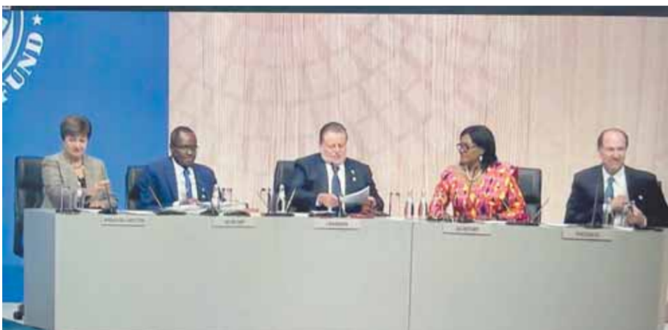
حسن عبدالله وكريستالينا جورجييفا خلال الجلسة العامة لمجلس محافظي البنك الدولي وصندوق النقد

وأعلن الصندوق توقعاته للنمو العالمي في العام المقبل بنحو 2.7٪، وهو ما يعد التخفيض الرابع خلال 12 شهرًا، كما يوجد احتمال بنسبة 4.1٪ أن ينخفض إلى أقل من 2٪. وتوقع صندوق النقد الدولي نمو الاقتصاد المصري بنسبة 6.6٪ خلال العام الجاري، رغم تزايد الضغوط على كافة القطاعات الاقتصادية بسبب تداعيات الحرب في أوكرانيا وتشفي كورونا المستمر وتقسيم سلاسل التوريد والإمداد خاصة المتعلقة بالطاقة والغذاء والتحديات الكبيرة التي يفرضها التغير المناخي. ولقمت كريستالينا إلى أن أكثر من 60٪ من البلدان منخفضة الدخل وأكثر من 25٪ من الأسواق الناشئة بدأت تعاني بشكل حقيقي من آباء الدين أو تقترب من المعاناة منها. وقالت كريستالينا: «خلال الوباء، رأينا أن إقرارنا الاحترازي وصل إلى 141 مليار دولار وهو مثال واضح على كيف يمكن أن يساعد الوصول المبكر إلى دعم الأموال في الحفاظ على السيولة، كما وافق صندوق النقد الدولي على توفير تمويل إضافي للبلدان التي تضربت بشدة من أزمة الغذاء العالمية».