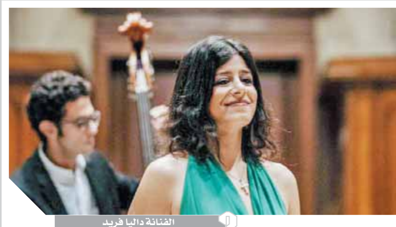
الفنانة داليا فريد