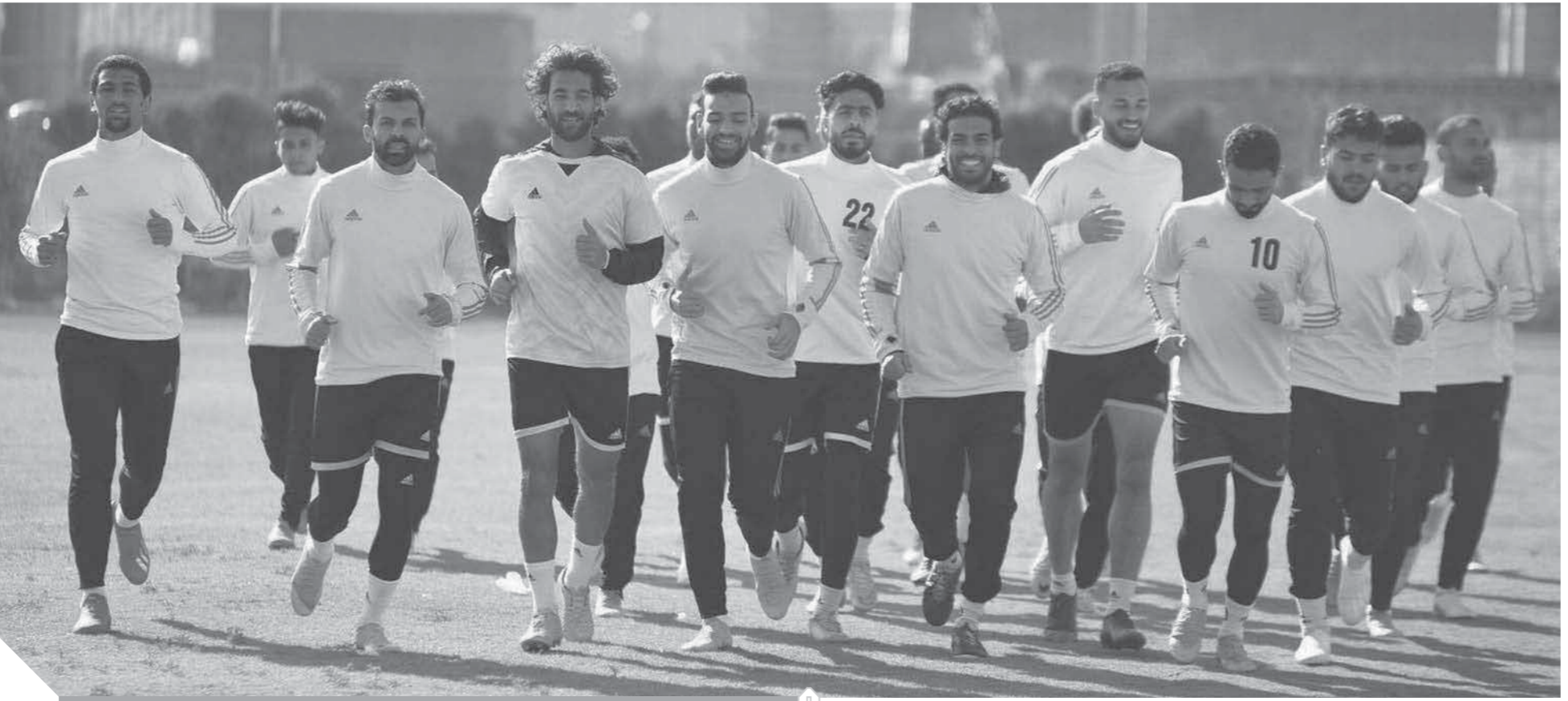
المقاصة يسعى لتجربة مميزة بالدوري