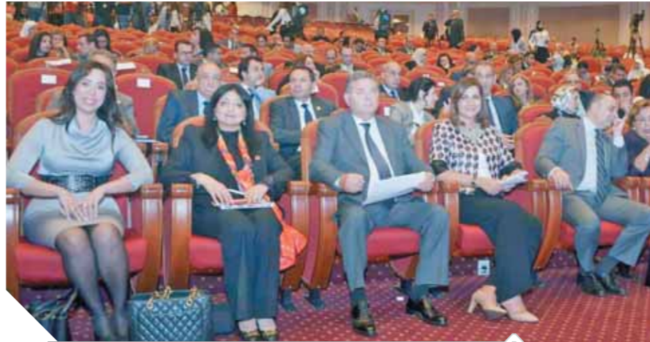
جانب من المشاركين فى مؤتمر مصر تستطيع