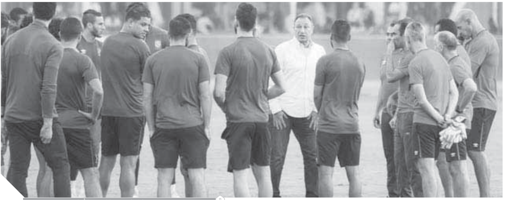
محمود الخطيب مع لاعبي الأهلي

وعقد محمود الخطيب رئيس النادي الأهلي جلسة مع لاعبي الفريق الأحمر أكد خلالها أن الفريق قدم بداية قوية موسمهم بتحقيق لقب كأس السوبر المحلي على حساب الزمالك، بجانب الفوز بثلاث مباريات في بطولة الدوري أيضاً التقدم لدور المجموعات بدوري أبطال إفريقيا، ولكن الجماهير لا تنتظر إلا لحصد الألقاب، وبالتالي سيكون مهماً استكمال مشوار الانتصارات.