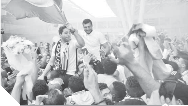
جماهير غفيرة زحفت لمطار القاهرة لاستقبال الفريق