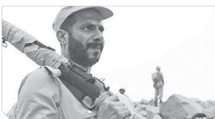
محمد فراج تائق في «الممر»

تففيده سيكون بالصورة التي أتمناها لأنه يتناول مرحلة تاريخية مهمة جداً من حق الأجيال الجديدة من الجمهور التي لم تعاصر تلك الحقبة، أن تشاهد عملاً يتحدث عن حرب الاستنزاف والمعارك التي كانت تتم خلف خطوط العدو، والفيلم يتناولها ليس كمادة تاريخية ولكن بالاقتراب من الحالات الإنسانية التي عاشت تلك المرحلة، والفيلم تم تنفيذها بشكل راقٍ أضاف لكل المشاركين وعن استعداداته للشخصية، قال: الضابط الإسرائيلي شخصية ملحمية، تعاملت معها كأي شخصية، وإن كانت الصعوبة في هذا الفيلم ليست في تنفيذ المشاهد، ولكنها في كراهيتها للشخصية وعدم قدرتي على التعاطف معها نهائياً، بل إنني أكرهها، ولذلك هذه الشخصية أخذت مني وقتاً طويلاً في التحضير لها، فانا مشغول بالتاريخ، وذاكرت كثيراً لكي أعرف الأسباب، علاقة الإسرائيليين بالعرب، وما هي الأوامر التي