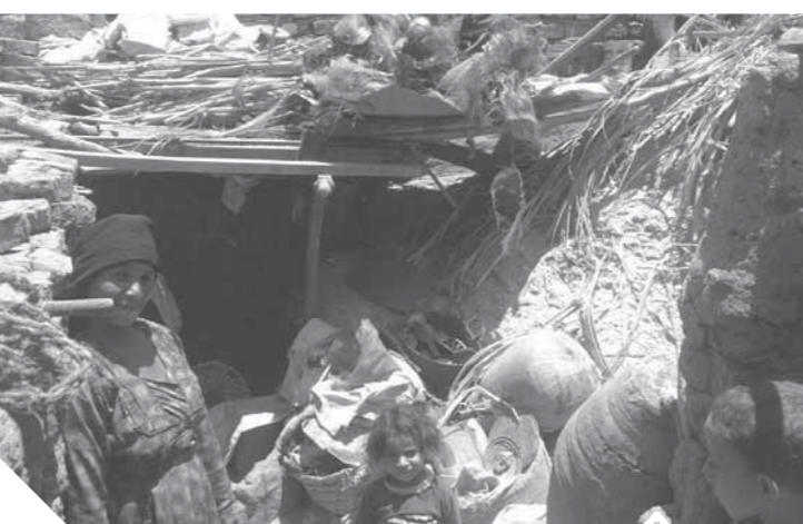
عشش أبو جناح بلا أذية

وهي سياق متصل قال حاتم رسلان رئيس لجنة الوفد بالمنيا وعضو الهيئة العليا إنه قد تعددت قصص رروايات معاناة أهالي قرية أبو جناح، فالقرية تعيش في برائن الفقر والجهد والمرض، الذي يعكس إهمال الدولة لهذه القرية، أملى أن تتحرك الأجهزة التنفيذية، لتتال القرى المحرومة حقها في العيش عيشة كريمة.