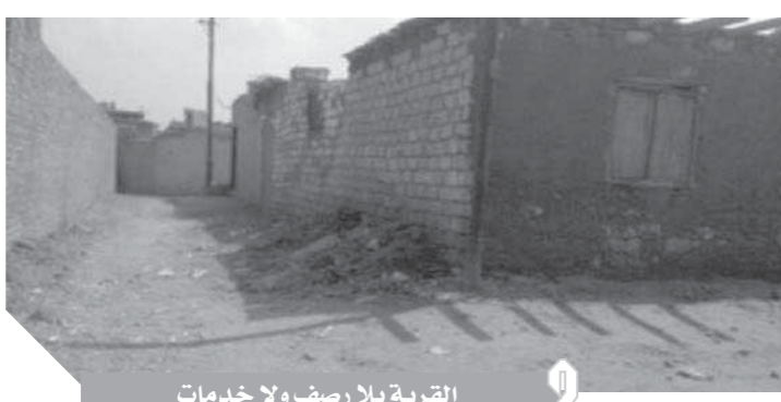
القرية بلا رصف ولا خدمات

محافظ أسيوط بإصدار امره لشركة مياه الشرب والصرف الصحي لإنهاء المشروع بالقرية حفاظا على المال العام وأرواح اطفالنا، مضيفين لابد الانتهاء من ترميم المعهد الأزهرى الخاص بالقرية لعدم ذهاب الطلاب إلى معاهد أخرى وتجذب حدوث خلافات جديدة بين الأهالي، وحفاظا على ارواح الطلاب.