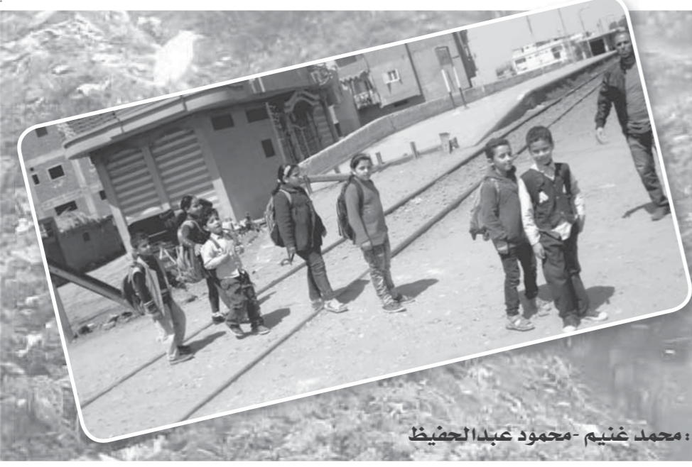
إعداد: محمد غنيم - محمود عبد الحفيظ