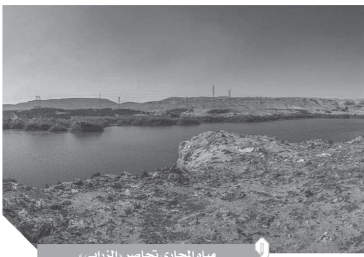
مياه المجارى تحاصر «الزرابي»

جميعهم يعيشون حياة مأساوية، حيث غابت عنهم كافة المظاهر الحضارية، ورغم رفع الأهالي العديد من الشكاوى إلا أنهم لا يستقبلون سوى وعود برفاة دون تنفيذ.