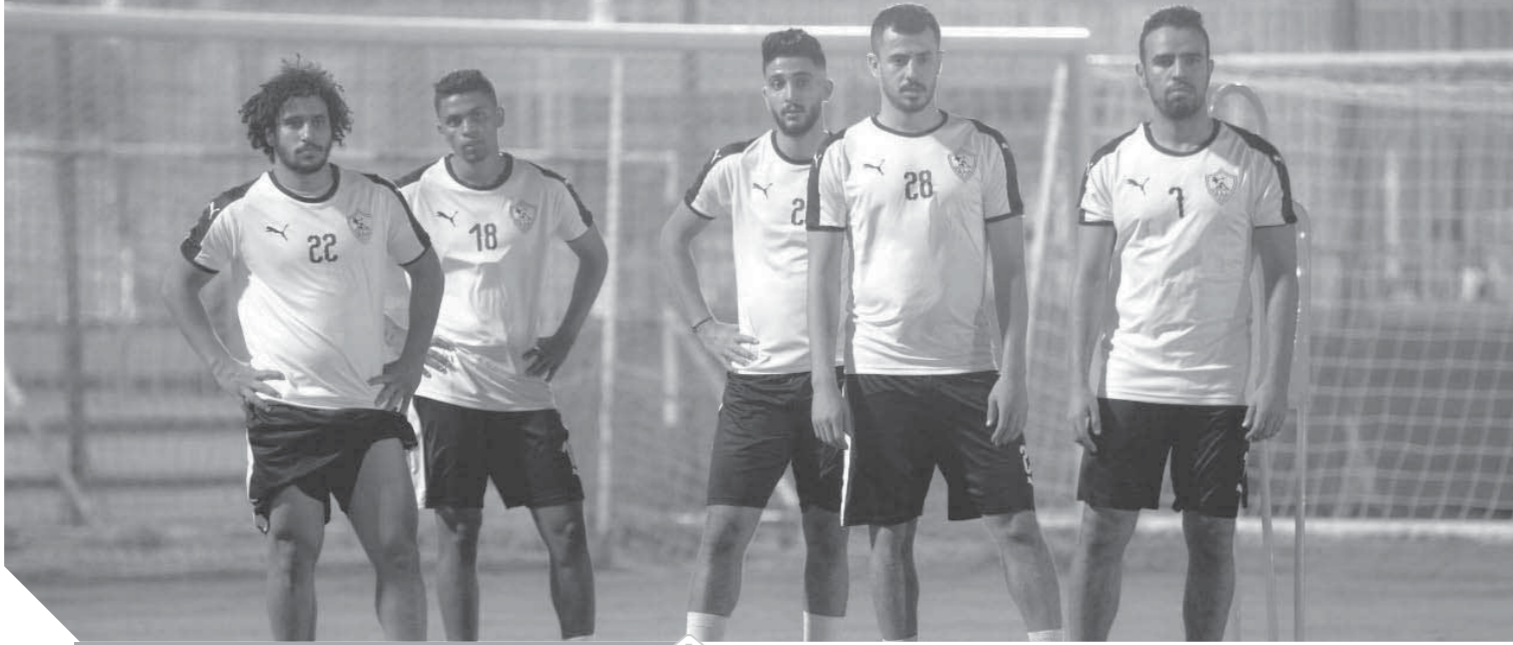
الزمالك يواصل استعداداته رغم تأجيل المباراة

كلمة تشير إلى غضبي من عدم الحصول على مستحقاتي.. وأكد أنه في حالة رغبته في الحصول على شيء سيحدث مع رئيس النادي بشكل مباشر. واختتم حديثه قائلاً: تركيزي مع الزمالك في المباريات المهمة المقبلة، ويكفي ما قاله رئيس النادي أمس بأن ما يريد طارق حامد سيتم تنفيذه.