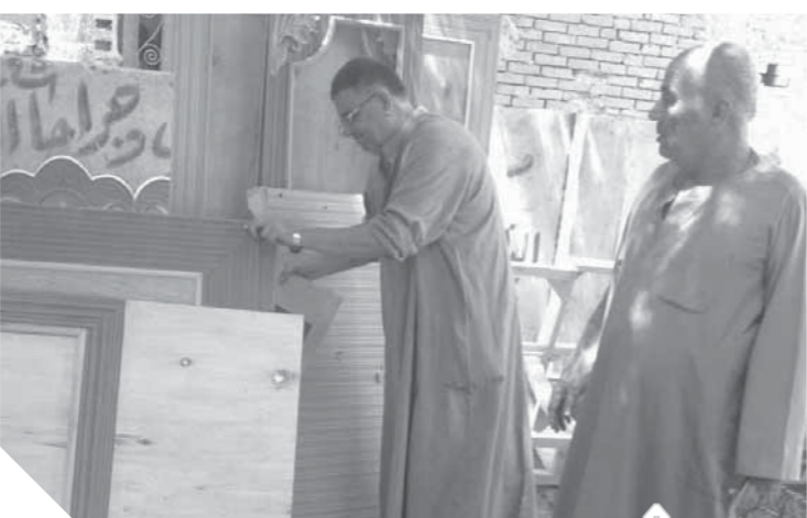
أهالي كتامة، يطالبون بمنطقة صناعية

مطالبًا بإنشاء اتحاد لأصحاب المعارض والورش وإنشاء جمعية لتوريد الخشب لتلبية الاحتياجات. وأوضح عوض أن صعوبة الاستيراد والتصدير مع قلة الشحن هي التي جعلت مدينة دمياط متفوقة علينا لتوفير وسيلة النقل البحري.