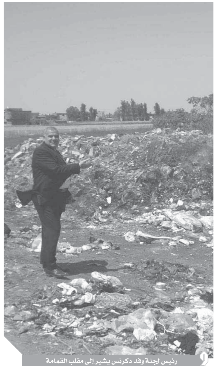
رئيس لجنة وفد دكرنس يشير إلى مطلب القمامة