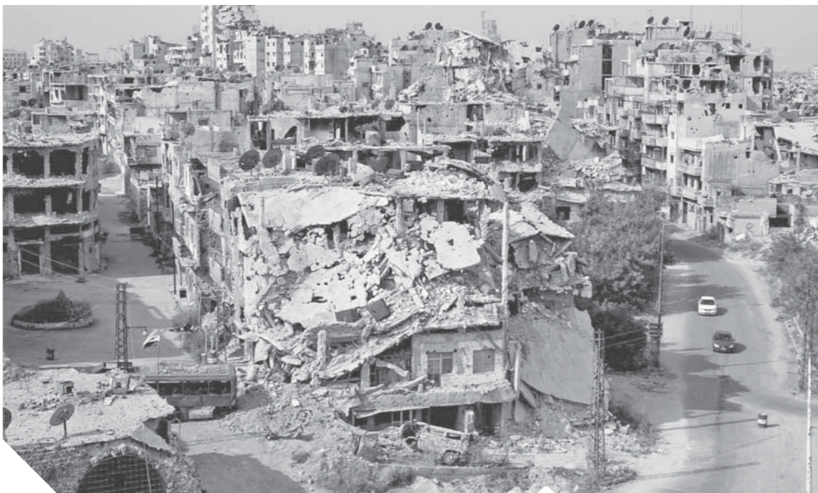
المخططات الخبيثة تسببت في تدمير سوريا