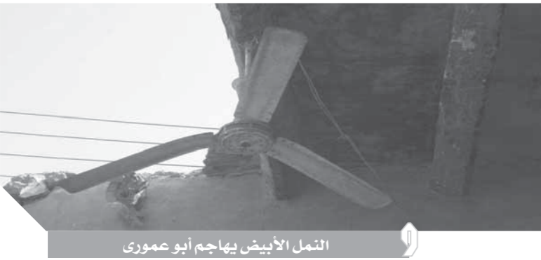
النمل الأبيض يهاجم أبو عموري

الأبيض مزمنة في القرية منذ سنوات طويلة حيث يعاني الأهالي من آثار وجود الحشرات في منازلهم بشكل دائم. وأضاف رشدي: النمل الأبيض لا يقف أمامها شئ فهي تقترض الأبواب الخشبية والأسقف المصنوعة من الخشب والشايك والشرفات ما يسبب خسائر فادحة لأهالي ويعرض المنازل المبنية من الطوب اللبن للانهيار لتدخل الخشب في بنائها.