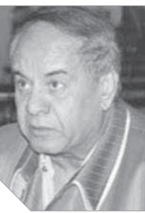
الدكتور نبيل لوقا بباوي يكتب: