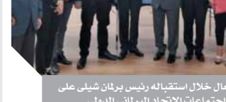
د. على عبدالعال خلال استقباله رئيس برلمان شيلى على هامش اجتماعات الاتحاد البرلمانى الدولى

عقد الدكتور على عبدالعال رئيس مجلس النواب العديد من اللقاءات الثنائية مع نظرائه من دول شيلى وقبرص ومالوى والنمسا، حيث تبادل معهم وجهات النظر إزاء القضايا العالمية والإقليمية، وتوحيد الرؤى تجاه القضايا التى تم مصر.