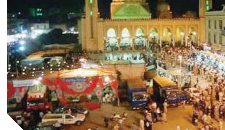
جانب من احتفالات السيد البدوي