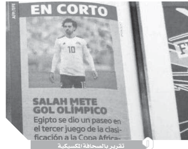
تقرير بالصحافة المكسيكية

اهتمت الصحافة المكسيكية بهدف محمد صلاح نجم منتخب مصر في مرمى أي سواتيني في تصفيات كأس الأمم الأفريقية بالقاهرة.. وقالت صحيفة «الجرافيكو» المكسيكية: إن صلاح أحرز هدفاً عالمياً من ضربة ركنية سدها مباشرة في المرمى في المباراة التي انتهت بفوز مصر 4/1. ومن جانبها سلطت صحيفة «دى بورتس»