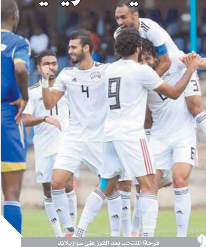
فرحة المنتخب بعد الفوز على سوزيلاند