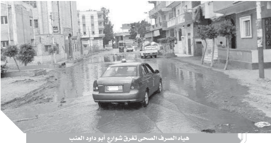
هياه الصرف الصحى تغرق شوارع أبو داود العنب

وتوجه الأهالى بالشكر لواء جمال نورالدين محافظ أسبوط وكذلك المنطقة الأزهرية بالمحافظة لتلبية نداءهم والحفاظ على أرواح أبنائهم.