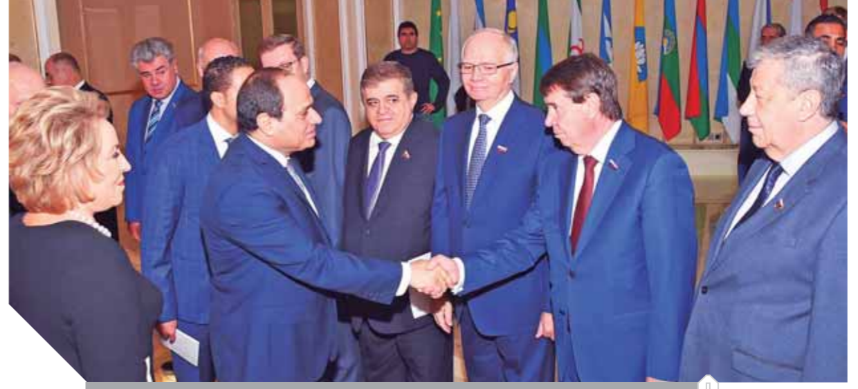
استقبال حافظ للبرئيس السيسي في روسيا