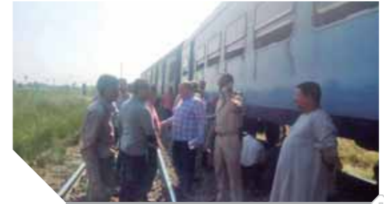
توقف حركة قطارات الصعيد

طالب طارق عامر محافظ البنك المركزي المصري، بعودة الأموال المهربة من القارة الإفريقية التي تم جمعها بطرق غير شرعية. وقال مسائلا «أين ثرواتنا؟ كيف لنا أن نمنى بلادنا ونحن نبذل الجهد المئضى في حين أن أموالنا تسرب إلى الخارج في تلك الدول مستنزفة مواردها وموارد شعوبنا وثرواته» جاء ذلك خلال ترويس عامر جلسة اجتماع محافظى المجموعة الاستشارية الإفريقية مع مدير عام صندوق النقد الدولي، التي عقدت في بالي بإندونيسيا. وشارك محافظ البنك المركزي المصري في اجتماع مجموعة الـ24 بحضور قادة وزارات المالية والبنوك المركزية وقيادات البنك الدولي وصندوق النقد. أكد «عامر»، أن هذه الاجتماعات تهدف إلى النهوض بالحوار حول السياسات النقدية مع دولنا فضلا عن دعم الجهود لإيجاد حلول مجدية للتحديات التي تواجهها دولنا، مشيرا إلى أنه يتطلع إلى أن يكون صندوق النقد الدولي شريكا في مواجهة هذه المخاطر الجسيمة من خلال تطبيق مزيج من سياسات الاقتصاد الكلى السليمة واتخاذ التدابير التحوطية والجزئية وبناء مؤسسات أقوى وأكثر مصداقية وهوامش أمان لتعزيز القدرة على التكيف مع الصدمات. وأوضح، أن الهدف النهائي هو زيادة النمو على نطاق واسع وتضييق فجوة الدخل بين المواطنين في دولنا