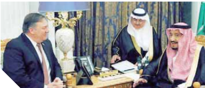
الملك سلمان مع وزير الخارجية الأمريكي

الأوضاع الراهنة في المنطقة، والجهود المشتركة المبذولة تجاهها. وفقا لوكالة الجيبر وزير الخارجية السعودي وسفير المملكة لدى واشنطن الأمير خالد بن سلمان استقبل بومبيو في المطار. وفي الجانب الأمريكي، حضر اللقاء نائب وزير الخارجية للشؤون السياسية، ديفيد هيل. وقال شهود من رويترز إن محققين أتركا دخولا لتقصية السعودية في اسطنبول خلال الليل، وفتشوا المكان لأول مرة لمدة تجاوزت تسع ساعات.