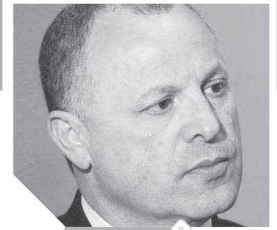
هاني أبو ريدة