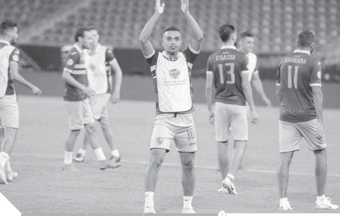
الزمالك يستأنف تدريباته استعداداً للإنتاج