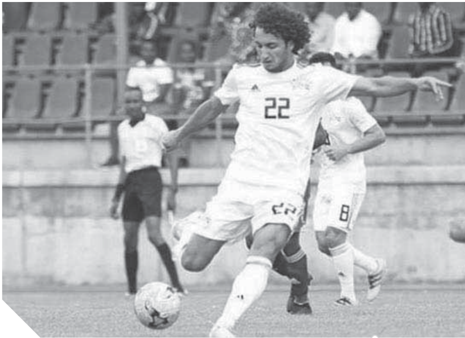
منتخب مصر أهدر فرصة تحقيق فوز كبير

لعب منتخبنا على الكرات الطويلة في العمق لحسين الشحات وعمرو وردة ومروان محسن مستغلاً تواضع الدفاع في الخبرة والتنظية والرقابة على مهاجمي المنافس وبأرأسه مروان محسن في حلق المرمى في يد الحارس السوزيلاندي. قاد حسين الشحات وتريزيجي أكثر من هجمة والأخير اخترق ولعب عرضية من داخل المنطقة على قدم حسين الشحات في حلق المرمى وبدلاً من التسديد المباشر