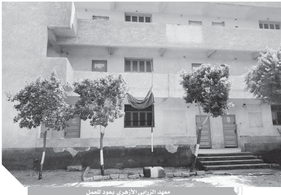
معهد الزرابى الأزهرى يعود للعمل

وفى هذا الصدد وقع أولياء الأمور على مذكرة تطالب مجلس الوزراء ومشيشة الأزهر بالتدخل وحل المشكلة، والانتهاه من أعمال الترميم والنظر إلى شكواهم لحقوق أبنائهم على حقوقهم المشروعة، وكذلك الحفاظ على أرواحهم من الذهاب فى الفترة المسائية، لأن العديد من أبناء القرية الذين يذهبون إلى المعهد يسكنون فى الأراضى الزراعية البعيدة عن