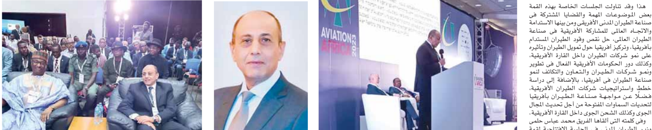
الفريق محمد عباس خلال اللقاء كلمته بالقمة الإفريقية الفريق محمد عباس وزير الطيران يبحث مع وزراء النقل الأفريقي مستقبل صناعة النقل الجوي بالقارة السمراء