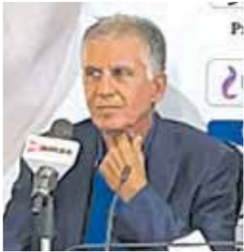
«كيروش»: هدفى قيادة المنتخب للمونديال 07