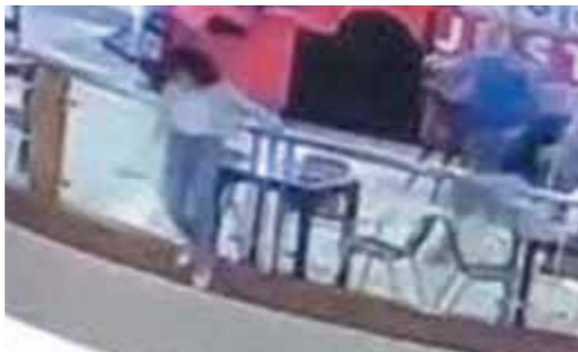
صورة من فيديو انتحار ميار

كتبت - تهاني شعبان: أكد وزير خارجية الكونغو كريستوف لوتوندولا، أن الخلافات بشأن سد النهضة يمكن حلها داخل إطار الاتحاد الإفريقي، لافتاً إلى أهمية عودة الأطراف الثلاثة للمسار التفاوضي في أسرع وقت، وأوضح خلال مؤتمر صحفي مع وزير الخارجية سامح شكري، أن التوصل إلى وثيقة اتفاق بين الأطراف الثلاثة ممكن في نهاية الأمر مع وجود ضمانات بالالتزام كافة الأطراف ببنوده، وقال وزير خارجية الكونغو الديمقراطية، إن زيارته للقاهرة وأديس أبابا والخروطوم، تأتي بتوجيه من الرئيس فيليكس تيشيكيدى لحث الأطراف الثلاثة على استئناف المفاوضات السد، وأشاد وزير خارجية الكونغو بالدور المصري الداعم لإيجاد في كافة المجالات في ضوء العلاقات المتميزة التي تجمع البلدين، منوها إلى الاتفاقيات الموقعة بين البلدين مؤخرا