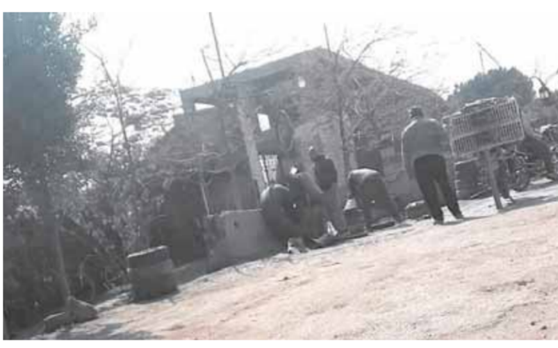
ميكانيكى يقوم بتركيب فرامل مضروبة على طريق بنها