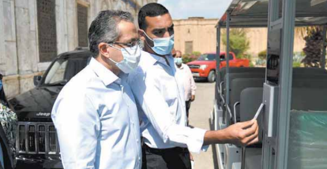
كتب - أحمد عثمان:

تفقد الدكتور خالد العناني وزير السياحة والآثار صباح أمس قلعة صلاح الدين الأيوبي، وذلك للوقوف على آخر مستجدات أعمال الترميم والصيانة الجارية بجامع محمد علي وآخر مستجدات إصلاح الساعة والصحن وساحة البانوراما والبرجولة الملكية أمام قصر الجوهرة، بالإضافة إلى متابعة الموقف التنفيذي لأعمال تطوير ورفع كفاءة خدمات الزائرين بها لتحسين تجربة الزائرين المصريين والسائحين. وأكد «العناني» خلال الجولة ضرورة الالتزام بالتوقيعات المحددة مسبقاً لانتهاه من أعمال الترميم والصيانة وتطوير الخدمات والمحافظة على الإرث الحضاري المصري الفريد للأجيال القادمة والبشرية. وخلال الجولة تفقد الوزير برج الساعة، والذي تم الانتهاء من ترميمه كاملاً وتوقيع الألوان لإعادتها إلى رونقها الطبيعي مرة أخرى.