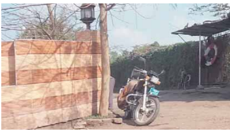
مخزن لبيع الفرامل المضروبة بطريق بنها السريع