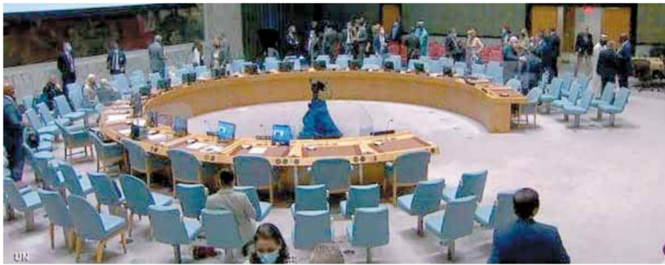
مجلس الأمن في اجتماعه لبحث أزمة السد

الغاية اللازمة لها. هذا من جهتها، قالت مريم الصادق المهدي، وزيرة الخارجية السودانية، إن السودان يشارك بحسن نية في جولات التفاوض بهدف الوصول إلى اتفاق يحفظ مصالح الدول المشاطئة ودولة المنبع على حد سواء. وقالت، في تصريح صحفي: «السودان يحدد دعوته لقبول عملية الوساطة المعززة بقيادة الاتحاد الإفريقي لمساعدة الأطراف في الوصول لاتفاق مرضى لأطراف العملية التفاوضية الثلاثة».