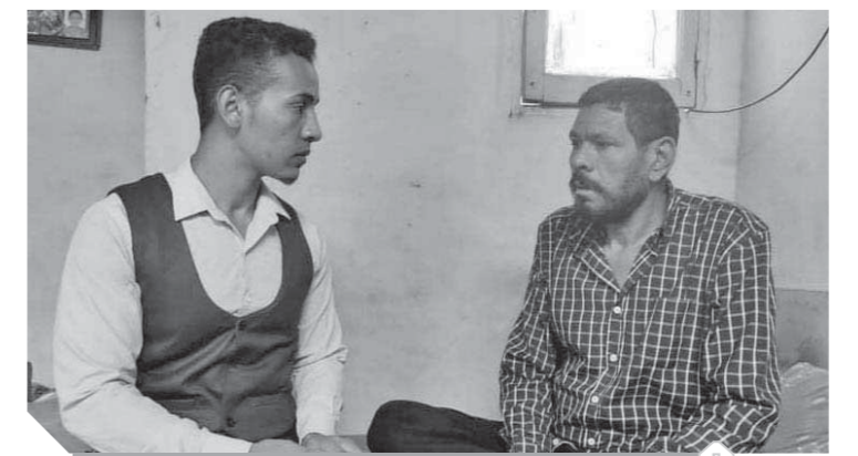
والد سائق التوك توك يتحدث إلى مندوب الوفاة

واستجمع الأب ما تبقى من قواه ليسأل ابني ماله، ليذهب به بعض الشباب إلى مكان الواقعة، ويقلب الأب المكان بعينه فلا يجد قرعة عينه، ويخبره البعض أن