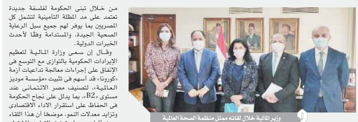
وزير المالية خلال لقائه ممثل منظمة الصحة العالمية