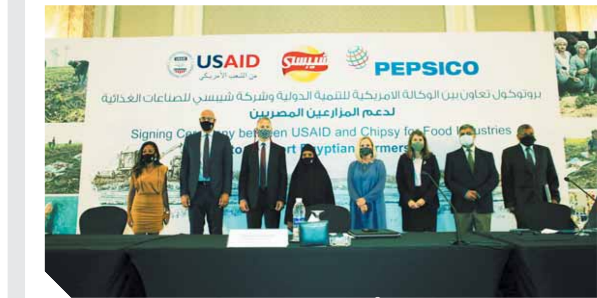
توقيع اتفاق التجديد

أعلنت الوكالة الأمريكية للتنمية الدولية (USAID) وشركة شيبسي للصناعات الغذائية - إحدى شركات بيبسيكو مصر - عن تجديد شراكة لزيادة إنتاجية المزارعين وبناء سلسلة توريد منتجات البطاطس تتسم بمزيد من الشفافية، وذلك في لقاء شارك فيه السفير الأمريكي جوناثان كوهين ومحمد شلباية، الرئيس التنفيذي لجموعة بيبسيكو مصر، وليزلي ريد، مديرة الوكالة الأمريكية للتنمية الدولية في مصر؛ والسيد روبيين بلاكي المدير الإقليمي لبرنامج الاستدامة في بيبسيكو. تهدف الشراكة إلى تمكين صغار المزارعين المصريين من إقامة روابط قوية بالسوق، وزيادة جودة المحاصيل، والتقدم نحو المعايير المعترف بها دولياً للممارسات الزراعية المستدامة. خلال السنة الأولى من الشراكة، شارك المزارعون في التدريب، وتلقوا توصيات فنية حول الممارسات الزراعية الجيدة، مثل التطبيق الموجه للرى والأسمدة، وفي هذا الإطار، جاء موسم العام الأول من الشراكة في ٢٠١٩/٢٠٢٠ ليحقق نتائج هائلة، حيث حقق مئات المزارعين في بنى سويف زيادة كبيرة في الإنتاج والجودة، فضلاً عن خفض التكلفة، مما أدى إلى مضاعفة الأرباح ثلاث مرات. وصرح السفير الأمريكي جوناثان كوهين بأن هذه الشراكة المزارعين على زيادة دخلهم، وتحسين مستوى معيشة أسرهم. وعلى مدى العامين المقبلين، تخطط الوكالة الأمريكية للتنمية الدولية، وشركة شيبسي للصناعات الغذائية على توسيع الشراكة لتشمل محافظات النوبية والمنيا للوصول إلى ٢٥٠٠ مزارع بحلول عام ٢٠٢٣.