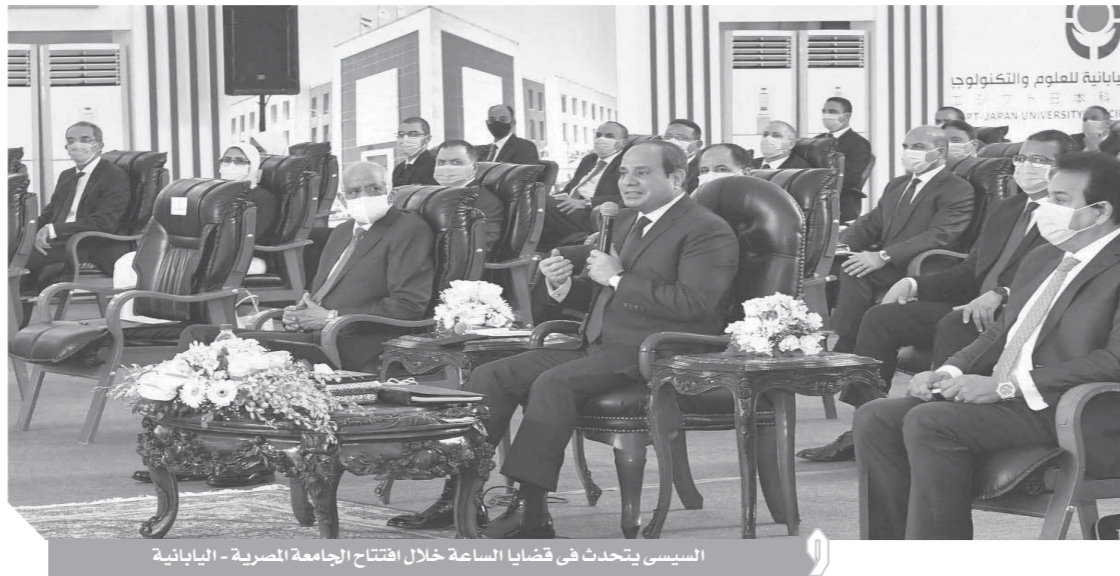
السيسى يتحدث فى قضايا الساعة خلال افتتاح الجامعة المصرية - اليابانية