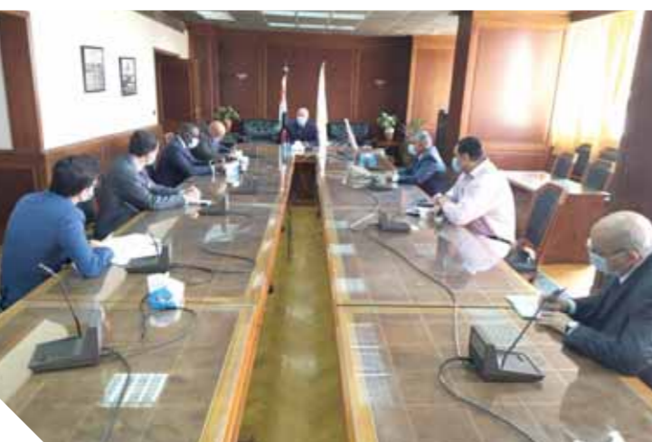
وزير الري خلال اجتماعه مع عضو البرلمان الفرنسى بحضور سفير فرنسا