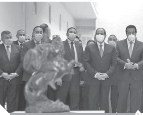
الرئيس السيسى يتابع الإنجازات التى تحققت فى مجال التعليم

أكد الدكتور مصطفى مدبولى رئيس مجلس الوزراء أنه تم استثمار ١٠٠ مليار جنيه فى السنوات الست الماضية لسد الفجوة ورفع مستوى جودة التعليم، ومع ذلك نحتاج إلى إنشاء ٧٢ ألف فصل جديد بتكلفة ٤٠ مليار جنيه لحل مشكلة الكفاية. وأوضح «مدبولى» فى كلمته خلال افتتاح الجامعة المصرية - اليابانية للعلوم والتكنولوجيا أن المشكلة الحقيقية لا تكمن فى البناء أو توفير تكلفته، لكن الإشكالية فى البناء العشوائى الذى تم على مدار ٤٠ سنة، والذى يمثل ٥٠٪ من العمران القائم فى مصر، حيث تسكن الغالبية العظمى من السكان فى مساحة لا تتجاوز ٧٪ من مساحة مصر وهى الكتلة العمرانية التى تشهد زيادة سكانية كبيرة وتمثل بها مشاكل عجز المدارس وكثافة الفصول وأضاف: أنشئ ٢٨٠ ألف فصل جديد منذ عام ١٩٩٥ منها ٧٦ ألف فصل خلال الـ ٥ سنوات الماضية فقط، فمصر فى سياق محموم لتتمكن من بناء منشآت لحل مشكلة الزيادة السكانية وتوفير فصول لأولادنا للتعليم.. وقال «مدبولى» التعليم العالى لم يكن لديه القدرة على استيعاب جميع الطلاب فضلا عن أعداد الوافدين.