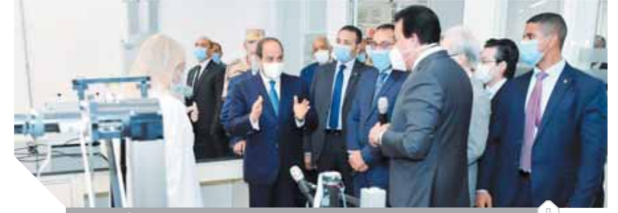
الرئيس السيسى خلال افتتاحه الجامعة المصرية - اليابانية أمس

كل موضوع هنشغل فيه لخدمة الدولة المصرية وشعبها