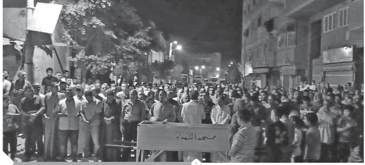
جانب من تشيع جنازة الشهيد