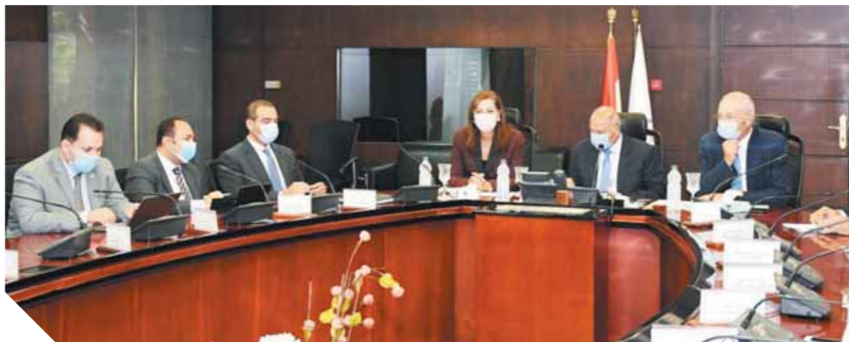
وزير النقل والتخطيط والمهندس يحيى زكى رئيس المنطقة الاقتصادية لقناة السويس خلال اجتماعهم أمس

كتب: عبد الرحيم أبو شامة وأحمد دراز وشيرين عجمي،