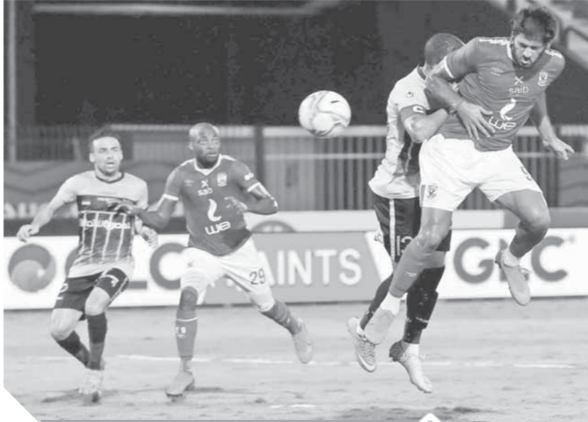
الأهل يبحث عن تحقيق الفوز أمام أسوان