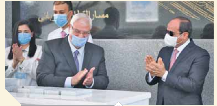
السيسى وعدلى خلال الافتتاح

«السيسى»: التحديات كبيرة وهدفنا تحسين حياة الناس تشغيل ٥ ملايين عامل فى البنية الأساسية بمختلف القطاعات لا تهاون فى مواجهة التحديات ولا نبيع الوهم للمصريين