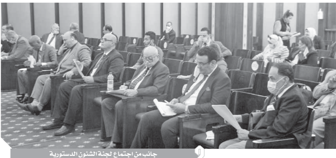
جانب من اجتماع لجنة الشؤون الدستورية