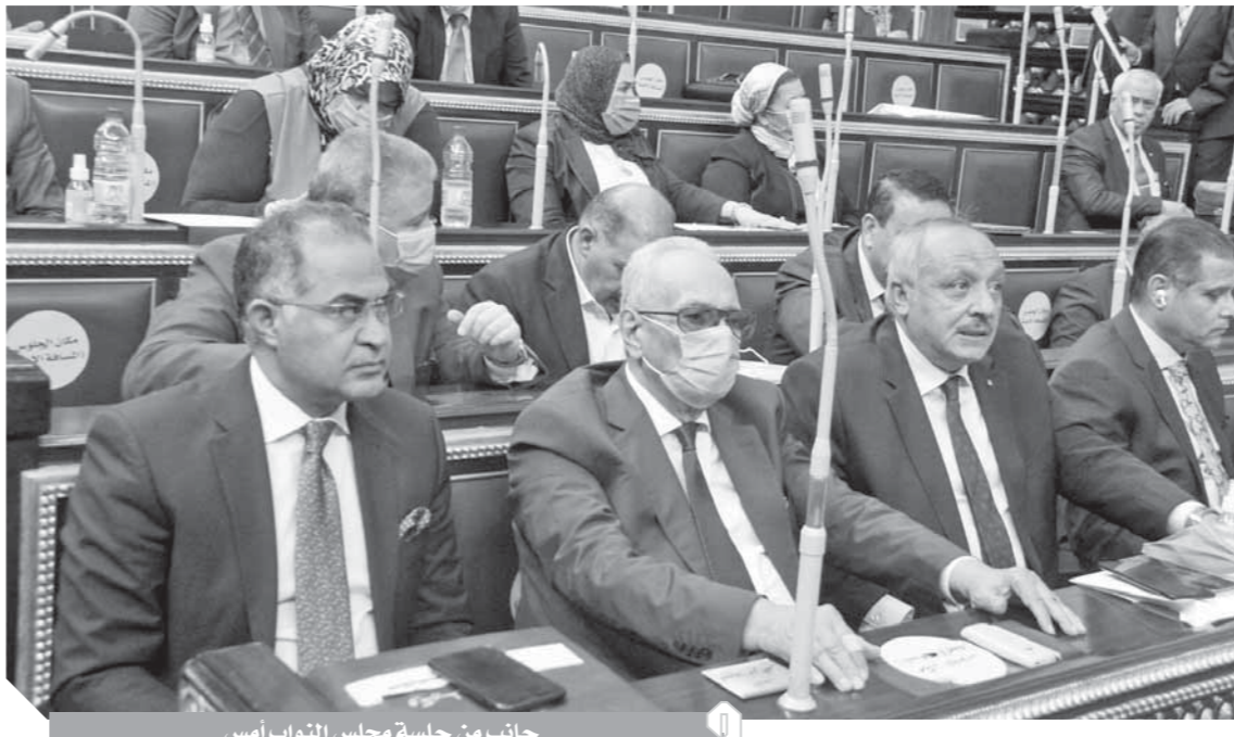
جانب من جلسة مجلس النواب أمس

وافق مجلس النواب برئاسة الدكتور على عبد العال على قانون مقدم من الحكومة بشأن تعديل بعض أحكام القانون رقم ١١٤ لسنة ١٩٤٦ بتنظيم الشهر العقاري. وقال المستشار بهاء الدين أبو شقة، رئيس اللجنة التشريعية إن الثروة العقارية تعد إحدى أهم ركائز الاقتصاد القومي، والتي تنمو قيمتها السوقية يوماً بعد يوم، كما أن حق الملكية من الحقوق الأساسية والتي اهتم الدستور بحمايتها في المادة (٢٣) والتي تنص على: «تحمي الدولة الملكية بأنواعها الثلاثة، الملكية العامة، والملكية الخاصة، والملكية التعاونية».