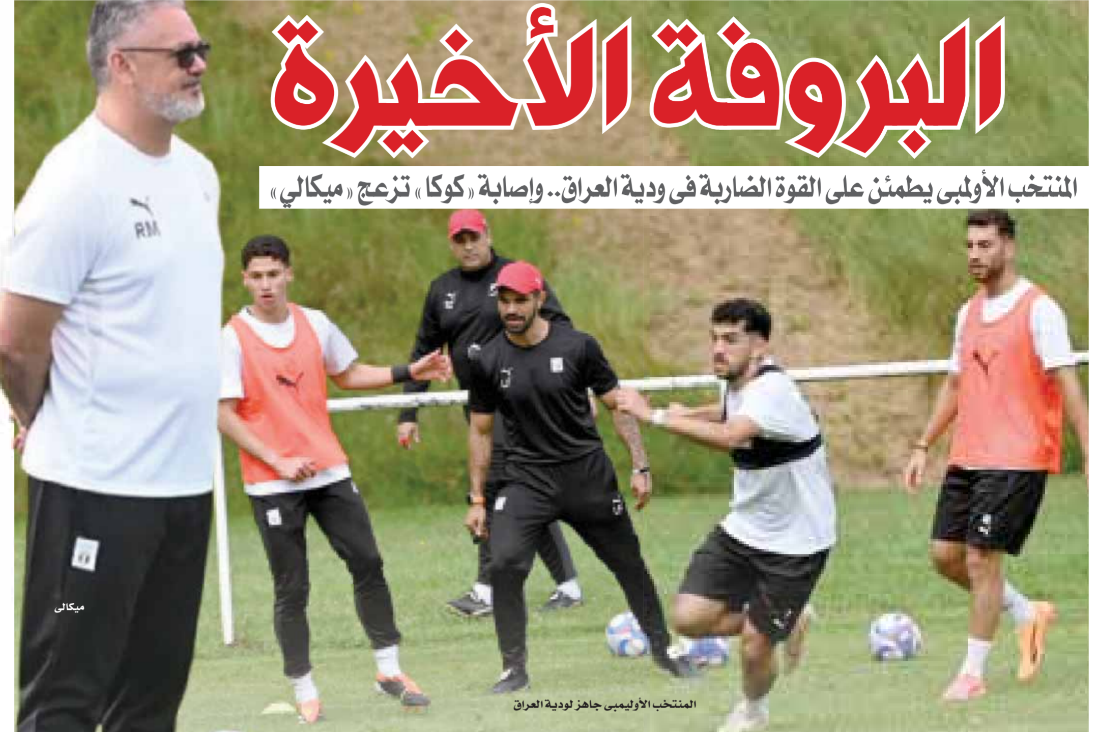
المنتخب الأولمبي جاهز لودية العراق

المنتخب الأولمبي يطمئن على القوة الضاربة في ودية العراق.. وإصابة «كوكا» تزعج «ميكالي»