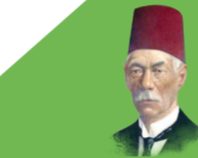
الحق فوق القوة... والامة فوق الحكومة تصدر عن حزب الوفد المصري