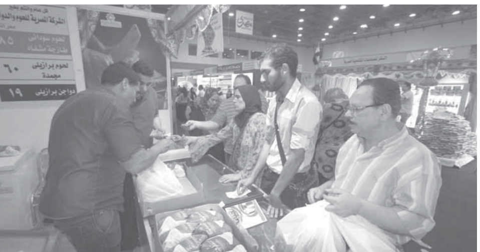
توفر كافة السلع في معارض أهلاً رمضان.. والمواطنون يشترون كميات أقل من المعتاد أملاً في «فرحة رمضان»