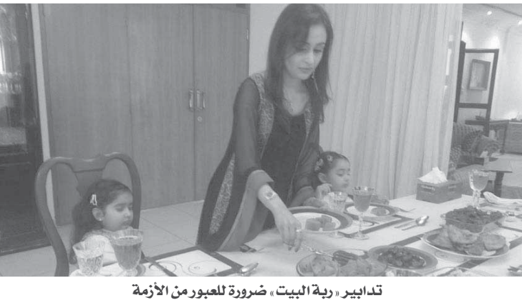
تدابير «رية البيت، ضرورة للعبور من الأزمة

وأضاف «رشاد»، أن المصريين يتناولون ما يقرب من 28 مليار رغيف خبز، و70 ألف طن فول، و160 مليون دجاجة، و100 ألف طن لحم الأبقار من المصروفات السنوية للأسرة بنسبة لا تقل عن 20%.