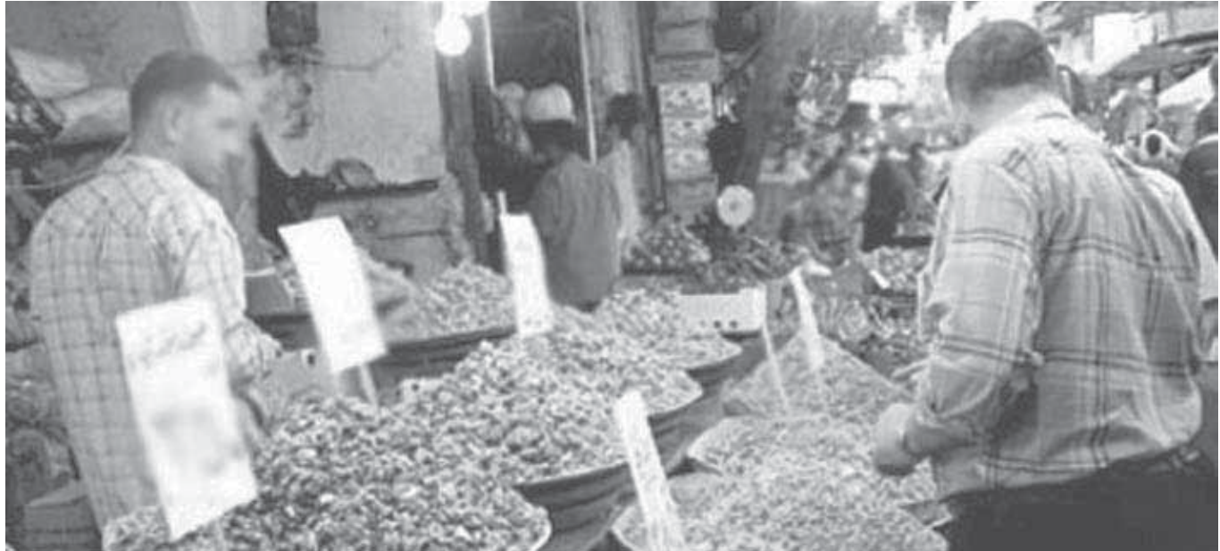
المواطنون يديقون في اختيار السلع خوفاً من الوقوع في فخ الغش التجاري