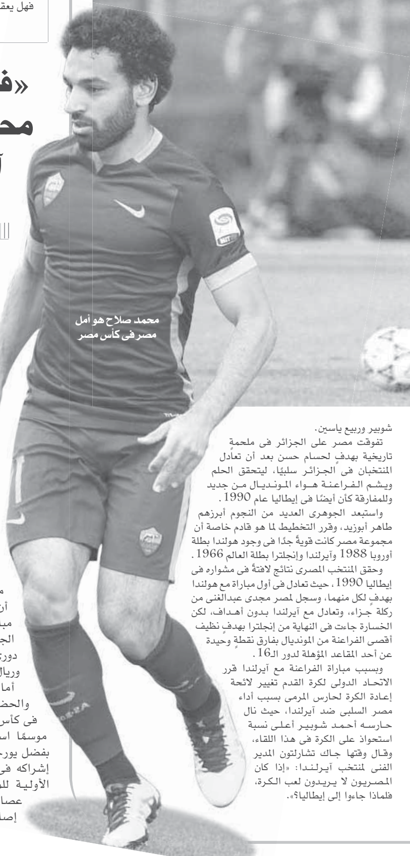
محمد صلاح هو أمل مصر فى كأس مصر