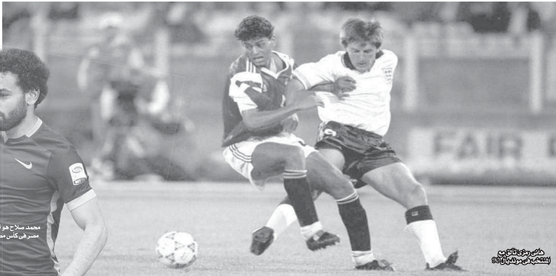
كأسى منى تاتق منى في مونديال 90

رحلة قصيرة في إيطاليا 34.. وإنجاز كاد يتحقق عام 90