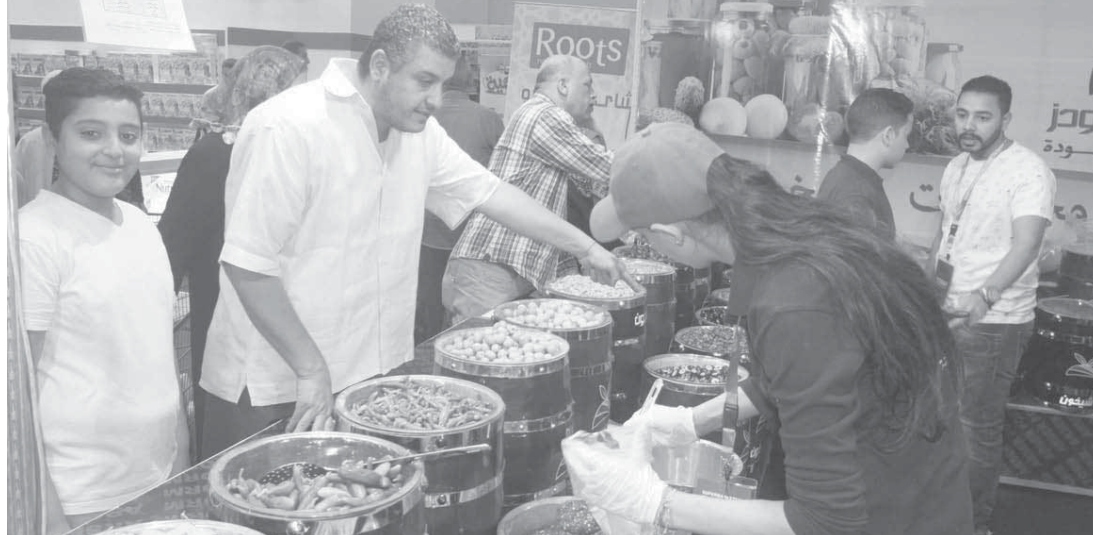
الباعة يحاولون إرضاء الزبائن وحثهم على الشراء