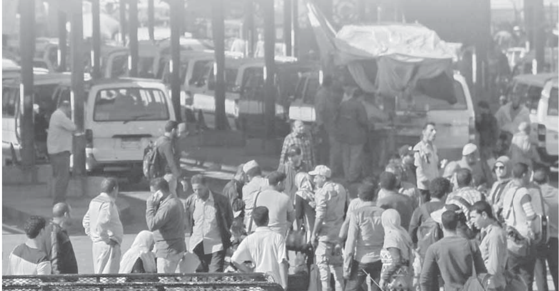
الآلاف العائدين إلى قراهم ومحافظاتهم لت قضاء أول يوم رمضان مع العيلة،

ويكمل الشاب، أن جميع العمال القادمين إلى القاهرة للعمل يشعرون بانهم أغراب، ويظل براودهم شعور بعدم الراحة؛ بسبب حالتهم النفسية السيئة، ليأتي رمضان ليمتحننا فرصة الرائعة للتلاقى على مائدة الإفطار، تناول وجبة عائلية، لتكون أكبر فرصة للتعاود والتواصل العائلي وإعادة الحياة مرة أخرى.