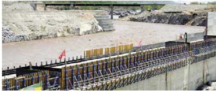
ازمة سد النهضة ما زالت مستمرة

كما اتفق الوزراء على عقد اجتماع على مستوى كبار المسؤولين بالدول الثلاث لتحديد الأسلوب الأمثل لإنشاء الصندوق على أن يعرض ذلك المقترح على الرؤساء من خلال الوزارات المعنية بكل دولة. وقد قبلت الدول الثلاث دعوة مصر لاستضافة