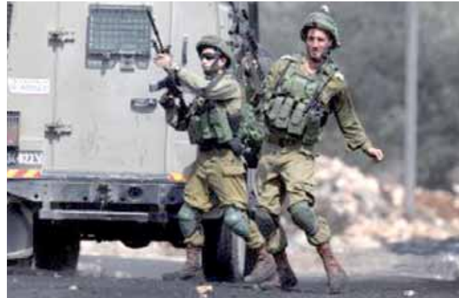
الاحتلال يطلق الرصاص على الفلسطينيين

قيام النظام الإسرائيلى بذبح أعداد لا حصر لها من الفلسطينيين بدم بارد، مشيراً إلى أن الفلسطينيين يعيشون داخل أكبر سجن مفتوح فى العالم. وانطلق «أسطول حرية» جديد، من أوروبا لكسر الحصار عن قطاع غزة. وذكرت صحيفة «معاريف» العبرية، أن أربع سفن كبيرة انطلقت مساء الثلاثاء، من ميناء «جيبوتى» بالسويد نحو قطاع غزة. وتبينت أن مئات النشطاء الأوروبيين، انطلقوا على متن السفن الأربع، للتضامن مع السكان فى قطاع غزة، والمطالبه برفع الحصار. يذكر أن الأسطول الأول لكسر الحصار، قد انطلق باتجاه قطاع غزة فى 29 مايو 2010، محملاً بعشرة آلاف طن من التجهيزات والساعات، والمئات من الناشطين الساعين لكسر الحصار، الذى قد بلغ عامه الثالث على التوالي، وقتذاك. تم تنظيم أسطول الحرية «2»، فى 2011، وأسطول الحرية «3»، فى 2015. وجهزت