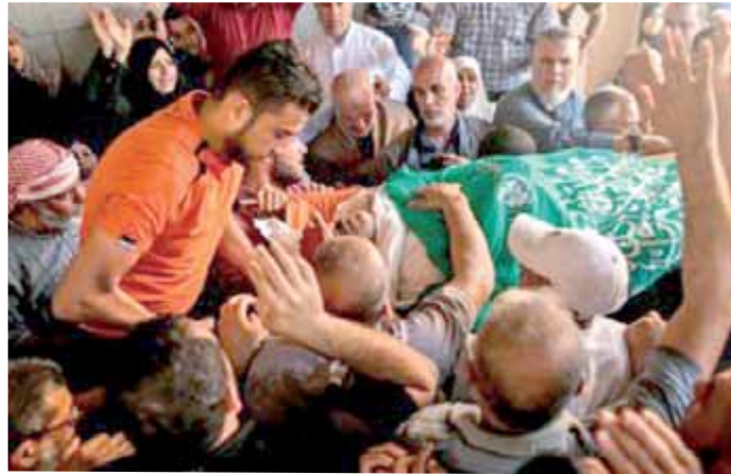
الفلسطينيون يشيرون أحد الشهداء

واسع عبر مواقع التواصل الاجتماعى، وكان وزير الخارجية الإيرانى محمد جواد ظريف، قد شن هجوماً الماضى، ضد قرار افتتاح سفارة الولايات المتحدة الجديدة فى القدس، وقال «ظريف» فى تصريحات صحفية: «هذا اليوم يمثل يوماً للعار، يتزامن مع