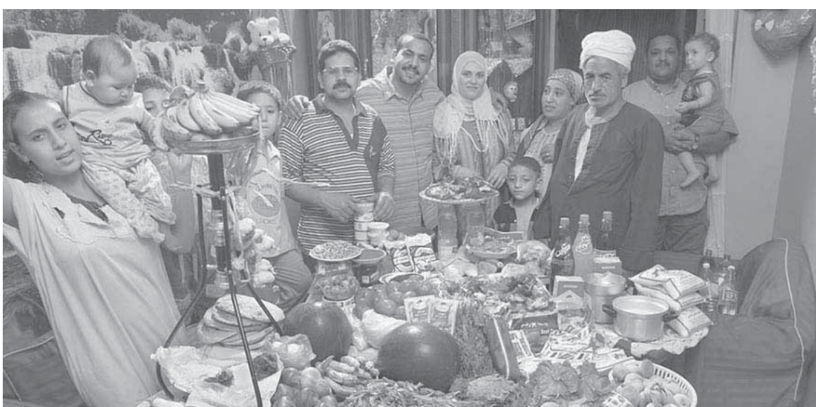
تكاليف عزومات رمضان عيب على ميزانية أى بيت

ليس من الصحيح أن تترك الزوجة زوجها غاضباً قبل نومه، فهو كثيراً ما يتعرض لضغوط يومية تجعله يتعرض لحالة من الاختناق النفسي، ولهذا على الزوجة مصالحة الزوج فوراً، أما إذا كان غضب الزوج بسبب مشاكل في العمل فيجب أن تقف الزوجة في صفه، وتؤكد له أن لديه حقاً في أن يغضب، في الوقت نفسه على الزوجة العمل على بث الثقة في زوجها وأنه قادر على مواجهة تلك الصعاب، وأنها ستقف بجانبه دائماً، حتى يصل إلى ما يريد، وبالتالي تستطيع الزوجة أن تمتص غضب زوجها وتجعله يشعر بالراحة.