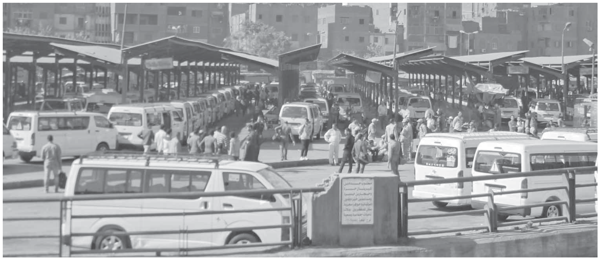
زحام في مواقف السيارات الأجرة

آلاف العمال المغتربين يتزاحمون على مواقف السيارات للحاق بإفطار «أول يوم»