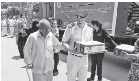
مساعدات غذائية من الداخلية للمواطنين

حرصت الأجهزة الأمنية بمديرية أمن القاهرة على مشاركة المواطنين البديلة بأجواء شهر رمضان ومساعدتهم في تحمل نفقات الحياة، فق قامت بتوزيع المنتجات والسلع الغذائية الأساسية على المواطنين بعدة مناطق بالعاصمة بمناسبة حلول شهر رمضان المبارك.