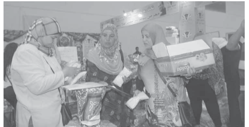
ريات البيوت لجأن إلى معارض الحكومة أملاً في أسعار مخفضة عن الأسواق