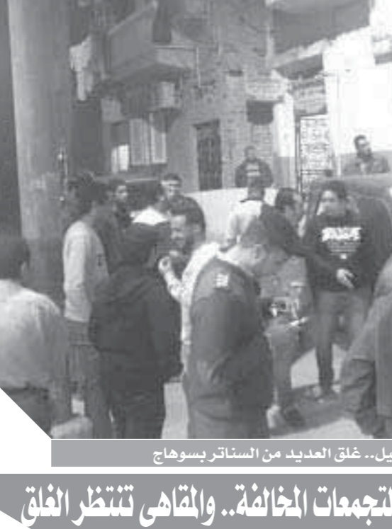
بعد منتصف الليل.. غلق العديد من السنااتر بسوهاج

الدروس الخصوصية لقيامها بممارسة نشاط الدروس الخصوصية. ورصدت مديرية التربية والتعليم بالقليوبية وجود ٨٠ مركز دروس خصوصية بينها ٤٦ بكفر شكر و٢٢ بالقناطر الخيرية و٤ بقلوب و٣٦ بالخانكة و٢٨ بشبرا وشبرا ١٦ بالخصوص و١١ بالعبور وتم بغرب شبرا وجارى استمرار أعمال الحصر وتم الدفع بحملات مكبرة أسفرت عن غلق عدد من سنااتر ومراكز الدروس الخصوصية.