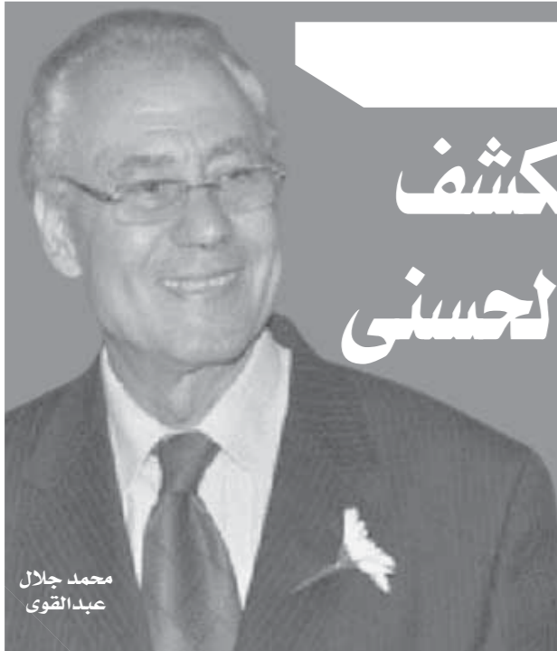
محمد جلال عبدالقوى

يملك الكاتب والسينارست الموهوب محمد جلال عبدالقوى رصيد ضخم من الأعمال الدرامية التي وضعته في مقدمة العظماء في صناعة الكلمة حتى نجح باقتدار أن يكون مايسترو الحوار في الدراما التلفزيونية لأكثر من ٤٠ مسلسلًا تجسد وترسخ الشخصية المصرية التي اقتقدناها بغيابه، منها على سبيل المثال المال والبنون والليل وآخره. نصف ربيع الآخر، قصة الأسمس، موسى ابن نصير، حضرة المتهم أبي وغيرها من دراما القيمة والقيم. عاد عبدالقوى بعد غياب ١٢ عامًا عن ساحة الإبداع مثل