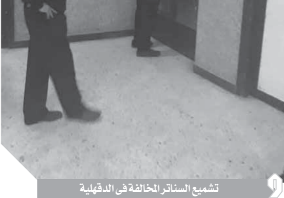
تشجيع السنااتر المخالفة فى الدقهلية

وتنادى محافظ بورسعيد أولياء الأمور الحفاظ على صحة أبنائهم وعدم التعامل مع سنااتر الدروس الخصوصية والاعتماد على النفس بالمراجعة المنزلية ومراعاة قواعد الحفاظ على الصحة العامة التي تنفذها الدولة في مختلف المساحات والميادين خلال هذه الفترة كإجراء احترازية، كما قرر محافظ بورسعيد تعليق الأنشطة الرياضية بجميع مراكز الشباب ونشاط أبناء المحافظة بالبعد عن التجمعات كإحد أهم الإجراءات الوقائية فى الفترة الحالية، وخصصت محافظة بورسعيد