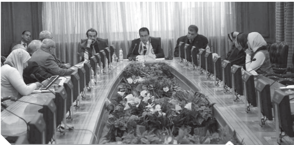
أعضاء لجنة الفيروسات التنفسية خلال اجتماعهم الطارئ

«عبد الغفار» يؤكد جاهزية المستشفيات الجامعية.. و«تاج الدين» يعرض خطط مواجهة «سارس»