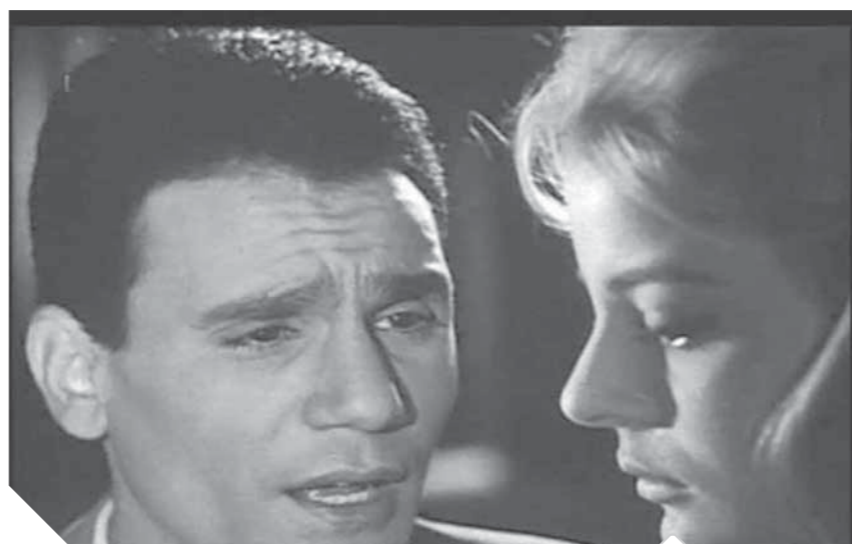
مشهد من فيلم «الخطايا»