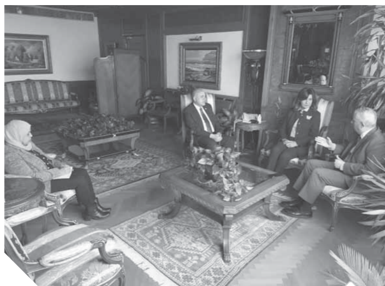
وزير الري والهجرة ورئيس لجنة العلاقات الخارجية بالبرلمان

بحث الدكتور محمد عبدالعاطي وزير الموارد المائية والري ونبيلة مكرم وزيرة الدولة للهجرة وشئون المصريين بالخارج وكريم درويش رئيس لجنة العلاقات الخارجية بالبرلمان خطة الدولة لترشيد الاستخدامات المائية وخطة التوعية بتضايا المياه على الصعيدين المحلي والدولي، وتم بحث آليات مشاركة المصريين بالخارج في نقل التكنولوجيات والتقنيات الحديثة المتعلقة بالمشروعات المائية. وأشارت «مكرم» إلى مجهودات الجاليات المصرية في زيادة الوعي العام بالخارج بالتحديات المائية المصرية وتوضيح الموقف المصري بملف سد النهضة، حيث من المزمع أن تنظم الجالية المصرية بالولايات المتحدة وقفة أمام البيت الأبيض والبنك الدولي اليوم، دعماً لمصر في مفاوضات سد النهضة، وتشن الجميع موقف المصريين بالخارج، حيث كشف ذلك عن الممدن المصري الأصل وارتباطه الوثيق بأرض الوطن.