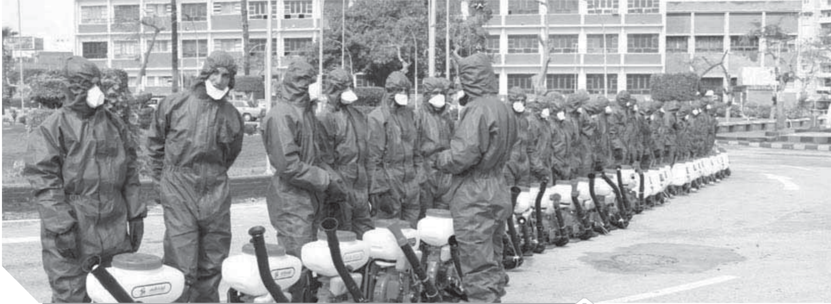
فرق التعقيم بدأت عملها الجديد إلى مصر