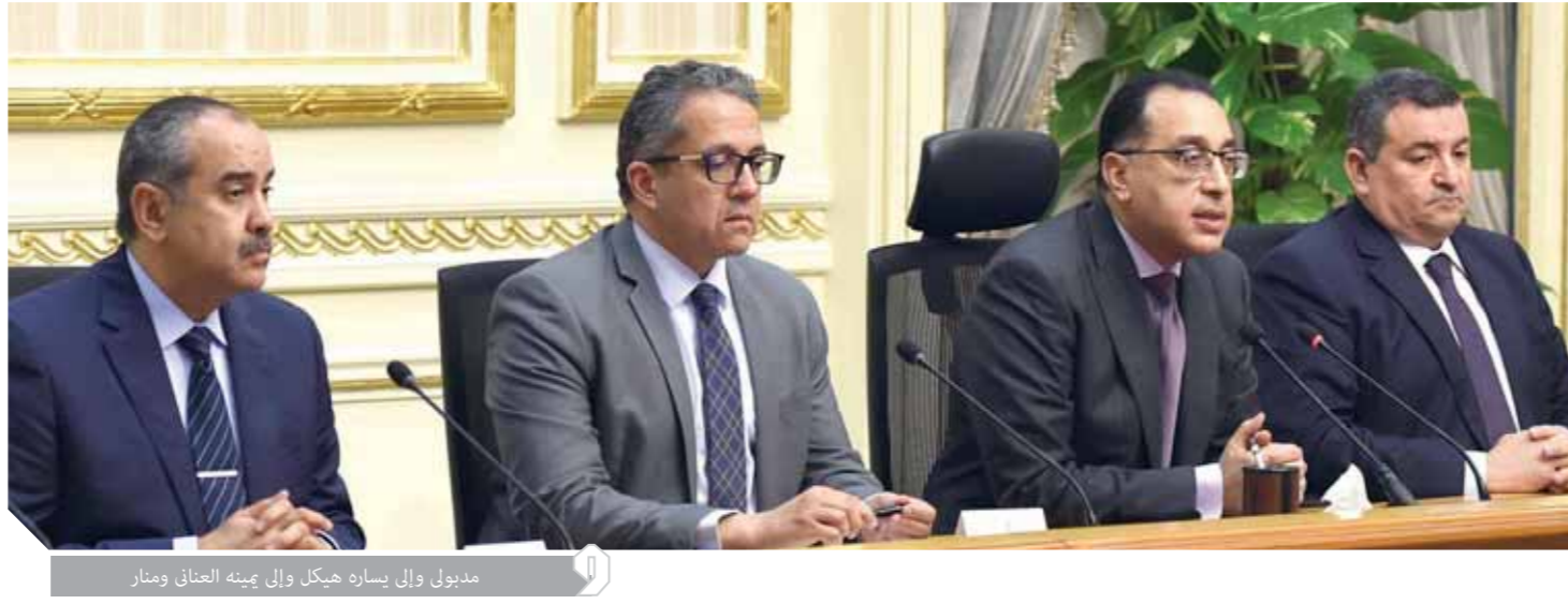
مدبولي وإلي يساره هيكلي وإلي يمينه العناني ومشار

ودعا المصريين إلى الالتزام بالقرارات حتى لا تتطور الأمور، وأكد أنه لدينا رصيد كبير من السلع يكفينا أشهراً طويلة قادمة، وأنه لا داعي للتزاحم أو القلق. وطالب رئيس الوزراء المواطنين بالامتنان التام على توافر السلع، وقال إننا سوف نتعامل بمنتهى الحزم مع التجار الجشعين، وهناك تنسيق مع الغرف التجارية. وأشار إلى الاتفاق مع وزير الطيران خلال فترة تعليق حركة الطيران أنه سيتم تعقيم المطارات والمنشآت السياحية. وقال إن هناك قطاعات سوف تتحمل خسائر منها