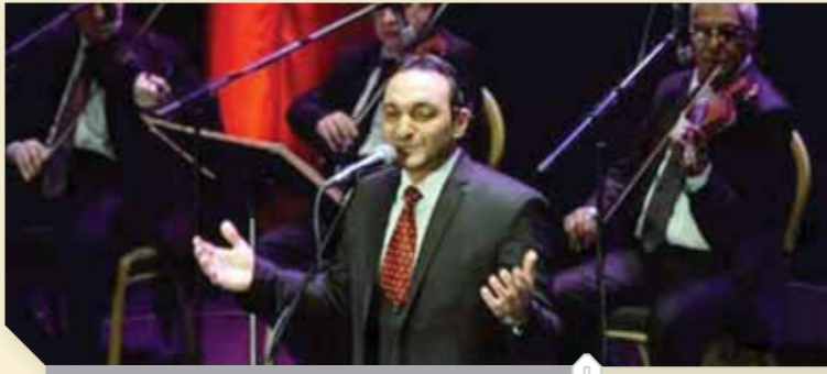
الفنان السورى عبدالقادر داية

وعندما تصاعدت السنة الحرب فى وطنه، جاء إلى مصر مع أسرته، المعقل الرئيسى للفن، وانطلقت حجرته الذهبية فى بداية وجوده بمصر فى الإسكندرية عروس البحر، التى مكث بها ٤ سنوات. جاء بعدها إلى القاهرة، ليثبت أقدامه الفنية على مسرح الأوبرا، وحول هذا يقول الفنان عبدالقادر داية إن الوصول للفناء بالأوبرا لم يكن سهلاً بل فى غاية الصعوبة، لأن حجرته ليست وحدها جواز مرور، بل يجب أن يقدمه أحد حتى يعرفه الجمهور، ومن هنا وقف بجانبه بعض الأساتذة من الفنانين المصريين الذين استقبلوه، وقدموه أولاً فى صالوناتهم وندواتهم على غرار الأساتذة سعيد مختار، أشرف سامى، أحلام أحمد، والأخيرة وقف معها على مسرح الجمهورية قبل أن يصل إلى الأوبرا.