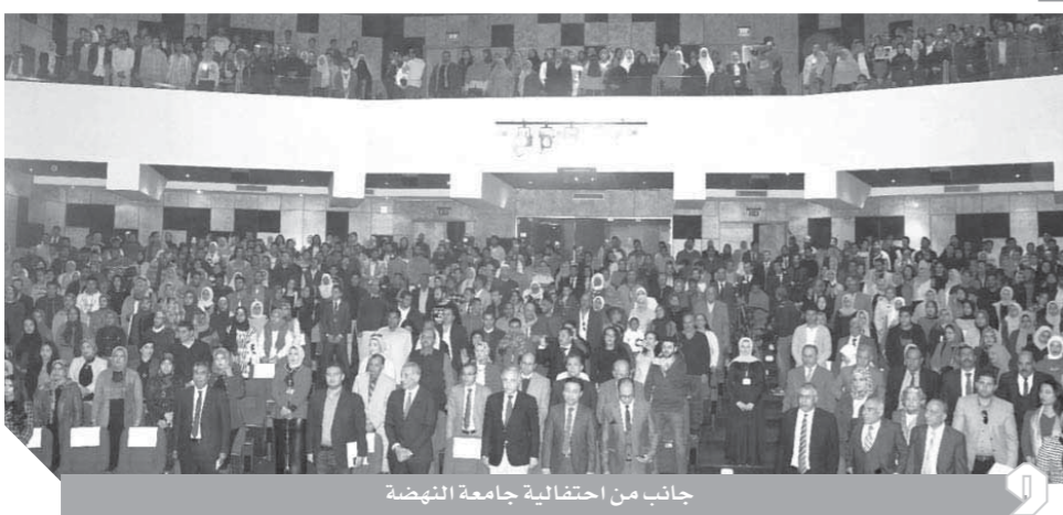
جانبا من احتفالية جامعة النهضة

قرار رؤساء الجامعات إخلاء المدن الجامعية وبدء عمليات موسعة لتعقيم الجامعة، وذلك في إطار خطة الجامعة للوقاية من فيروس كورونا المستجد، وجه الدكتور محمد الخشت رئيس جامعة القاهرة عمداء الكليات والمعاهد رؤساء المراكز والمستشفيات بالمتابعة المباشرة لتنفيذ بنود خطة الجامعة لمكافحة الفيروس واتخاذ كل الاحتياطات اللازمة. وأصدر الدكتور محمد الخشت، تعليماته بإخلاء