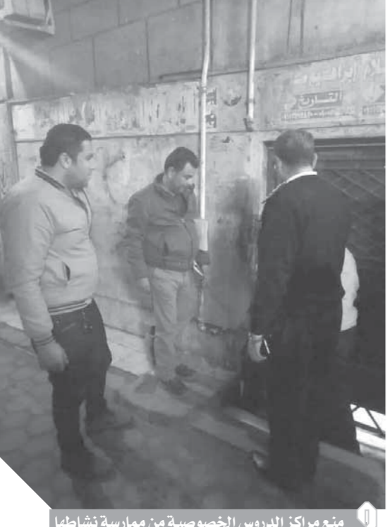
متح مراكز الدروس الخصوصية من ممارسة نشاطها