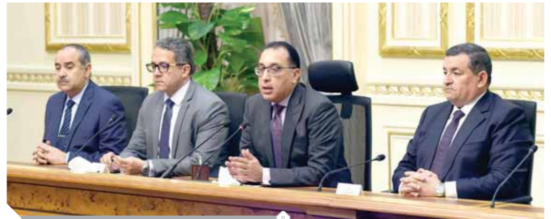
مدبولي والى يساره هيكال والى يمينه العناني ومشار

«الوزراء» يكذب «الجاردان» حول إصابة ١٩ ألف مصري بـ«كورونا»