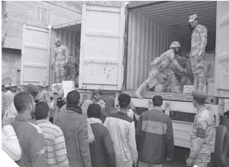
القوات المسلحة تشارك بإغاثة المضارين من الطقس السيئ

كتب: محمد صلاح وأبو زيد كمال وسامية فاروق: