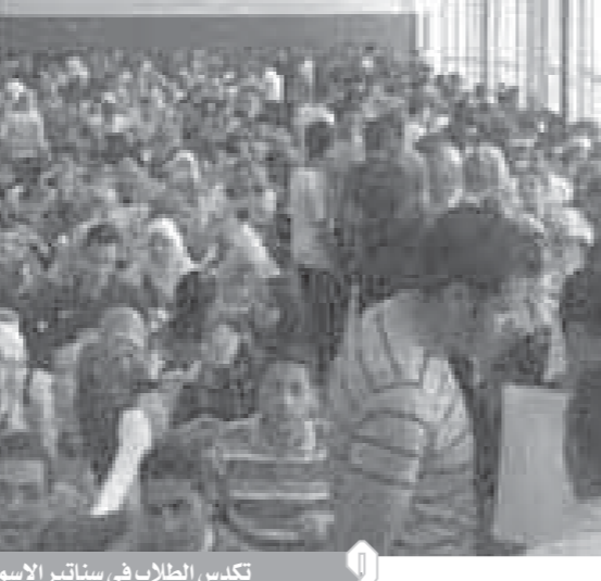
تكس الطلاب فى سنااتر الإسمايلية

وكانت مديرية الصحة بالدقهلية قد قامت مؤخرا بحملة تطهير موسعة بجميع المحافظات الحكومية والمدارس المختلف على مستوى المحافظة وكشفت المصادر قيام العاملين بالبولك باستخدام الكمادات الواقيه وكشفت الجامعة إجراءات المجلس الأعلى للمستشفيات الجامعية ومستشفيات جامعة المنصورة للوقاية من العدوى والإصابة بالكورونا تضمنت الإجراءات تكثيف أعمال تطهير كافة المنشآت وملحقات المستشفيات والكليات والمدن الجامعية وتعقيمها بصفة يومية، وأكد الدكتور أشرف عبدالباسط رئيس الجامعة بث المحاضرات إلكترونيا للطلاب من خلال مراكز التحول الرقمي.