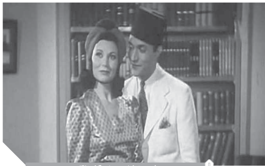
مشهد من فيلم، رصاصه في القلب.