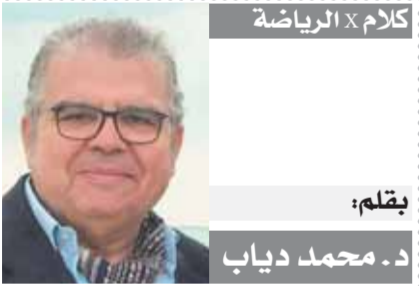
بقلم: د. محمد دياب