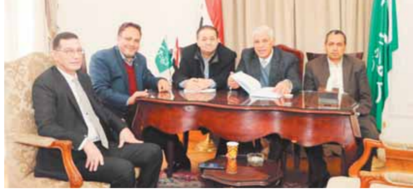
لجنة الإشراف على الانتخابات

ضريح سعد باشا زغلول بمنطقة وسط البلد، في تمام الساعة الثانية ظهراً لإعلان برنامج الانتخابي والرد على تساؤلات الصحفيين وسائل الإعلام. وبدأت اللجنة المشرفة على انتخابات رئاسة حزب الوفد ٢٠٢٢، عملها يوم السبت الماضي، في تمام الساعة الحادية عشرة صباحاً في المقر الرئيسي