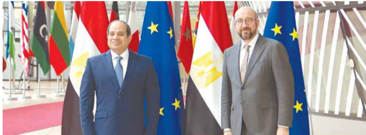
الرئيس السيسي خلال لقائه مع رئيس المجلس الأوروبي

نجاحاً في المنطقة في هذا الصدد تحت القيادة الحاسمة والحكمة من الرئيس. كما أعرب الرئيس السيسي عن تطلع مصر لتعزيز التعاون المشترك مع الاتحاد الأوروبي في مجال مكافحة الإرهاب والتطرف وفقاً لمقاربة شاملة تعالج الجذور الرئيسية للإرهاب والتطرف.