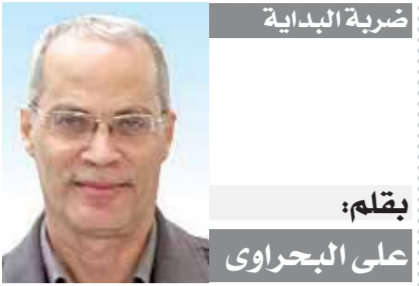
بقلم: على البحراوى