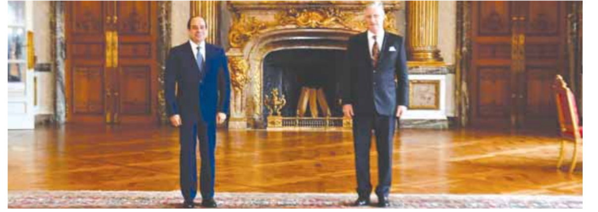
الرئيس السيسي خلال لقائه مع ملك بلجيكا

..وخلال لقائه شارل ميشيل رئيس المجلس الأوروبي: