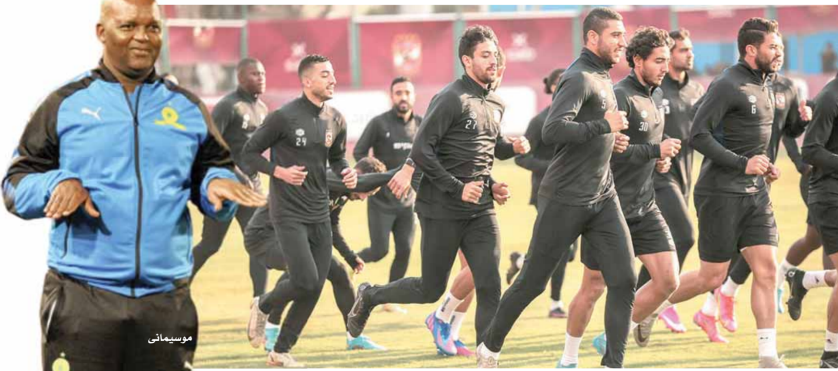
الأهلئ يستعد بقوة لمواجهة الهلال