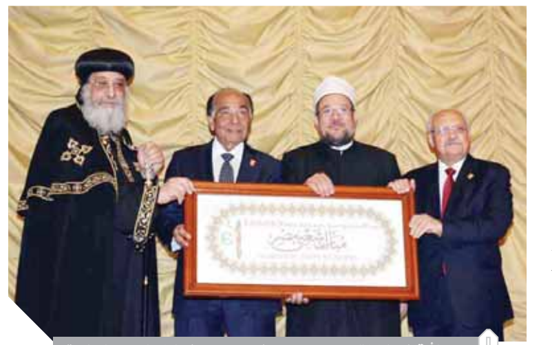
وزير الأوقاف والبابا تواضروس ومحمد فريد خميس في لقاء الوحدة الوطنية

فلا يبقى للناس مساجد ولا كنائس ولا معابد ولا وطن ولا دين، فالكنائس الصادقة هي التي تبقى والزبد إلى جفاء.