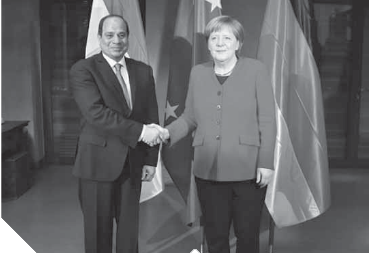
الرئيس السيسي، يصافح ميركل

الدول الأوروبية، ومؤدى ذلك أن هناك حاجة في المرحلة الحالية إلى مزيد من التواصل والتسويق بين الجانبين لإيجاد أرضية مشتركة لمعالجة المشكلات والموضوعات ذات الاهتمام المشترك، ولهذا تعد التمة العربية الأوروبية في شرم الشيخ فرصة وخطة هامة في هذا الاتجاه، وسيعقبها العديد من الخطوات الأخرى. وحول مكافحة ظاهرة الإرهاب، أكد السيسي أنه كان أول رئيس دولة إسلامية يطلب بتصويب الخطاب الديني، خاصة وأن شتى الدول تعاني من الخطاب الديني المتشدد ليس فقط الدول العربية أو الإسلامية بل العالم بأسره، وشدد السيد الرئيس على ضرورة أن ينتبه العالم لتلك الظاهرة، ففي عام 2014 طالب الرئيس بضرورة التعامل بحسم لاستخدام وسائل التواصل الاجتماعي وأنظمة الإتصال الحديثة في تشجيع الفكر المتطرف، وتجنيد العناصر واستخدامهم لإيذاء العالم، وهو الطلب الذي لم يتم التفاعل معه بالشكل المناسب على الصعيد الدولي، وفي التقدير فإن الفكر المتطرف سيظل يساهم في تفتيش ظاهرة الإرهاب ما لم تتم إجراءات دولية حاسمة لتقصيحه.