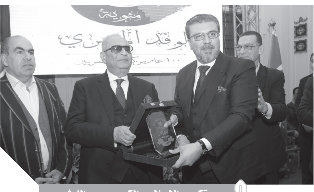
.. وتكريم الإعلامي الكبير عمرو الليثي