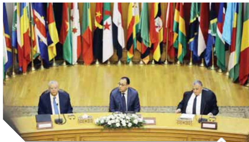
الجلسة الافتتاحية للمؤتمر الثالث لرؤساء المحاكم

بالتزامن مع رئاسة مصر للاتحاد الأفريقي لعام 2019،