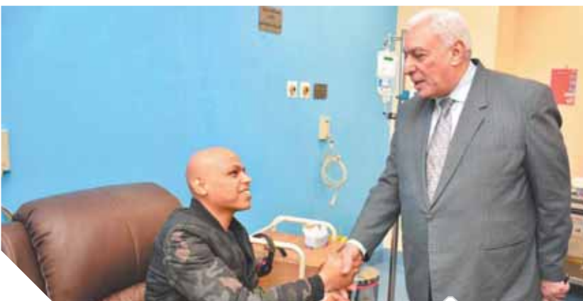
محافظ الأقصر يزور أحد المرضى