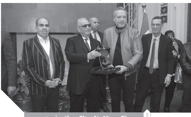
تكريم الإعلامي الكبير تامر أمين