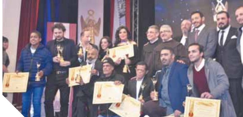
تكريم أبطال فيلم يوم الدين

سخرية المخرج عادل أديب من حالة البطالة التي يعيشها الوسط الفني وقال اعترض عن حضور اسدقائى الحمد لله عندهم شغل الحمد لله لسه في حد يشغل ، وأضاف أن مصر قادمة بقوة وأضاف في كلمته ان السينما تقوم على الإبداع والامتاع كما أشعلت المطربة الشابة ايه عبدالله حنل الختام وقدمت مجموع من الأغنيات منها الاطلاق، ومصر وتفاعل معها الجمهور واختتمت اليوم فعاليات الدورة الـ 67 للمهرجان المركز الكاثوليكي للسينما برئاسة الأب بطرس دانيال، والتي استمرت فعالياتها