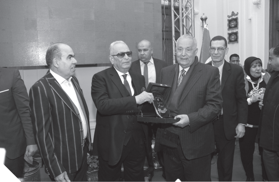
.. ويكرم الكاتب الصحفي الكبير صبري غنيم