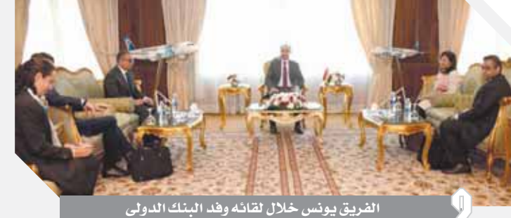
الفريق يونس خلال لقائه وفد البنك الدولي

كتبت - أماني سلامة، التقى الفريق يونس المصري وزير الطيران المدني وفد البنك الدولي ليبحث سبل التعاون المشترك في مجال الطيران المدني. وناقش الجانبان الآليات والإمكانات