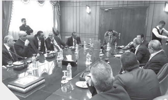
وزير الرياضة خلال اجتماعه مع اللجنة المنظمة للبطولة

وأكد صبحى اهتمامه بكافة الألعاب الرياضية، وقال إن الوزارة تدعم اتحاد اليد وكافة الاتحادات المختلفة التى تنظم البطولات العالمية التى تقام على أرض مصر، مؤكداً أن الوزارة تقوم بتسهيل كافة الأمور من أجل العمل على إنجاح البطولة، مضيفاً أن كرة اليد هى اللعبة الشعبية الثانية فى مصر، والوزارة توليها كل الاهتمام، كما أن استضافة البطولة على أرض بورسعيد يؤكد أن شعب بورسعيد شعب رياضى ويسعد بإقامة كافة الأنشطة الرياضية