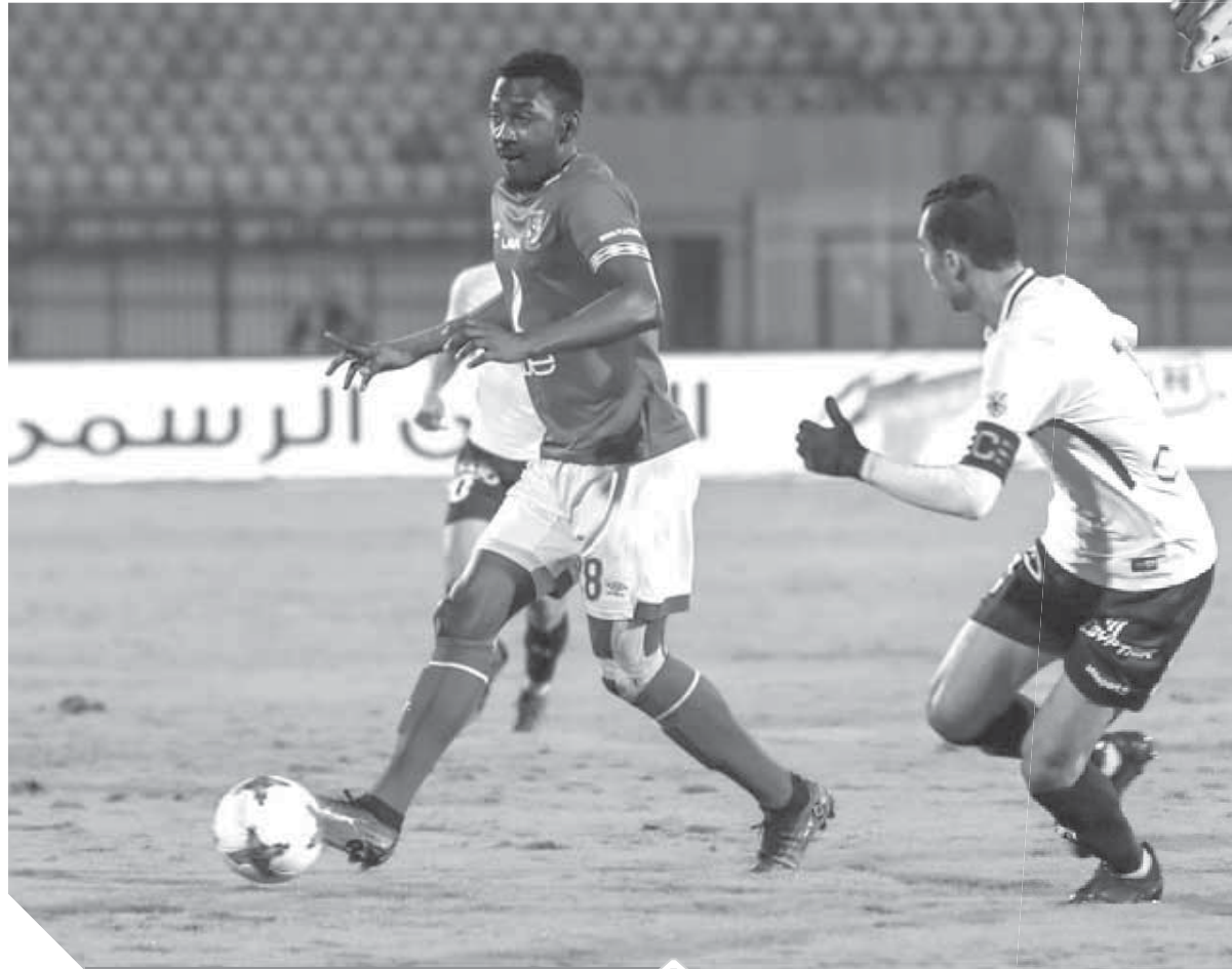
آجاي يجرد للأهلى خلال ساعات

اختبار أخير يحسم عودة «صالح» و«مروان» فى لقاء الداخلية.. و«محارب» غاضب من التهميش