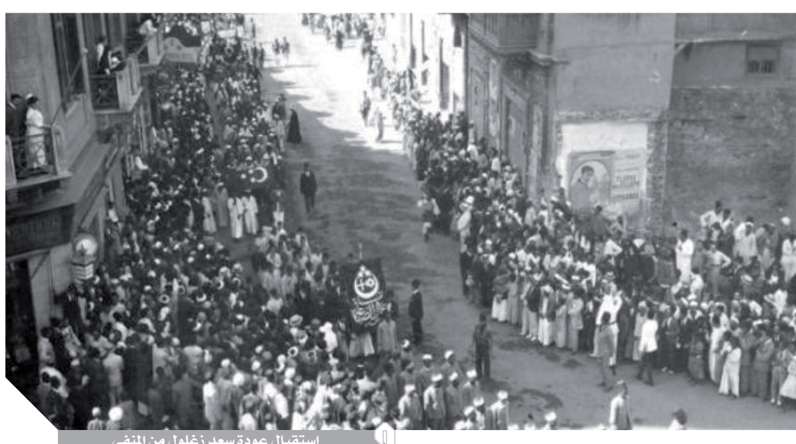
استقبال عودة سعد زغلول من المنفى

سعد باشا، وبالوفد المصري بعد خروجه من السجن، وهي للأمانة التاريخية تخرج عن نطاق مسئولية «فهمي» المباشرة. وإذا كان ابن شقيق عبدالرحمن فهمي هو أحمد ماهر قد شكل أحد أجنحة الوفد القوية واختير زيراً، أو حصل على الباشاوية فيما بعد اشتق عن الوفد وصار خصماً لدوداً لمصطفى النحاس وتقلد رئاسة الوزراء، فإن عبدالرحمن فهمي لم يحصل على أي شيء، واكتفى باسترجاع ذكريات الفداء والتضحية وتذكر وجوه المخلصين من الفدائيين العظام الذين لم نعرف منهم سوى القليل، حيث كانت هناك أعمال بطولية عظيمة لم يعرف أحد حقيقة من قام بتنفيذها بسبب حذر وفضلة ودهاء القائد السري للثورة المسلحة. لكن على أي حال، فقد عاش عبدالرحمن فهمي بعيداً إلى حد ما عن السياسة وأثر أن يقضى باقي عمره في تأسيس النقابات العمالية وتنظيمها في مصر، وأصدر جريدة للتحدث باسم العمال وظل حريصاً على عدم الحديث عن دوره وخدمته للثورة حتى وفاته في يوليو سنة 1946 تاركاً أربعة أبناء كان من بينهم مراد فهمي وزير الأشغال فيما بعد. مات عبدالرحمن فهمي وخرج الناس يودعون ولم يكن كثير منهم يعلمون دوره العظيم في إشعال أهم وأعظم ثورة في تاريخ مصر، وفيما بعد خرجت مراسلات الثورة السرية وبان الدور العظيم الذي لعبه.