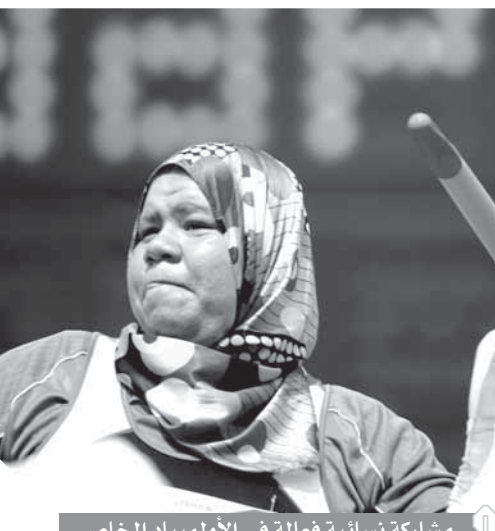
مشاركة نسائية فعالة فى الأولمبياد الخاص

تشهد مسابقات ألعاب القوى (أم الألعاب) التى ستقام ضمن الألعاب العالمية للأولمبياد الخاص بالإمارات 2019 مشاركة 148 لاعباً ولاعبة، وتشارك مصر فى ألعاب القوى بفريق مكون من 4 لاعبين و4 لاعبات. وتقام مسابقات ألعاب القوى بنادى ضباط شرطة دىبى ضمن الرياضات الثلاث التى تستضيفها دىبى حيث يستقبل مجمع حمدان الرياضى مسابقات السباحة فى الصالات والسباحة المفتوحة فى مياه الخليج العربى فى شاطئ جميرا. بينما تقام باقى الألعاب بمركز أبو ظبى للمعارض اندوك، ومدينة زايد الرياضية، وحلبة مرسى ياس، ومنتج الفرسان الرياضى الدولى، ونادى ياس لينكس أبو ظبى للجولف، وكورنيش أبو ظبى، ونادى ضباط الطائرة.