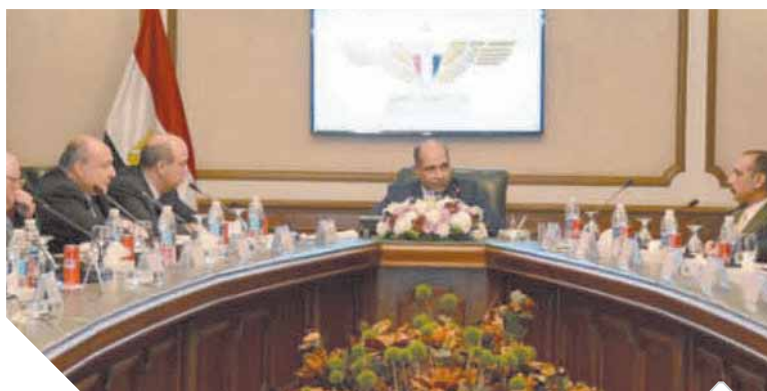
وزير الطيران يناقش مع شركات الطيران الخاصة الخطة المستقبلية

سيكون له الأثر الأكبر على زيادة معدلات الدخل القومي خاصة أن القطاع شهد طفرة واضحة خلال الفترة الماضية. وفي نهاية اللقاء أكد وزير الطيران أن شركات الطيران المصرية الخاصة هي جزء أصيل من منظومة قطاع الطيران المدني، حيث تم الدعوة لعقد اجتماعات بشكل دوري مع سلطة الطيران المدني وشركة مصر للطيران من أجل تحقيق التكامل بين قطاعات منظومة الطيران المدني المصري.