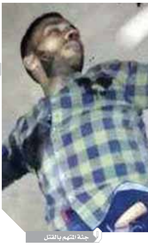
جثة المتهم بقتل شخصين