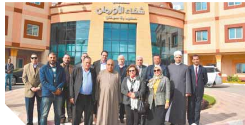
لجنة الشئون الدينية تزور مستشفى الأورام