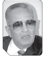
بهاء الدين أبو شقة