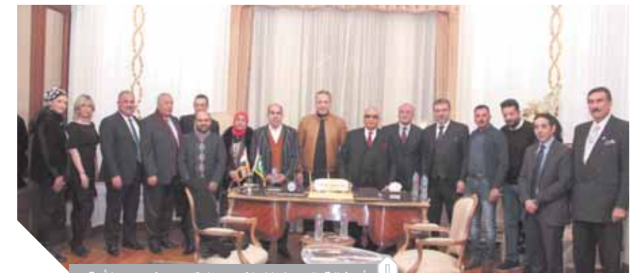
أبوشقة يتوسط الإعلاميين المكرمين في بيت الأمة