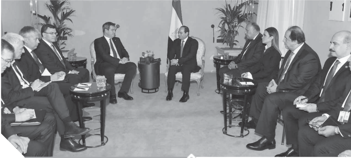
الرئيس السيسي، والوفد المرافق خلال اجتماعهم مع الجانب الألماني