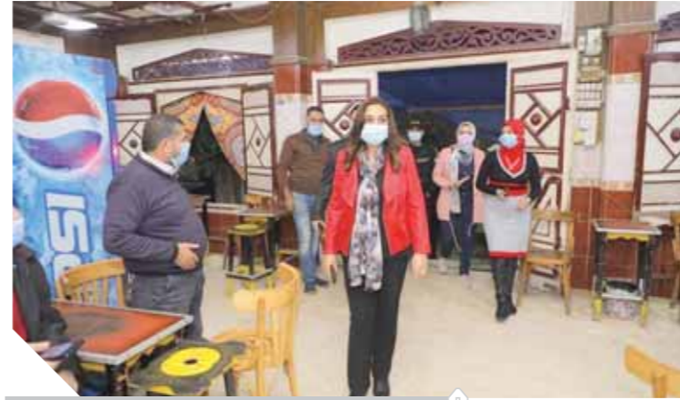
الذكورة مثال عوض محافظة دمياط تفود حملة

لرصد المخالفات، حيث تم إزالة ٣ حالات تعد البناء على أرض زراعية، بغزة مشطة التابعة للوحدة المحلية لدمشدر على مساحة ٣٣٥ متر مربع. وأعلنت الوحدة المحلية مركز مغاغة شمال محافظة المنيا، عن ضبط مقهى مخالف، يقوم صاحبه بتقديم المشية للعوالمين، وتم التحفظ على المضبوطات، وتسليم صاحب المقهى مركز الشرطة، وتحرير محضر، واتخاذ كافة الإجراءات القانونية، وجاء ذلك بناءً على تعليمات اللواء أسامة القاضي، محافظ المنيا، بتشديد الرقابة والتأكد من تطبيق قرارات رئاسة مجلس الوزراء، واتباع الإجراءات الاحترازية لمواجهة فيروس كورونا المستجد، ومن جانبه أوضح محمد السيد، رئيس مركز مغاغة، شمال المنيا، أنه خلال القيام بعملية مكبرة على الحملات، وأماكن تقديم الخدمات للعوالمين لإزالة التعديات وإشغالات الطرق، وضبط الأسواق، وللتأكد من تطبيق الإجراءات الاحترازية، وفي مقدمتها التباعد الاجتماعي، والالتزام بالمواعيد المقررة للفلق واتباع وتطبيق الإجراءات الاحترازية، حيث تم ضبط أحد المقاهي يقدم شيشة لرواده شارع الشواني بحي غرب مدينة مغاغة، حيث تم ضبط ١١ شيشة، والتحقق من المخالف، وتحرير المحضر اللازم لاتخاذ الإجراءات القانونية حيال المخالف.