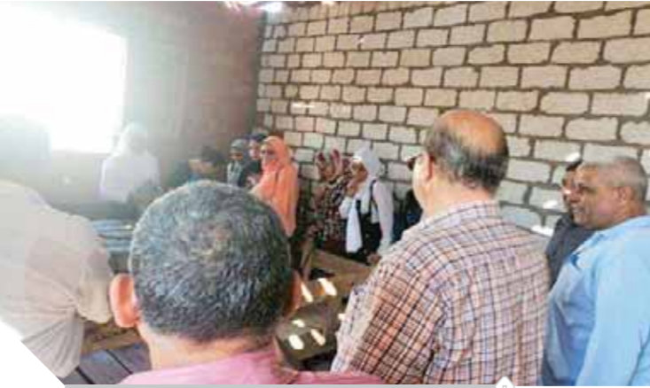
غلق ستر دروس بالبنيا