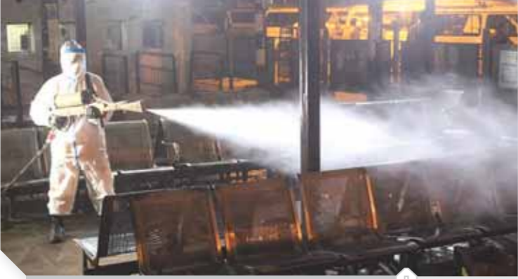
جانب من عمليات التعقيم

بالإضافة إلى تطهير وتعقيم محطتى مترو الهايكستب وعدلى منصور وما تحتويه من أجهز وأرصفة وشبابيك حجز التذاكر وحواط وأماكن انتظار بما يحقق ضمان سلامة وأمان المواطنين المترددين، وكذا تطهير وتعقيم موقفى عبود والمظلات والمناطق المحيطة بها.