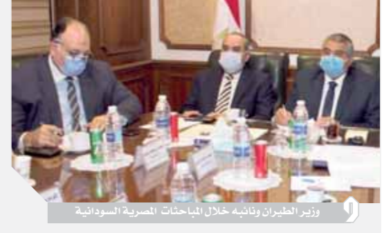
وزير الطيران وتلقيه خلال المباحثات المصرية السودانية

أكد وزير الطيران المدني أن القيادة السياسية تولي اهتماماً كبيراً بتعزيز التعاون الدائم بين مصر والسودان في مختلف القطاعات وبخاصة في مجال الطيران المدني والنهوض بهذا المرفق الحيوي المهم الذي يمثل تحدياً كبيراً للتعاون المتميز بين البلدين الشقيقين، جاء هذا خلال الاجتماع الذي عقده الطيار محمد منار وزير الطيران المدني عبر تقنية الفيديو كونفرانس مع المهندس هاشم بن عوف وزير البنية التحتية والنقل