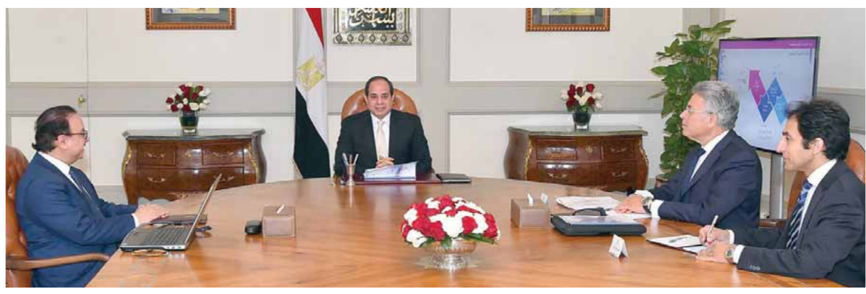
السيسى، خلال اجتماعه مع وزير الاتصالات ورئيس الرقابة الإدارية

زيادة المساهمة في الناتج المحلي إلى 8%.. والصادرات إلى 20 مليار دولار إنشاء 10 مصانع للإلكترونيات و10 مناطق تكنولوجية وتوفير 4.5 مليون فرصة عمل