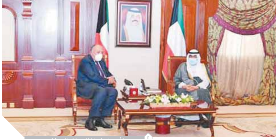
الأمير نواف خلال استقباله، شكرى،

وأعرب أمير الكويت عن تطلعه لزيارة مصر في أقرب وقت، ونقل شكرى تهنئة الرئيس السيسى بتولى الشيخ نواف حكم الكويت، وتسمية الشيخ مشعل الأحمد الصباح ولياً للهد. أكد سامح شكرى وزير الخارجية عقب لقائه أمير الكويت وولى العهد على متانة العلاقات بين الشعبين الشقيقين، وما تربطهما من علاقات استراتيجية ممتدة، كما أكد أهمية العمل خلال المرحلة القادمة لاستغلال الفرص المتاحة لدى الجانبين للدفع قدماً بمجالات التعاون الثنائي إلى آفاق أرحب، مع إيلاء أهمية خاصة للتعاون الاقتصادي خاصة فى تلك الظروف التي يواجهها العالم.