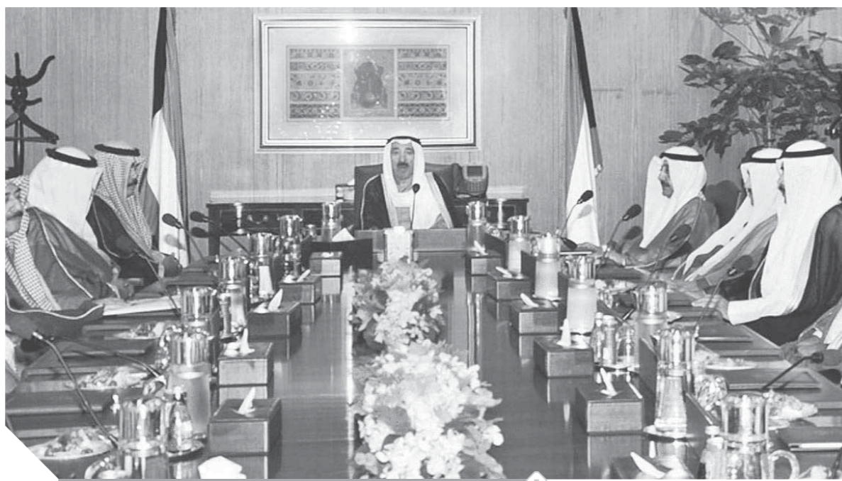
استقالة الحكومة الكويتية رسالة واضحة يتمسك أمير الكويت بالديمقراطية

للدستور الكويتي فإن مجلس الوزراء، أو حكومة الكويت، هي السلطة التنفيذية ويقوم الأمير بتعيين رئيس الوزراء، الذي يقوم بتعيين الوزراء في حكومته. ووفقاً للدستور أيضاً يجب أن يكون أحد أعضاء الحكومة ممن تم انتخابهم في مجلس الأمة الكويتي. وجميع أعضاء الحكومة المنتخبين وغير المنتخبين لديهم مقعد في مجلس الأمة، ويجب ألا يزيد عدد أعضاء الحكومة على ثلث أعضاء مجلس الأمة المنتخبين، شكلت أول حكومة في عهد الشيخ عبدالله سالم الصباح في ١٧ يناير ١٩٦٢، وكانت حكومة انتقالية حتى بدء العمل بالدستور.