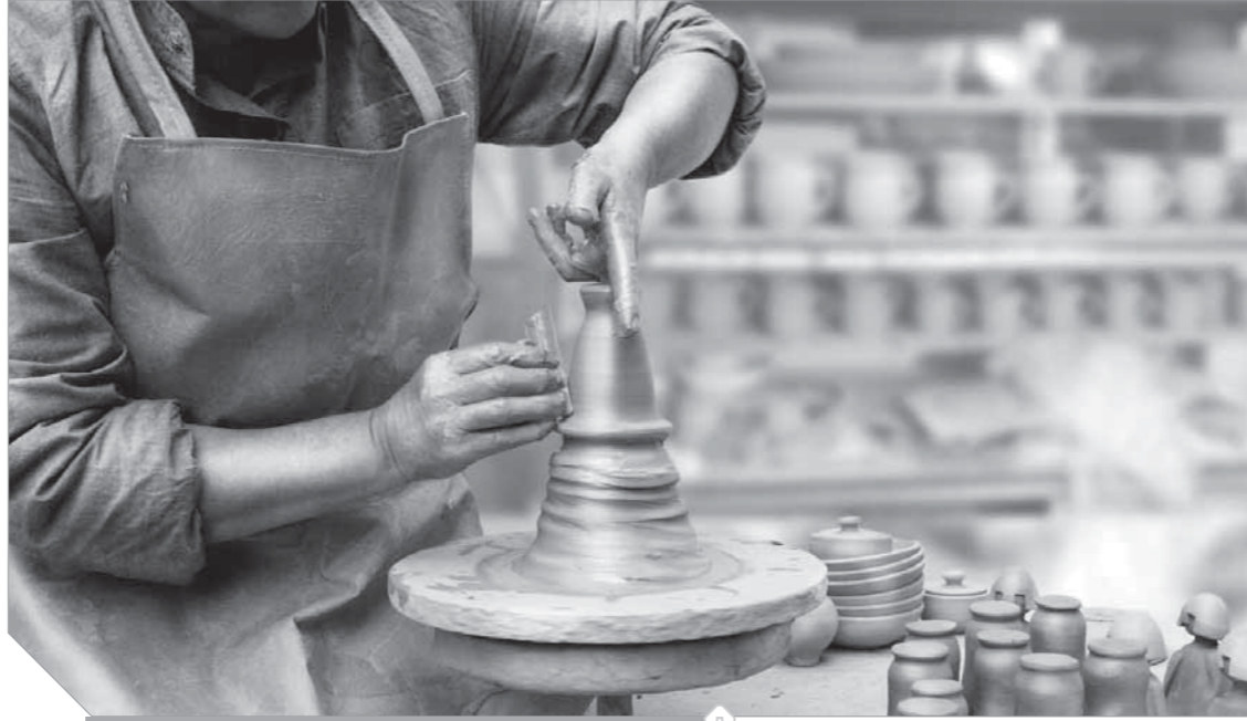
الصناعات اليدوية والحرفية من أقدم الصناعات الصغيرة والمتوسطة في مصر

مصر، وحصر أعداد العاملين بها وطبيعتهم وفتحهم العمري، وكذلك أماكن تركيز الحرف وتوزيعها على الخريطة الجغرافية للدولة، وتكليف هيئة الرقابة على الصادرات والبورصات وضع آكواد جمركية خاصة بكل الحرف اليدوية على غرار الآكواد الجمركية في الهند، فضلاً عن استحداث مدارس ودبلوم حرفي يجذب الأجيال ويساعدهم على صورة مرموقة لأنفسهم على غرار العديد من الجامعات في أوروبا والتي تمنح درجة بكالوريوس في الفنون والحرف التقليدية واليدوية، كما يوصى المركز المصري بمساعدة الحرفى على سهولة الوصول للخدمات وتحسين جودتها من خلال نظام شراء مموع من خلال شركات أو مجمعات شرائية تمتد الحرفى بكيماته المطلوبة، وكذلك توفير وحدات مصغرة للصناعة لتلبي الأسباب، والاستفادة من المزايا المنوطة للسلطات المصرية بالخارج وإقامة معارض خاصة بالحرف اليدوية بها، وكذلك السماح للعاملين بعرض منتجاتهم في مناطق حيوية وسياحية كالمتاحف والمتاحف وغيرها، مع ضرورة تخصيص الدعم والتمويل حسب الإنتاج وطبيعة كل مؤسسة، بالإضافة لطبيعة المشروع ومتطلبات الحرفى، كما أن التمويل لابد وأن يكون مقرنًا بالتدريب لتقليل الخسائر والمخاطرة على غرار مبادرة بنك الإسكندرية.