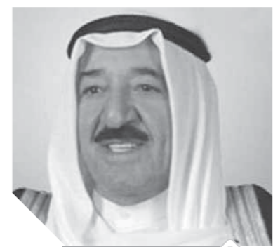
الشيخ صباح الأحمد