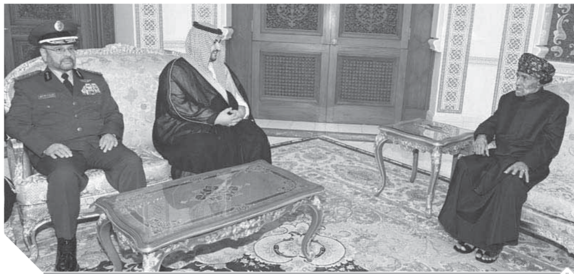
السلطان قابوس بن سعيد سلطان عمان يستقبل في إطار المشاورات الجديدة الأمير خالد بن سلمان نائب وزير الدفاع في السعودية

كما عقد السيد بدر بن سعود البوسعيدي الوزير المسؤول عن شؤون الدفاع في سلطنة عمان، بمقر وزارة الدفاع، جلسة المباحثات الرسمية مع الأمير خالد بن سلمان نائب وزير الدفاع السعودي والذي أكد متانة وعق العلاقات التاريخية التي تربط السلطنة والسعودية، وسعى قيادتي البلدين إلى العمل على تعزيزها بما يحقق مصالحهما المشتركة وبذل مزيد من أوجه التعاون والتسيق المشترك بما يحقق الأمن والاستقرار في المنطقة. عقب ذلك تم استعراض العلاقات القائمة بين البلدين الشقيقين، ويحث مجالات التعاون بين وزارتي الدفاع وتعزيزه. من جانبه استقبل الفريق أول سلطان بن محمد النعماني وزير المكتب السلطاني، نائب وزير الدفاع