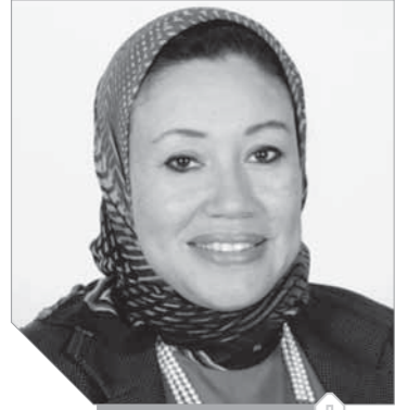
عملة عبد المطفى

مصر، وحصر أعداد العاملين بها وطبيعتهم وفتحهم العمري، وكذلك أماكن تركيز الحرف وتوزيعها على الخريطة الجغرافية للدولة، وتكليف هيئة الرقابة على الصادرات والبورصات وضع آكواد جمركية خاصة بكل الحرف اليدوية على غرار الآكواد الجمركية في الهند، فضلاً عن استحداث مدارس ودبلوم حرفي يجذب الأجيال ويساعدهم على صورة مرموقة لأنفسهم على غرار العديد من الجامعات في أوروبا والتي تمنح درجة بكالوريوس في الفنون والحرف التقليدية واليدوية، كما يوصى المركز المصري بمساعدة الحرفى على سهولة الوصول للخدمات وتحسين جودتها من خلال نظام شراء مموع من خلال شركات أو مجمعات شرائية تمتد الحرفى بكيماته المطلوبة، وكذلك توفير وحدات مصغرة للصناعة لتلبي الأسباب، والاستفادة من المزايا المنوطة للسلطات المصرية بالخارج وإقامة معارض خاصة بالحرف اليدوية بها، وكذلك السماح للعاملين بعرض منتجاتهم في مناطق حيوية وسياحية كالمتاحف والمتاحف وغيرها، مع ضرورة تخصيص الدعم والتمويل حسب الإنتاج وطبيعة كل مؤسسة، بالإضافة لطبيعة المشروع ومتطلبات الحرفى، كما أن التمويل لابد وأن يكون مقرنًا بالتدريب لتقليل الخسائر والمخاطرة على غرار مبادرة بنك الإسكندرية.