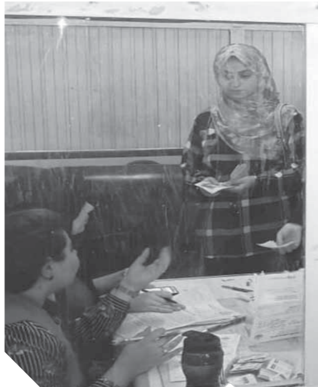
فحص إحدى الطالبات بالمبادرة الرئاسية

صرح الدكتور هشام شوقي مسعود، وكيل وزارة الصحة بالشرقية، بأن فرق المبادرة الرئاسية للفتح على فيروس سي حملة ١٠٠ مليون صحة بالمحافظة، قامت بإجراء المسح الطبي لطبئة القرية الأولى بجامعة الزقازيق أمس لعدد ٢٦٨ طالباً، وذلك بعد بلوغهم سن ١٨ سنة وإدراج أسمائهم على الميسمين الخاص بالمبادرة الرئاسية ضمن المستهدفين. ولفت وكيل الوزارة إلى أن إجمالى من تم فحصهم من الطلاب بلغ ٢١٩٩٠ طالباً جامعياً حتى الآن من خلال عدد ٦ فرق طبية بكلية التجارة، ومستشفى الطب، وكلية الطب البيطرى، تم تحويل ٣٦ حالة لمستشفى الأحرار التعليمى لإجراء تحليل الحمض النووى (PCR) كتحقق تأكيدى بعد الفحص السريع، ويبلغ عدد الطلبة المستهدفين بالمحافظة ٣٤٨٠٠ طالب، حيث يستمر العمل بالجامعة حتى يوم ١٧ أكتوبر الجارى.