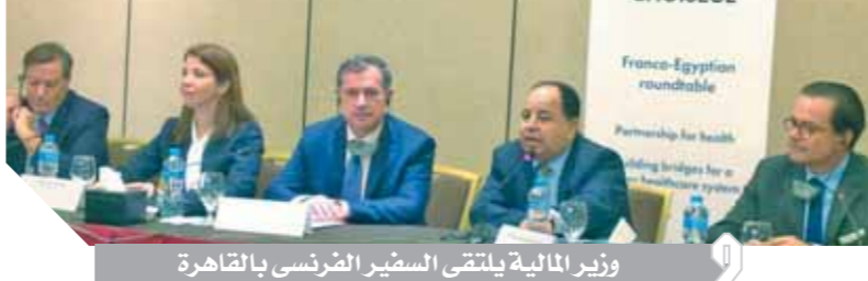
وزير المالية يلتقي السفير الفرنسي بالقاهرة