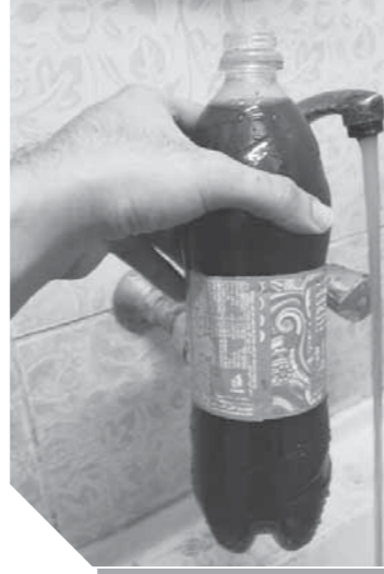
زجاجة سوداء تم تعبئتها من صنوبر المياه