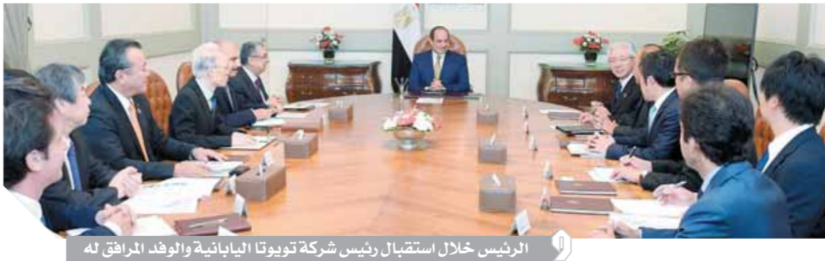
الرئيس خلال استقبال رئيس شركة تويوتا اليابانية والوفد المرافق له