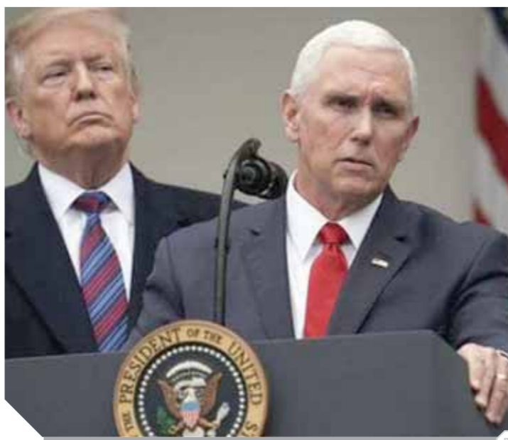
«الخزينة الأمريكية، تعرض عقوبات على تركيا

وتابع: «أنا جاهز تماماً لتدمير الاقتصاد التركي وبسرعة إذا استمر القادة الأتراك في السير على هذا النهج الخطير والدمر». وفيما يتعلق بالعملية التركية في سوريا، أوضح ترامب أنه «على تركيا أن تعطي أولوية لحماية المدنيين، وخصوصاً الأقليات الإثنية والدينية»، مضيفاً: «سنسحب قواتنا