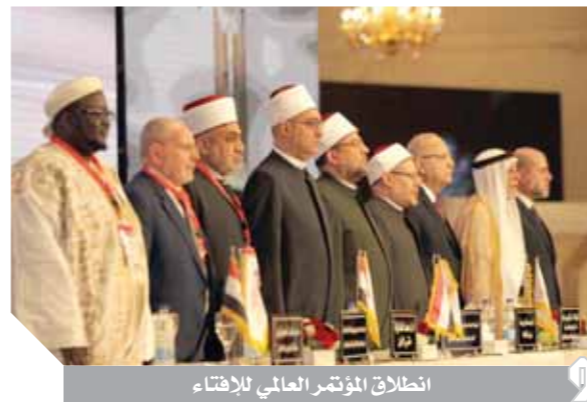
انطلاق المؤتمر العالمي للإفتاء