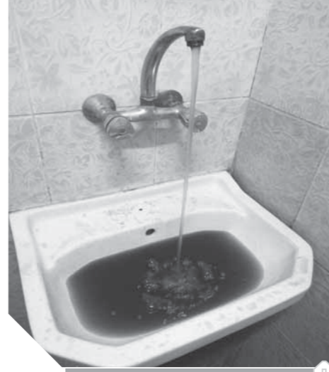
المياه سوداء وتحوي كل التلوث