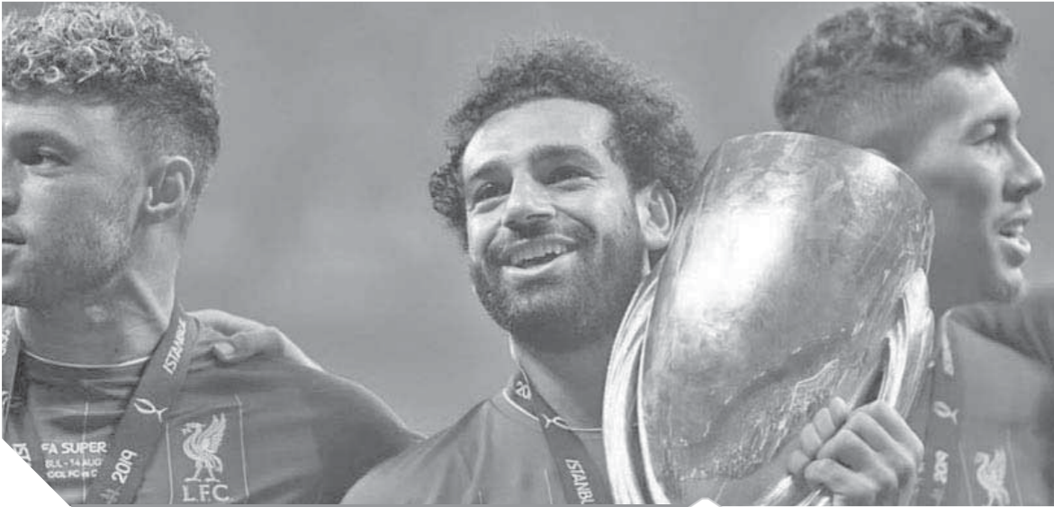
صلاح يحمل كأس السوبر