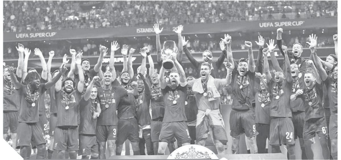
فرحة كبيرة للاعبى ليفربول بعد الفوز بالسوبر الأوروبى