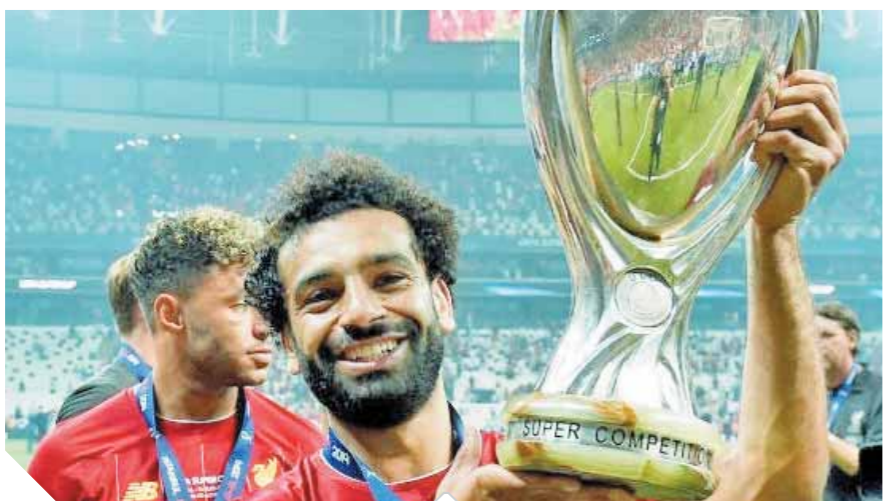
صلاح يحتفل بكأس السوبر

وصلت الصحف العالمية الضوء على السوبر الأوروبى، وتحت عنوان «صلاح الخطير وكيبا المقدس»، أشادت صحيفة «ميرور» البريطانية بالمستوى الذى ظهر عليه النجم المصرى، ووصفته بالخبرة بعدما هدد دفاع السيتى طوال الـ١٢٠ دقيقة حيث كاد يسجل هدفاً فى المباراة لولا تألق الحارس الإسباني كيبا الذى أنقذ تشيلسى من الحسارة فى أكثر من مرة، وجاء عنوان صحيفة «ديلى ميل»: «أدريان البطل»، مشيرة إلى أنه قاد فريقه للفوز بالسوبر الأوروبى للمرة الرابعة فى تاريخ الريدز حيث تصدى لركلة الجزاء الخامسة.