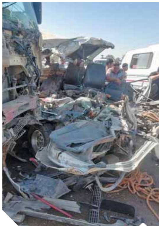
بقايا السيارات في حادث التصادم