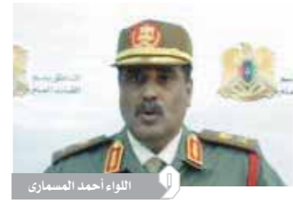
اللواء أحمد المسماوي

أعلن اللواء أحمد المسماوي، الناطق الرسمي باسم الجيش الوطني الليبي، أن سلاح الجو الليبي استهدف طائرات تركية مسيرة داخل مطار مدينة زوارة غربي البلاد. وقال المسماوي، في بيان صحفى إنه بعد جمع المعلومات عن حركة الطائرات التركية المسيرة تأكد أنها تستعمل هتفريين داخل مطار زوارة، مشيراً إلى أن «طائرات سلاح الجو العرعى الليبي قامت صباح أمس بضرب الهتفريين وتسويتها بالأرض وتم قتادى ضرب مهبط وصالة الركاب في المطار». وأضاف البيان أن «هذه رسالة إنذار لأي مكان