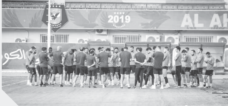
الأهلي يختتم تدريباته لمواجهة بيراميدز

ووعد محمود الخطيب رئيس النادي بصرف مكافآت مجزية لتحفيز اللاعبين لحصد الثنائية المحلية، وتحقيق لقب الكأس بجانب بطولة الدوري الممتاز التي حصدتها الأهلي.