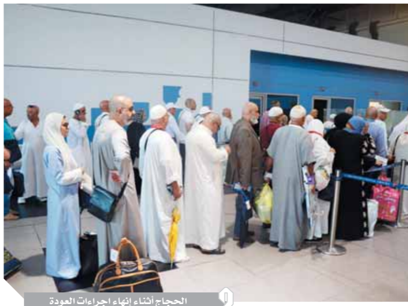
الحجاج أثناء إنهاء إجراءات العودة