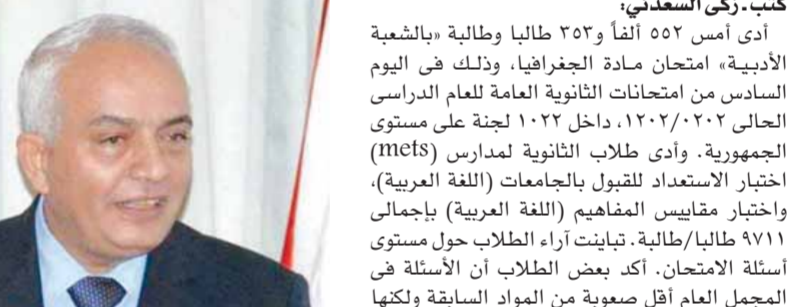
كتب - زكي السعدني،

أدى أمس ٥٥٢ ألفاً و ٣٥٢ طالباً وطالبة «بالشعبة الأدبية» امتحان مادة الجغرافيا، وذلك في اليوم السادس من امتحانات الثانوية العامة للعام الدراسي الحالي ٢٠٢١/٢٠٢٢، داخل لجنة على مستوى الجمهورية. وأدى طلاب الثانوية لمدارس (mels) اختبار الاستعداد للتبول بالجامعات (اللغة العربية)، واختبار مقاييس المفاهيم (اللغة العربية) بإجمالي ٩٧١١ طالبا/طالبة. تبيننت آراء الطلاب حول مستوى أسئلة الامتحان. أكد بعض الطلاب أن الأسئلة في المجمع العام أقل صعوبة من المواد السابقة ولكنها تضمنت بعض المحتوى من الكتب الدراسية، ووصف البعض الآخر الأسئلة بأنها تتضمن جزئيات صعبة وتحتاج إلى وقت طويل للتفكير في الحل المطلوب، واستمرت شكوى الطلاب من ضيق الوقت ووجود الإجابات المتشابهة في الاختبارات. وحرص الدكتور رضا حجازي نائب الوزير لشؤون المعلمين ونائب رئيس عام الامتحان على متابعة سير عمليات الامتحانات في غرفة العمليات المركزية بالوزارة، والتواصل مع مديري المديريات التعليمية؛ للتأكيد على ضرورة تطبيق المركزى بوزارة التربية والتعليم عدة ملاحظات، حيث رصد فريق مكافحة الغش الإلكتروني (٣٣) حالة.