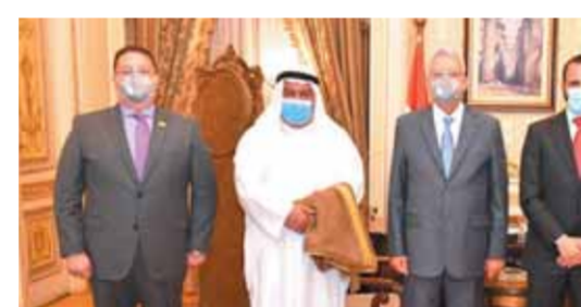
كتب - حازم العبيدي،

استقبل المستشار الدكتور حنفي جبالى رئيس مجلس النواب بمقر المجلس أمس الخميس مرزوق الغانم رئيس مجلس الأمة الكويتي، رحب المستشار الدكتور حنفي جبالى بمرزوق الغانم ضيفاً عزيزاً ومصرياً، واصفاً تلك الزيارة بالتاريخية، وتثري العلاقات الودية والودية بين مصر والكويت متعلماً لتعزيز التعاون البرلماني والتنسيق في المحافل الإقليمية والدولية خدمة للقضايا العربية. أعرب الغانم عن جزيل شكره وتقديره لحفاوة الاستقبال التي لاقاه منذ بدء الزيارة، وهدم التهئة إلى المستشار الدكتور حنفي جبالى على توليه رئاسة مجلس النواب، مشيراً إلى أن الدماء المصرية الكويتية امتزجتاً تصيداً للعلاقات الأخوية بين البلدين الشقيقين واصفاً الدور المصري البرلماني. عقب اللقاء عقدا الجانبان مؤتمراً صحفياً أكد فيه عمق ورسوخ العلاقات المصرية - الكويتية في كافة المجالات وعلى كافة الأصعدة خاصة على الصعيد البرلماني.