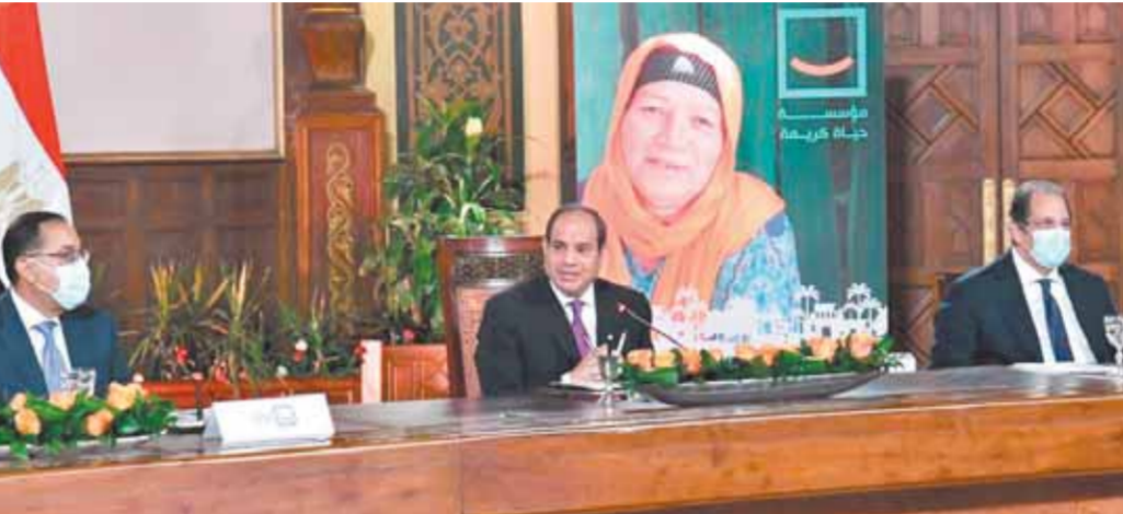
«السيسى» خلال اجتماعه مع مجموعة رجال الأعمال المشاركين في مبادرة «حياة كريمة» ، ويجواره الدكتور مصطفى مديولى واللواء عباس كامل

وقد أعرب الرئيس عن تقديره لسادة الحضور من رجال الأعمال على مساهماتهم وجهودهم المجتمعية في مشروع «حياة كريمة» في إطار تحقيق التنمية الاقتصادية والاجتماعية في مصر، موضحاً سيادته أن هذا المشروع سيمثل نقلة نوعية كبيرة لمصر ويفتح آفاق الاعتماد على مستلزمات الإنتاج المحلي، ومن ثم تطوير قطاع الصناعة والأعمال الذي يعد بمثابة المستقبل التنموي لمصر.