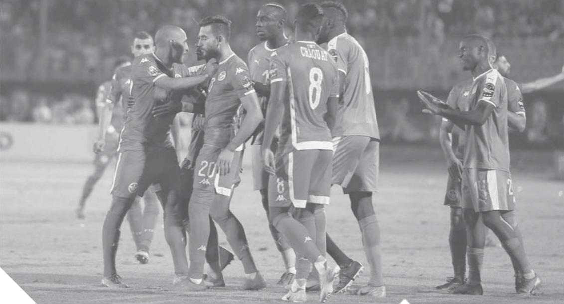
لاعبو تونس في حالة غضب شديد بعد المباراة

سيطرت حالة من الحزن الشديد على الجماهير التونسية بعد الخروج المرير والدراماتيكي لتونس قرطاج أمام السنغال من دور الأربعة في كأس الأمم الإفريقية بعد أن كان منتخب تونس يراوده حلم التتويج القاري الغائب منذ عام ٢٠٠٤. وخسر المنتخب التونسي على يد السنغال بهدف نظيف في دور الأربعة سيناويو دراماتيكي بعد أن أضاع نسور قرطاج ضربة جزاء في الدقيقة ٧٥ عن طريق فرجاني ساسي، ثم تصدى الحارس معز حسن لضربة جزاء سنغالية عن طريق هنري سافيه، ثم سجل المنتخب السنغالي هدف الفوز في الوقت الإضافي بضربة رأس. ويناقش الاتحاد التونسي لكرة القدم مصير المدرب الفرنسي الآن جيريس المدير الفني للتونس بعد ضياع حلم التتويج، وتتجه التنية لتجديد الثقة في خدماته رغم الانتقادات التي تعرض لها في بداية المهمة، خاصة أن الفريق لم يظهر بأفضل مستوياته قبل الخروج. وتعرض بعض نجوم المنتخب التونسي لانتقادات حادة بسبب إهدار الفرص على رأسهم فرجاني ساسي الذي أضاع ضربة جزاء مهمة بجانب يوسف المسالك الذي قدم مستويات هزيلة بجانب طه الخنيسي الذي فشل في استغلال انفراد محقق، ووجهت وسائل الإعلام التونسية انتقادات لنظام حكم الفيديو المساعد (فار)، عقب خسارة المنتخب التونسي أمام نظيره السنغالي بهدف نظيف بدور الأربعة من بطولة كأس الأمم الإفريقية. وأعلن الحكم الإثيوبي باملاك تيسيما عن