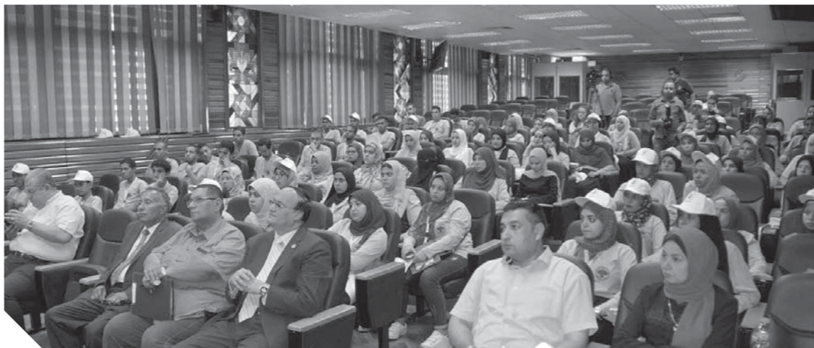
جانب من أساتذة وطلاب جامعة القاهرة فى برنامج معسكر قادة المستقبل