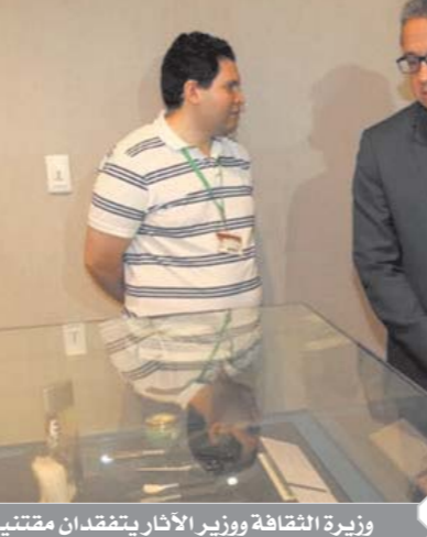
جانب من متحف نجيب محفوظ