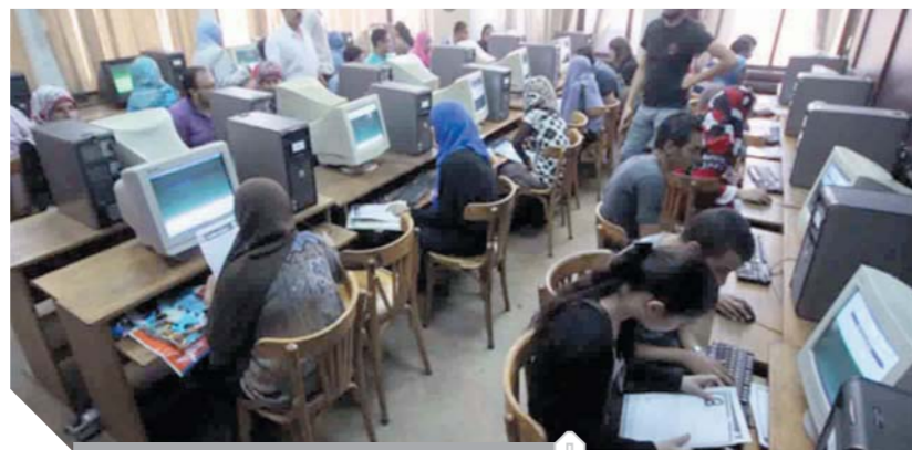
الطلاب خلال تسجيل رغبتهم عبر الإنترنت

ارتفاعاً حاداً في شرائح مجاميع الدرجات الحاصل عليها الطلاب، وارتفعت شرائح المجاميع العليا التي تبدأ من ٩٥٪ إلى ١٠٠٪ وتؤهل الحاصلين عليها للالتحاق بكليات القمة التي تشمل الطب والصيدلة وطب الأسنان والعلاج الطبيعي والبتروك والهندسة والتخطيط العمراني، وصلت نسبة الارتفاع في هذه الشرائح إلى ١٧.٢٧٪ مقابل ١٠.٩٨٪ بفارق ٦.٢٧٪ عن العام الماضي ما سيؤدي إلى ارتفاع الحد الأدنى لكليات الطب وطب الأسنان والعلاج الطبيعي والصيدلة، ومن المتوقع أن يصل الحد الأدنى لكليات الطب إلى ٩٩٪ والأسنان ٩٨.٥٪ والصيدلة ٩٨٪ والعلاج الطبيعي ٩٧.٥٪ والهندسة ٩٢٪، وارتفعت شرائح المجموع من ٩٠٪ إلى أقل من ٩٥٪ إلى ٩٠.٥٪ مقابل ١٦.٨١٪ العام الماضي بزيادة قدرها ٢.٢٤٪، وانخفضت الشرائح من ٨٥٪ إلى أقل من ٩٠٪ إلى ١٦.٨٠٪ مقابل ١٦.٩٢٪ العام الماضي.