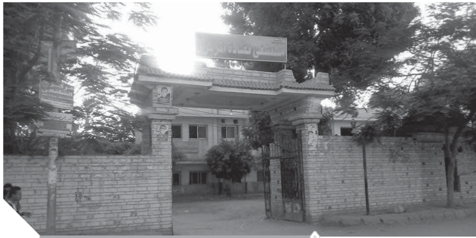
مستشفى نقادة ينتظر الإحلال والتجديد

نقل مستشفى نقادة المتهاكل في نظر المسؤولين ليس بغرض التتمية وإنما بغرض استهلاك مرضى وموظفين وأطباء. وطالب أهالي مدينة نقادة، الدكتورة هالة زايد وزيرة الصحة واللواء عبدالحاميد الهجان، محافظ قنا، بضرورة إعادة تشغيل مستشفى المركز مرة أخرى لرفع المعاناة عن