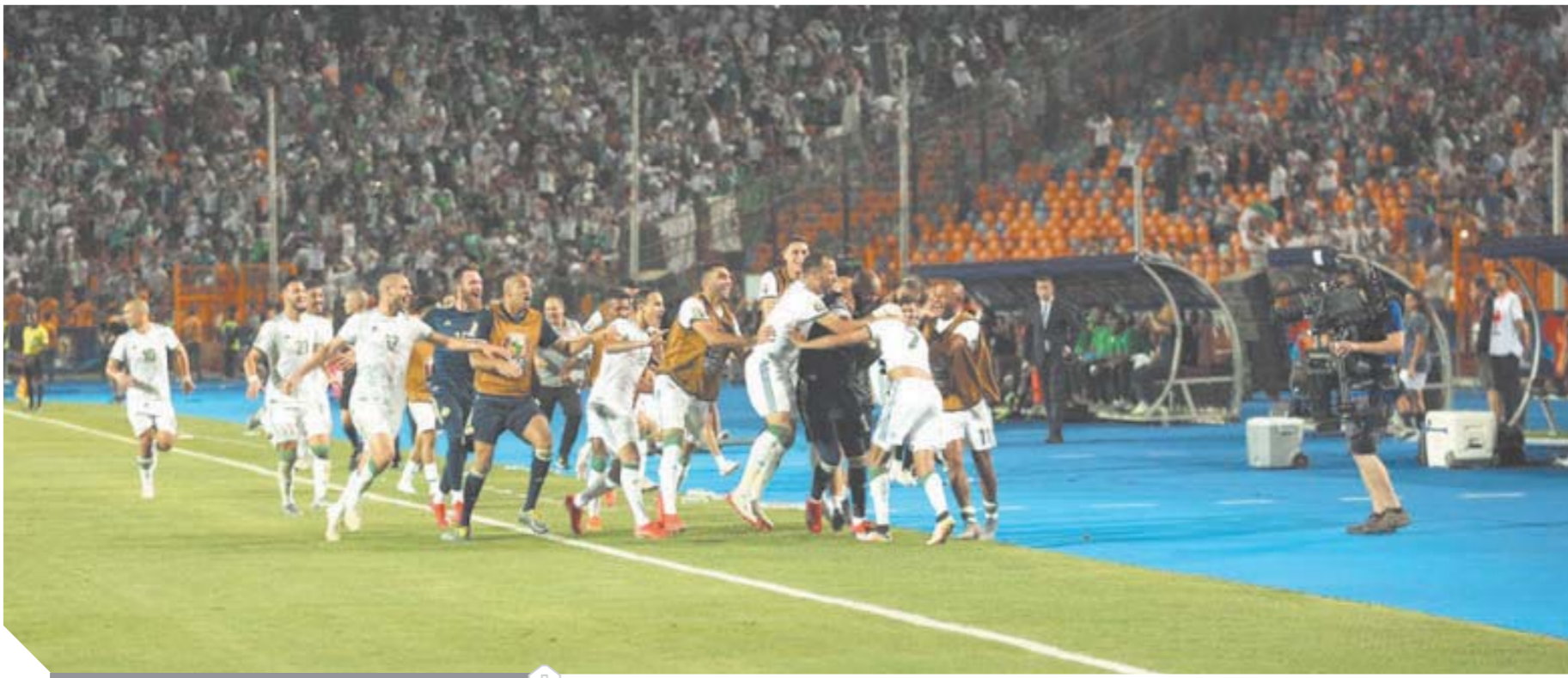
فرحة فريق الجزائر بالهدف الثاني

الجزائر ترسم ملحمة التأهل للنهائي بهتاف: «الشعب يريد كأس إفريقيا»