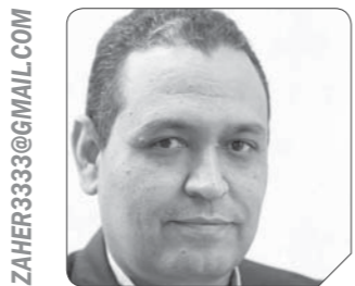
بقلم: كاظم فاضل

القوية بما يضمن له مستقبلاً أفضل، وتم فتح باب الأسئلة للطلاب وقد دارت حول: طبيعة المؤامرات الخارجية ضد مصر، وضد الوطن كله، على غرار ليبيا وسوريا واليمن والعراق، والتخطيط الأجنبى لإسقاط دول وحكومات ومؤسسات، وكانت العين على مصر، فهى عمود الخيمة، ومقبرة الغزاة، وقد حفظها الله لأنها- لا سمح الله- لو سقطت لسقطت الأمة كلها، ولكن الله حماها وحامى الأمة بقوة جيشها الوطنى الذى لا يعرف الفرقة ولا التقسيم، وهو سند قوى للشعب والدولة معاً، وسند أقوى لبناء الدولة الحديثة، وسلاحنا الوطنى فى مواجهة المؤامرات هو التسليح بالوعى والقدرة على التفكير والنقد ومواجهة الغزو الفكرى، ومواجهة حروب الجيل الرابع التى تتم بالوكالة والريمووت كنترول عبر حرب الشائعات والإجهاط والتثييس وحروب التشكيك فى مصداقية المشروعات الوطنية