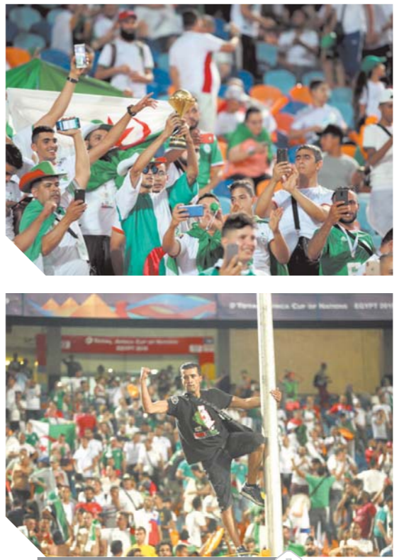
فرحة جمهور الجزائر

الروح القتالية تقود الخضر لإسقاط نيجيريا.. و«بلاماضي» يقهر المنتقدين فرنسا تعلن الطوارئ قبل موقعة السنغال.. و«بن صالح» يهنئ المنتخب