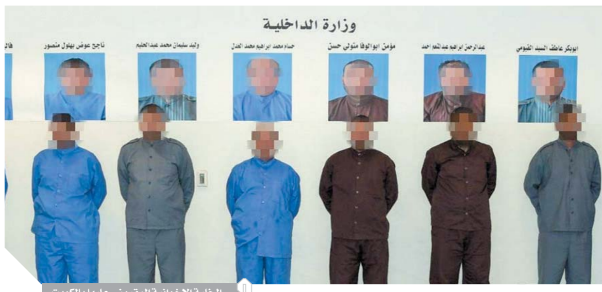
الخلية الإخوانية المقبوض عليها بالكويت