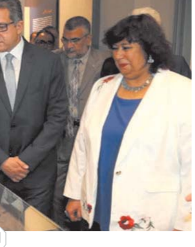
جانب من متحف نجيب محفوظ