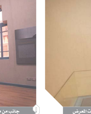
جانب من متحف نجيب محفوظ