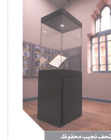
جانب من متحف نجيب محفوظ