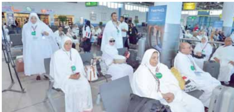
تقديم كل التسهيلات داخل الصالة الموسمية للحج ومبنى الركاب ٢