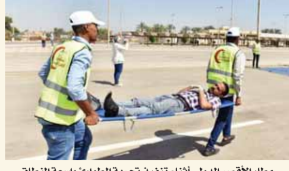
مطار الأقصر الدولي أثناء تنفيذ تجربة الطوارئ واسعة النطاق

في إطار الالتزام برفع كفاءة المطارات المصرية والالتزام بتنفيذ كافة توصيات سلطة الطيران المدني والمنظمة الدولية للطيران المدني (الآيكاو) - أخرى مطار الأقصر الدولي تجربة طوارئ واسعة النطاق full scale exer- CISC سيناريو حريق بمنطقة انتظار السيارات والموتور على قنينة بالمنطقة المتفرقة لأماكن انتظار الجمهور. حيث تم إطلاق سارينة الطوارئ من قبل برج المراقبة الجوية وتم تداول البلاغ من مركز عمليات المطار الثالث في المطار، وبحضور الجهات الخارجية المختصة، وعلى الفور تمت الاستجابة في وقت قياسي في قوات الإطفاء والإنقاذ، حيث توجه مركز القيادة المتحرك لقيادة الحادث وتفعيل مخطط سريان البلاغ لاستدعاء جميع العناصر الدعم الداخلي من المطار، وكذا الدعم الخارجى من قبل محافظة الأقصر لتزويد بسيارات إسعاف وإملاء، مع غلق الحاور المرورية المؤدية إلى المستشفيات مع تجهيز مستشفيات الأقصر لاستقبال حالات الإصابات والوفيات.