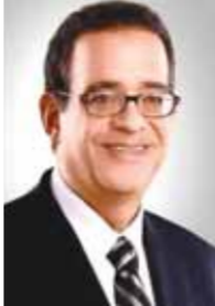
بقلم: طارق عبد العزيز