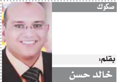
بقلم: خالد حسن