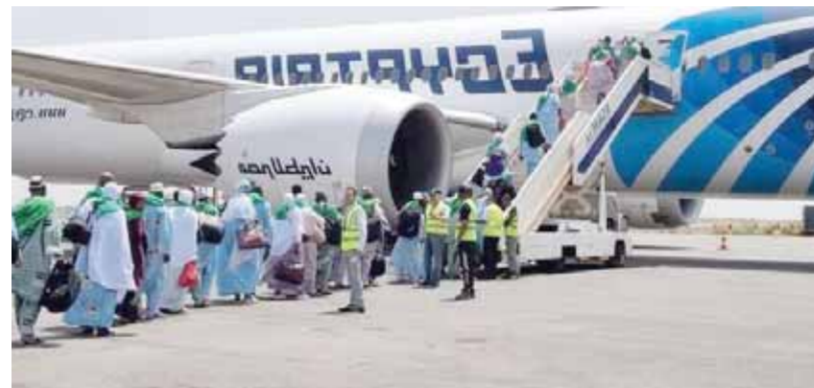
حجاج بيت الله الحرام خلال سفرهم إلى الأراضي المقدسة