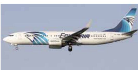
طائرات مصر للطيران تنطلق ثلاث دول إفريقية يوليو المقبل

أعلنت شركة مصر للطيران الناقل الوطني لجمهورية مصر العربية عن تدشين خطوط جديدة داخل القارة السمراء خلال شهر يوليو القادم، وهي مقديشو عاصمة الصومال وأبيدجان عاصمة كوت ديفوار وكذلك خط إلى جيبوتي. حيث من المخطط تسير رحلات جوية إلى العاصمة الإفريقية أبيدجان اعتباراً من 9 يوليو القادم بواقع ثلاث رحلات أسبوعياً أيام الأحد والأربعاء والجمعة، ومن المخطط أن تسير مصر للطيران رحلات جوية تربط بين جيبوتي ومقديشو ابتداءً من 11 يوليو وحتى نهاية الجدول الصيفي بمدل رحلتين أسبوعياً بخط سير (القاهرة - جيبوتي - مقديشو - جيبوتي - القاهرة).