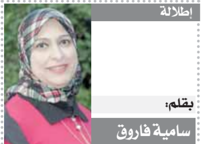
بقلم: سامية فاروق

ويفضل المدافع الجزائري خوض تجربة الاحتراف فى أوروبا، بعد حصوله على عرض من سانت ترند