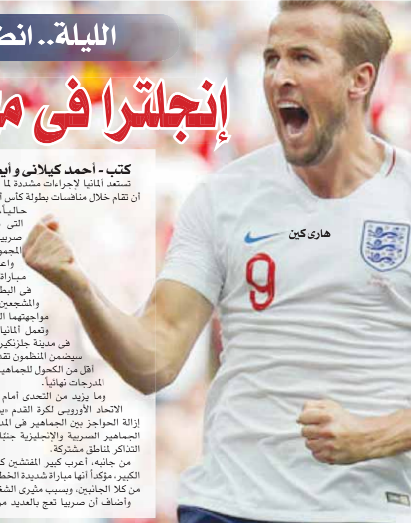
بقلم: خالد حسن

وقد أصبح رمز الحماة رمزًا لمحافظة المنوفية، ويوجد بمدخل المحافظة على الطريق الزراعي، محافظة المنوفية الأسبق