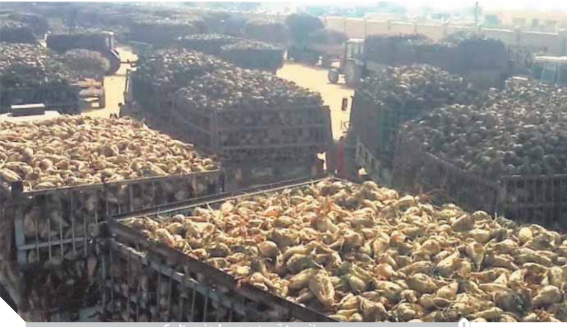
جانب من توريد محصول بنجر السكر