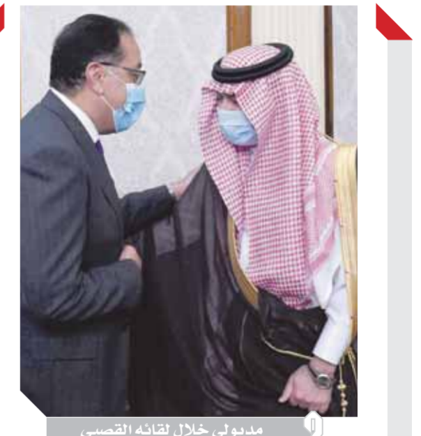
مديولي خلال لقائه القصبي

وزير التجارة السعودي: جئنا لنقول لكم معكم قلباً وقلبا في جميع المجالات «مديولي»: نواجه بحسم أي إجراءات بيروقراطية تعطل الاستثمار