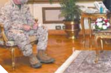
وزير الدفاع خلال لقائه قائد القيادة المركزية الأمريكية

وأضاف «الحصرى»، لماذا نصدّر أزمات للرئيس «السيسى»، لازم ندرس القرار أولاً، ونشوف البديل الأول، أما تصدير الأزمات فهو أمر غير سموح به».