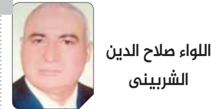
حنان أبوالضياء تكتب: