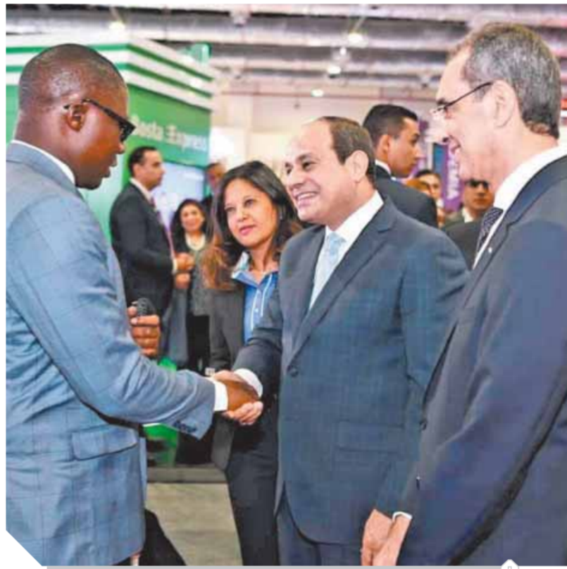
الرئيس السيسي وزير الاتصالات في أحد المعارض

انتهت وزارة الاتصالات من ربط أكثر من ٧٥ قاعدة بيانات حكومية ببعضها بالتعاون مع هيئة الرقابة الإدارية في إطار تنفيذ المشروع