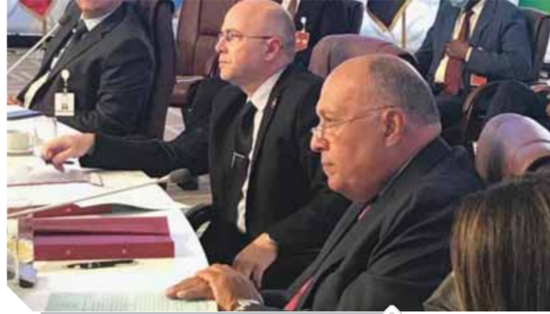
شكري خلال الاجتماع الطارئ لوزراء الخارجية العرب

من العام على بدء الوساطة الإفريقية، إلا أنها لم تسفر بعد، وللأسف الشديد، عن النتائج المرجوة، ولا يتحمل اللوم في ذلك من قاموا عليها، فمصر تقدر الجهود التي بذلتها جنوب إفريقيا والكونغو الديمقراطية. وتابع «شكري» قائلاً: تعرض صيرنا لاختبارات عدة، وفي كل مرة أثبتت مصر أنها الطرف الذي يتصرف بمسؤولية ومن منطلق إدراك مسبق بتبعات تصعيد التوتر على أمن واستقرار المنطقة، ومن ثم فإن مصر مصرة على استفاد كافة الحلول الدبلوماسية، الأمر الذي دعانا ونحن هنا لتعرض الأمر على أشقائنا العرب، طالبين منهم الدعم للمسعى المصري السوداني العادل. وأكد «شكري» أن مصر تعرض هذه القضية الوجودية على المجلس الوزاري لجامعة الدول العربية من منطلق تأثر الأمن القومي العربي بهذه القضية، ولا ينبغي أن يُفهم هذا باعتباره محاولة