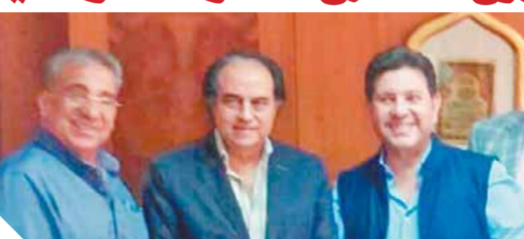
الفنان هاني شاكر وعادل المصري خلال الاجتماع

في هذا النشاط والمجال رغم وجود كورونا، واتخذت منصة ضخمة لإقامة هذه الفعاليات والمهرجانات والمناسبات المتعددة والمتخلفة والمتنوعة بالخارج، وبالتالي ضاعت الملايين من العملة الصعبة إلى الاقتصاد المصري من جراء وقف هذا النشاط، وأكد رئيس غرفة المنشآت والمطاعم السياحية، أهمية مد فترة العمل إلى الساعة الثالثة صباحاً بالمنشآت والمساحات المرخصة لها، وكذلك زيادة أعداد الفرقة الموسيقية التي تعمل بالمنشآت السياحية والمعاصرة والفن الغنائية، مع الالتزام بالاعتدال والحفاظ على التدابير الاحترازية، مطالباً بإعادة النظر في إغلاق هذا النشاط، ومطالب عادل المصري بضرورة وضع السياحة الترفيهية والمنوعات في مكانها الذي تستحقه لمئاتها من أهمية ما يمكنها أن تحقق أرباحاً سياحية أخرى بما فيها الشاطئية، مشيراً إلى أنها - السياحة الترفيهية - في حد ذاتها تعتمد في الأساس على السائحون ذوي الإنفاق المرتفع الراغبين في التمتع ومتابعة نجومهم وحفلاتهم، وأن مصر تتمتع بأنها تضم وتحتضن أكبر الفنانين في عالمنا العربي، ويعيش كل نجوم الفن في العالم، ويحمل كل منهم بالوقوف بالناء أمام الأهرامات و المناطق السياحية المصرية ذات الصيت العالمي.