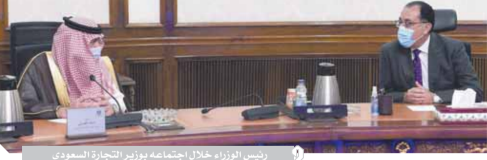
رئيس الوزراء خلال اجتماعه بوزير التجارة السعودى