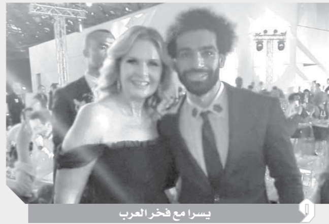
يسرا مع فخر العرب

صورة للتجم المصري مع أعضاء فرقة مسرح مصر، وعلق عليها كاتبًا: «كل سنة وأنت طيب وعقبال مليون سنة يا أحسن لعيب في العالم، وإن شاء الله أهداف».