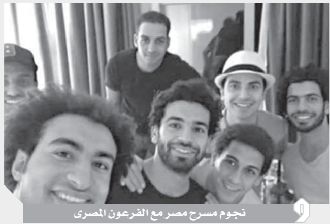
نجوم مسرح مصر مع الفرعون المصري

كما هنا الاتحاد الأريقي لكرة القدم «الكاف» محمد صلاح بعيد ميلاده الـ ٢٨ حيث نشر عبر حسابه بموقع تويتر فيديو خلال مشاركته مع