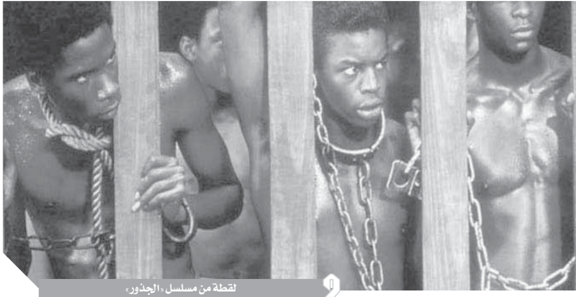
لقطة من مسلسل «الجدور»

ما زالت صرخاته تملأ الوجدان، نسمة كما ذكر مسلسل الجدور، Roots Generations، الذى عرفه المشاهدون العرب خصوصاً باسم «كونتا كينيتي»، وفى قصة تروى