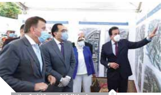
مديولى خلال تفقده مستشفى كورونا