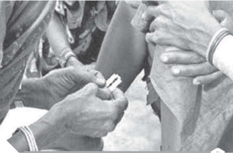
القضاء على الختان قضية مجتمعية