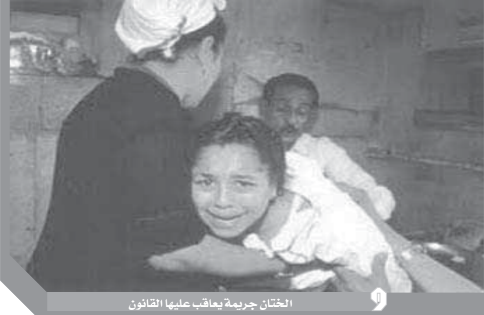
الختان جريمة يعاقب عليها القانون

رغم تأكيد علماء الدين أن ختان الإناث ليس فرضاً دينياً، وتأكيد الأطباء أنه خطر على الصحة النفسية والصحة العامة للمختنطات، وتأكيد خبراء الاجتماع أن عفة البنات لا علاقة لها بالختان، وأن «الأمأن مش في الختان».. ورغم أن منظمات المرأة في مصر أعلنت الحرب على الختان منذ ٣١ عاماً واختارت منذ عام ٢٠٠٢ يوم ٤١ يونيو من كل عام يوماً وطنياً مناهضة الختان.. ورغم كل ذلك لا يزال هناك من يصر على تمزيق جسد بناته بختانهم. ومن الصدف العجيبة أن يشهد يونيو الجاري، واقعة باغاة القسوة في مركز جيهينة بمحافظة سوهاج ضحاياها ٣ صغيرات أعمارهن ما بين ٨ و ١١ عاماً، وثلاثتهن خدعن والدهن مدعيًا أنه سيحلب لهن طبيًا لتطعيمهن ضد كورونا.. وببراءة طلبت الصغيرات الثلاث من الأب أن يسرع باستدعاء الطبيب الذي سيحميهن من أفياب كورونا التي تهدد الجميع.