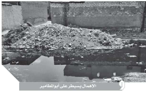
الإهمال يسيطر على أبوالطامير