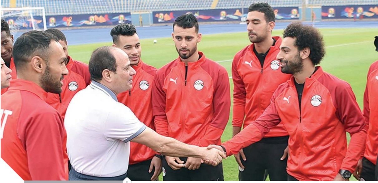
الرئيس يصافح محمد صلاح