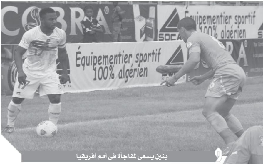
بنين يسعى لتفاجأة في أمم أفريقيا