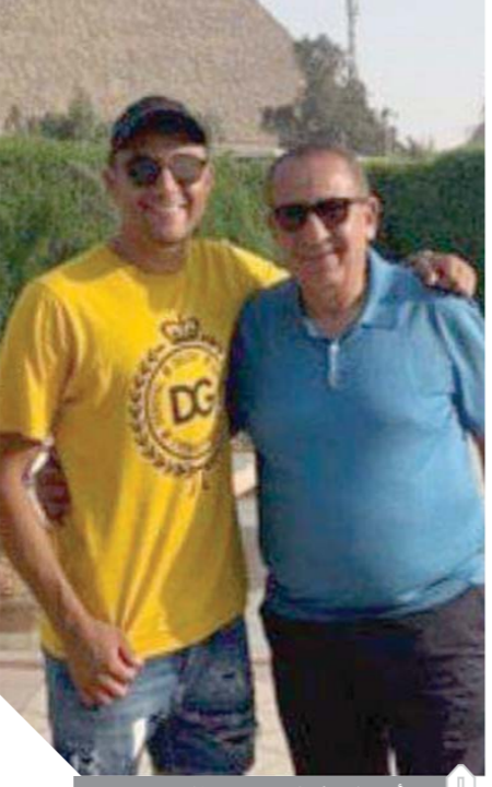
أبوعلی وكيلور نجم ريال مدريد

ويؤكد ذلك ما تناوله الصحف والمجلات العالمية عن زيارة «صلاح»، وتصدرت صورة أغلفة المجلات العالمية بنشر صورة وهو يصطاد السمك، فكتب مجلة «كينج جوردن» العالمية تعليقاً على صورة «صلاح»، مع السمكة الكبيرة بأن نجم لفريرول يستمتع بإجازة بعد الإنجاز الكبير وحمله كأس بطولة أوروبا، وتابعت المجلة قائلة: «نجح صلاح في اصطياد حراس المرمى ونجح أيضاً في اصطياد السمك، كما تقول المجلة إن «صلاح» لديه إمكانيات كبيرة في الصيد إلى جانب الكرة. ونشر صور محمد صلاح على أغلفة الصحف والمجلات وهو يستقل مركباً وسط البحر الأحمر ويصطاد السمك، ترويج كبير للمقصد السياحي المصري وتنطقة البحر الأحمر. وأيضاً قيام كيلور نايفاس، حارس مرمى ريال مدريد الإسباني هو وأسرته بالتقاط الصور في الأهرامات والمتحف المصري وخان الخليلي والفردفة وسهل حشيش وقيامه بنشرها على مواقع التواصل الاجتماعي حيث يتابعه على «فيس بوك» أكثر من ٦ ملايين شخص وأكثر من ٢٠ مليون على «انستجرام»، ترويج للسياحة المصرية وخلال تواجد بالفردفة على ماريña «البياتروس» وسهل حشيش التقط أيضاً عدداً من الصور وقام بنشرها على مواقع التواصل الاجتماعي، ووجه الدعوة لأصدقائه وجماهيره بالسفر والاستمتاع بزيارة مصر والبحر الأحمر، وهو ما يجعل المتابعين للاعبين العالميين يكونون حريصين على زيارة الأماكن التي زارها نجومهم المفضلون والاستمتاع بها وهو ما يعد دعابة وترويجاً للسياحة المصرية ويؤكد ذلك تلقى فنادق البحر الأحمر اتصالات من السياح الإنجليز للاستفسار عن رحلات صيد السمك بعد نشر «صلاح» صورة وهو يصطاد السمك.