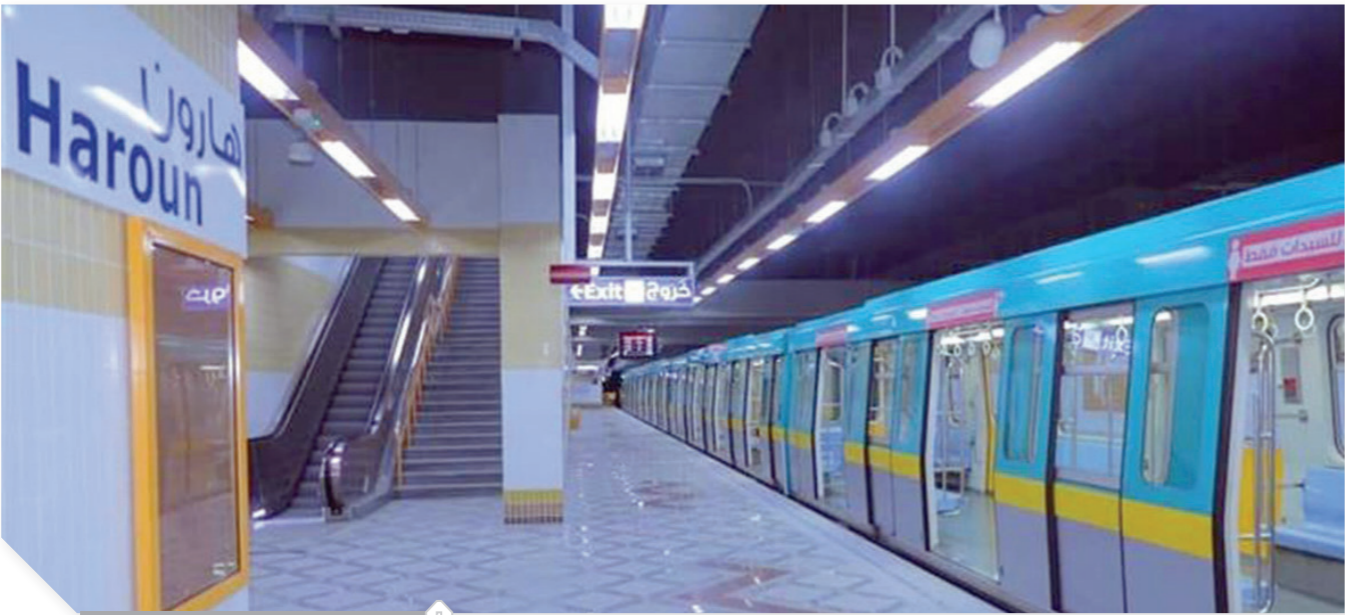
محطة هارون، بالخبط الثالث

تخفيض تصل ٩٠٪ على أن تكون بعدد ١٨٠ رحلة خلال الثلاثة أشهر أيهما أقرب. وأكدت الوزارة أن الخط الثالث بالكامل مصمم على الطراز الأوروبي وكافة محطاته وقطاراته مكيفة الهواء وخالية من التلوث ويتوافر بها سلالم متحركة ومصاعد كهربائية لكبار السن وشاشات عرض إلكترونية لمواعيد قدوم القطارات، وأن خدمة المترو تتميز بالسرعة، حيث تستغرق المسافة من محطة العتبة إلى محطة الأهرام ١٧ دقيقة وحتى محطة نادي الشمس تستغرق ٢٥ دقيقة. وانطلق أمس الأول قطار لمترو الأنفاق بالخبط الثالث بمحطات هارون ونادي الشمس والأف مسكن بعد بدء تشغيلها التجريبي للركاب.