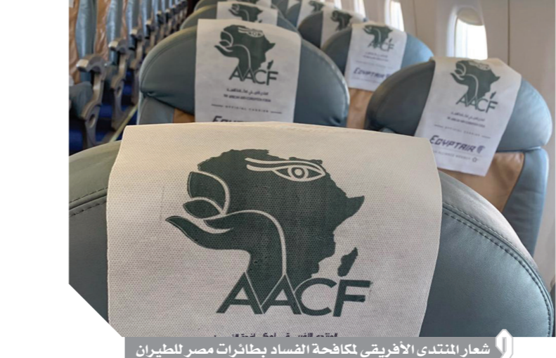
شعار المنتدى الأفريقى لمكافحة الفساد بطائرات مصر للطيران

الشيخ حيث قامت الشركة بتسيير رحلات إضافية بخلاف رحلاتها المنتظمة لنقل ضيوف المنتدى، هذا بالإضافة إلى تقديم كافة التسهيلات لإنهاء إجراءات السفر الخاصة بضيوف الحدث فى سهولة ويسر سواء فى مرحلة الذهاب أو العودة. هذا وقد قامت الشركة بتزيين طائراتها بشعار المؤتمر على Head Rest التي يتم وضعها على مقاعد الطائرات وتوزيع الشيكولاتة المغلفة بذات الشعار على متن رحلات الشركة طوال فترة انعقاد المنتدى. كما تم تخصيص جناح دعائى لمصر للطيران حيث يمكن لضيوف المنتدى تغيير حجوزاتهم أو إصدار تذاكرهم أو أى إجراءات أخرى من مقر المنتدى فضلاً عن تقديم أحدث العروض الخاصة ببرنامج المسافر الدائم. كتب - أمانى سلامة: تشارك مصر للطيران، الناقل الوطنى لجمهورية مصر العربية والعضو الحادى والعشرين فى تحالف ستار العالى، كتاقل رسمى للوفود الأفريقية والضيوف المشاركة فى المنتدى الأفريقى لمكافحة الفساد، تاتى هذه المشاركة من منطلق الدور الريادى التي تتمتع به الشركة الوطنية فى القارة الأفريقية تحت مظلة وزارة الطيران المدني برئاسة الفريق بونس المصرى. هذا ويشارك فى هذا الحدث الذى تنظمه هيئة الرقابة الإدارية، نحو ٥١ دولة أفريقية من بينهم المغرب والجزائر وتونس وأنجولا وبوركينا فاسو وغيرها من الدول. وقد حرصت الشركة على تسيير جسرهما الجوى لنقل السادة ضيوف المنتدى من القاهرة إلى شرم