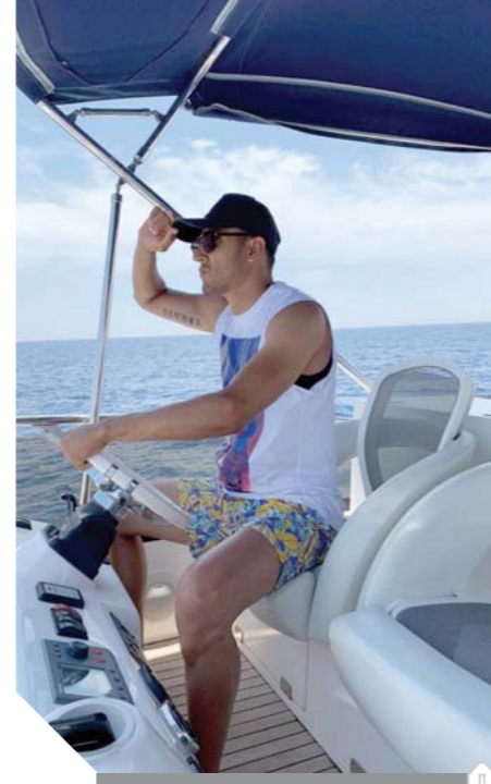
حارس مرمى ريال مدريد