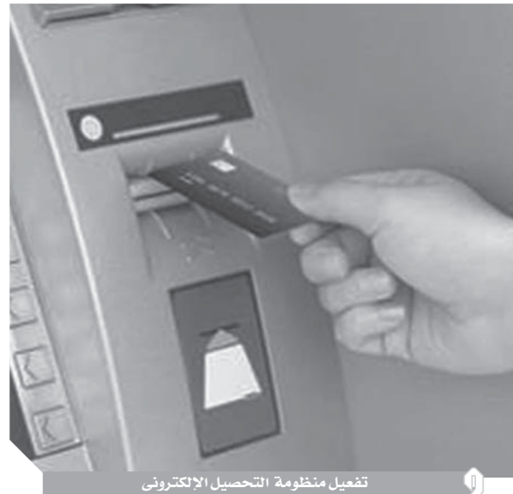
تفعيل منظومة التحصيل الإلكتروني

الدفع والتحويل الإلكتروني، وهو ما يحقق نقلة نوعية في سرعة وسهولة إنجاز الخدمات، ويعاقب بفرصة لا تقل عن ٢٪ ولا تزيد على ١٠٪ من قيمة المبلغ المدفوع نقداً، ولا يتجاوز مليون جنيه، لكل من خالف أحكام المواد (٣) و(٤) و(٦) من هذا القانون، كما يعاقب بذات العقوبة كل من قام بتجزئة المدفوعات. وتضاعف الغرامة