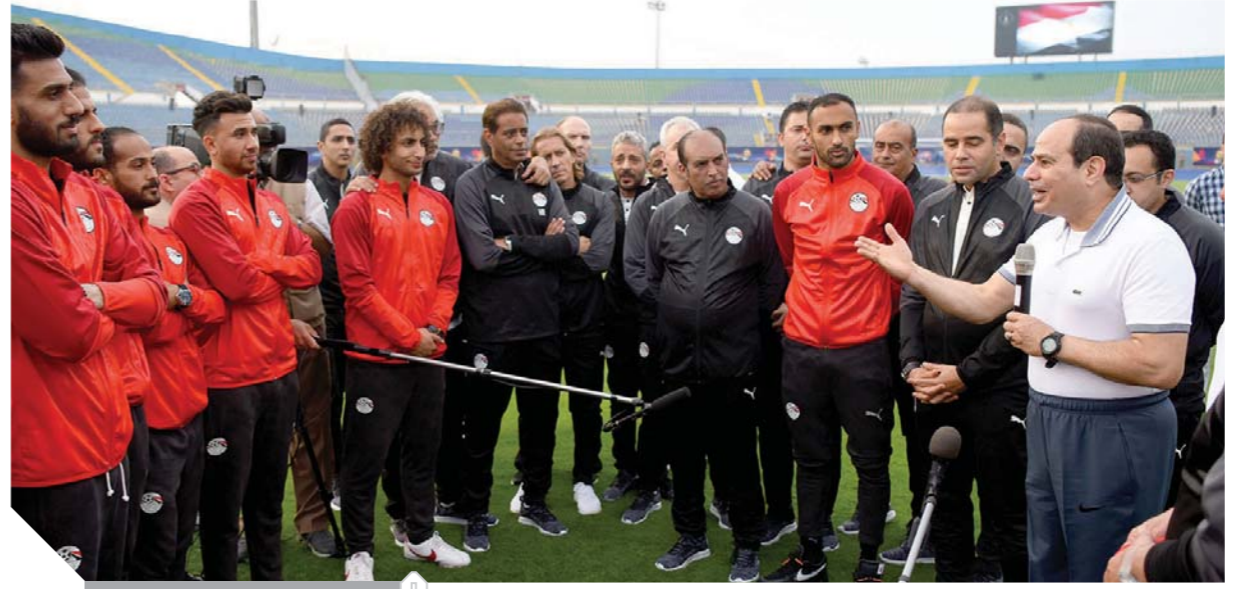
السيسى يوجه كلمة للمنتخب