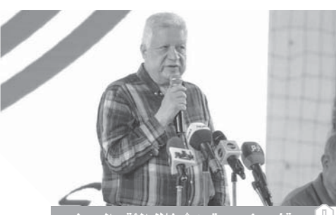
مرتضى منصور يتحدث خلال المؤتمر الصحفى