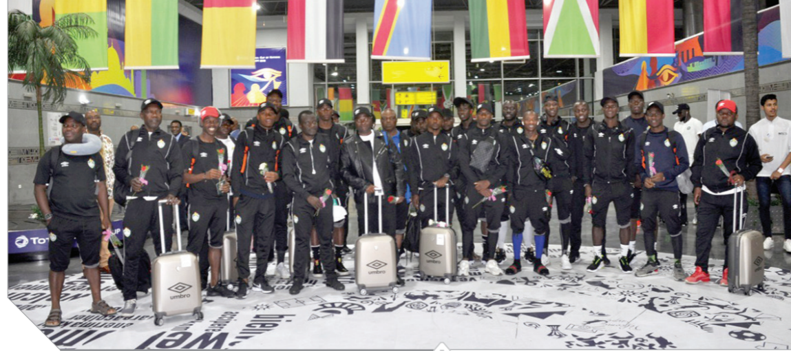
الفرق المشاركة لدى وصولهم صالة كأس الأمم الأفريقية

وأوتوبيسات الخدمات الأرضية وتم تخصيص عدد مجلة حورس على الطائرات هذا الشهر للإعلان عن استعدادات البطولة وتوزيع هدايا تذكارية وشيكولاته على الجماهير القادمة لمجازرة منتخبهم، فضلا عن تخصيص كاونترات ولافتات دعائية بمطار القاهرة للمشاركين في البطولة الأفريقية. جدير بالذكر أن نادي إيروسبورت الرياضى التابع لوزارة الطيران المدني سيمتضيف تدريبات منتخب جنوب أفريقيا المشارك بالمجموعة الرابعة التي سوف تقام على استاد السلام حيث تم تجهيز ملعب كرة القدم الرئيسي بالنادي ومبنى النادي الصحى وصالة الجيمنازيوم.