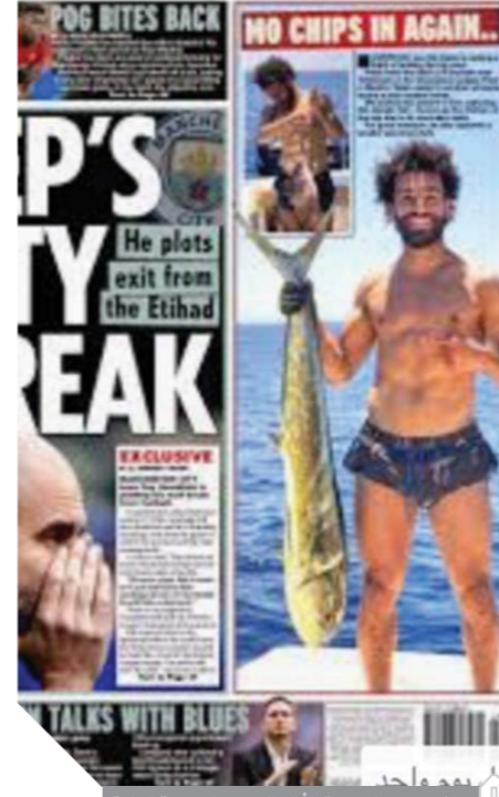
صلاح يتصدر الصفحات الأولى للصحف الرياضية العالمية