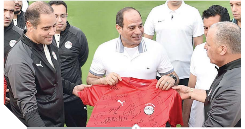
الرئيس يتسلم، فائزة، المنتخب

كتب - ناصر عبدالمجيد: قام الرئيس عبدالفتاح السيسى أمس بزيارة المنتخب الوطنى لكرة القدم خلال تدريباته باستاد الدفاع الجوي، بحضور الدكتور أشرف صبحى وزير الشباب والرياضة. وصرح السفير بسام راضى، المتحدث الرسمى باسم رئاسة الجمهورية، بأن السيسى التقى بأعضاء المنتخب الوطنى المشارك فى بطولة كأس الأمم الإفريقية المقبلة لكرة القدم التى ستستضيفها مصر انطلاقاً من شهر يونيو الجارى، حيث أعرب خلال اللقاء عن خالص أمنياته بالتوفيق والنجاح للمنتخب فى البطولة، مؤكداً ثقته الكاملة