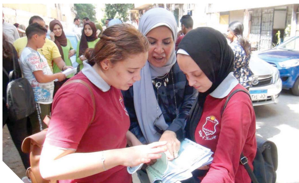
طالبتان تراجعان مادة، الاستاتيكا، بعد الامتحان

طلاب الثانوية العامة سعداء بمستوى امتحان «الإستاتيكا»