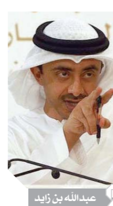
عبدالله بن زايد

كتب - صلاح صيام: تصدت القوات اليمنية المشتركة بمديرية التحيتا فى الحديدة لأكبر محاولات تسلل لميليشيات الحوثي نحو منطقتى الجبلية والفازة جنوب وغربى المديرية، وأدى تصدى القوات اليمنية المشتركة للمسلحين الحوثيين إلى مقتل وجرح العشرات، بينهم القيادى الحوثى محمد على الشرفين، الذى قتل فى هذه العملية. وتأتى محاولات الميليشيات الحوثية اليانسة لقطع خطوط الإمداد من الخط الساحلى وتكثيف استعداداتها داخل مدينة الحديدة، ضمن ترتيبات متسارعة للانقضاض على اتفاق السويد. قالت القوات اليمنية المشتركة: إن وحدات استطلاعها رصدت خلال الساعات الماضية تحركات مسلحة