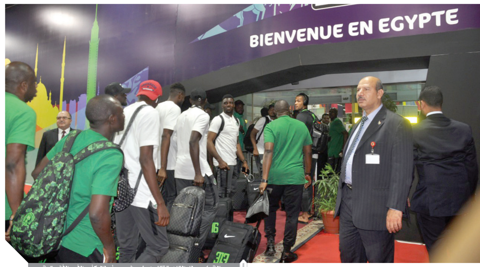
صالة ٤، مطار القاهرة تترزين بضيوف مصر أبطال كأس الأمم الأفريقية