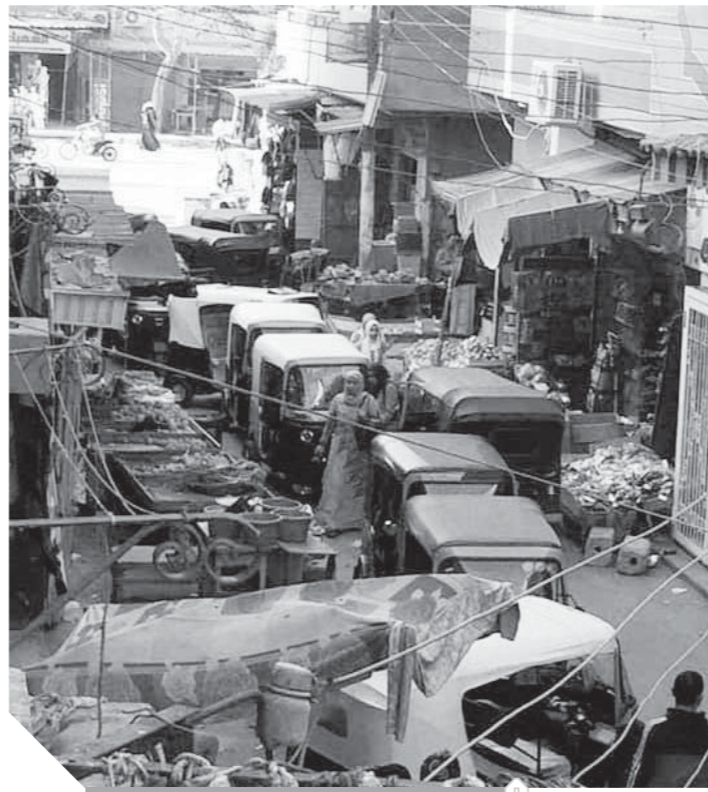
العشوائية تضرب القنطرة غرب