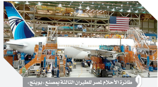
طائرة الأحلام لمصر للطيران الثالثة بمصنع بوينج.

قال Ekene Okpareke محلل تسويق شركة بوينج العالمية إن عائلة البوينج B787 وخاصة طراز B787-٩ الذي تعاقبت مصر للطيران على شراء ٦ طائرات منه هو الأكثر مبيعاً ورواجاً في شتة حول العالم، وأضاف أن شركة بوينج تعاقبت على تلبية ٤٤٤ طلب شراء حتى الآن من طراز B787-٩ ويتم تنفيذ ١٥٥٤ رحلة يوميا لطائرات الديرمالينر المختلفة بمعدل إقلاع طائرة كل دقيقة، حيث