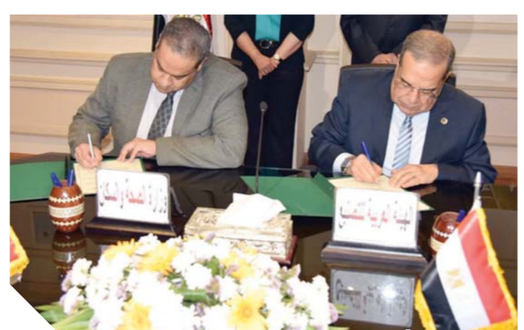
توقيع بروتوكول تعاون بين الصحة والعربية للتصنيع

وأشادت وزيرة الصحة بمجهودات الهيئة العربية للتصنيع لزيادة نسب التصنيع المحلي بالصناعات الطبية وتميزها بالدقة والالتزام في مواعيد التسليم وخدمة ما بعد البيع والتي تضاهي معايير الجودة العالمية. ووفقاً لجوانب البروتوكول، أوضح الفريق عبدالممنع الترأس رئيس الهيئة العربية للتصنيع أن الهيئة تساهم في مكونات التصنيع بنسبة كبيرة على أن تعاطف نسبة المكون المحلي خلال السنوات المقبلة، مضيفاً أن الهيئة تحرص على المشاركة في دعم كافة مبادرات رئيس الجمهورية للرعاية الصحية في إطار المشروع القومي لمصر ٢٠٣٠.