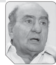
المستشار محمد حامد الجمل