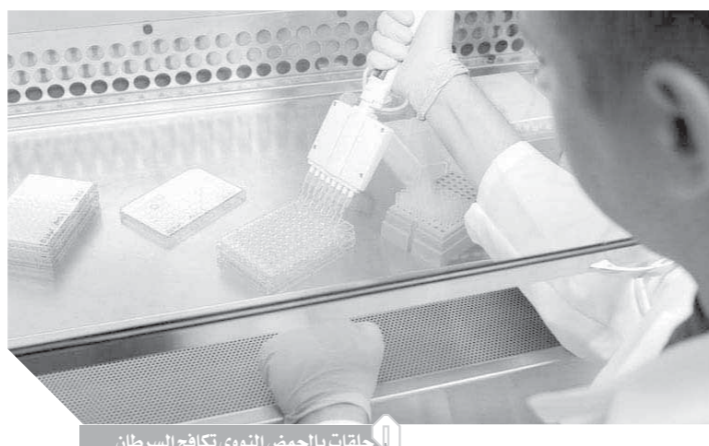
حلقات بالحمض النووي تكافح السرطان

عبر هذه الحلقة، مما يضمن حصول الخلايا على العدد الصحيح من الصبغيات في النهاية. عن سكاى نيوز