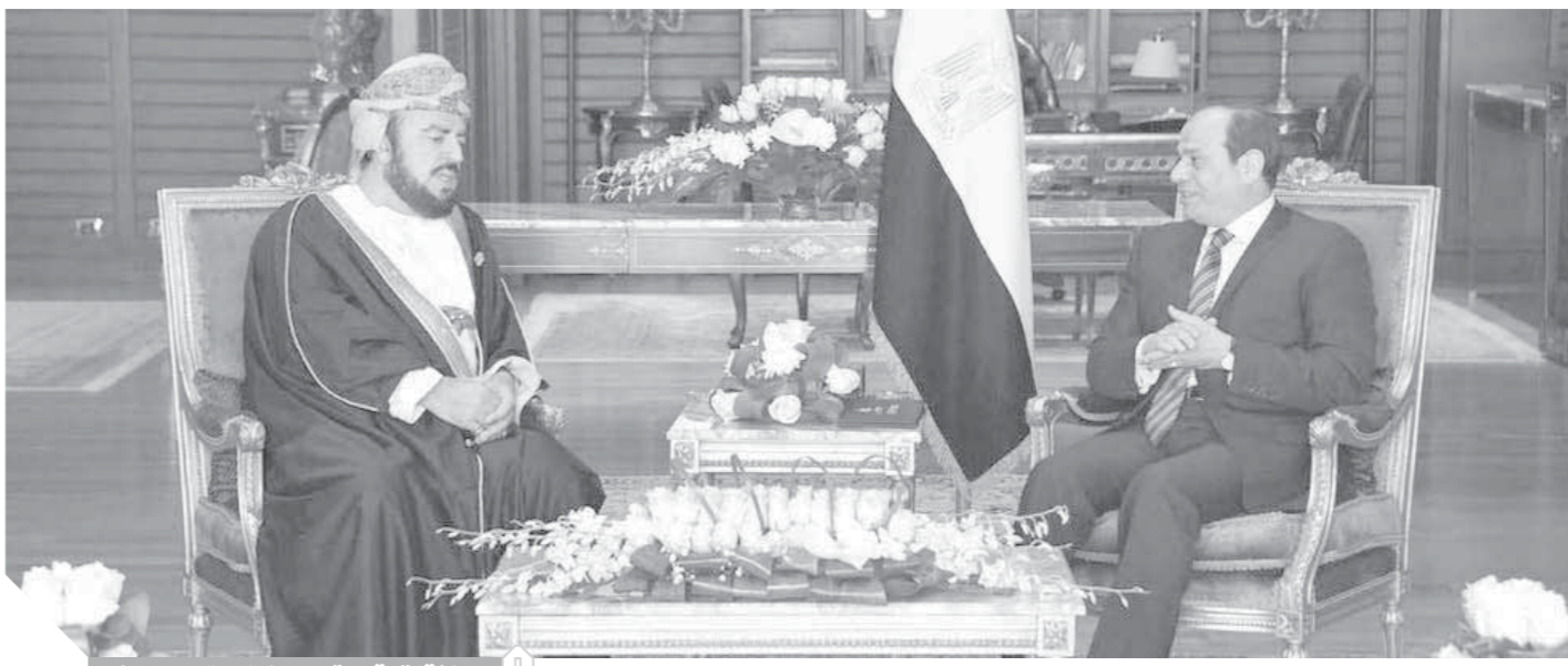
تعاون مستمر بين عمان وبريطانيا