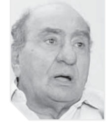
المستشار محمد حامد الجميل