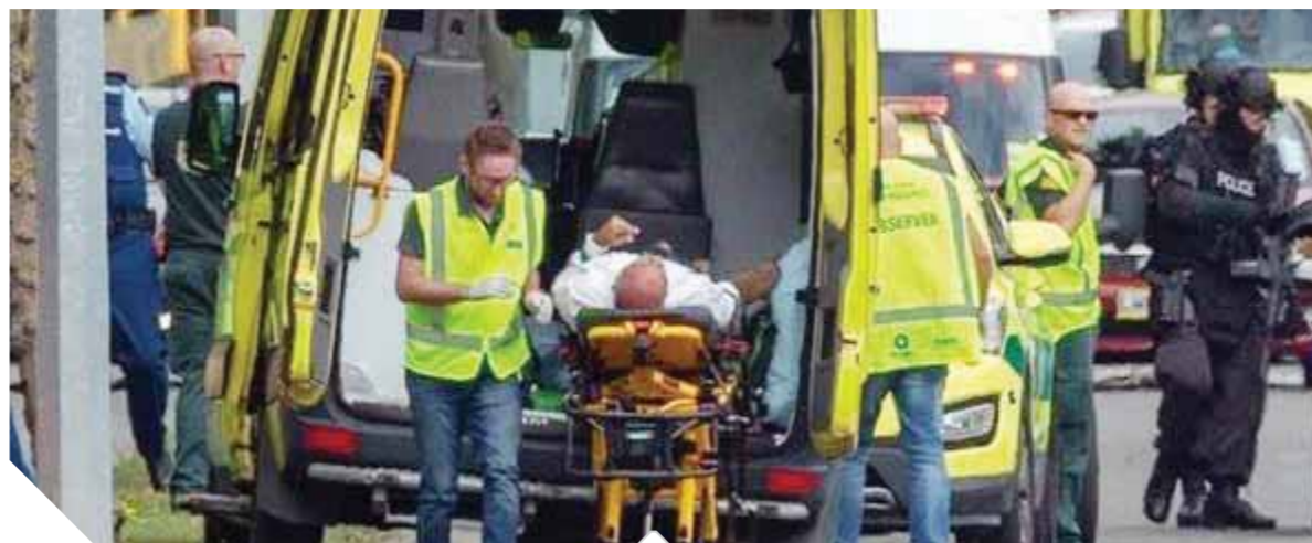
سيارات الإسعاف تنقل المصابين

الحادث، ونعى الدكتور أسامة الأزهرى مستشار رئيس الجمهورية للشؤون الدينية شهداء الحادث الإرهابي في نيوزيلندا قاتلاً إن الإرهاب في أي مكان في العالم جرم لا يغتفر ولا بد من التضامن مع كل الأديان. وأدى المصلون صلاة الغائب في جامع الأزهر أمس على أرواح شهداء وضحايا