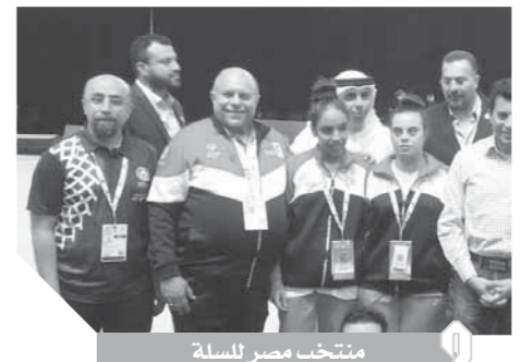
منتخب مصر للسلة

ويرغب «زيدان» فى تحسين موقف الفريق فى الدورى، حيث يحتل المركز الثالث، مع اقترابه من النهاية بعد 11 مباراة، وانزاع المركز الثانى من