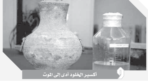
أكسير الخلود أدى إلى الموت

● من قديم الأزل والإنسان يبحث عن الخلود، الحياة الدائمة في قوة لا مرض فيها ولا موت ينهيها، ولكن الخلود للبشر أمر مستحيل، وفي الصين تحديداً تعددت وفيات كل من بحثوا عن الخلود، وهو ما كشفتته الشرطة مؤخراً، بكشف سر وفاة عدد من الباحثين بعد تناولهم جرعة دواء، كان يعتقد أنها تمنح الحياة الأبدية لكل من يشربها، وهو دواء أثري استخدمه قدماء الصين قبل ألفي عام يطلق عليه «أكسير الخلود» ولكن كل من عثر حديثاً على هذا الإكسير وتناوله، سار به إلى الموت سماً.