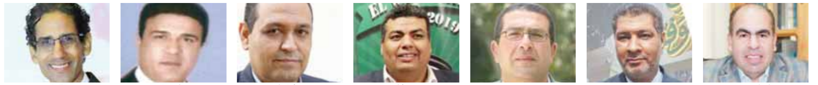
الهضبي سباق منصور فؤاد كاظم الصباح تهاى

انتهت لجنة الاحتفال بمئوية الوفد من إعداد الدعوات الخاصة بالاحتفال الكبير الذي ينظمه حزب الوفد يوم 22 مارس الجارى، بمناسبة ذكرى مئوية الحرب وثورة 1919. كما تم إعداد كشوف المعومين من أعضاء الوفد بالمحافظات. ووضعت اللجنة معايير وضوابط لاختيار المشاركين من اللجان النوعية ولجان الحزب في المحافظات. وأكد الدكتور ياسر الهضبي نائب رئيس الوفد المتحدث الرسمي للحزب، أن اللجنة عملت جاهدة على التنسيق الجيد لخروج الاحتفال بالصورة المناسبة التي تليق بمئوية الوفد، وموضحاً أن هذه الذكرى