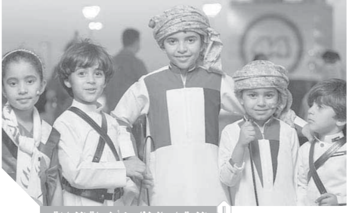
الاهتمام بالطفل من أولويات الإمارات

حققتها الدولة في مختلف المجالات، واختتمت قائلة: «نرى المستقبل في عيون أطفالنا.. والإمارات تقدم نموذجاً عالمياً رائداً في رعايتهم وحماية حقوقهم، ونحن نتخلف بيوم الطفل الإماراتى لا بد لنا أن نتذكر دور الوالد المؤسس المنفور له بإذن الله تعالى الشيخ زايد بن سلطان آل نهيان، طيب الله ثراه، نستلهم من إرثه وسيرته العطرة الغير والدروس... وأذكر في هذه المناسبة مقولته التاريخية: «إن الطفل فلذة الكبد ونور العين... إبتسامته نضءه الدنيا علينا»، كما يجب أن نضع الجهود الحثيثة التي تقوم بها فاطمة بنت مبارك الكتنى «أم الإمارات» نصب أعيننا دائماً إذ لخصت سموها توجه الدولة تجاه الطفل بكلماتها: «إن الطفل الذى نستقبل به عصرنا جديداً هو مشروعنا الأكبر الذى توليه الدولة أعظم العناية، وتضعه في أولويات خططها المستقبلية... ومن هذا المنطلق، علينا أن نجعل ماد كفرننا ورويتنا وهدفنا نحو مستقبل مشرق، الاستثمار في أفضل دولة في العالم، وهو ما يعكس نهج الإمارات في الاستثمار في النشء باعتبار الأجيال الجديدة الثروة الحقيقية للمستقبل ومصدر القوة التي توجب إعداده على الوجه الأمثل لصفون الإنجازات والمكتسبات التي