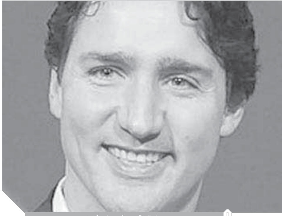
جاستين ترودو رئيس وزراء كندا

انهيار جليدي خلال رحلة تزلج، وتوازي ذلك مع دخوله لعالم السياسة، حيث انضم للحزب الليبرالي، ثم انتخب عضواً بمجلس النواب عام 2008. وأعيد انتخابه عام 2011، شغل مناصب في حكومة الظل التي شكلها الحزب الليبرالي، كناقد للتعددية الثقافية والهجرة، وغيرها مما يمس قضايا الشباب والجامعات، ليكرس توجهها سياسياً جديداً يعنى بالفئات العمرية التي يعتمد عليها الوطن في العمل والبناء، وهي فئات الشباب، وفي عام 2013، انتخب لزعامة الحزب الليبرالي الكندي، وعقب فوز الحزب الليبرالي الكندي بأغلبية ساحقة في الانتخابات الفيدرالية 19 أكتوبر 2015، أصبح ترودو رئيساً لوزراء البلاد وعمره 44 عاماً. من أبرز سماته الشخصية سعيه الدائم للعمل الاجتماعي والشبابي، حيث شجع جهود الإغاثة الكندية بعد زلزال هايتي عام 2010، وسعى لإجراءات هجرة أكثر سهولة من هايتي إلى كندا في أوقات الأزمات، كما شارك في مباراة ملاكمة خيرية باسم «قاتلوا من أجل العلاج» ضد عضو مجلس الشيوخ من حزب المحافظين، ونجح من خلال سياسته في تحسين الوضع الاقتصادي في بلاده وفي خفض الدين المحلي، وله مواقف سياسية خارجية داعمة لضحايا الصراعات الأهلية والعرقية، منها دعمه لأهالي دارفور. تزوج ترودو من صديقة طفولته صوفي غريغوار عام 2008، فقد كانت زوجته زميلة شقيقة الأصغر ميشيل، وعندما أصبح شاباً عاود الاتصال بها، ورزق منها بثلاثة أبناء، ولدين وبنت، وبعد توليه منصب رئاسة الوزراء باع منزله الذي كان يقيم به في مونتريال، واستأجر منزلاً في الحي الذي كان يقيم كطفل خلال فترة رئاسة وزراء والده، وكأنه يستمد قوته السياسية من الحي الذي تربى به في كنف والده السياسي المخضرم رئيس الوزراء الأسبق.