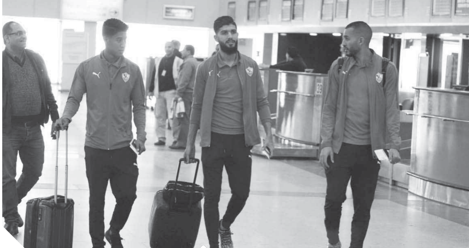
نجوم الزمالك فى المطار فى الطريق إلى الجزائر