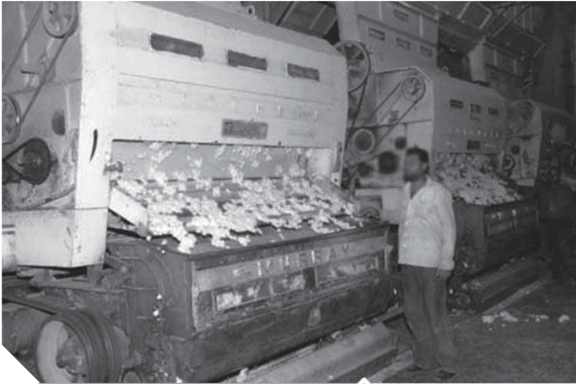
إنتاج محالج الفيوم المطور