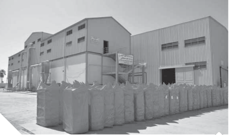
محالج الفيوم بعد التطوير

وهدجها بها ١٠ محالج جعلت من مدينة المحلة قلعة للنسيج على مدار عصور طويلة، وبمعالج الغربية بطنطا و٤ محالج بكفر الزيات ومحالج النيل ومحالج الدلتا ١ و٢، وهناك محالج النيل بزفتى و٤ محالج بمرزك ومدينه المحلة الكبرى وهم محالج النيل ٢، ١ ومحالج ومحالج مصر.