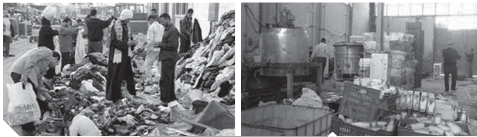
مصانع مجهولة المصدر تسبب في خسائر بالملايين