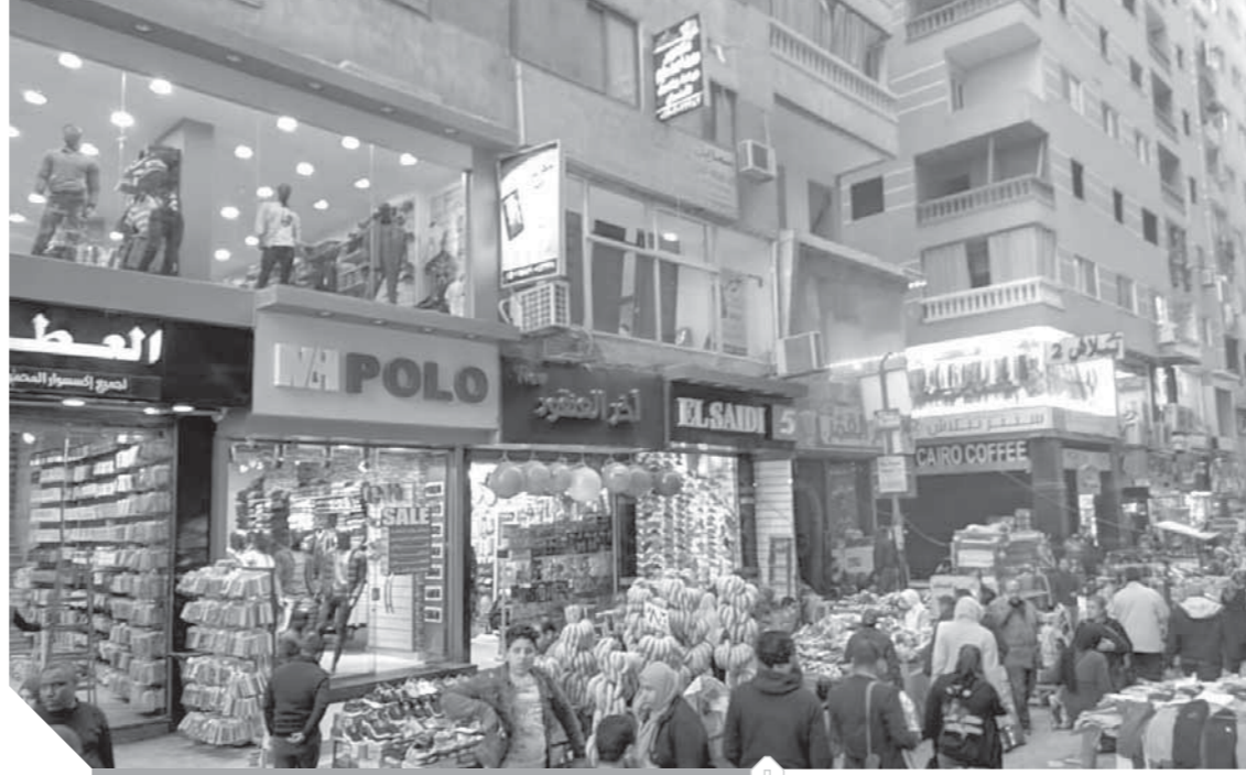
٥٠٪ تخفيضات والركود يضرب المحلات

تخفيضات حتى ٥٠٪.. رقابة مشددة على الأسواق.. وركود في المبيعات! حماية المستهلك يطارد المتلاعبين بالأسعار