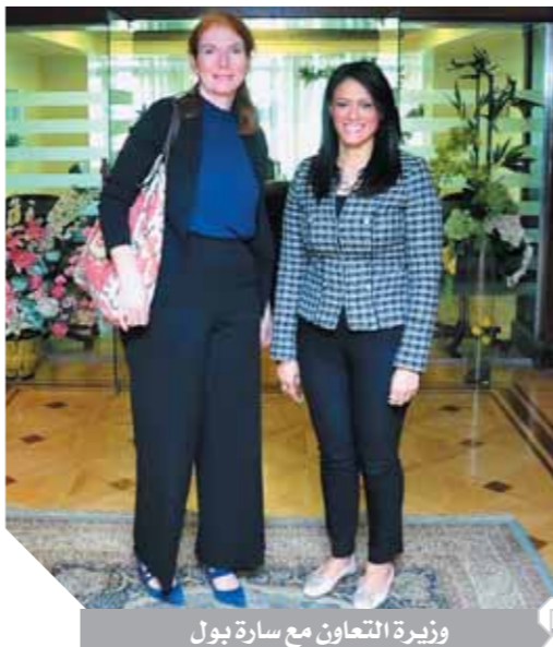
وزيرة التعاون مع سارة بول

قررت محكمة القضاء الإداري، حجز دعوى إلزام الحكومة المصرية بإتخاذ إجراءات التقاضي الدولي ضد تركيا، برد الأموال التي تحصلت عليها دون وجه حق تحت مسمى الجزية، التي كانت تسدها مصر للدولة العثمانية أثناء الاحتلال العثماني لمصر، لجلسة ١٨ أبريل للنطق بالحكم. قالت الدعوى: إن مصر طلت تدفع الجزية لمدة أربعين عامًا بدون وجه حق، واكتشفت هذا الخطأ في ستينيات القرن الماضي وقد سبق وطالبت الخارجية المصرية بتركيا برد تلك الأموال، ولكن المطالبة توقفت بدون سبب معروف. وطالبت بصفة مستعجلة مطالبة دولة تركيا برد الأموال التي تحصلت عليها من مصر تحت مسمى الجزية، وإصدار قرار بالتحفظ على الأموال المملوكة لدولة تركيا في مصر، وعدم تسليم ما تبقى من الوديعة التركية والتحفظ عليها.