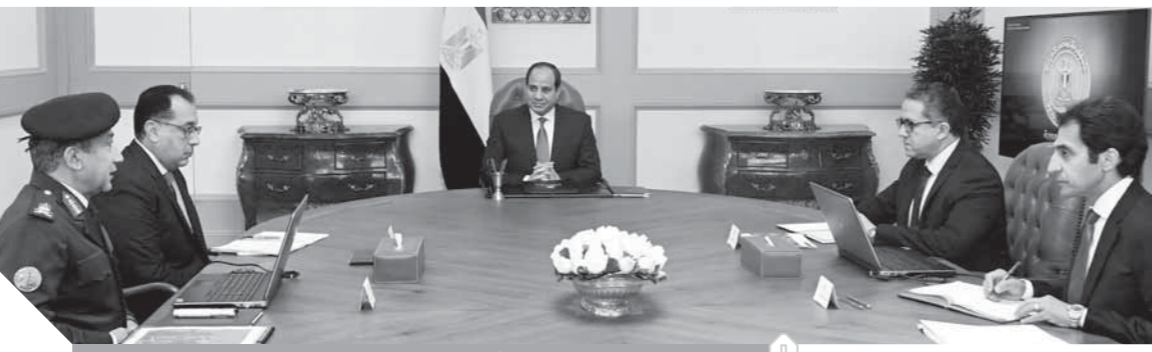
السيسى خلال متابعته الموقف التنفيذى لمشروع المتحف المصرى الكبير