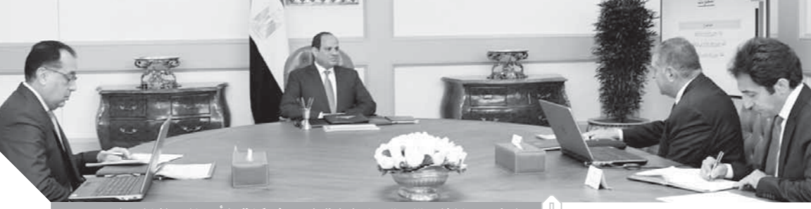
الرئيس خلال متابعته خطط تطوير شركات الأعمال والغزل والنسيج