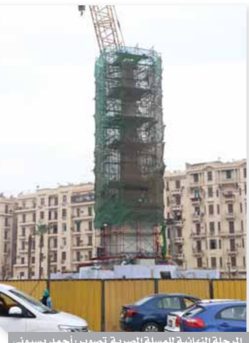
المرحلة النهائية للمسلة المصرية

وقدمت خلال الحفل عدداً كبيراً من أغانيها منها «أخاصمك أه، معجبة مفرمة، أه ونص، اطربط وادلع، الدنيا حلوة، بدنا نوع الجو، ماشى حدى، لون عيونك»، وغازلت المصريين بغناء أغنية «لو سألتك أنت مصري». وشارك النجم وائل جسر وقدم عدداً كبيراً من أغنيات الوداع والفرار، منها: مشيت خلاص، غريبة الناس، بتوحشيتنى، خلينى ذكرى، نهاية واحدة، واختم حفله بأغنية «نحب ليه»، وسط تفاعل الجمهور الحاضر. وشاركت ساندى بأحدث أغنيات ألبومها الأخير «ريموت حياتك»، وواصلت تقديم عدد من أغنياتها منها «حلو جداً»، «أحلى بنت»، والذي تفاعل معها الجمهور. وتفاعل الجمهور مع المطرب بهاء سلطان