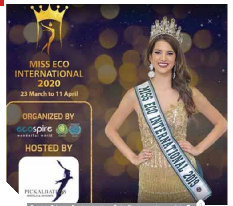
إقبال كبير على مسابقة ملكة جمال السياحة والبيئة العالمية