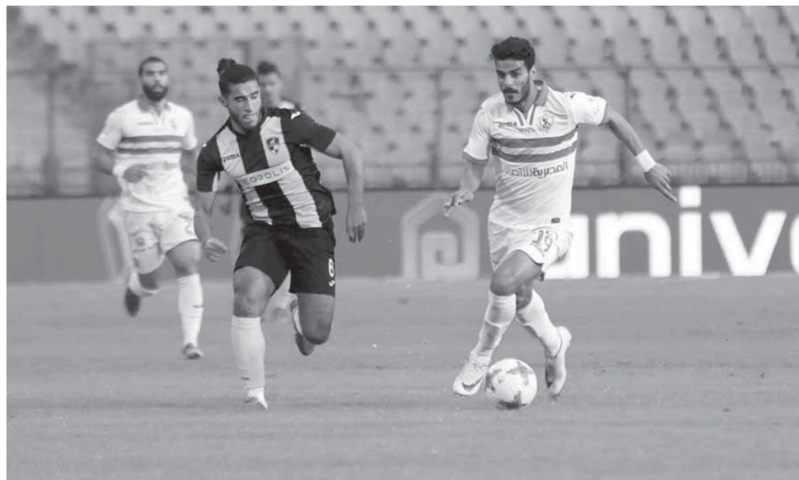
الزمالك فاز على دجلة وحقق الانتصار الثالث على التوالي

وأضاف أن هناك تواصل بينه وبين المهندس إبراهيم عثمان وأصفا البيان الذى صدر بأنه يؤكد على عمق العلاقات بين الناديين.