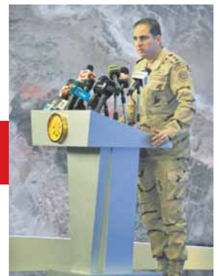
المتحدث العسكري أثناء المؤتمر الصحفى

الجيش حافظ على قواعد حقوق الإنسان ووفر الحماية الكاملة للمدنيين