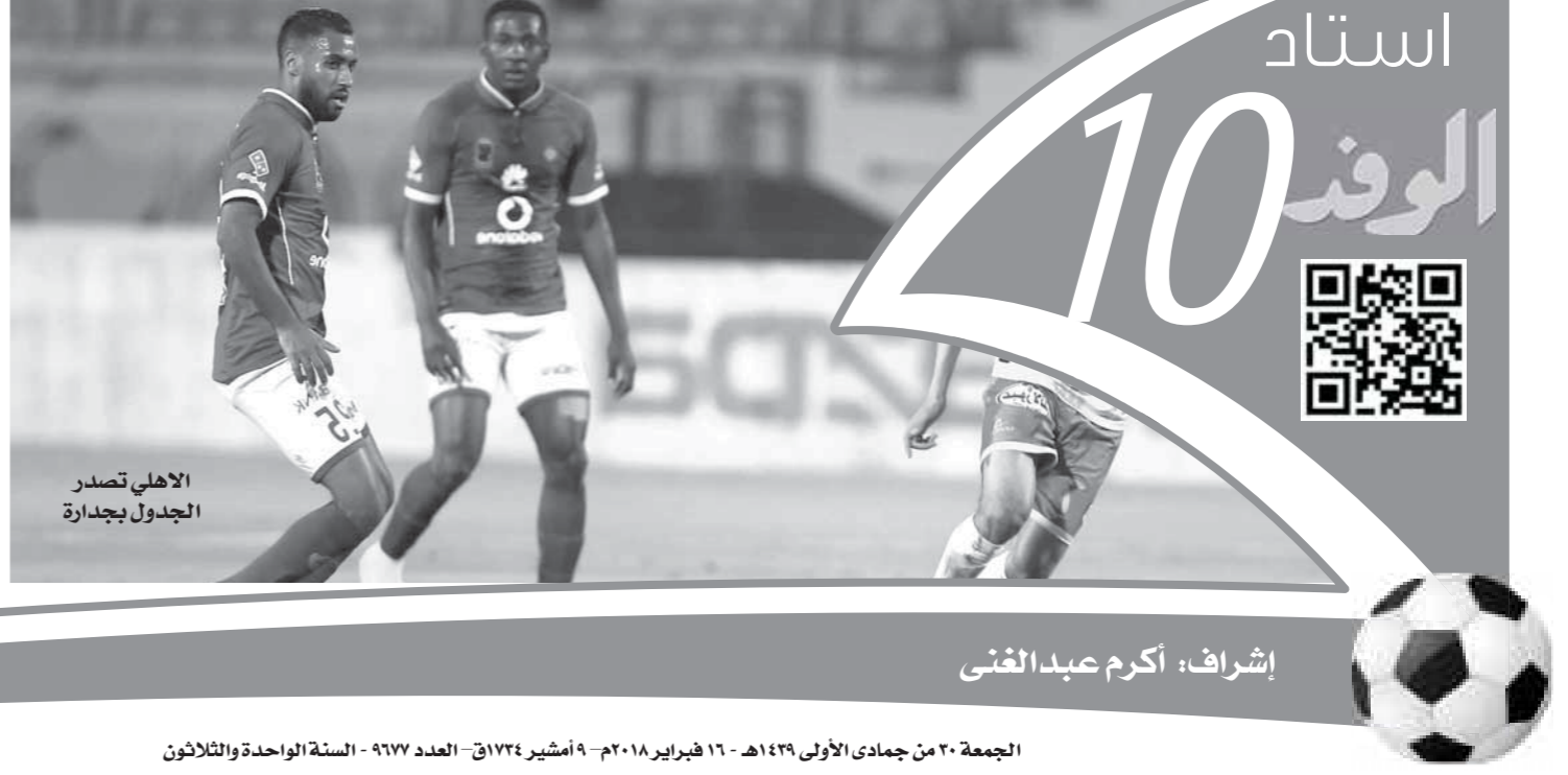
الأهلي تصدر الجدول بجدارة

قررت لجنة المسابقات باتحاد الكرة تأجيل مباريات الزمالك مع المقاصة، والأهلي مع المصري والذي كان مقرراً لإقامتهما يوم 4 مارس المقبل إلى موعد سيتم تحديده فيما بعد. وأكد عامر حسين رئيس لجنة المسابقات أن المباراتين تم تأجيلهما نظراً لتعديل الاتحاد الإفريقي لكرة القدم «الكاف»، مواعيد بطولتي دوري أبطال إفريقيا