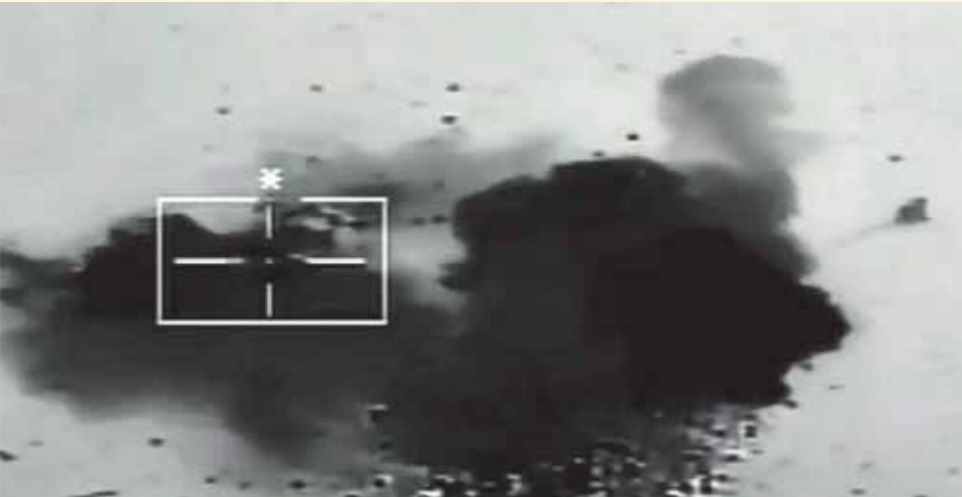
تدمير السيارات المحملة بالمتفجرات على الحدود الغربية