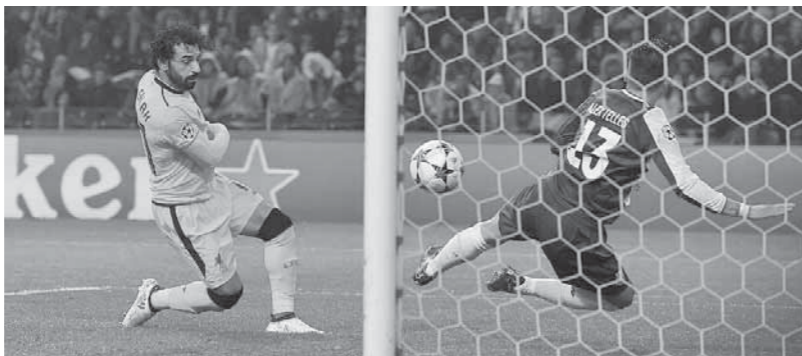
محمد صلاح سجل هدفاً رائعاً

وأضاف: «هذه المنطقة من الملعب تتطلب رياضة جأش وهديه كبير، صراحة لقد بذل اللاعبون مجهوداً كبيراً، (صلاح) فى قمة مستواه وأنه عليه بالثقة».