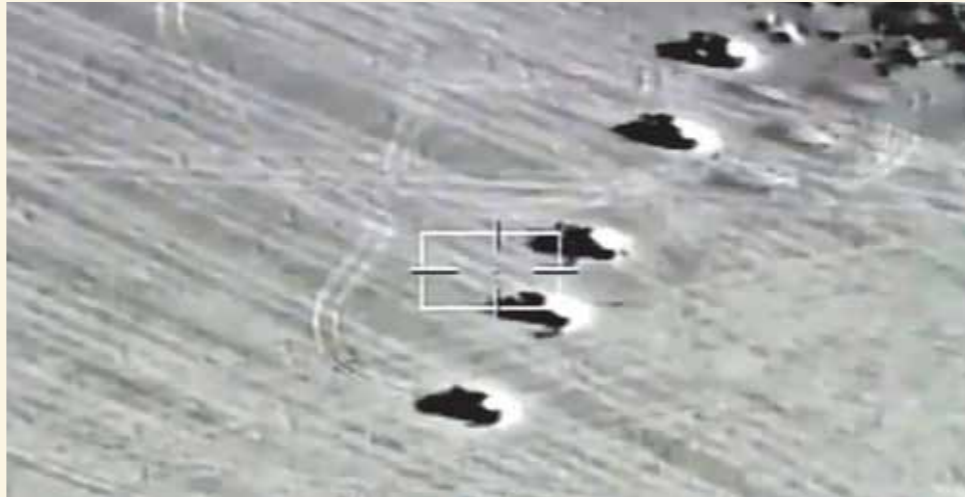
نسور الجو أحبطوا عملية اختراق للحدود الغربية

تزامناً مع تنفيذ خطة المجابهة الشاملة للقضاء على العناصر الإرهابية وأعمال التسلل والتخريب عبر الحدود، وبناءً على معلومات استخباراتية مؤكدة تفيد بجمع عدد من العناصر الإجرامية تستعد للتسلل إلى داخل الحدود المصرية باستخدام عدد من سيارات الدفع الرباعي على الاتجاه الاستراتيجي الغربي، وبأوامر من القيادة العامة للقوات المسلحة أقامت تشكيلات من القوات الجوية لاستطلاع المنطقة الحدودية واكتشاف وتتبع الأهداف المعادية وتأكيد أحوالها والتعامل معها على مدار الـ 24 ساعة الماضية، وقد أسفرت العملية عن استهداف وتدمير 10 سيارات دفع رباعي محملة بكميات من الأسلحة والذخائر. وتواصلت القوات الجوية وعناصر حرس الحدود تنفيذ مهامها بكل حسم لتأمين حدود الدولة ومنع أى محاولة للتسلل أو اختراق الحدود على كافة الاتجاهات الاستراتيجية.