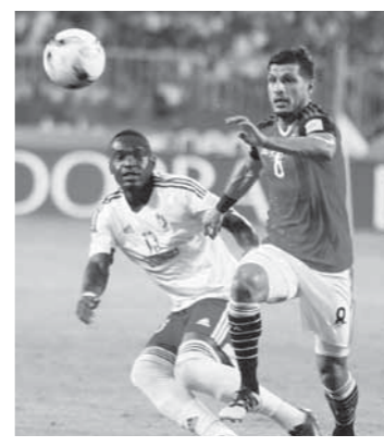
المنتخب تراجع بصورة غير متوقعة فى تصنيف الفيفا

واصل المنتخب الوطنى الأول، تراجعته فى التصنيف العالمى للاتحاد الدولي لكرة القدم، «فيفا»، والذي صدر أمس عن تصنيف المنتخب لشهر فبراير حيث تراجع المنتخب المصرى 13 مركزاً دفعة واحدة، ليصبح الأكثر تراجعاً خلال الشهر الجارى. ويعدما كان يحتل الفراغنة صدارة المنتخب الأفريقية، هبط للمركز الخامس، متراجعا للمركز 43 عالمياً بدلاً من المركز 30 فى شهر يناير، ويات الأكثر تراجعاً فى منتخبات العالم، بينما صعد منتخب الكونغو 8 مراكز ليصبح الأكثر صعوداً، وحقتت أسلندا مركزاً تاريخياً بالتواجد فى المرتبة 18.