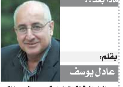
بقلم: عادل يوسف

والأسوأ في ظل هذه الأزمة هو انتشار أدوية مشوشة في الصيدليات ومنها للأست مضادات حيوية وحقنات ولين وأدوية أخرى خاصة بالأشخاص المزمنة. هذه الأدوية المشوشة التي تنتجها مصانع بير السلم تباع بنقص الأسعار، يصعب اكتشافها بسبب دقة الجهات المنتجة في تقليد شكل المنتج أو العبوات وتشكل خطرا دائما على صحة المريض. ما يحدث في سوق الدواء المصري يحتاج إلى تدخل عاجل من الدولة لإيجاد هذه الصناعة الحيوية والتي تمكن بشكل مباشر على المريض الذي لم يعد يحتمل أي زيادات في الأسعار ولا اختفاء أنواع حيوية من الأدوية. يا سادة.. صناعة الدواء في مصر صناعة حيوية ويتجاوز هذا السوق في مصر نحو ٣٠٠ مليار جنيه فمصر لديها ١٧ مصنعا للدواء تمثل قوة صناعية كبرى، وتتميز بعدادات نمو معرفته وتعتبر صناعة الدواء ضمن ٩ قطاعات مستهدفة حدتها الحكومة للوصول بحجم الصادرات إلى ١٠٠ مليار دولار بحلول ٢٠٣٠. ولكن التحديات التي من نقص الخامات وانتشار أدوية مشوشة قد تعطل هذا المستهدف، ومطلوب تدخل عاجل من الحكومة لمساعدة شركات الأدوية في حل أزمة نقص المواد الخام اللازمة للإنتاج، سواء الإفراج عن المواد الخام المكسدة بالمواد، أو تسهيل إجراءات الاستيراد، وتوفير العملة الصعبة اللازمة للاستيراد فلا يعقل أن تفتت شركات الأدوية والمستزمات الطبية في التطوير انتظارا لتوفير العملة الصعبة!! يا سادة.. لا تتركوا المريض المصري فريسة لشركات الدواء. ففي ظل الارتفاع القياسي في أسعار صرف الدولار ليس أمامنا إلا زيادة أسعار الأدوية على المريض والتي شملت بالفعل أكثر من ٢٠٠٠ صنف خلال السنة الماضية وينسب تراوحت ما بين ١٥٪ إلى ٣٠٪. ترجوكم المريض المصري لم يعد يحتمل أكثر من ذلك ويكفيه الام المرض، ارحموا من في الأرض يرحمكم من في السماء.