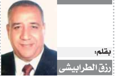
بقلم: رفاق الطرابيشي