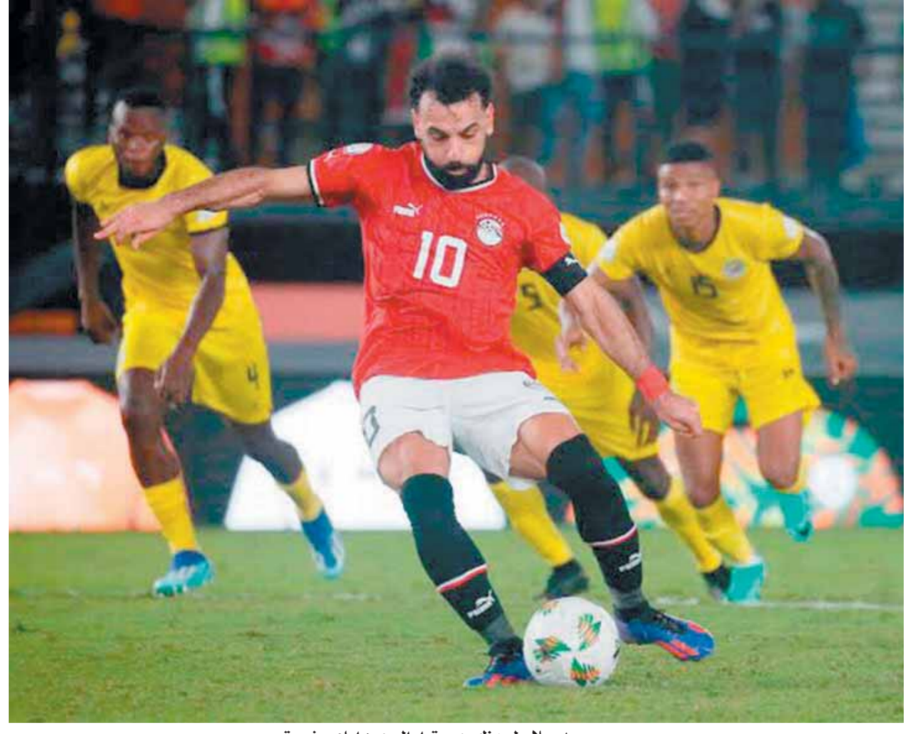
محمد صلاح لم يظهر بمستواه المعتاد امام موزمبيق