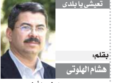
بقلم: هشام الهوتى