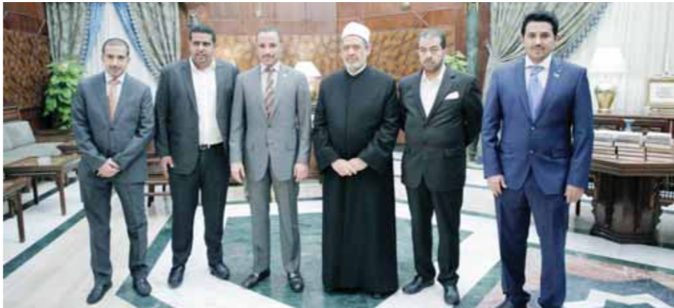
الإمام الأكبر مع عدد من خريجي الأزهر

من ناحية أخرى، أكد فضيلة الإمام الأكبر د. أحمد الطيب، شيخ الأزهر، رئيس مجلس إدارة المنظمة العالمية لخريجي الأزهر، أنه يجب على الطلاب الوافدين الاستمسك بالمنهج العلمي الأزهرى، عقيدة، وفكراً، وسلوكاً، حتى يكونوا خير سفراء للإسلام في بلدانهم، ينشرون صحيح الدين بتعاليمه السمحة، ويرسخون قيم السلام، والتسامح، وثقافة الحوار، وفقه المواطنة والتعايش السلمي بين جموع المواطنين.