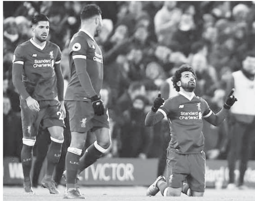
محمد صلاح ساهم في إسقاط مانشستر سيتي بأول هزيمة

وبوصوله للهدف رقم 24 عاد «صلاح» أكبر عدد أهداف سجلها الأسطورة ستيفن جيرارد (موسم 2008-2009) ودانييل ستورديج (2013-2014) خلال موسم واحد، كما أصبح أول لاعب يسهم في 24 هدفاً خلال أول 23 مباراة، ويعادل الرقم القياسي الذي حققه لويس سواريز في موسم 2013-2014. وحقق صلاح رقفاً جديداً بهذا الهدف، حيث