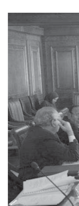
أعلى الجامعات الخاصة يثير أزمة في الجامعات

لعمام الدراسي 2017/2018 الفنى بالجمهورية؛ وبعد انتهاء المقابلات، تعد الكشوف النهائية، وترسل للجهات الأمنية لاستطلاع رأيها في كافة المرشحين، تم التقدم لجميع المرشحين إلكترونياً عن طريق الإدارة العامة للإحصاء دون تدخل في الترشيحات لضمان الشفافية والنزاهة في اختيار القائمين على هذه المهمة الوطنية. تضم منظومة امتحانات الدبلومات الفنية (39) لجنة منها (19) لجنة إدارة و20 لجنة «مكترول»، ويوجد في كل لجنة رئيس ووكيل لجنة.