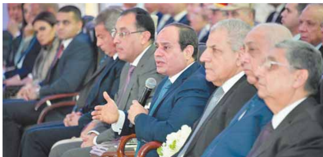
«السياسي» خلال افتتاحه عددا من المشروعات التنموية

سياستنا تتجه نحو السلام والبناء والتعمير