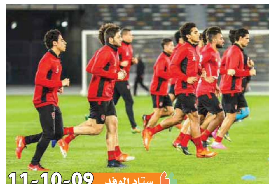
ستاد الوفد 11-10-09 جانب من تدريبات الأهلي «صورة أرشيفية»

تقام اليوم مواجهتان في الجولة الثامنة عشرة للدوري الممتاز لكرة القدم، يسمى الأهلي بقيادة حسام البدري في لقائه أمام طلائع الجيش لاستعادة الصدارة، حيث يحتل المركز الثاني خلف الإسماعيلي برصيد 39 نقطة وله مباراة مؤجلة أمام المقاولون العرب. ويحتل الطلائع المركز الثامن برصيد 25 نقطة، وتقام المباراة في الثامنة مساءً باستاد الدفاع الجوي. ويلتقي المصري البورسعيد مع وادي دجلة باستاد برج العرب بالإسكندرية. وفي الزمالك رفض إيهاب جلال المدير الفني منح لاعبيه راحة بعد التعادل مع الإنتاج الحربي سلبياً، وأدى الفريق مرانه صباح أمس استعداداً لمواجهة الداخلية الخميس القادم. وقرر «جلال» استمرار تجميد المستحقين المالية للاعبين لحين تحسن النتائج.