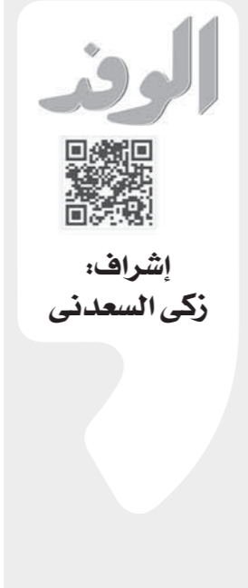
إشراف: زكي السعدني