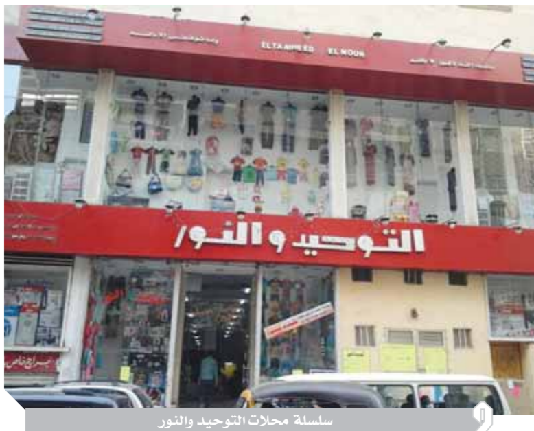
سلسلة محلات التوحيد والنور

«صفوان» و«السويركى» يديران كيانات تمول أنشطة الجماعة الإرهابية