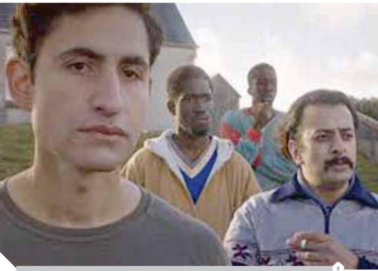
مشهد من فيلم «التيه»