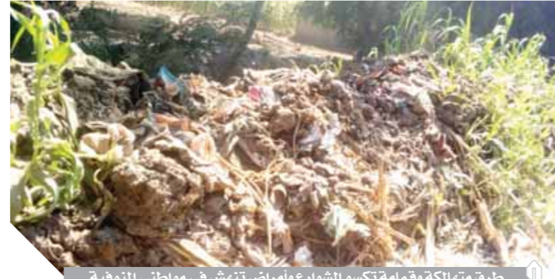
طرق متهالكة وقمامة تسكو الشوارع وأمراض تنهش في مواطنى المنوفية