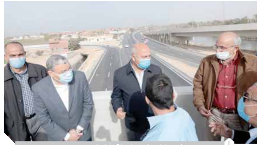
كامل الوزير يتفقد المرحلة الأولى للطريق الصحراوي

أما المرحلة الثالثة في المسافة من محور ديروط مروراً بأسبوط وسوهاج وحتى قنا بطول ٢٤٠ كم، والمرحلة الرابعة في المسافة من قنا مروراً بالأقصر حتى إدفو بطول ٢٢٥ كم، أما المرحلة الخامسة في المسافة من أسوان - توشكى بطول ٢١٠ كم، والمرحلة السادسة في المسافة من توشكى حتى أرقين بطول ١٠٠ كم، بعدها توجه وزير النقل، يرافقه اللواء أسامة القاضي محافظ المنيا، لتفقد محور سناوط على النيل بمحافظة المنيا، حيث تابع الوزير المسلمات النهائية لتشغيل المحور والانتهاء من أعمال الأمن والسلامة وبوابات السيطرة الأمنية