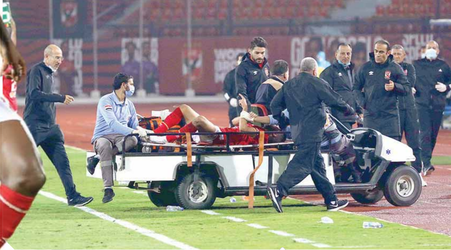
الأهلى افتتح مشواره بالدورى بعبور المقاصة

مشكلة فى الملاعب المتاحة للتدريبات بسبب سوء أرضيتها، ويسعى الأهلى لحل الأزمة بحجز ملعب للتدريبات على نفقته فى الساعات القادمة قبل السفر إلى النيجر خاصة أن هناك ملاعب قليلة بالنيجر وأرضيتها سيئة.