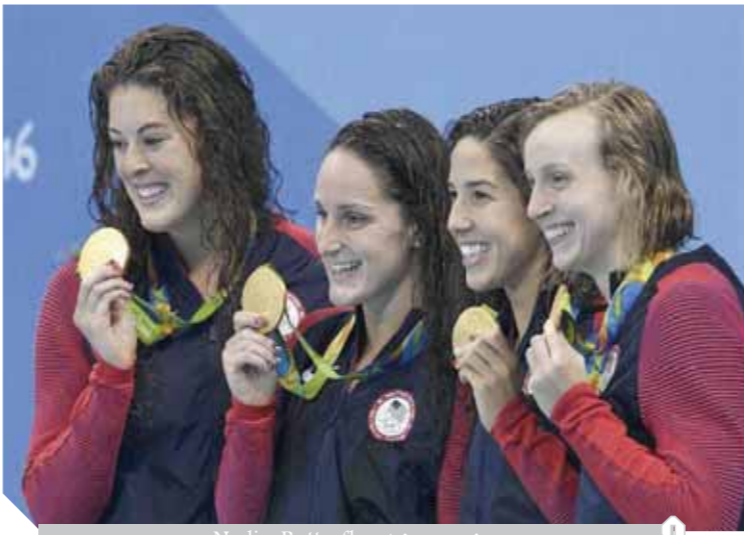
مشهد من فيلم Nadia, Butterfly