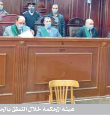
هيئة المحكمة خلال النطق بالحكم