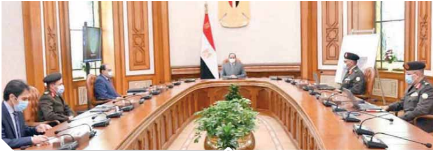
السيسى، خلال اجتماعه أمس

العاصمة. وتناول الاجتماع كذلك الموقف الإنشائي والتفصيلي لمدينة الجلالة بمختلف مكوناتها، بما فيها مستشفى الجلالة التعليمي والنصب التذكاري، بالإضافة إلى استعراض سير العمل بعدد من الجامعات الأهلية الجديدة على مستوى الجمهورية.