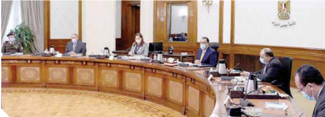
رئيس الوزراء خلال اجتماعه أمس مع عدد من الوزراء

وقالت من أجل استكمال هذه الإنجازات، تعد وزارة التخطيط والتنمية الاقتصادية وثيقة الإصلاح الاقتصادي، التي تضم مجموعة من الإصلاحات المعنية بمرجعة القوانين والتشريعات وتقديم حوافز للقطاع الخاص للعمل على زيادة مساهمته في كافة القطاعات وتشجيعه على توفير فرص عمل.