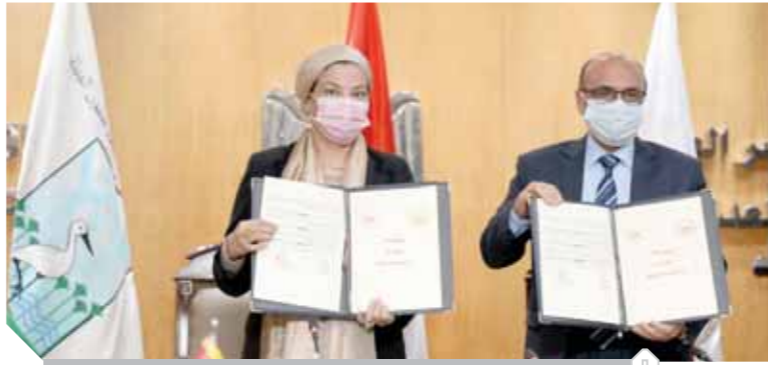
وزيرة البيئة خلال توقيع البروتوكول

الأوضاع البيئية والصحية وإبراز الوجة الحضارى الذى يليق بمصر. ومن ناحية أخرى وقعت الدكتورة ياسمين فؤاد وزيرة البيئة والمستشار عمر مروان وزير العدل بروتوكول تعاون مشترك لدعم وبناء قدرات وتدريب الكوادر البشرية للعاملين فى مجال صون البيئة وحمايتها. وتضمن البروتوكول دعم خبراء البيئة الملحقين بالدوائر البيئية فى مجال تقييم الأضرار البيئية، وكذلك تزويد القضاة وأعضاء النيابة العامة والنيابة الإدارية بكل جديد بشأن الانفاقيات البيئية الدولية والإقليمية وما يتفرع عنها من التزامات على الصعيد الوطنى باعتبار أن الاتفاقيات الدولية التى تصدق عليها مصر جزء من التشريع الوطنى.