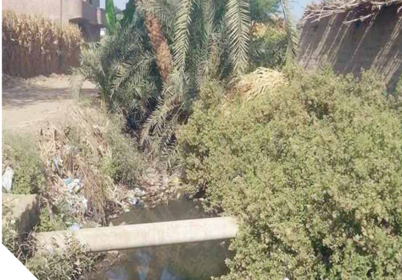
مصارف القرى قتلت بالقامة

بينما تأتي الصورة العامة في جميع مراكز المحافظة أصبحت الحفر والمطبات علامة مميزة في الشوارع وخاصة الشوارع الرئيسية والمدن والقرى، ما نتج عنه العديد من الحوادث وخاصة بين عربات التوك توك والموتوسيكلات التي يقودها الصبية في وضع النهار، وكذلك تلال القمامة بالقرب من المدارس والمصالح الحكومية وعدم إعادة رصف الطرق.