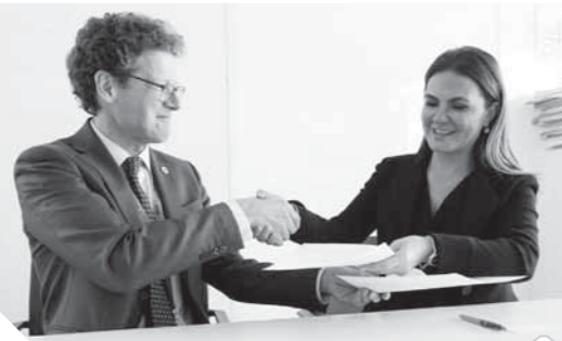
سحر نصر وإستيغانو توسكانو أثناء توقيع المذكرة

وقعت مصر وسويسرا، مذكرة تفاهم للتعاون بين الأمانة التنفيذية لإزالة الأنغام وتنمية الساحل الشمالى الغربى بمصر، التابعة لوزارة الاستثمار والتعاون الدولى، ومركز جنيف الدولى لإزالة الأنغام للأغراض الإنسانية. قام بالتوقيع كل من الدكتور سحر نصر، وزيرة الاستثمار والتعاون الدولى، والسفير إستيغانو توسكانو، مدير مركز جنيف الدولى لإزالة الأنغام للأغراض الإنسانية، وتضمنت المذكرة، ربط أعمال مكافحة الأنغام بالأمن والتنمية، وتطوير المعايير الوطنية لأعمال مكافحة الأنغام، ودعم برنامج التعاون الإقليمى العربى. وأكدت الوزيرة، أهمية هذه المذكرة فى التعاون مع الشركاء فى التنمية فى جهود إزالة الأنغام