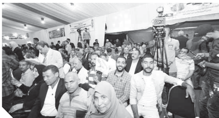
جانب من الجماهير خلال الاحتفال

«السيسي» قائد وطني مخلص سيذكره التاريخ بأحرف من نور لإفساد المخططات وحماية الدولة