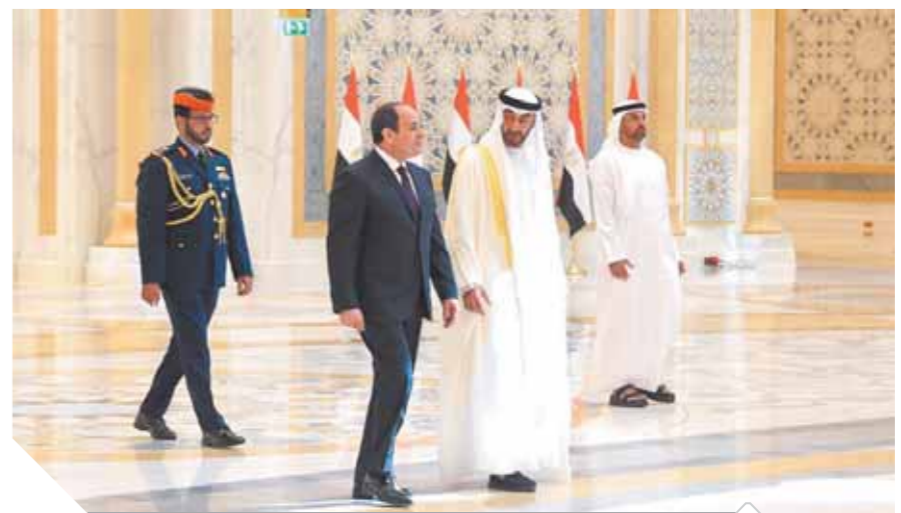
«بن زايد»، خلال استقبال «السيسي»، بقصر الوطن بـ «أبوظبي»