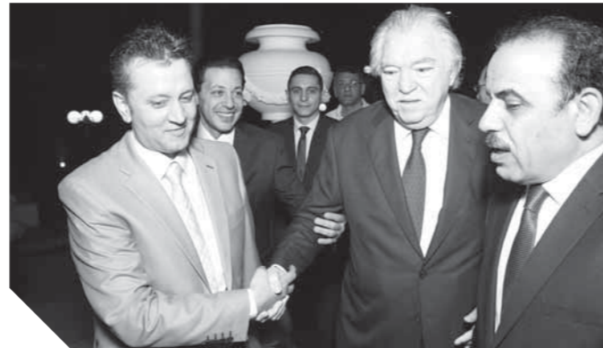
النحاس يستقبل أباطة في الصورة الجمال وسلامة