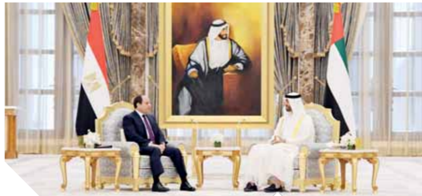
جانب من المباحثات بين الزعيمين

كافة الأصعدة، فضلاً عن مناقشة عدد من القضايا الإقليمية والدولية ذات الاهتمام المشترك، حيث توافتحت رؤى الجانبين بشأن ضرورة تعزيز الجهود المشتركة لمكافحة الإرهاب وأهمية تضاضف جهود المجتمع الدولي من أجل التوصل إلى تسويات سياسية للأزمات التي تشهد بعض دول المنطقة، بما يحافظ على وحدة أراضي تلك الدول ويصون مقدرات شعوبها. وقد قام صاحب السمو الشيخ محمد بن زايد آل نهيان عقب انتهاء المباحثات بمنع الرئيس «وسام زايد»، الذي بعد أرفع وسام تمنحه دولة الإمارات لمؤكداً رؤساء وقيادة الدول، وذلك تقديراً للعلاقات التاريخية والوطيدة التي تجمع بين البلدين الشقيقين، وتوثيقاً لدور السيسي في دعم وترسيخ تلك العلاقات على كافة الأصعدة.