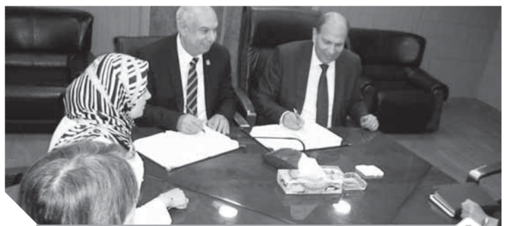
توقيع عقد الخدمات الاستشارية الخاص بالمناطق الصناعية