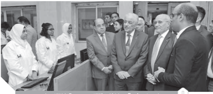
العصر وشوقى خلال افتتاح مدرسة الإنتاج الحربى

كتب . محمد صلاح وأبوزيد كمال وسامية فاروق،