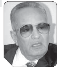
بهاء الدين أبو شققة