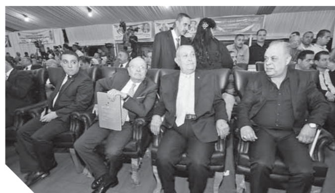
الضمان أشرف زكى والوزير عبد الباقي خلال الاحتفال