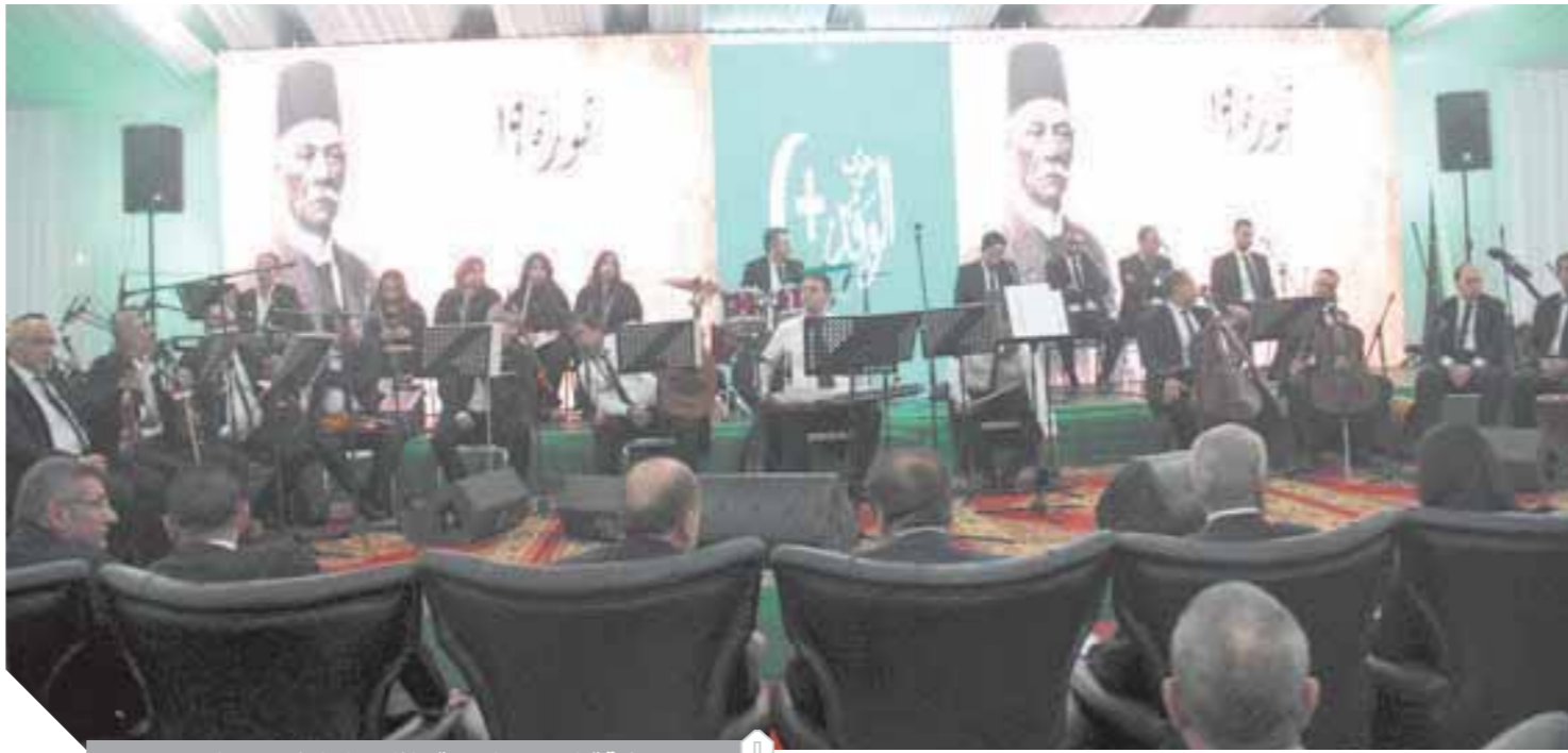
فرقة الموسيقى العربية خلال حفل الوفد بعيد الجهاد

أو يخفوا بعض الأطعمة في الجيب أو «الشراب»، ولم يتخيل أبناء قرية المواشير أنهم وسط ترعة نار، خطلت ستة من أبنائهم وأصاب العشرات. ● صاحب الأرض، كان آخر من يعلم، ولما اكتشفت الفحمة، قام بإبلاغ الجهات المعنية، وعند وصولها لم يتم أخذ الاحتياطات والتدابير اللازمة لحماية الأقران والمنطقة من أي مخاطر طائرة، وكالعادة نزل رجال الدفاع المدني للموقع، وقيل أن ينتهوا من الفحص لعمل اللازم وسد المسورة وإيقاف البنزين، ألقى شاب مستهتر بعقب سيارته على الأرض، فتحول المكان إلى ما يشبه جهنم، وتقدم كل من كان قرب الاشتعال، وبعد ساعات، وبصعوبة شديدة، أطفأت قوات الحماية المدنية السنة الثيران بعد إغلاق المحبس الرئيسي لخط الوقود القادم من شركة طنطا للبترول، وعندئذ تم التحفظ على مالك الأرض البالغ من العمر سبعين عاماً؟! ● الحكاية أبناء المواشير مع البنزين المتدفق مجاناً، تدق ناقوس الخطر الأصيلة، سلام.