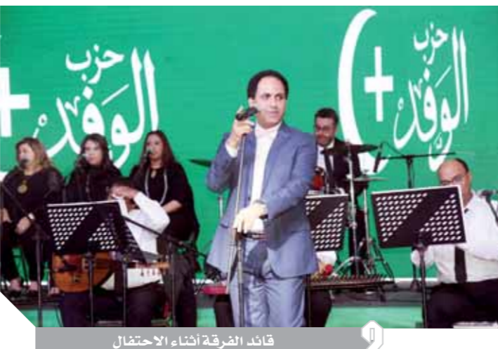
قائد الفرقة أثناء الاحتفال

الأول للأذهان العصر الذهبي للفن، والذي ساهم في إثراء الوعي الجمعي لدى المصريين على مختلف توجهاتهم وجدير بالذكر أن حزب الوفد عبر تاريخه حرص على الانحياز للحركة الفنية المصرية في مختلف المجالات سواء في الغناء أو المسرح وكذلك السينما والفنون التشكيلية وهو الأمر الذي أسهم لمولد مبرك لقوى مصر الناعمة والتي مثلت ذراعاً طولى له القاهرة، في شرق العالم وغربه، وظل دفاع الوفد عن دعم الفنانين ورفع المعاناة التي يتعرضون لها بمناخه الوفود الذي ساهم في الدفع بحركة الفن المصري لتقديم المزيد من الأعمال الخالدة في السينما والمسرح والغناء. يذكر أن المستشار بهاء أبوشقة رئيس حزب الوفد افتتح من قبل معرضاً يضم صوراً وثائقية عن تاريخ ثورة ١٩١٩ وتضمن عدداً من المقتنيات والوثائق النادرة التي توثق لثورة ١٩١٩ وتاريخ كفاح الشعب المصري ودور الوفد في الدفاع عن الوطن وهويته.