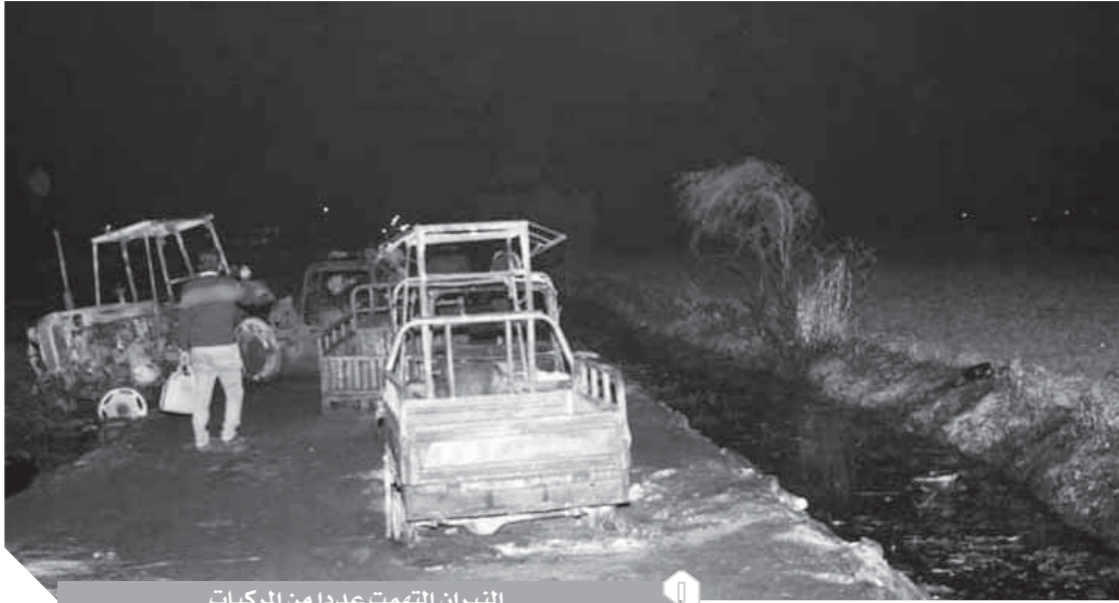
التيران التهمت عددا من المركبات