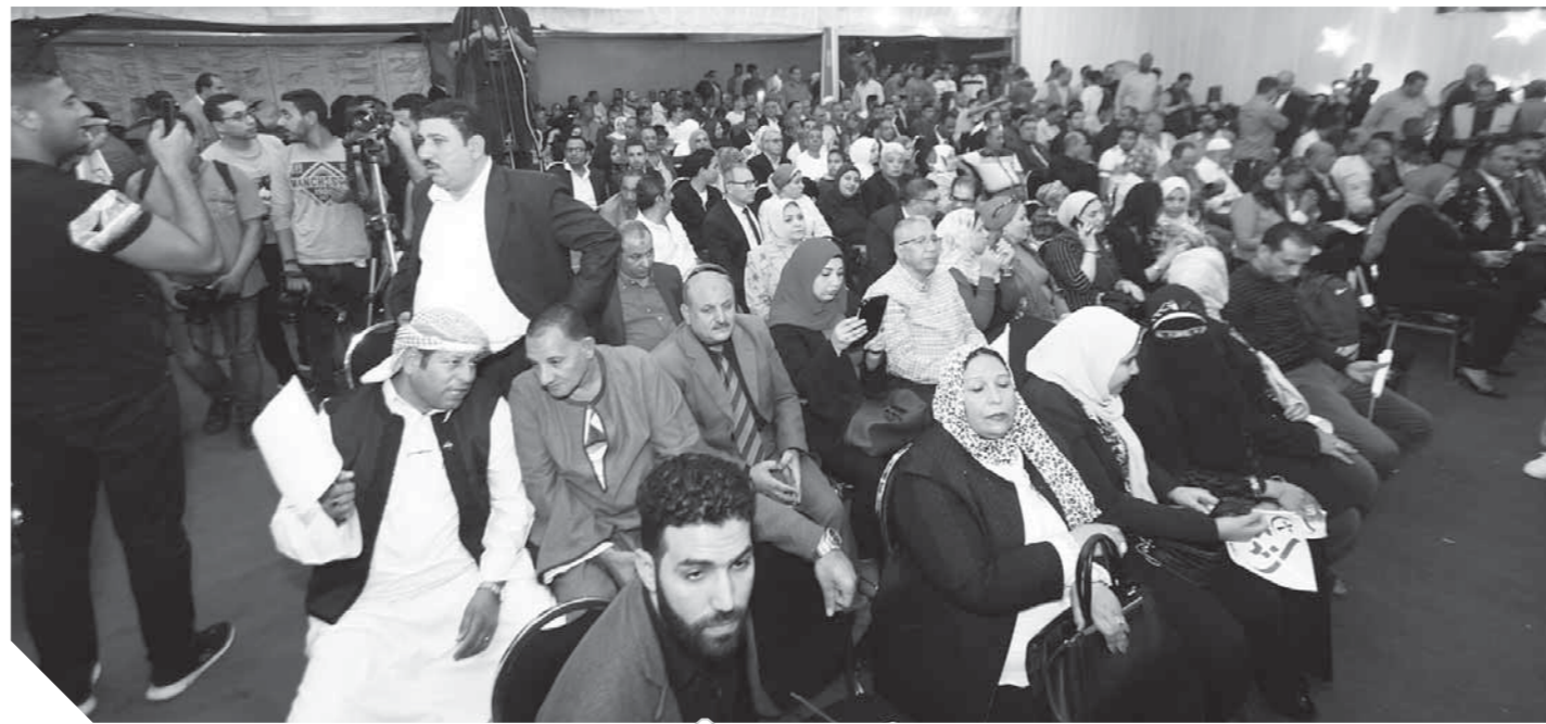
الجماهير حرصت على حضور الاحتفال بعيد الجهاد