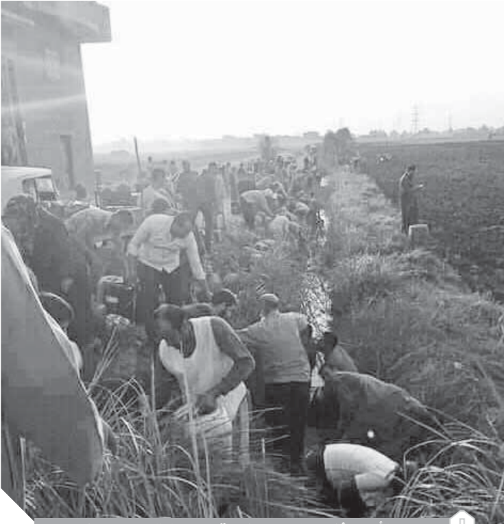
الأهالي أثناء ملء الجراكن قبل لحظات من الحادث