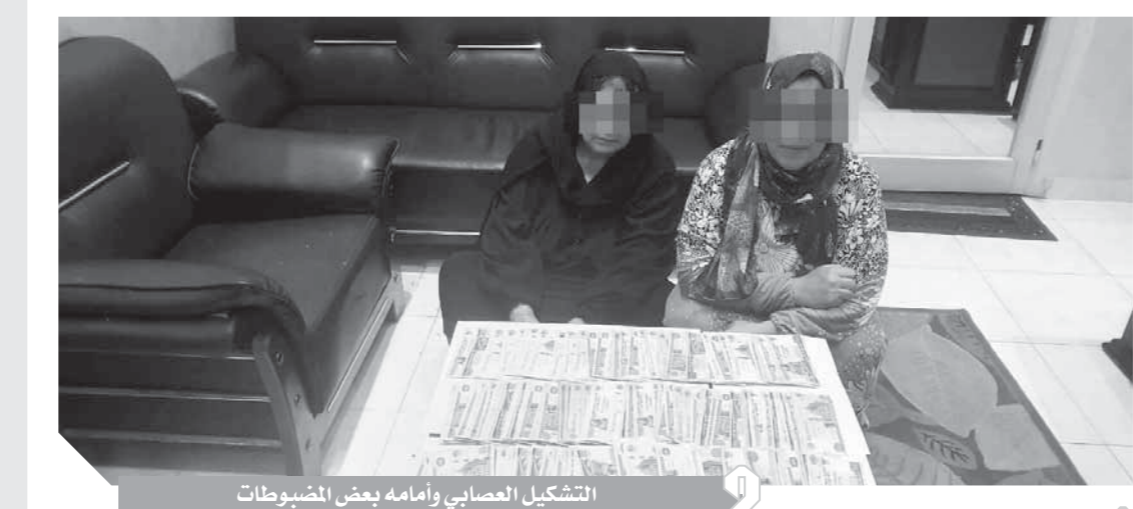
التشكيل العصابى وأمامه بعض المضبوطات

واقعة سرقة إحدى السيدات بذات الأسلوب عن طريق قطع حقيبة يدها باستخدام الأداة المضبوطة بحوزتها، وتطور مناقشتها للربط بينهما وبين القضايا المجهولة اعترفاً بارتكاب ٤ حوادث سرقة بذات الأسلوب، وتم بإرشادهما ضبط الهاتف المحمول المستولى عليه من المجنى عليها الثانية وأقرتا بانفاقهما المبالغ المالية المستولى عليها على متطلباتهما الشخصية، وباستدعاء المجنى عليهن تعرفت الثانية على الهاتف واتهموها بالسرقة، وتحذر عن ذلك المحاضر اللازم، وتولت النيابة العامة التحقيق.