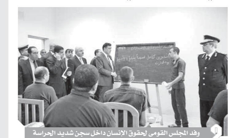
وفد المجلس القومى لحقوق الإنسان داخل سجن شديد الحراسة

الرياضية.. كما ناقشوا عددا من النزلاء حول أحوالهم المعيشية وأوجه الرعاية المقدمة لهم، الذين أشادوا بمستوى أوجه الرعاية المختلفة المقدمة لهم وحسن معاملة إدارة السجن لهم.