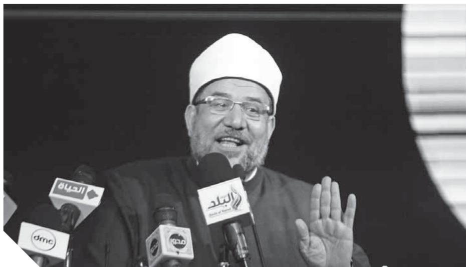
محمد مختار جمعة

نبني كما كانت أوائلنا تبني ونفعل مثلما فعلوا، كما أشار المستشار بهاء الدين أبو شقة إلى ما يتحقق من انطلاقه قوية بالأرقام الاقتصادية المحددة بمعدلات نمو غير مسبوقة، فالدولة المصرية لا تعنى بالبناء الاقتصادي فحسب وإنما تعنى ببناء الإنسان، وأضاف أن الدولة تعطي أولوية لقطاع الصحة والتعليم وقضايا الثقافة وقضايا الخطاب الديني المستنير، واختتم الوزير كلمته قائلاً: كل التوفيق لمصر في ظل القيادة الحكيمة من الرئيس عبدالفتاح السيسي، وسعيد أن أكون بينكم لأبرع عن إيماننا بالتعددية السياسية والتنوع الوطني وأن الوطن لكل أبنائه وبكل أبنائه دون أي تمييز.