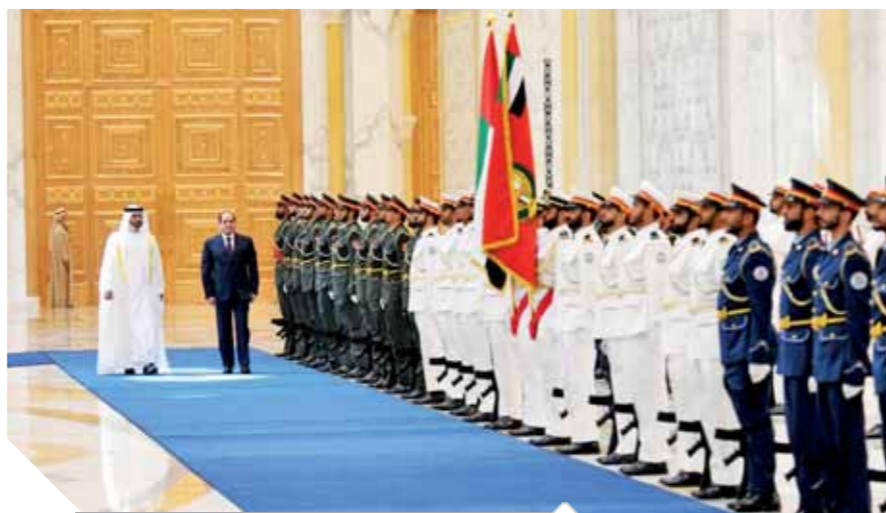
.. وخلال استعراضهما لحرس الشرف