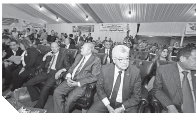
هانى أباطة ومحمد عبده في الاحتفال