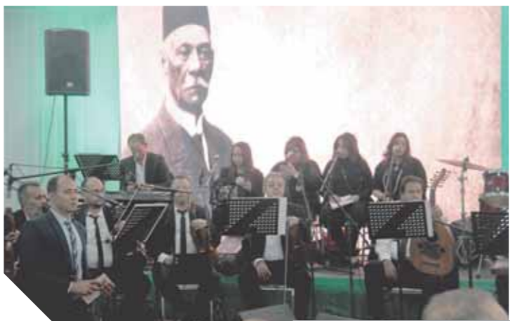
أغاني وطنية لفرقة الموسيقى العربية أثناء الاحتفال بعيد الجهاد

وحفلت الذاكرة الثقافية بأسماء العديد من المثقفين المبدعين في مختلف المجالات الذين جسدت المبادئ الوفدية هوية لهم وبيات الأغاني التاريخية التي