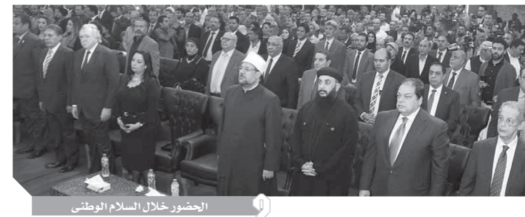
الحضور خلال السلام الوطني