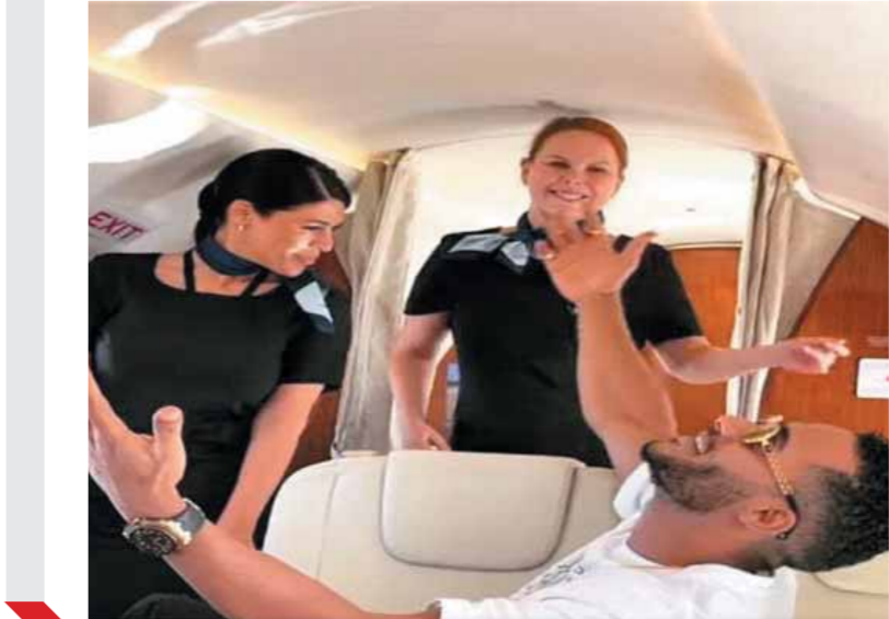
المضيفات يرقصن مع محمد رمضان

كتب: خالد حسن، نفت النقابة العامة للعاملين بالنقل الجوى، أمس، تبعية المضيفات اللاتى ظهرن يرقصن مع الممثل محمد رمضان، تبقيتهن لشركة مصر للطيران، ودعا رئيس النقابة العامة، جميع العاملين من الأطقم وخدمة الطائرات فى «الشركات المصرية»، بأن يستمروا فى التحلى بالنزاهة والحرص على تطبيق قواعد الأمان على متن الطائرة، وعلمين بقواعد سلامة الطيران المقررة، وفقاً لقواعد الأنظمة الدولية للطيران المدنى، وكذلك الاستمرار فى الالتزام بقواعد العمل وبموجب التدريب والتوعية التى تتمتع بها فئاته الضيافة الجوية المصرية، وعلمهم الكامل بأن لهم وظائف محددة منصوصاً عليها دولياً ويأتى فى مجملها خدمة الراكب سواء كان على متن طائرة خاصة أو على متن طائرة ركاب، وتشمل خدمة الراكب ومساعدته كل ما يحتاجه من استفسارات واحتياجات ولا يدخل فى نطاق ذلك الرقص أو مجارته فى ذلك، ومن حقهم الاعتراض على تصرفات وسلوكيات الراكب بل وإلغاء رحلته وإنزاله من الطائرة إذا تعلق الأمر باختراق الخصوصية أو انتهاك أى من معايير الأمان والسلامة.