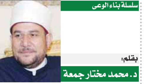
سلسلة بناء الوعى