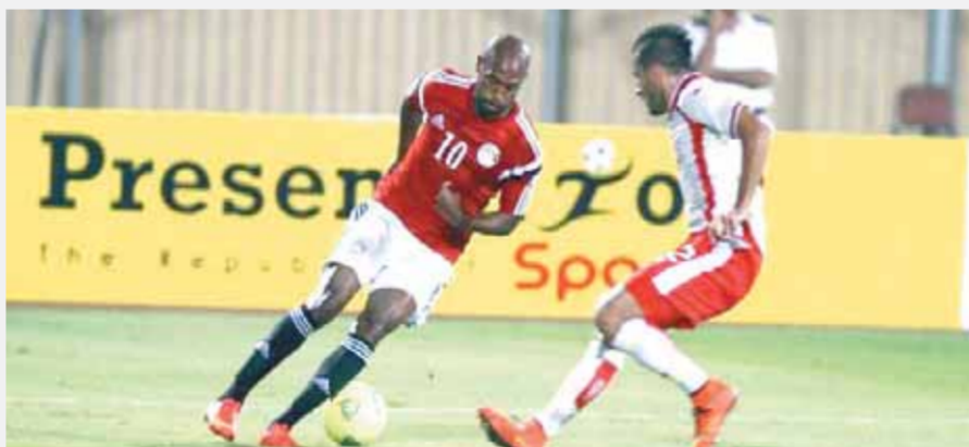
الزمالك يتدرب بقوة استعدادا للقاء توسكر