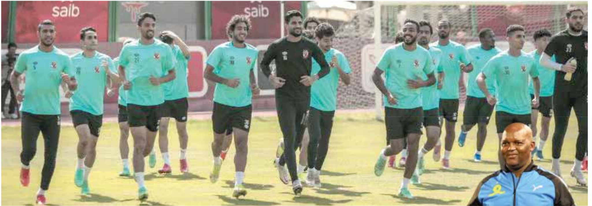
روح عالية في تدريبات الأهلي قبل لقاء بطل النيجر