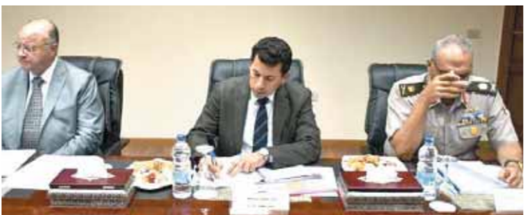
وزير الرياضة خلال اجتماع تطوير وتحديث ستاد القاهرة.

من جهة أخرى، أعلن وزير الرياضة، موافقة الوكالة الدولية لمكافحة المنشطات «وادا» على استضافة مصر اجتماعات مكتبها التنفيذي ومجلس إدارتها في العام المقبل ٢٠٢٢، وذلك خلال اجتماع وزراء الشباب والرياضة الأفارقة، لبحث سبل تعزيز برامج مكافحة المنشطات في أفريقيا.. وهو الاجتماع الذي يعقد لأول مرة في القاهرة السمر. وتحدثت صبيحي خلال الاجتماع مع دعم