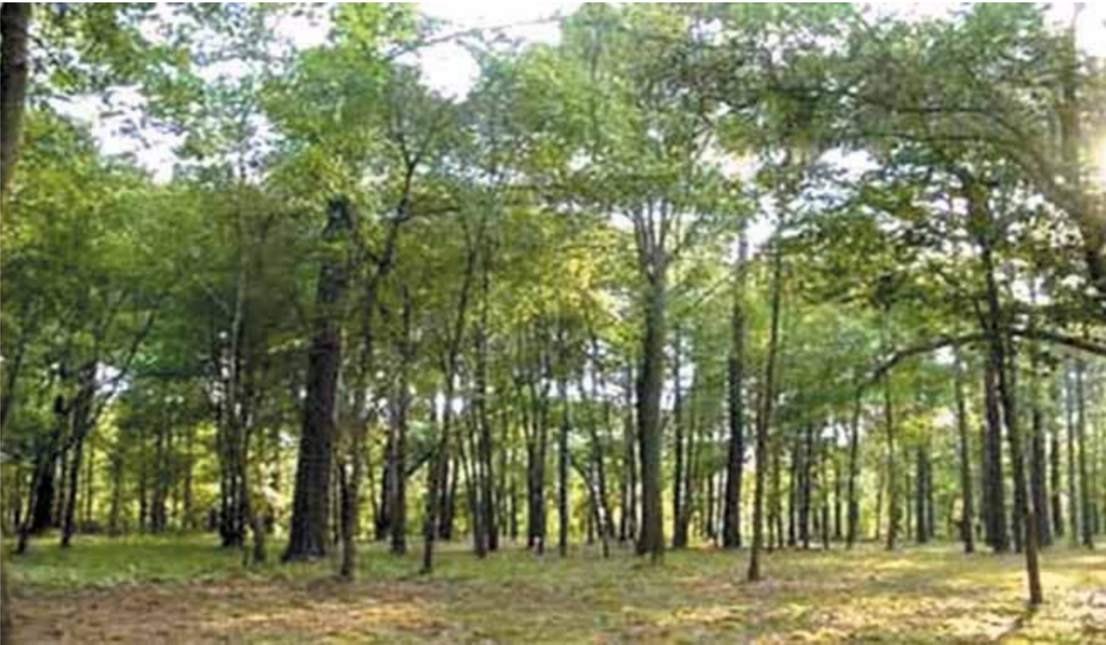
غابة سراييوم فى الإسماعيلية

فى مشهد مشحون بالقلق والتوتر، يطل وجه سالم المراع الماكر الذى يتقبل الهزيمة المؤقتة وينتهي للانقراض من غريمه وشبيهه فى الشر واللا أخلاقية. فيلماء المبركان مع صلاح أبو سيف محطتان ناضجتان فى المشوار الناجح الذى يتسرخ فى الأفلام الثلاثة التالية: «شبه» من الخوف، ١٩٦٩، «ميرامار»، ١٩٦٩، «ثرثرة فوق النيل»، ١٩٧١. رشدى، فى «شبه» من الخوف، واحد من رجال الطاغية عتريس، فهل يمكن للنابع أن يتطلع إلى مكانة ومهابة الزعيم؟ هنا تكمن المسألة، فهو يتناسى هامشيه؟ وحقيقة إنه يستمد القوة والنفوذ المحدود