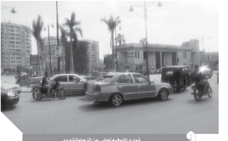
شوارع المنوفية تعاني من الزحام الشديد

تلك هي المدينة أو العاصمة كما يطق عليها أهلها، فهل ينتشر في العاصمة التوك توك وسيلة المواصلات العشوائية، التي تهدد أمن وسلامة المجتمع خصوصاً في عاصمة المحافظة، وحتى الآن لم تجد الحكومة خطة لوضع حل جذري لازمة التوك توك، وهناك