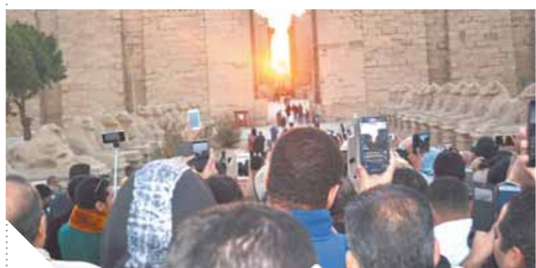
معيد أبوسمبل يشهد ظاهرة فلكية لافتة