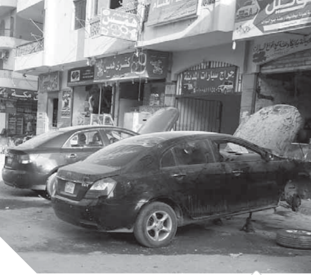
الورش تحاصر العمارات السكنية وتقترب في أزجاج الأهالي

بعد غياب الدولة والقانون معا، فقد قام من يمتنون مهنة صيانة السيارات مثل الميكانيكا والسكمره والبوية، والحدادين، باستئجار المحلات الكائنة بعمارات الشباب وأبراج الربيع، بغرب مدينة كفر الشيخ، في غياب تام لأجهزة الدولة بالمحافظة، وخرفاً للقانون، وبالرغم من استنائة سكان المنطقة للمسؤولين بالمحافظة إلا أنهم لم يحرخوا ساكناً لمعانة المواطنين، بسبب التلوث السمي والبصري، فضلا عن عذاب الإزعاج المستمر حتى بعد منتصف الليل، ورغم أن تلك المنطقة السكنية الكبيرة تقع مقابل المنطقة الصناعية التي أنشئت منذ عشرات السنوات لأغراض ورش تصليح السيارات واللحام وغيرها من الصناعات المزعجة، وأيضا منطقة للحرفيين خلف عمارات الشباب والتي أقامها اللواء أحمد زكى عابدين المحافظ الأسبق عقب قيام ثورة 25 يناير لنقل الورش خارج الكتلة السكنية لتضرر الأهالي من التلوث البيئي، إلا أن أصحاب الورش استغلوا غياب الدور الأساسي للأجهزة المعنية بالمحافظة عن تلك المخالفة الصارخة، واستباحوا حرمة السكان الأمنيين وراحتهم، وفي غياب من المسؤولين من المحافظة تحولت المنطقة الصناعية ومنطقة الحرفيين إلى أبراج وسمارات سكنية يعكس ما أقيمت من أجلها رغم أن المنطقة الحرفية حق انتفاع، كما تسببت تلك الورش بانتشار الزيوت والقاذورات في قلب الشوارع ومداخل العمارات والأبراج السكنية، بالإضافة إلى أكوام القمامة التي انتشرت بشكل بيئي كارثي، وأصبح الشكل المعماري مشوهاً، كما ساعد أيضا على ذلك المنظر البتبع عدم وجود خدمات مثل عدم رصف الطرق داخل الكتلة السكنية، وانهايار شبكة الصرف الصحي، وانتشار الروائح الكريهة بسبب تآثر القمامة بكل مكان، فضلا عن تجاهل المحافظة عن دخول الغاز الطبيعي للوحدات السكنية كإحدى أحياء المدينة.