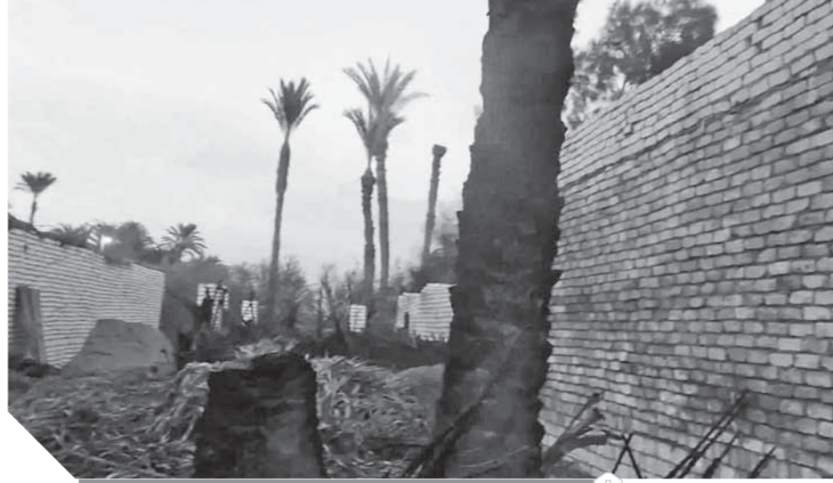
الغوض يحيط بحرائق بنى سويف

والغاء ممارسة كنت قد ادخلتها للمكان وللأمانة لئلا، مضيافاً «والله أنا كنت وسط تواجدنا بالقرب منها إلا أننا فوجئنا بنيران كثيفة تتبع من الأبن سبب اشتعالها واضطرت إلى رفع سطح المنزل الصغير خوفاً من تكرار اشتعال النيران مرة أخرى». أحد شباب المنطقة يقول: «توجهنا لإحضار عدد من المشايخ لتفسير ومنع الحرائق، إلا أن بعضهم طلب أمراً قبل أن يصل إلى المنطقة وأخيراً فشلوا في معرفة سبب الحرائق أو منعها.