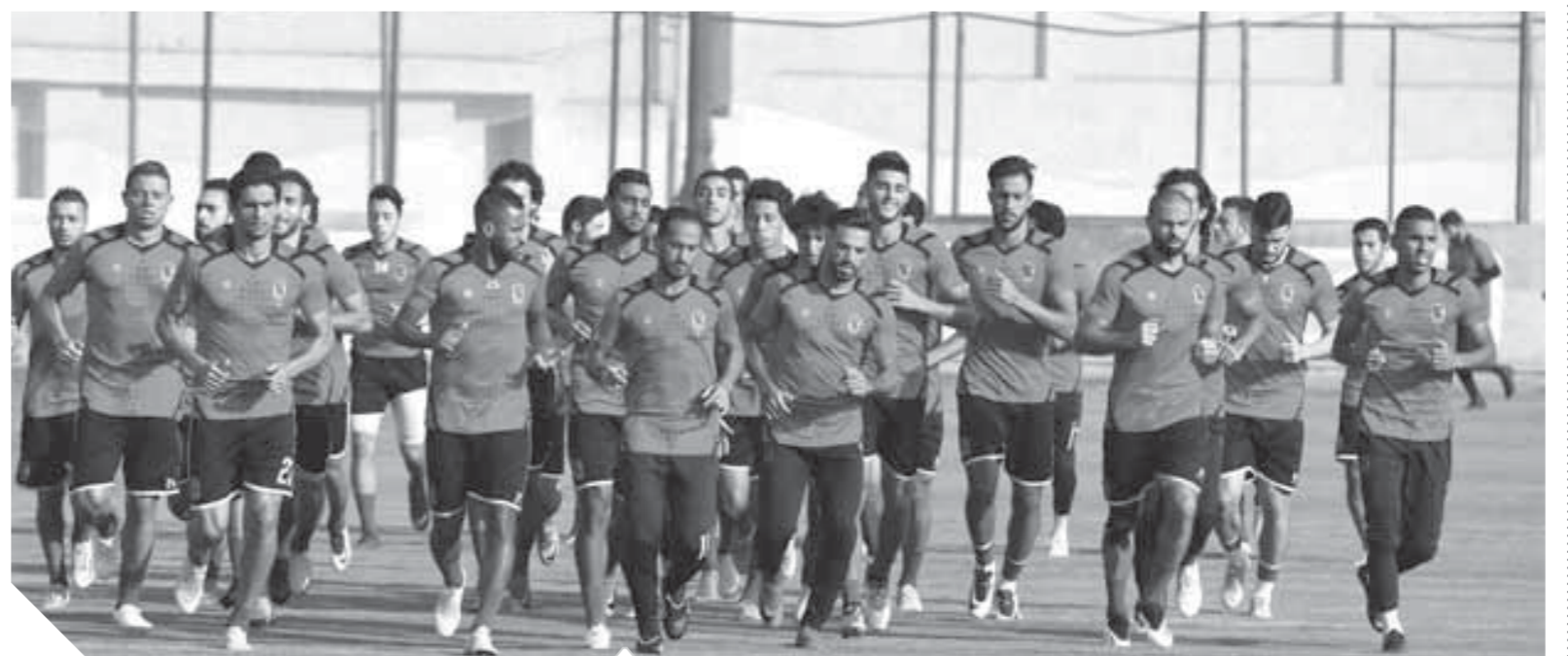
مران جاد للاهلى قبل مواجهة وفاق سطيف