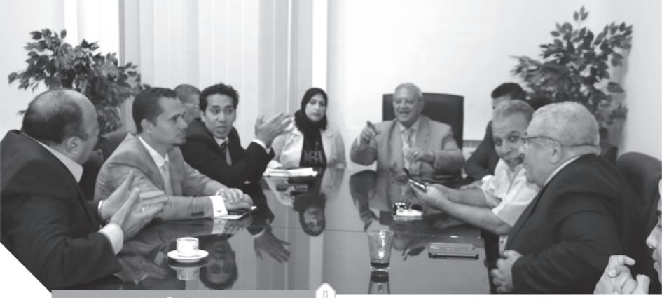
جانب من اجتماع لجنة الدفاع بالوفد

دقيقة للغاية، وهو ما أكدته الرئيس عبدالفتاح السيسي في خطابه للجنة التثقيفية التي انعقدت أول من أمس، بأن الدولة تخوض حرباً خطيرة وشديدة، وذلك نظراً إلى الجهل بالعدو الذي تحاربه بالداخل، على عكس حربنا ضد إسرائيل التي كان العدو فيها واضعاً لنا. وطالب «نور»، المشاركين بالاجتماع بتخصيص بعض الأفكار لتنفيذها، خلال الشهر الجاري، تزامناً مع انتصارات أكتوبر المجيدة، لإبراز دور اللجنة، وبنك أهدافها في الشارع المصري لاستشعار الشعب أن هناك أمناً قومياً داخلياً، موضحاً أن الديمقراطية هي أهم أهداف الحزب الذي ولد من رحم الأمة المصرية. واقترح اللواء هشام حامد بلال، عقد حفل كبير تتم تنظيمه إعلامياً على نطاق واسع، لتناول حرب أكتوبر بتمعن وإبراز دور الشخصيات المجهولة فيها، ومن الممكن استخدام برج القاهرة في إنارته ليلاً، ورفع علم مصر عليه وصور الأبطال. فيما قال اللواء هشام حامد بلال، عقد حفل كبير تتم تنظيمه إعلامياً على نطاق واسع، لتناول حرب أكتوبر بتمعن وإبراز دور الشخصيات المجهولة فيها، ومن الممكن استخدام برج القاهرة في إنارته ليلاً، ورفع علم مصر عليه وصور الأبطال. فيما قال اللواء هشام حامد بلال، عقد حفل كبير تتم تنظيمه إعلامياً على نطاق واسع، لتناول حرب أكتوبر بتمعن وإبراز دور الشخصيات المجهولة فيها، ومن الممكن استخدام برج القاهرة في إنارته ليلاً، ورفع علم مصر عليه وصور الأبطال.