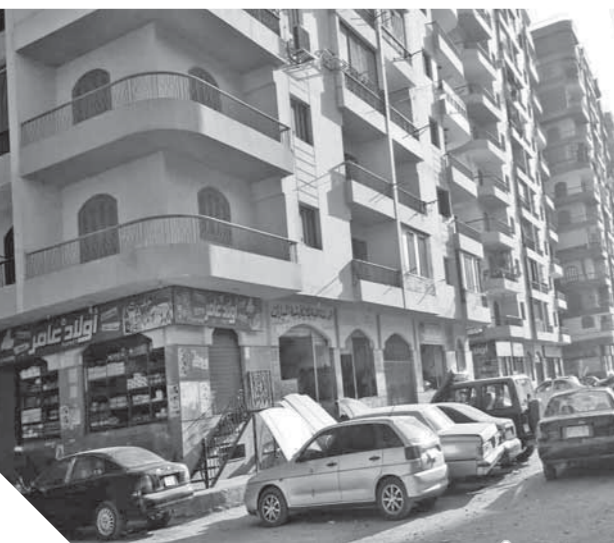
مداخل العمارات تحولت إلى مقالب قمامة بسبب الورش

وأكد الدكتور إسماعيل عبد الحميد طه محافظ كفر الشيخ للورد خلال لقائه بالصحفيين والإعلاميين، أنه أعطى تعليماته بتجديد مواعيد لفتح وغلق تلك الورش المتواجدة بأبراج الربيع وسمارات الشباب وأشار إلى أنه لا يوجد مكان لتلقهم في الوقت الحالي. وتطالب «الورد» المحافظ بالتدخل السريع لإنقاذ أهالي المنطقة من كارثة بيئية، وإيجاد حل فوري لنقل المحلات خارج المنطقة السكنية لصالح عدد كبير من المواطنين.