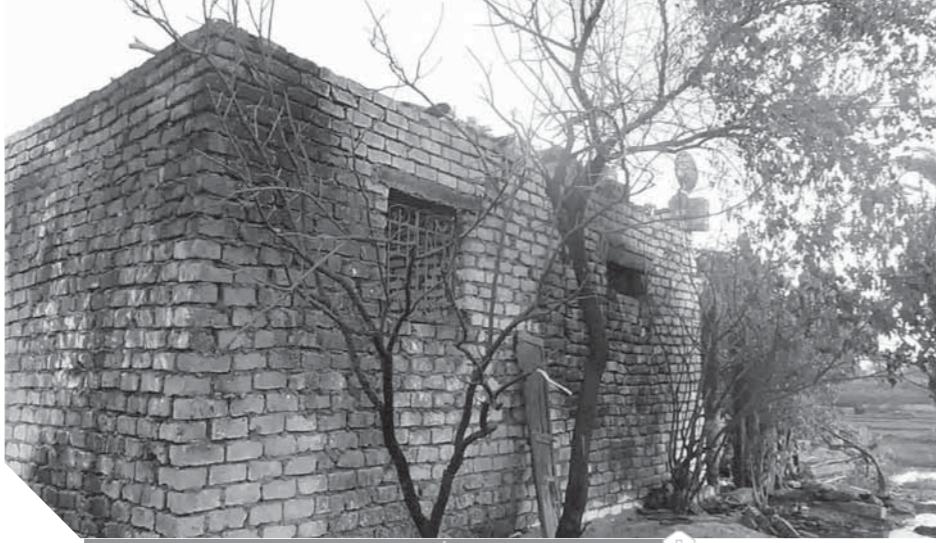
تلف الأشجار بسبب تكرار الحرائق