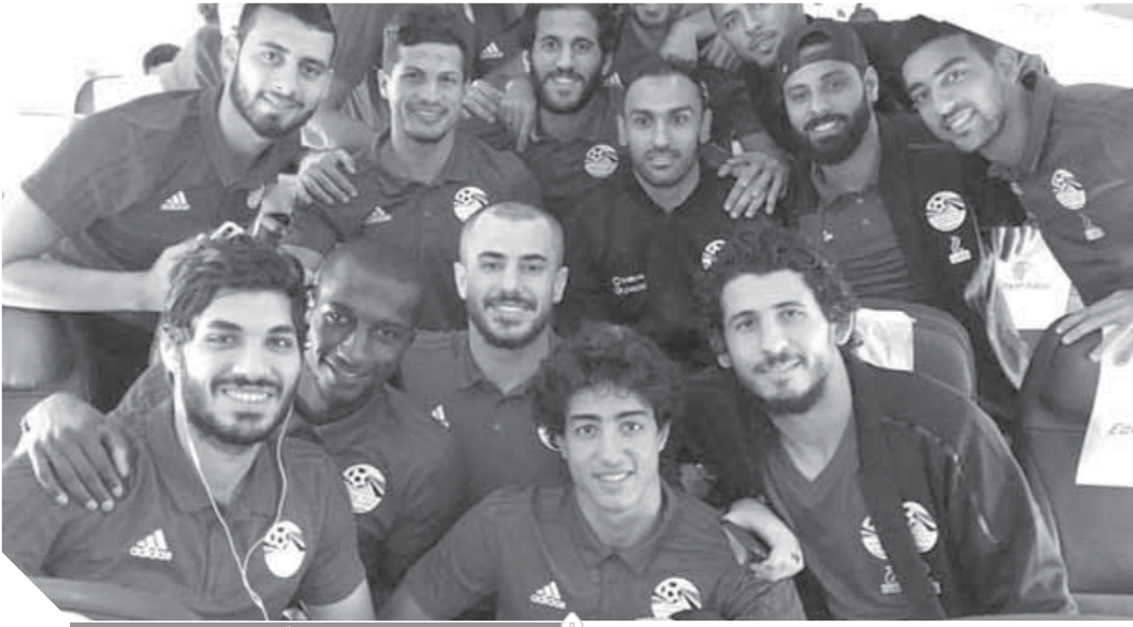
المنتخب خاض رحلة شاقة إلى إي سواتيني