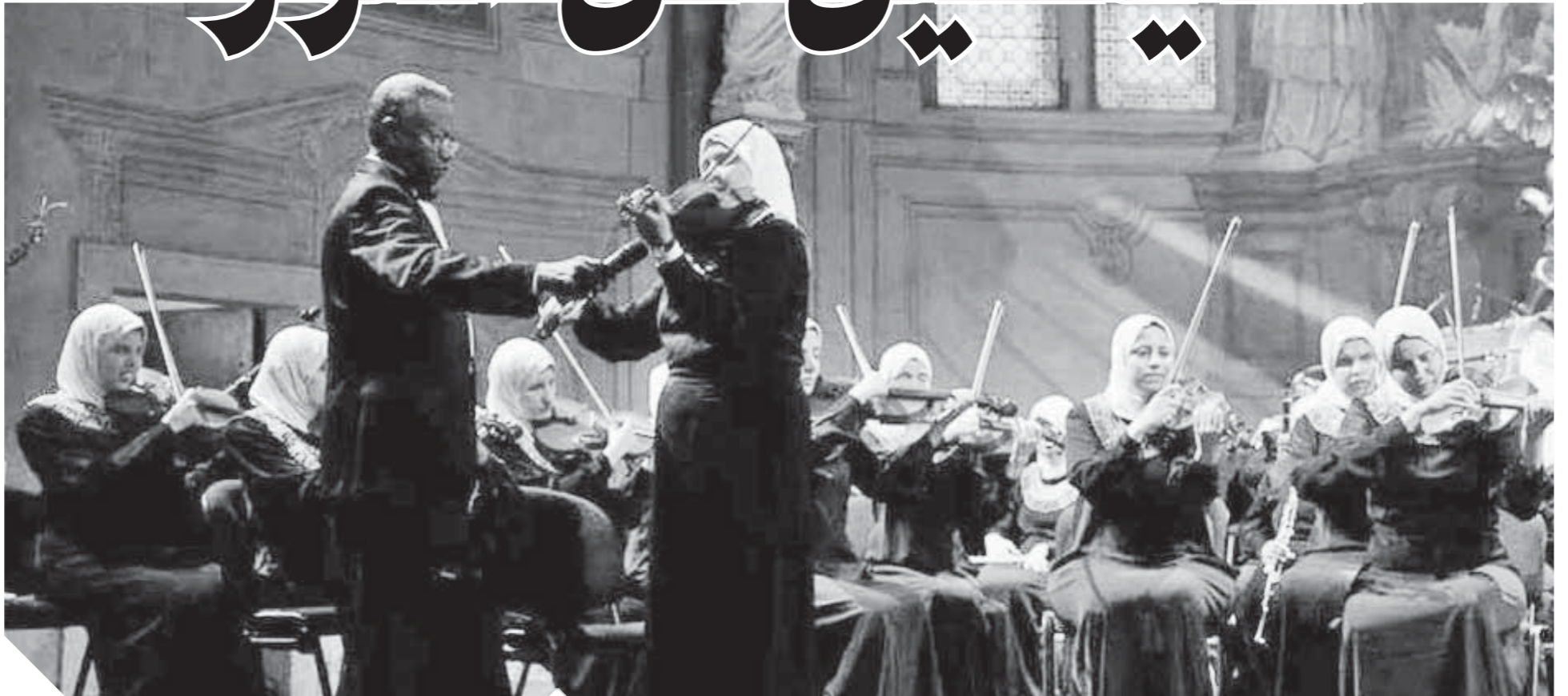
أوركسترا النور والأمل مهدد بالتوقف