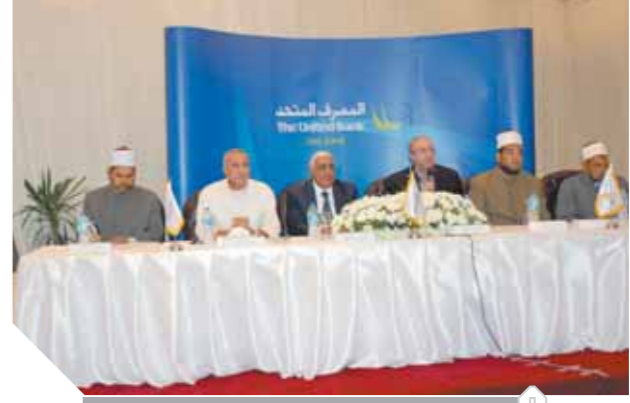
المشاركون في حفل توزيع جوائز مسابقة القرآن الكريم

أكد جمال نجم، نائب محافظ البنك المركزي ان البنوك المحلية تقوم بدور فعال في أعمال التنمية المستدامة للمجتمع المصري من خلال المبادرات القومية والمؤسسية، مشدداً على أهمية تعميق مشاركة البنوك كمؤسسات مجتمع مدني في أعمال التنمية المستدامة وفقاً لرؤية الدولة المصرية 2030. وإثنى نجم، على جهود المصرف المتحد في أعمال التنمية المستدامة خاصة في مجال تحسين الخدمات الصحية وتطوير التعليم ومنها تنمية مهارات الأطفال والشباب المتميزين من حفظة كتاب الله. جاء ذلك خلال إعلان بنك المصرف المتحد عن