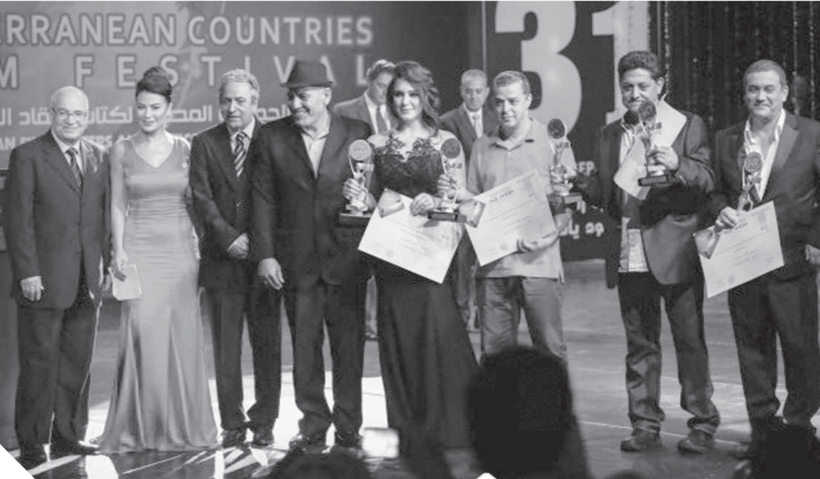
مهرجان الإسكندرية يكرم المبدعون

رسالة محبة أرسلها المشاركون في مهرجان الإسكندرية السينمائي لدول البحر المتوسط إلى العالم، أن يعم السلام والاستقرار، والطمأنينة في قلوب البشر، بدلاً من الدمار الذي يحل على بعض الدول، ويشرد شعبيها، اختيار موفق من لجان المهرجان لأفلام رصدت كيف يدمر الإرهاب أجساد الأمم، ويجعلها هزينة وضعيفة الحركة، وعلى الجانب الآخر أمتعنا بأفلام اكتشفت تراث الأمم، ورغم بعض الأخطاء التي وقع فيها المهرجان إلا أنه حقق هدفه بنسبة ٨٠٪، وتعتبره نجاحاً، والحق يقال إن أمير أباطة