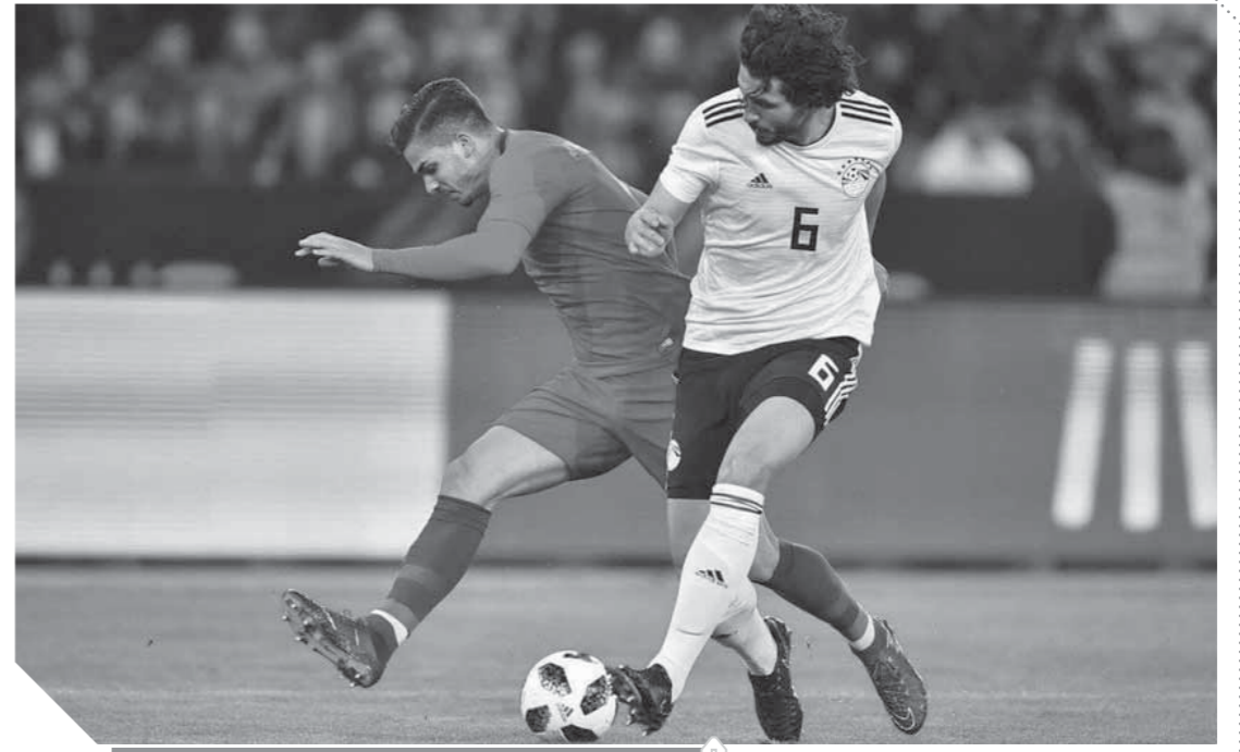
حجازي يعود للمشاركة أساسيا

اليوم.. الفريق يخوض مرانه الرئيسي في «مبابان»