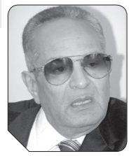
بهاء الدين أبوشقة