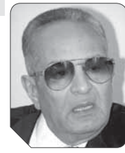
بهاء الدين أبوشقة