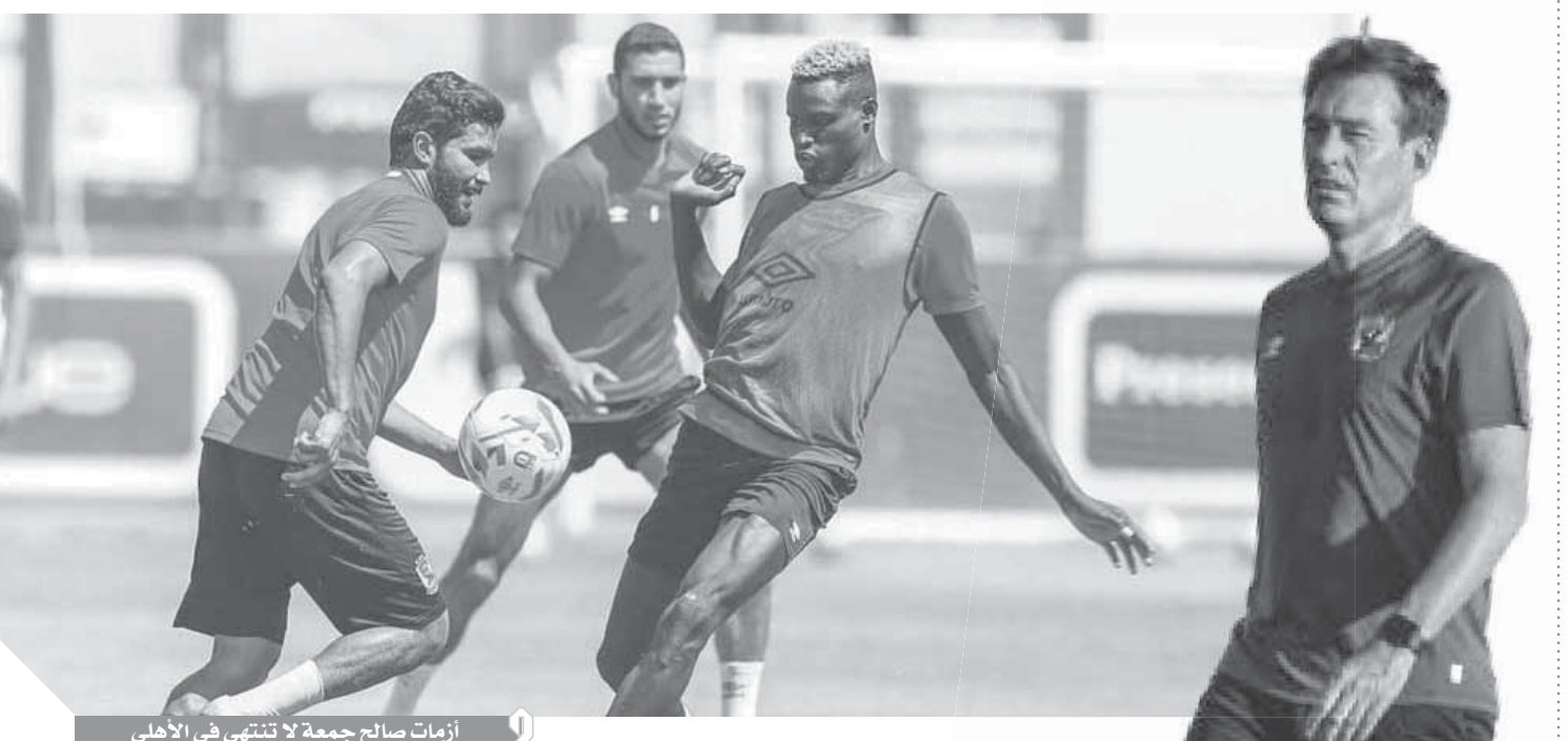
أزمات صالح جمعة لا تنتهي في الأهلي