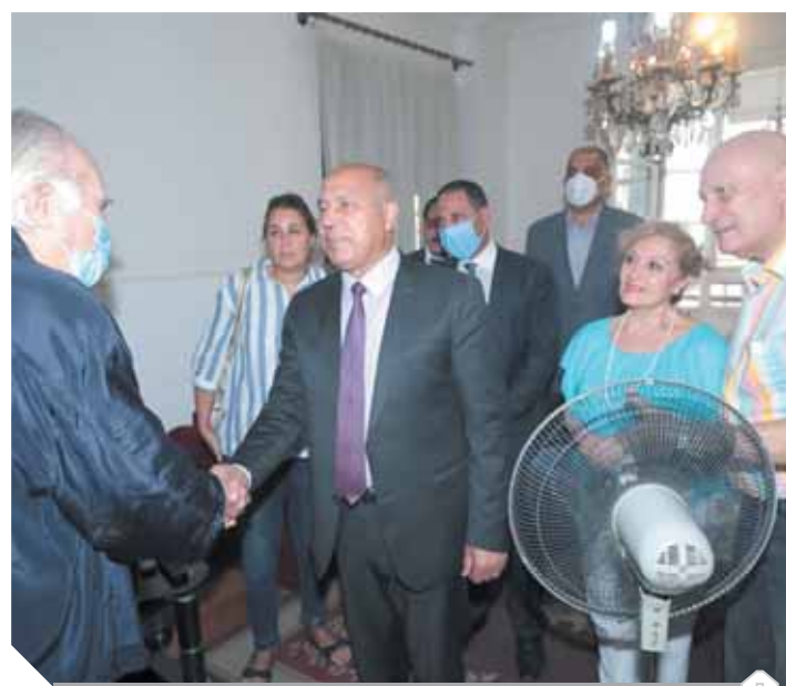
وزير النقل خلال استقباله سكان عمارة الشريتلى

أحد أركان المبنى، وقد زار وزير النقل المهندس كامل الوزير العمارة، حيث استقبله عدد من السكان بالورود معبرين عن شكرهم لإنجاز ما تعد به من عودة قاطني العمارة لشققهم في أقرب وقت، وتوجه السكان بالتحية للرئيس «السياسي» والحكومة على التحرك السريع لرفع الضرر عنهم وأثقا على التعامل المثالي من قبل وزارة النقل والشركة الفرنسية المنفذة للمشروع، وتوجه