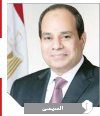
إشراف: فاطمة عياد

أصدر الرئيس عبدالفتاح السيسي قرارًا جمهوريًا بإنهاء تولى وزارة السياحة والآثار إدارة واستغلال منطقة وقصر المنزه في الإسكندرية، وتسليمها إلى رئاسة الجمهورية. ونص القرار في مادته الثانية أن تتولى الرئاسة بصفتها الجهة صاحبة الولاية، تطوير المنطقة لأغراض التنمية والسياحة دون تغيير طبيعتها القائمة على النفع العامة.