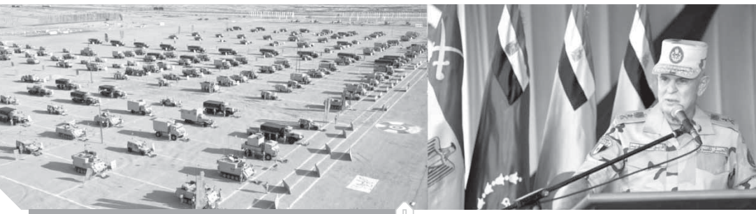
الفریق فريد يشهد مشروع مراكز القيادة الخارجي

كتب - محمد صلاح وأبوزيد كمال وسامية فاروق: