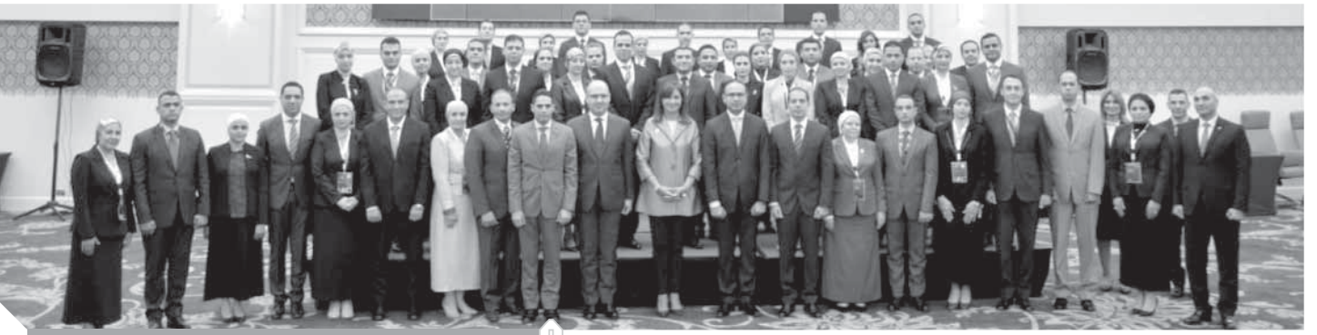
السيرة مكرم وسط المرشحين للعمل بالتمثيل الدبلوماسي

بربط المصريين في الخارج بالوطن، وإطلاعهم على جهود التنمية وتفاصيل التحديات، وخاصة الشباب باعتبارهم شركاء في صناعة مستقبل الوطن، والسعى لتلبية الطلبات المشروعة للمواطنين بالخارج، وربط الخبراء في مختلف المجالات التكنولوجية في خطة الحكومة ٢٠٣٠ من خلال سلسلة مؤتمرات «مصر تستطيع». إضافة لجهود الوزارة في مكافحة الهجرة غير الشرعية في إطار المبادرة الرئاسية «مراكب النجاة».