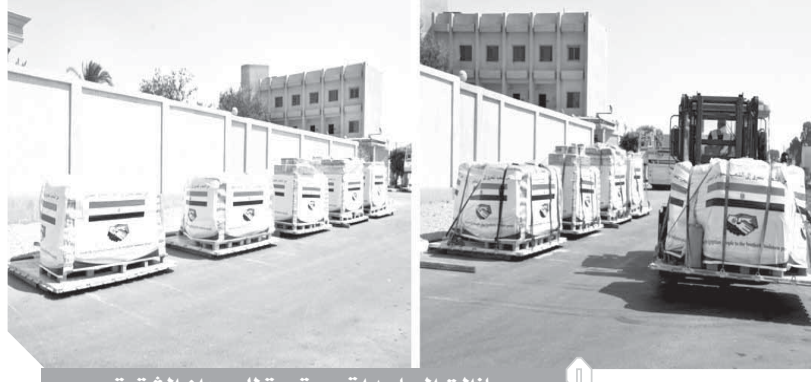
مازالت المساعدات مستمرة للسودان الشقيق

كتب - محمد صلاح وأبوزيد كمال وسامية فاروق: