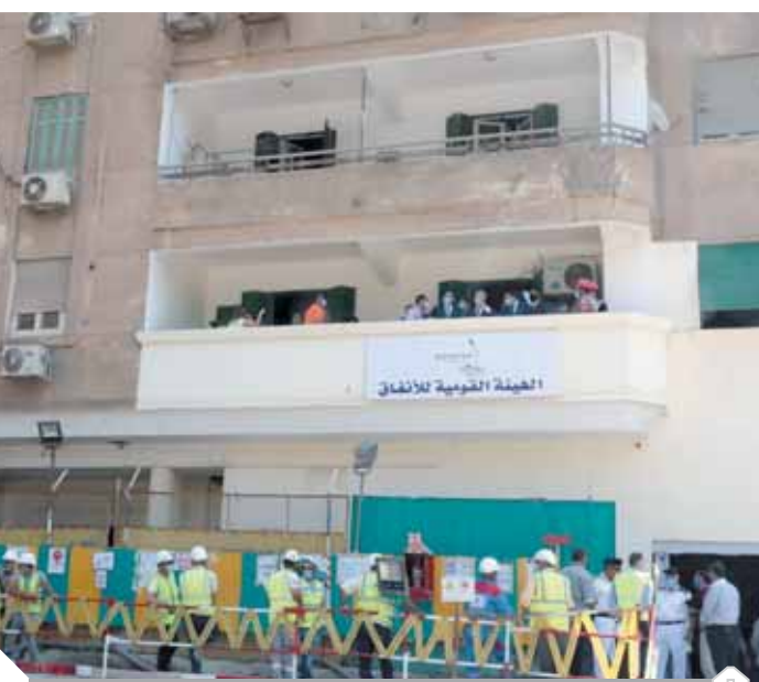
عودة سكان عمارة الشريتلى إلى شققهم