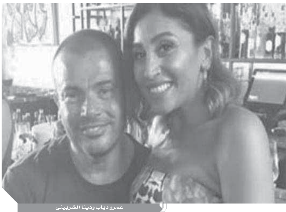
عمرو دياب ودينا الشربيني