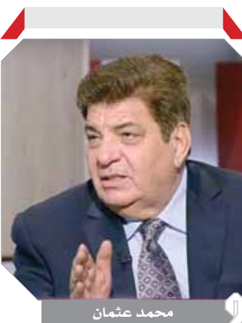
محمد عثمان تتناسب مع تطبيق الإجراءات الاحترافية