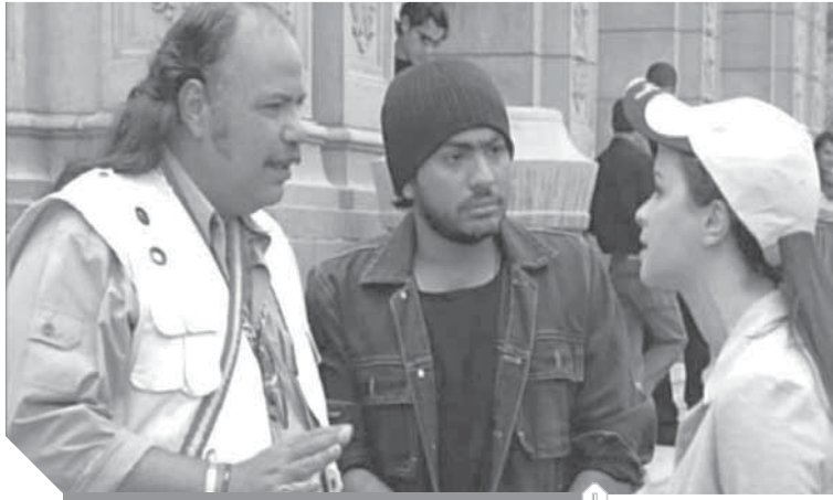
مشهد من فيلم «سيد العاطفي»

للنور، لكنه لم يفلح. لكل أجل كتاب، والرحيل المفاجئ للمخرج على رجب قد دقت ناقوس الخطر في الوسط الفني.