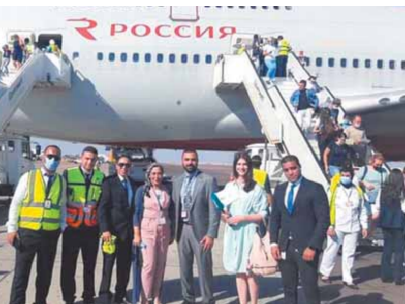
الرحلات الروسية على أرض مطارى شرم الشيخ والغردقة

وفي هذا السياق أكد الطيار محمد منار وزير الطيران أن عودة السياحة الروسية الى مصر جاء بفضل جهود ودعم القيادة السياسية لقطاع الطيران المدنى خلال السنوات الماضية.