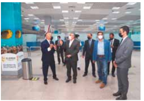
نائب وزير الطيران على رأس لجنة التفتيش الأمنى والبنى

اللجنة العليا للتفتيش الأمنى والبنى بالمطارات والفنادق المصرية تزور مطارى الغردقة ومرسى علم