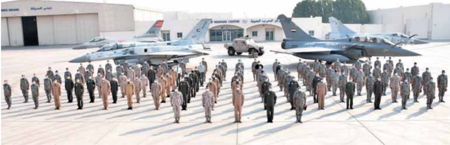
كتب - محمد صلاح وأبو زيد كمال وسامية فاروق؛

اختتمت فعاليات التدريب المشترك الجوى المصرى الإماراتى (زايد-٣) بمشاركة عناصر من القوات الجوية المصرية والإماراتية والذي استمرت فعالياته لعدة أيام بدولة الإمارات العربية المتحدة، تضمن التدريب تنفيذ عدد من المحاضرات النظرية والعملية لتوحيد المفاهيم ونقل المهارات والتنسيق على إدارة العمليات المشتركة بمختلف