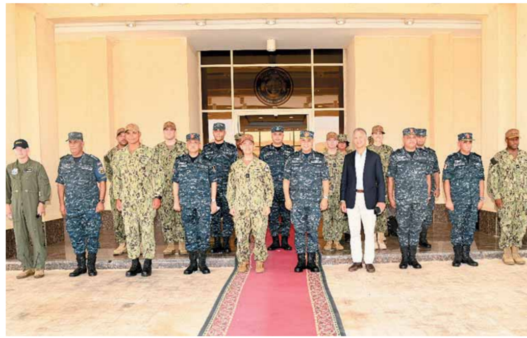
كتب - محمد صلاح وأبو زيد كمال وسامية فاروق؛

في إطار العلاقات الاستراتيجية الراسخة بين جمهورية مصر العربية والولايات المتحدة الأمريكية، استقبل الفريق أحمد خالد قائد القوات البحرية كلاً من الفريق بحرى تشارلز كوبر قائد القوات البحرية التابعة للقيادة المركزية الأمريكية وجوناثان كوهين سفير الولايات المتحدة الأمريكية في مصر لمشاهدة قاعدة «برنيس» البحرية وما يتم توفيره من خلال هذه القاعدة الحديثة ومرافقها من إمكانيات داعمة للأسطول البحرى المصرى والوحدات البحرية للدول الصديقة والشقيقة، وذلك خلال زيارة الطراد الأمريكى (USS Monterey) إلى قاعدة «برنيس» البحرية والتي تعد أول نشاط بحرى يتم تنفيذه بالقاعدة.