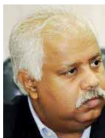
بقلم: حمدي رزق