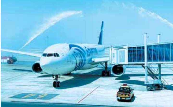
استقبال طائرة مصر للطيران لدى وصولها من موسكو بتقليد رش المياه

وتجدر الإشارة إلى أن شركة مصر للطيران تقوم بتسيير رحلة يومية منتظمة بين القاهرة وموسكو.