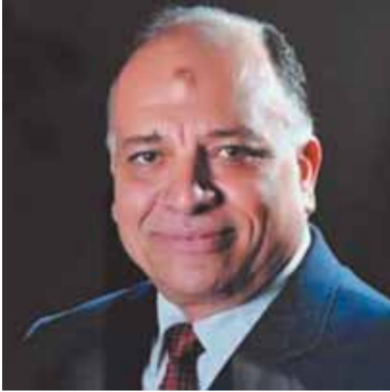
محمد سعيد محروس

وأضاف أن وزارة الطيران المدنى وجميع شركاتها التابعة قامت بتطبيق كافة الإجراءات الأمنية والاحترازية بجميع المطارات المصرية، حيث أشاد بها كافة الوفود ولجان التفتيش التى زارت مصر خلال الفترة السابقة التى أكدت ثقة الجميع فى تطبيق المعايير الأمنية والصحية بالمطارات المصرية وتوج هذا الإنجاز بحصول ١١ مطاراً مصرية حتى الآن، من بينها مطارا شرم الشيخ والغردقة على شهادة الاعتماد الصحى للسفر الآمن من المجلس العالمى للمطارات ACI. ورحب وزير الطيران المدنى بوصول أولى الرحلات الروسية اليوم من موسكو إلى مطارى شرم الشيخ والغردقة سواء على متن الناقل الوطنى مصر للطيران أو شركات الطيران الروسية.