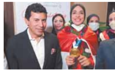
وزير الشباب في استقبال الأبطال