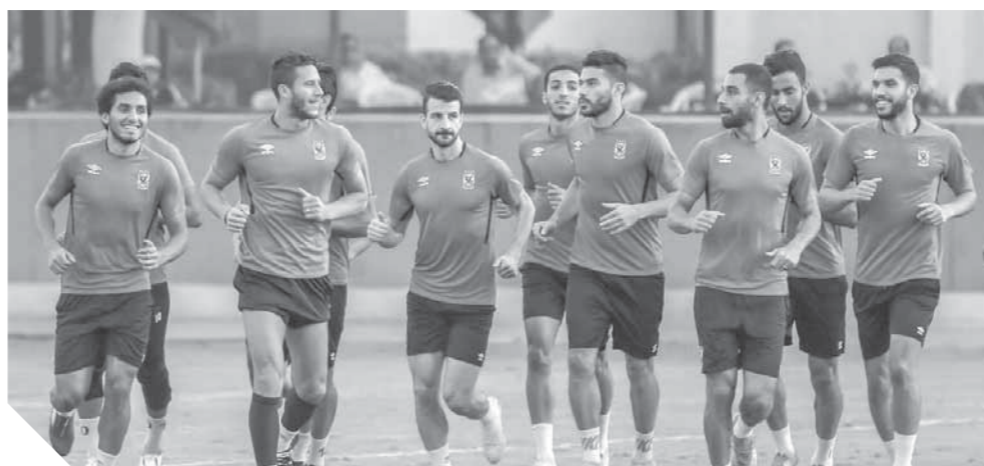
الأهلى يستعد لخوض مباراة بيراميدز