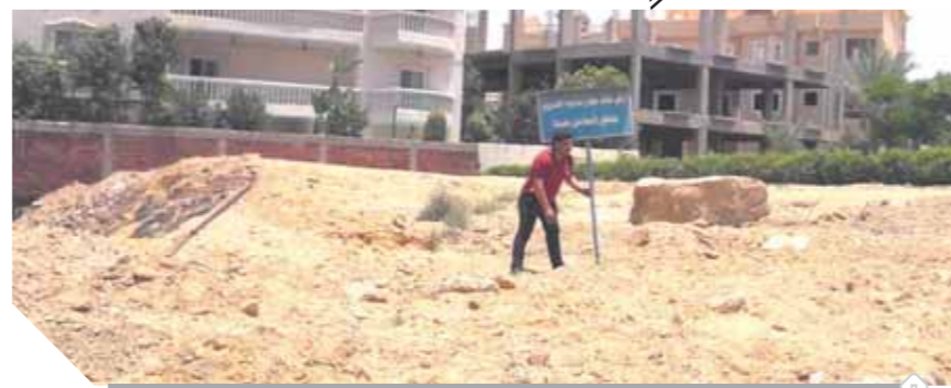
معاينة المخالفين فى الشرق

لعدد ٦ قطع أراضٍ لعدم إثبات الجديدة والبناء خلال المهلة المقررة. وأضاف رئيس الجهاز أنه تم إلغاء التخصيص لعدد ٢٠ قطعة أرض أخرى، وذلك لعدم الالتزام بسداد المستحقات المالية. وأكد رئيس الجهاز أنه لا تعاون فى استرداد حق الدولة والحفاظ على الطابع العمرانى بمدينة الشرق.