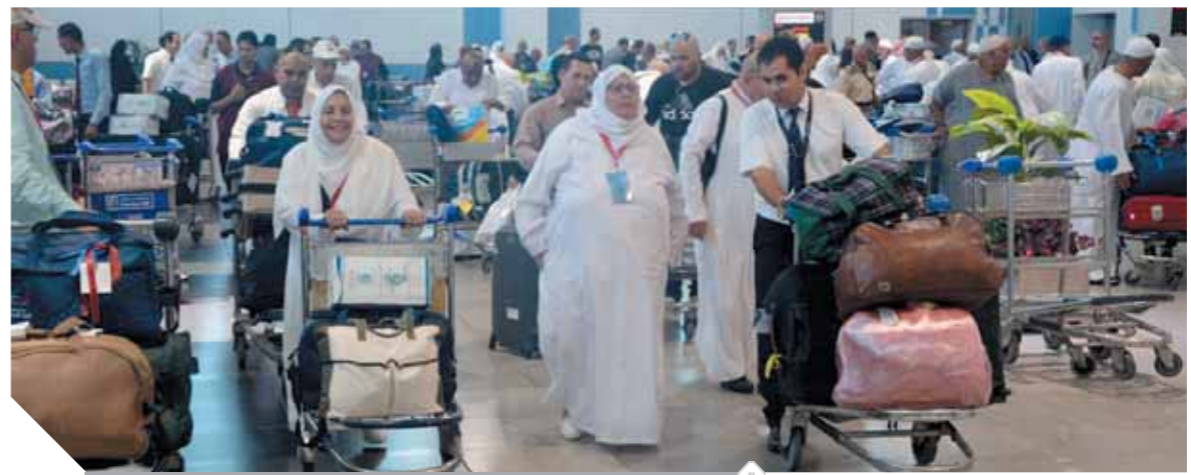
مطار القاهرة يستقبل طلائع حجج بيت الله الحرام