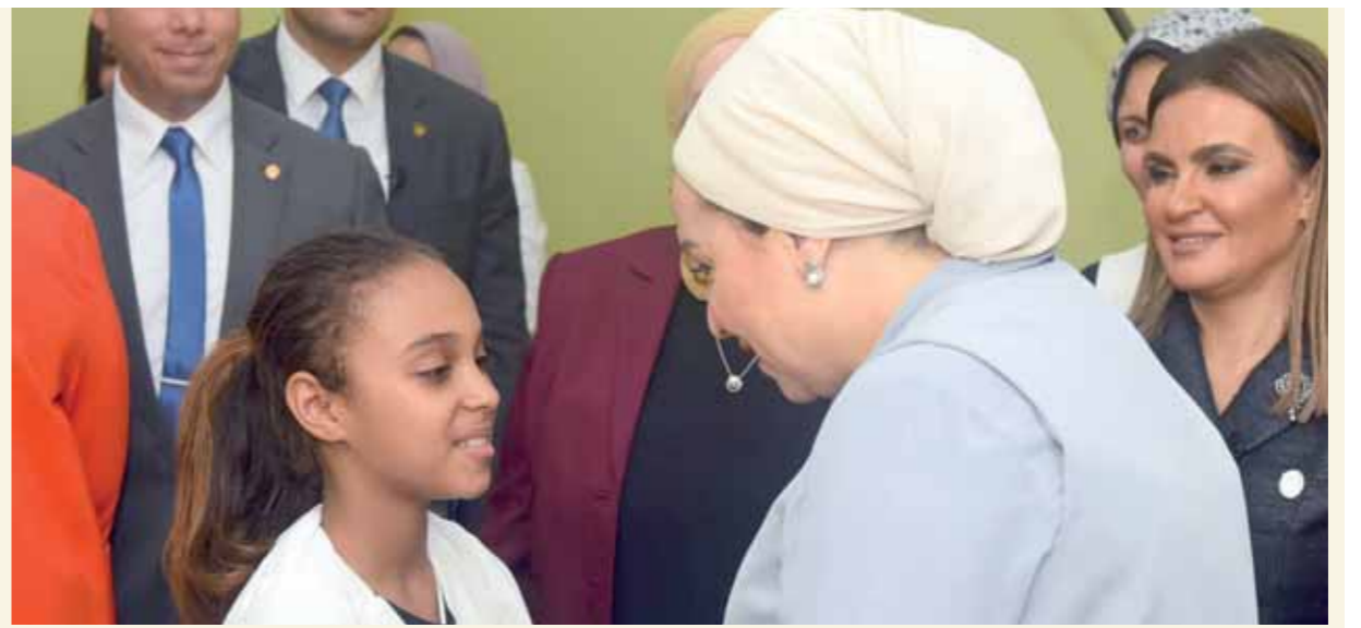
السيدة انتصار السيسى قرينة رئيس الجمهورية أثناء افتتاحها دار رعاية الفتيات بالعجوزة

قامت السيدة انتصار السيسى قرينة رئيس الجمهورية أمس بافتتاح دار رعاية الفتيات بالعجوزة وقامت بجولة تفقدية بالدار تابعت خلالها الأنشطة الفنية والرياضية للنزيلات، وتفقدت السيدة حرم الرئيس الحالة المعيشية للفتيات بالدار. وأوصت بضرورة توفير كافة