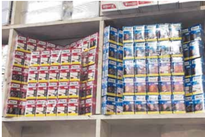
شركات السجائر تعلن أسعارها الجديدة

وبناء عليه أعلنت شركة المنصور الدولية للتوزيع وكيل امبيريال توباكو العالمية وشريك التصنيع للشركة الشرقية للدخان عن أسعار بيع منتجاتها المذكورة. يذكر أن «المنصور» والشرقية للدخان تعتمدان على سياسة بيعية تعتمد على إنتاج منتجات مطابقة للمواصفات وتتمتع بجودة عالية وبأسعار تنافسية لتقبل عليها أكبر شريحة من جمهور المستهلكين، بالإضافة إلى إلزام التجار والموزعين بعدم تجاوز الأسعار التي تحددها الشركة بهدف الحفاظ على استقرار السوق ومراعاة محدود الدخل وهو الأمر الذي يدخل في نطاق دور المنصور أو الشرقية للدخان في الخدمة المجتمعية من خلال الحفاظ على استقرار الأسعار قدر الإمكان.