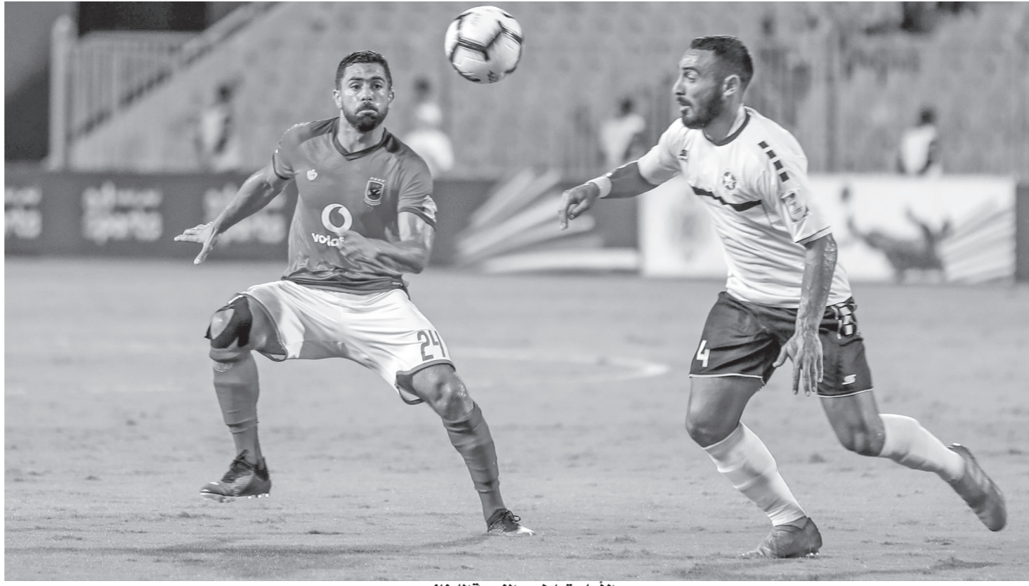
الأهلى تعادل مع النجمة اللبنانيى