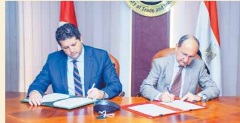
وزير الصناعة المصري والتونسي خلال الاجتماع

شراكة بين القطاعات الواعدة، وبصفة خاصة في مجالات الصناعات الإلكترونية والصناعات الغذائية للسيارات والغزل والنسيج والملابس الجاهزة. كما تم الاتفاق على أهمية تفعيل دور مجلس الأعمال المصري التونسي المشترك وتكثيف لقاءات وتجمعات رجال الأعمال في كلا البلدين، فضلاً عن دراسة توقيع بروتوكول تعاون بين المراكز التكنولوجية المصرية والمراكز الفنية التونسية في مجالات الصناعات الغذائية والزراعية والجلود والأحذية والمنسوجات ومواد البناء وكذا الصناعات الكيماوية والهندسية والأثاث والتعبئة والتغليف، كما تضمن الاتفاق عقد الاجتماع الحادي عشر لفريق العمل المصري التونسي المشترك في مجال الاعتراف المتبادل بشهادات المطابقة بين الجانبين خلال شهر أكتوبر المقبل بالقاهرة. وأوضح الوزير أن الاجتماع قد أكد أيضاً أهمية تعزيز التعاون المصري التونسي المشترك في دول القارة الأفريقية خاصة في ظل الحضور المصري القوي في منطقة شرق ووسط أفريقيا والتواجد التونسي البارز في غرب أفريقيا، وفي هذا الإطار وجه الوزير التهنئة للجانب التونسي على انضمام تونس مؤخرًا لتجمع دول الكوميسا الأمر الذي سيشجع