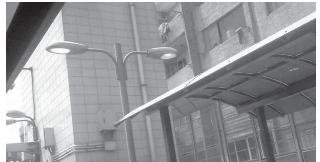
أعمدة الإنارة مضاءة نهاراً ولم يبتذل أحد المسئولين إليها

محطات مترو الأنفاق، وأضاف الدكتور حمدي البرغوثي، خبير النقل الدولي، أن جميع الخطوط التي يسير عليها مترو الأنفاق ملك لهيئة المترو، تستطيع أن تقوم بتأجيرها عبر لافتات إعلانات بطول المترو، مثل طريق مصر الإسكندرية الصحراوية، مطالبا بعمل إدارة تسويق وقسم إعلانات، يقوم بتأجير متر في مترين بمائة ألف جنيه في السنة، موضحة أن طول الخط من حلوان إلى المرج، لا يقل عن مائة كيلو، ما يعني أن هناك مائة ألف متر، مؤكداً أن هيئة