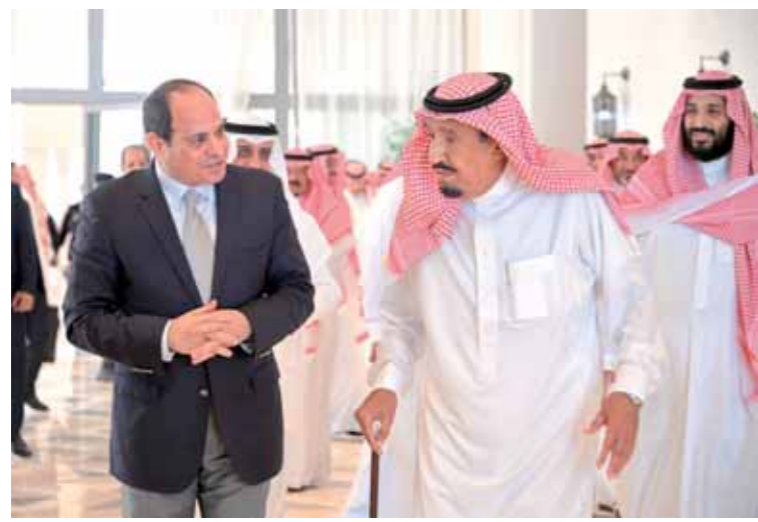
الملك سلمان يستقبل الرئيس السيسي بمدينة نيوم

رئيس الوزراء، وزير الدفاع، وعباس كامل رئيس المخابرات العامة، حيث تم خلال اللقاء التشاور وتبادل وجهات النظر حول آخر مستجدات الأوضاع في المنطقة والقضايا ذات الاهتمام المشترك، وكذلك مجمل العلاقات الثنائية الأخوية بين البلدين، وقد أقام الملك سلمان مأدبة غداء على شرف الرئيس بمناسبة الزيارة.