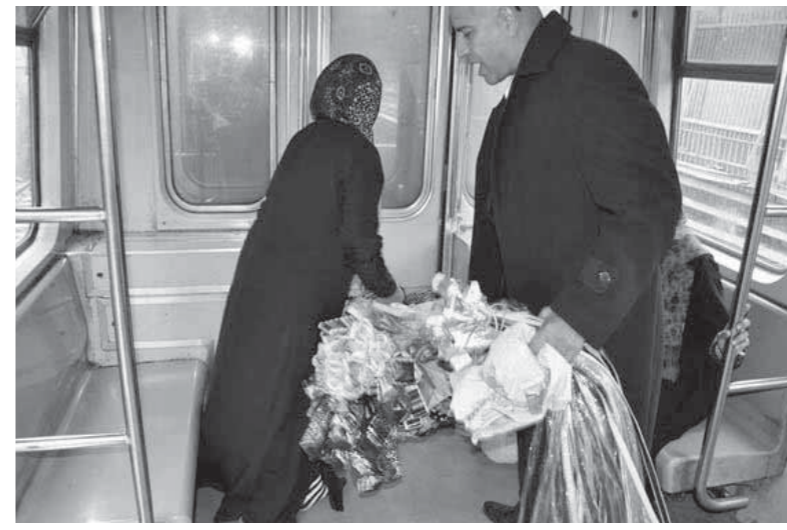
الباعة الجائلون يحتلون عربات المترو

أزمة الباعة الجائلين داخل عربات مترو الأنفاق، باتت مشكلة تؤرق الجميع، نتيجة لأصوات الباعة المرتفعة لعرض بضائعهم، وكأنك تقف في سوقية، وليس وسيلة مواصلات، كل بائع يعلو بصوته على الآخر لجذب الانتباه، سيدات ورجال وأطفال ومراهقون الجميع باعة يحملون بضائع مختلفة منها الملابس وأدوات المطبخ واكسسوارات وأخرى مناديل لزوم التسول بطرق مختلفة. حالة من الغضب أصبحت تتاب جميع رواد المترو، خاصة بعربة السيدات التي يقتحمها البائعون الرجال ويمرون بين السيدات ذهاباً وإياباً لبيع وعرض بضائعهم مما يسبب الكثير من المشاجرات مع السيدات داخل العربة. ويرغم محاولات كثيرة من قوات الأمن لمطاردة هؤلاء البائعين من المترو، وبالرغم من زيادة غرامة البيع داخل عربات المترو، بالخطوط الثلاثة إلى 50 جنيهاً بدلاً من 15 جنيهاً، بالإضافة إلى مصادرة بضائعهم، ولكن كل لم يمنع تسلسل الباعة الجائلين في المترو.