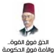
الدق فوق القوة، والامة فوق الحكومة