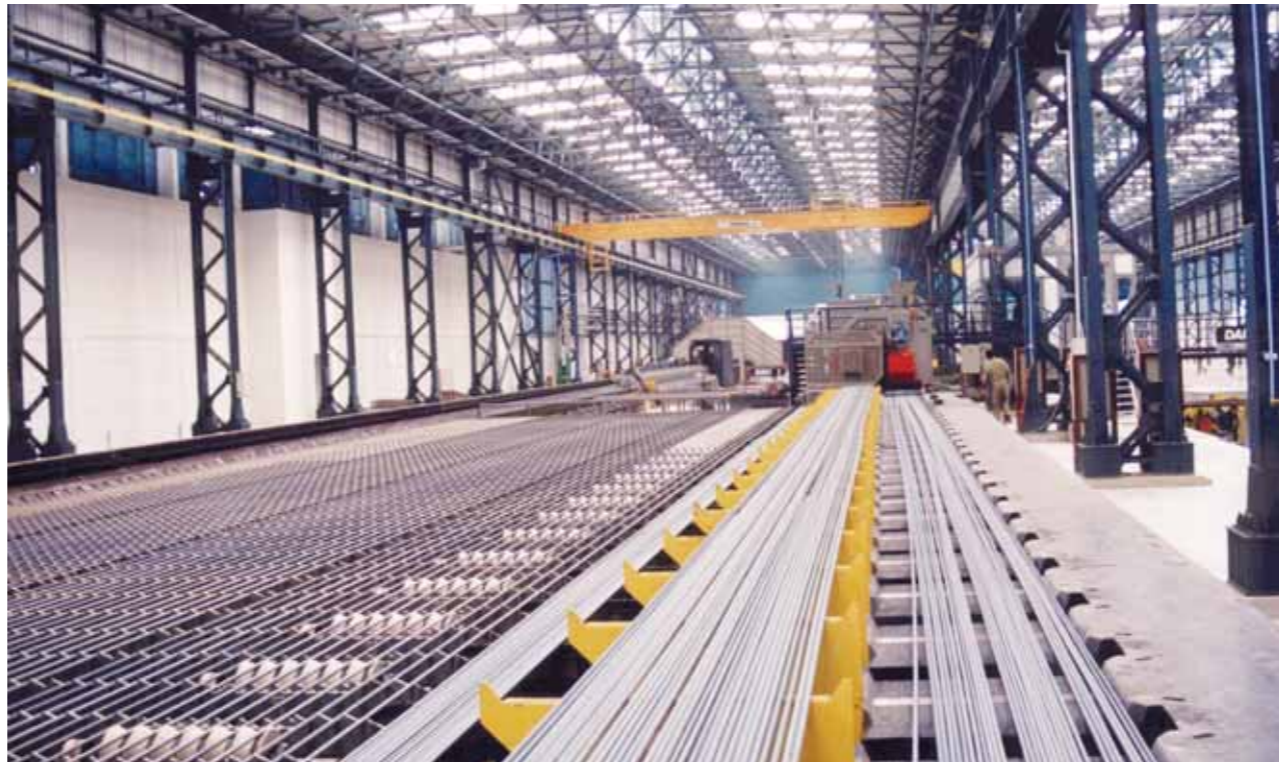
صناعة الصلب المحلية تواجه خطر الإغراق بنظام «الأوف شور»

لأن المبدأ الحاكم في التجارة العالمية وفي قوانين وأعراف الدول الصناعية القوية هو: «المعاملة بالمثل»، قامت الصين بالرد القوي على الأمريكيان وفرضت رسوماً حمائية مساوية لما فرضه الأمريكيان على العديد من منتجاتها التي يتم تصديرها لأمريكا وغيرها من الدول على مستوى العالم مثل الزبدة، الخمر، الموسيقى، وما يقمته 50 مليار دولار من المنتجات، ما يعنى ارتفاع أسعار السلع الأمريكية في السوق الصيني وعدم تنافسيتها، مقارنة بالسلع المثيلة في دول أخرى، ولم يختلف الوضع في أوروبا عنه في الصين فقد بدأت أوروبا في تحقيقات الحماية وأصدرت قرارات يوم 18 يوليو الماضي بفرض حصص استيرادية على منتجات الصلب تبلغ في مجملها 4 ملايين طن وهو ما يعادل متوسط الواردات السنوية خلال الثلاثة أعوام الماضية، يبدأ بعدها فرض رسوم جمركية قدرها 25% على جميع واردات الصلب بعد انتهاء فترة تلك الحصص والتي أعطيت لها مهلة 200 يوم تنتهي في الأسبوع الأول من فبراير 2018. كان من نتيجة ذلك أن سارع المستوردون الأوروبيون باستيراد منتجات صلب نهائية قبل انتهاء المهلة واستكمال الحصص الاستيرادية وهو ما رفع أسعار التصدير العالمية، وكذلك الأسعار المحلية في أوروبا من حديد تسليح ومسطحات صلب، حيث لوحظ في شهر أغسطس الماضي أن