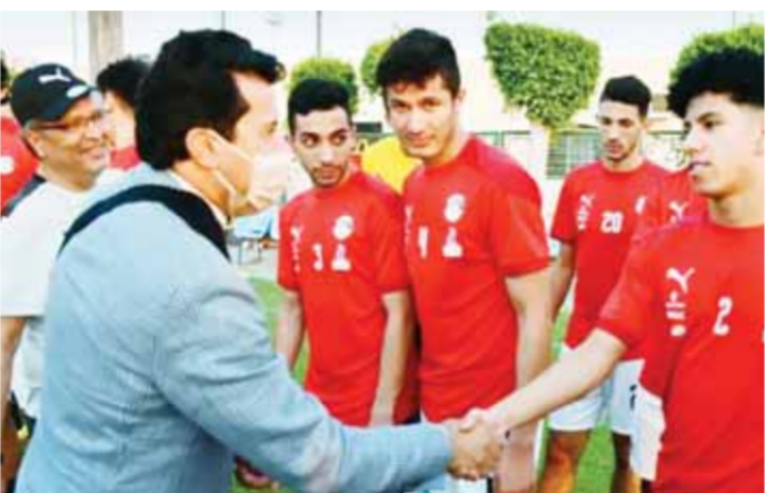
وزير الرياضة حرص على زيارة معسكر المنتخب الأولمبي لمؤازرة اللاعبين

وجارى التنسيق مع شركة مصر للطيران لتحديد موعد إقلاع الطائرة من مطار القاهرة. ويلعب المنتخب الأولمبي مبارياته ضمن المجموعة الثالثة مع منتخبات إسبانيا والأرجنتين وأستراليا، حيث يستهل منتخبا مواجهته في طوكيو بلقاء نظيره الإسباني يوم ٢٢ يوليو على ملعب سابورو دوم. في المقابل، وصل منتخب إسبانيا أمس إلى العاصمة اليابانية، ويخوض الفريق أول تدريباته اليوم بقيادة لويس دي لا فوينتي، وقد انضم للفريق