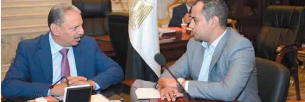
اللواء إبراهيم المصرى يتحدث للوفد