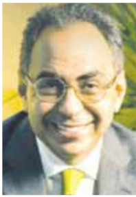
بقلم: د. هانى سرى الدين