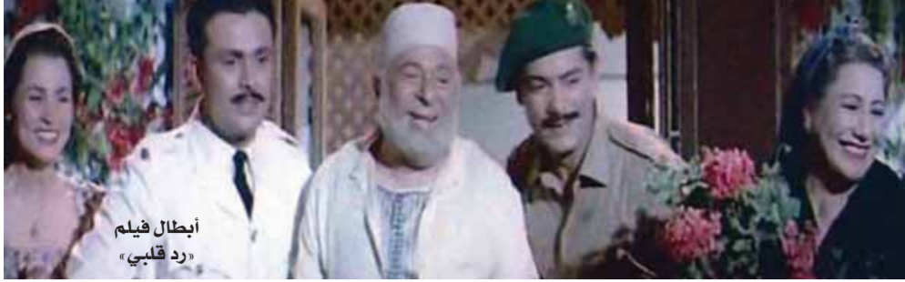
أبطال فيلم «رد قلبي»