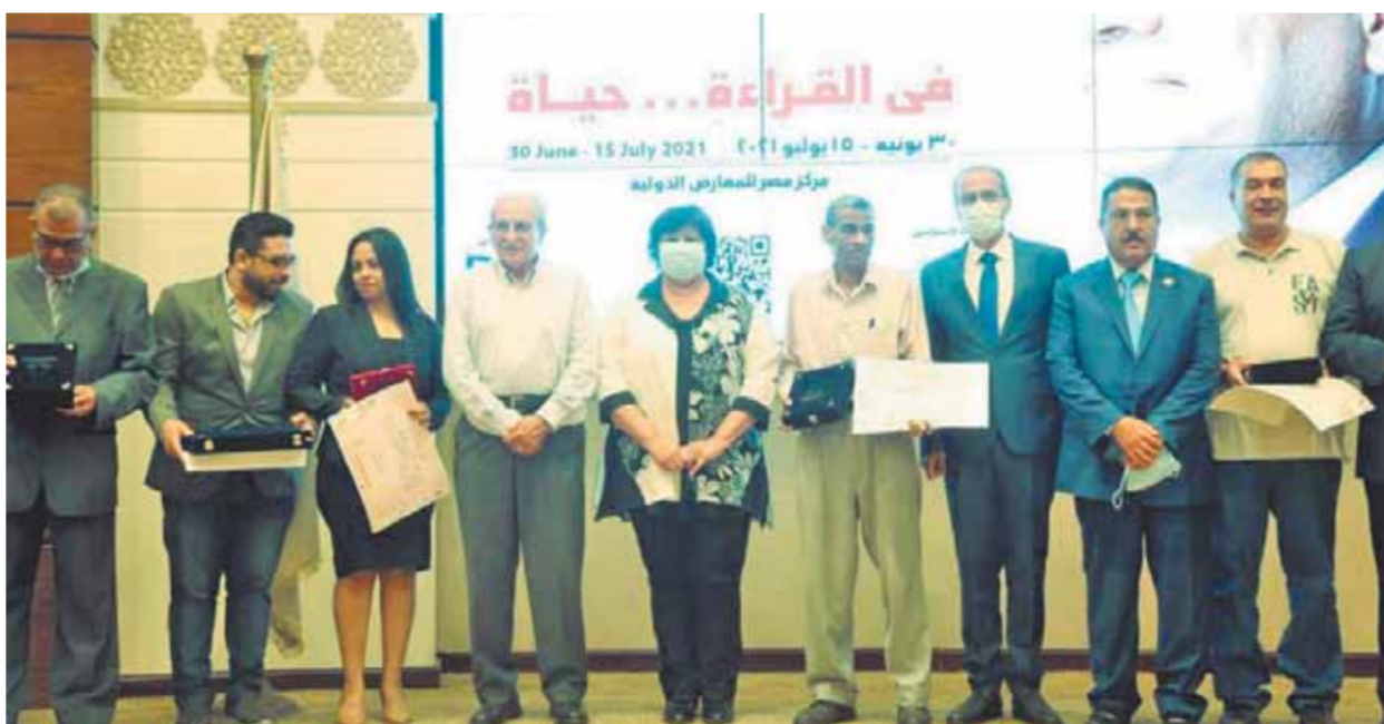
وزيرة الثقافة مع الفائزين فى المسابقة

كتاب ثلاثية صناعة الفيلم، للمؤلف المخرج الكبير على بدرخان، عن هيئة الكتاب. ومجال القصة القصيرة فاز كتاب ما لا يمكن إصلاحه، للمؤلف ميثم الوردانى، وكان الحفل قد استهل بفيلم وثائقي عن الدورة ال٥٢ من معرض القاهرة الدولى للكتاب تضمن المحتويات والأجنحة وأساليب التنظيم.