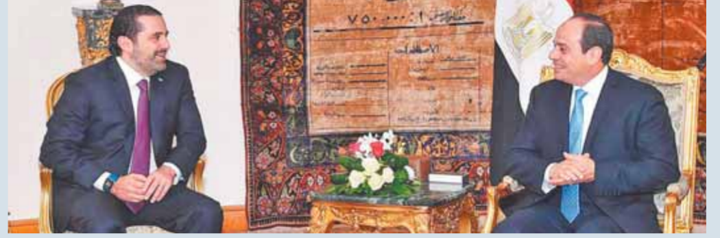
السياسي خلال استقباله الحريري

أمن الخليج يرتبط بالأمن القومي المصري والتنسيق مستمر لمواجهة التحديات