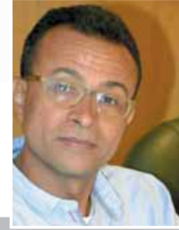
خيرى حسن يكتب: