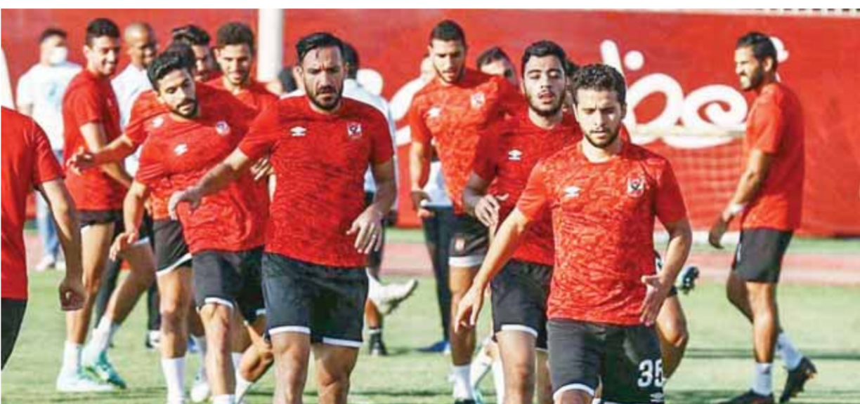
الجديدة واضحة على استعدادات الأهلي للنهائي الأفريقي