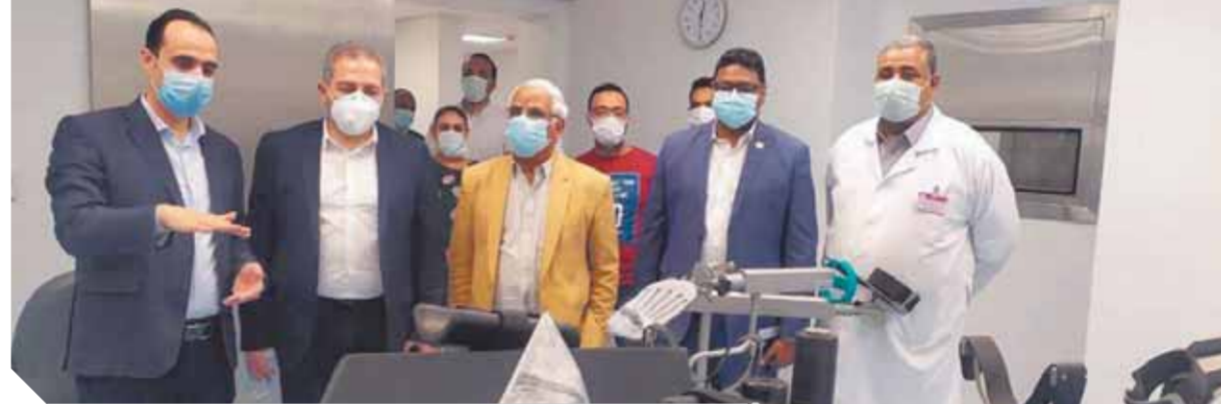
جولة حسام صادق في فرع التأمين الصحي الشامل بالأقصر

كتبت- عبد القادر إسماعيل، أكد الدكتور محمد ميميت، وزير المالية، رئيس الهيئة العامة للتأمين الصحي الشامل، أن الرئيس عبدالفتاح السيسي نجح في تبنى وتنفيذ مشروعات قومية غير مسبوقة، تكاملت معاً لتغيير وجه الحياة على أرض مصر، وتحسين معيشة المواطنين، والارتقاء بمستوى الخدمات المقدمة إليهم، لافتاً إلى أن الرئيس السيسي يبادر بإطلاق منظومة التأمين الصحي الشامل، باعتبارها الأداة الرئيسية للإصلاح القطاع الصحي في مصر، وتحقيق حلم الرعاية الصحية الشاملة والمتكاملة لكل المواطنين. ووجه الوزير بتعزيز جولات المتابعة الميدانية إلى محافظة الأقصر لوضع المسامات النهائية لمنظومة التأمين الصحي الشامل بها تمهيداً للإطلاق الرسمي اعتباراً من أول يوليو المقبل، في إطار خطة الدولة لمد مظلة هذا النظام الجديد إلى باقي محافظات المرحلة الأولى التي تضم الأقصر، والإسماعيلية، وأسوان.