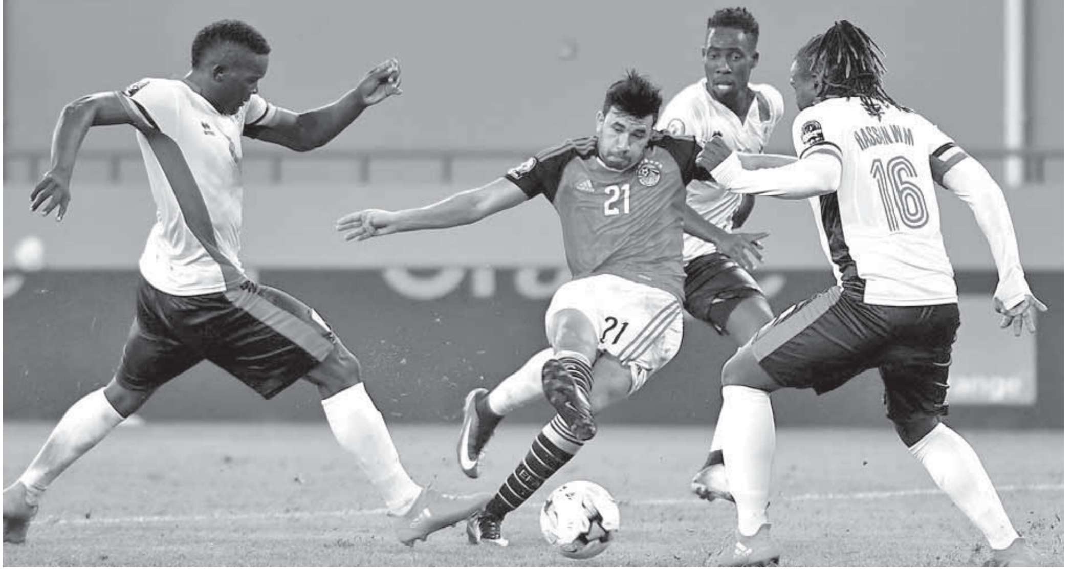
منتخب مصر في مهمة تاريخية أمام أوروغواي