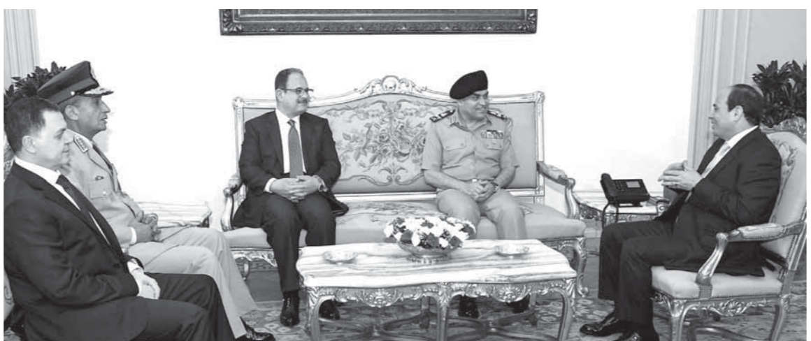
الرئيس السيسى خلال استقباله الفريق أول صدقى صبحى واللواء مجدى عبدالغفار والفريق محمد زكى واللواء محمود توفيق

جذور الإرهاب. كما عقد الرئيس اجتماعاً آخر مع اللواء مجدى عبدالغفار وزير الداخلية السابق، بحضور اللواء محمود توفيق عبدالجواد وزير الداخلية الجديد. وتقدم الرئيس بخصالص الشكر للواء مجدى