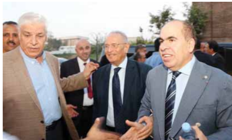
أبوشقة، يتوسط الهضبي، ومدينة،