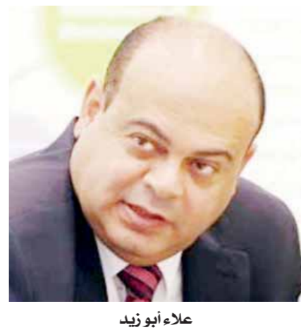
علاء أبو زيد

بشدة خلال الفترة الماضية، خاصة بعد عدم تنفيذ لتصريحاته ووعوده السابقة الخاصة بإقامة مشروعات استثمارية عملاقة من بينها «تطوير جزيرة روميل وهضبة عجيبة باستثمارات خيالية، وإقامة نافورة راقصة في البحر على غرار نافورة دبي الشهيرة»، واكتفى فقط بإنشاء نافورة مضيئة على الكورنيش أمام استراحته الخاصة وأخرى أمام مبنى المحافظة. وابتعد المحافظ عن إقامة أية مشروعات جادة وأدار ظهره لرجال الأعمال الجادين، وتفرغ فقط للظهور في وسائل الإعلام وحفلات التكريم، ناسباً لنفسه إنجازات المحافظين السابقين.