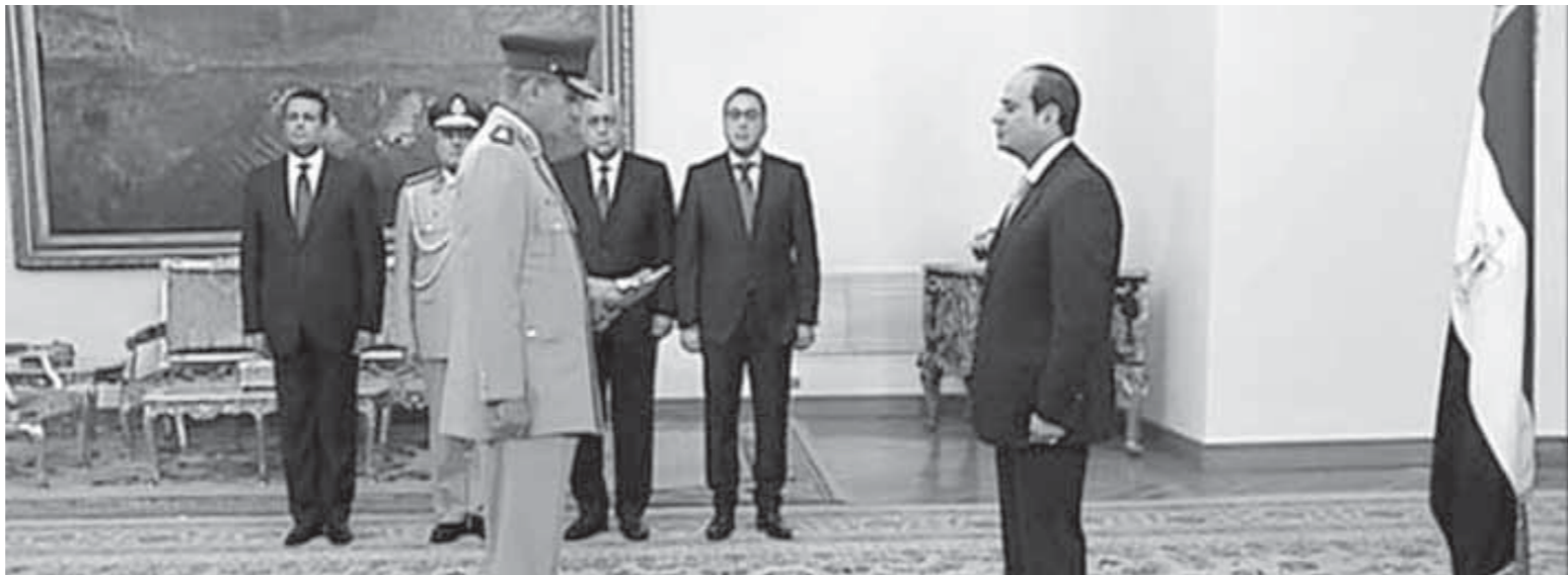
وزير الدفاع الجديد محمد زكى يؤدى اليمين الدستورية أمام الرئيس

12 وزيراً جديداً أبرزهم الدفاع والداخلية واحتفاظ 20 وزيراً حالياً بحقائبهم.. وتعيين 15 نائب وزير