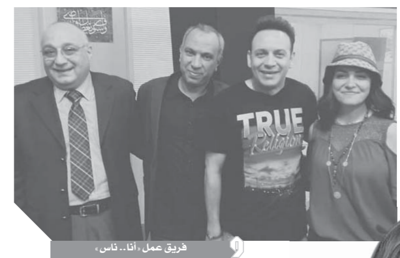
فريق عمل «أنا.. ناس»