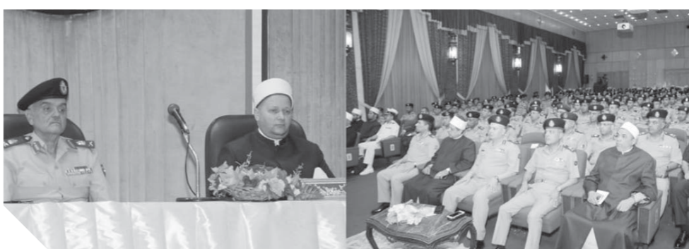
جانب من الاحتفال الذى نظّمته القوات المسلحة بمناسبة ذكرى العاشر من رمضان ١٤٤٠ هـ

كما أصدر الفريق محمد فريد رئيس أركان حرب القوات المسلحة توجيهات لتهنئة قادة وضباط وضباط الصف والصناع والعسكريين والجنود ورجال القوات المسلحة بسيباه، وكذا المشاركين بقوات حفظ السلام والعاملون المدنيين بالقوات المسلحة بهذه المناسبة نفسها.