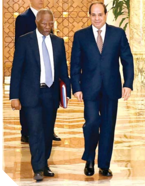
الرئيس خلال استقباله تابومبيكي

كتب- ناصر عبدالمجيد: يفتح الرئيس عبدالفتاح السيسي، اليوم، عدداً من المشروعات القومية، أبرزها محور روض الفرج وامتداد محور المشير. وكان «السيسي» قد تقفد محور روض الفرج، منتصف الشهر الماضي، حيث وضع الجزء الأخير من الكوبري، استعداداً لافتتاحه، ويعتبر كوبري روض الفرج المعلق، أضخم كوبري معلق في العالم، وتنفذه الهيئة الهندسية للقوات المسلحة وشركة المقاولون العرب، ويمثل نقلة نوعية في خريطة الطرق بالقاهرة الكبرى، ويقع الكوبري المعلق ضمن المرحلة الثالثة من محور روض الفرج، ويبدأ من ميدان الخلفاوي على كورنيش النيل أمام أبراج أخاخان والجهة المقابلة من النيل بحيزرة الوراق مروراً بمنطقة بشنيل، وتجدر الإشارة إلى أن الرئيس السيسي قد تقفد يوم الجمعة الماضي منطقة النخيل في نهاية محور المشير التي تم تطويرها من قبل الشركة الوطنية للطرق التي قامت بتوسعة حرم الطريق وإزالة المخلفات المتراكمة، وإقامة سلسلة مشروعات خدمية للمواطنين على جوانب الطريق، وقد وجه الرئيس في هذا الإطار باستمرار التوسع في عملية التطوير الخدمي والتنسيق الحضاري للمنطقة على نحو يخدم أهالي المنطقة ويوفر فرص عمل لهم، حيث تقفد السيسي أحد المتاجر التي كان قد وجه بتشبيدها وتسليمها لمواطن من أهالي المنطقة الذي كان يفتقرش الطريق من قبل، وذلك حرصاً على سلامته وتوفير عمل له.