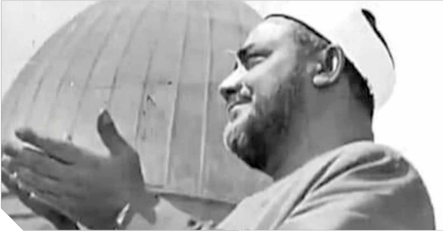
الكروان الريانى الشيخ سيد النقشبندى

رحمه الله- فقال إن الشيخ سيد النقشبندى علم من أعلام مصر الأمة العربية والعالم الإسلامى، طيب الله ثراه، وجعل الجنة مثواه. النقشبندى وهب حياته لتجوى السماء، موهبة فنية إسلامية نادرة حافظ لأهنتها على النغم الأصيل واللحن السماوى، صوته الإعجازى يفيض بالمعنى والروحانية الفائقة. يعرف كيف تنطق الكلمة العربية النطق الصحيح لديه والإمامت وشافية غير عادية وروعة اللحن. الشيخ سيد النقشبندى من حراس الموسيقى العربية الأصيلة والنغم الشجي الذى يغيب رويدًا رويدًا فى هذه الأيام، إنه من البقية الباقية الصالحة وللولاة لاقتدنا الأصالة فى مجال التطريب الذى يسمو بالوجدان، ولدينا تليفزيونات كثيرة جدًا تخصص للشيخ وموهبته الكبيرة من علماء وشعراء والمخين الكبار سواء من مصر أو من الدول العربية والإسلامية رحمه الله وأسمه. ● متى بدأت علاقة الشيخ النقشبندى بالإذاعة والتليفزيون؟ ● الشيخ النقشبندى كانت له شهرة كبيرة منذ الخمسينيات بالدول العربية، حيث كانت له تسجيلات قرآنية بإذاعة مكة وهذا مدون بمجلة الإذاعة السعودية، وكذلك سوريا، حيث سجل الكثير بالمسجد الأموى وبالتلفاز والإذاعة السورية، وكانت المساجد بالمشام قاطبة قبل الإفطار برمضان تدع تسجيلات الشيخ الكبير، وهذه كانت سنة حميدة من أهل الشام العاشقين للشيخ سيد النقشبندى رحمه الله. أما بمصر من واقع مفكرة الشيخ لعام ١٩٦٦م وبالتحديد يوم الثلاثاء الموافق ٢٧ ديسمبر ١٩٦٦م (القاهرة) دُعيت من الأستاذ أحمد فراج لتسجيل حلقتين بالتليفزيون بالمسيدة زينب. يوم الخميس ٢٩ ديسمبر استمعنا إلى تسجيل الأستاذ أحمد فراج بالتليفزيون، وبعد ذلك استمرت التسجيلات للتلفاز فى رحاب الإيهان - نور الأسماء الحسنى، حلقات الهدى والنور، واستمرت التسجيلات حتى عام ١٩٧٥م.