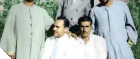
البرانيين فى وداع إمام المداحين أثناء تشييع جنازته

● هل شارك الشيخ رحمه الله مهتمًا بالادب فى هذا الوقت؟ ● نعم الشيخ النقشبندى رحمه الله فى الشعر والنثر فأحب نقسه فى أحسن ما يكون إذا كان إذا مدح الرسول عليه الصلاة والسلام أخذته حالة لا ينظر إلى أحد بل يكون فى حال يعلمه الله. وبدا الناس يتحدثون عن ذلك باستفاضة. ووصلت شهرة الشيخ النقشبندى وحالته الصوتية الإعجازية إلى المسئولين فى محافظة سوهاج وما حولها لمديرية أسبوط قبل أن تصبح محافظة، وكان ذلك فى عام ١٩٤٥- فطلبوه للمشاركة فى حفل يقامه مدير المديرية الشاعر عزيز أباطة، وظهر الشيخ سيد على المسرح لأول مرة ومعه بطائنه وبدأ بتصديده سلوا كنوس الطلاء أباطة بقصيدة «يا جارة الوادى»، فكان احتفاء الشاعرين به رائعًا. وبعد ذلك كان دائمًا يدعو الشاعر عزيز باشا أباطة لمنزله ليسعد من هذا الفيض الريانى..