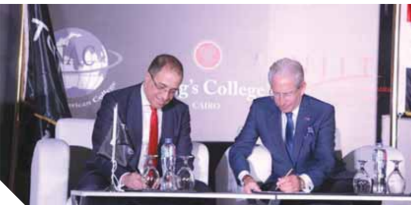
جانب من توقيع العقود

للدور الأساسى الذى لعبه المجلس فى ترشيح جامعة نيو جيرسى للتكنولوجيا NJIT للشراكة مع تطوير مصر، فى حديثه عن الشراكات المثمرة بين إنجلترا ومصر، لا سيما فى قطاع التعليم، صرح السير جيفرى آدمز: «كينجز كوليدج هى مدرسة مستقلة تحظى باحترام كبير فى إنجلترا، ولديها أكثر من ١٤٠ عامًا من التاريخ، يسعدنى أنها ستفتتح قريبًا أول مدرسة لها فى مصر، جنبًا إلى جنب مع شريكها تطوير مصر، تزدهر الروابط التعليمية بين بريطانيا ومصر على جميع المستويات، بدعم قوى من الحكومتين، وإنه لأخبار سارة أن كينجز كوليدج القاهرة ستقدم قريبًا تعليمًا بريطانيًا عالي الجودة لآلاف الشباب المصريين الموهوبين.» ومن جانبها قالت السيدة نيكول شامبين القائمة بأعمال السفير الأمريكى بالقاهرة: «هذه المبادرة التعليمية ستفتح الطلاب المصريين فرصة الحصول على التعليم الأمريكى، وستمنحهم من المنافسة على الوظائف التى تتطلب مهارات عالية ومساعدة مصر على تطوير اقتصادها القائم على المعرفة. هذه المبادرة تعتمد على أربعة عقود من استئجار حكومة الولايات المتحدة فى تعزيز التعليم فى مصر، بما فى ذلك بناء أكثر من ٢٠٠٠ مدرسة، وتدريب أكثر من ١٠٠ ألف معلم، وتوفير أكثر من ٣٥٠ مليون دولار فى هيئة منح دراسية وتبادلًا أكاديمية، ودعم الروابط الجامعية.»