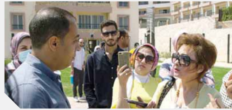
مدير مشروع وادي دجلة فى العين السخنة خلال الجولة

يقع مشروع «مورانو»، على مساحة ٤٧٠ ألف متر مربع، الجدير بالذكر أن وادي دجلة العقارية قد فازت بأرض هذا المشروع من خلال توقيع عقد الشركة فيما بينها وبين الشركة المصرية للسباحة والفنادق (إيجو) وقامت الشركة باستغلال هذه الأرض لإنشاء مشروع مورانو باعتبارها من أحد أهم المشروعات التى تقدها الشركة فى هذه المنطقة لما يمتلكه من العديد من المميزات أهمها مرور مجرى العين السخنة فى أرضه الذى يعطيه ميزة وتقردا من غيره من المشروعات بالسخنة.