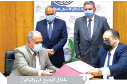
خلال توقيع البروتوكول

التابعة لوزارة الإنتاج الحربى، والشركة الوطنية المصرية لتطوير التنمية الصناعية التابعة لقطاع الهياكل المعدنية، وذلك بحضور اللواء صلاح الدين حلمى رئيس الشركة القابضة للنقل البحرى والبرى، وأعرب هشام توفيق وزير قطاع الأعمال العام عن ترحيبه بمواصلة التعاون المثمر مع كل من وزارة الإنتاج الحربى والهيئة العربية للتصنيع وجهاز مشروعات الخدمة الوطنية لدعم الصناعة الوطنية، وذلك فى إطار جهود النهوض بالشركة التجارية