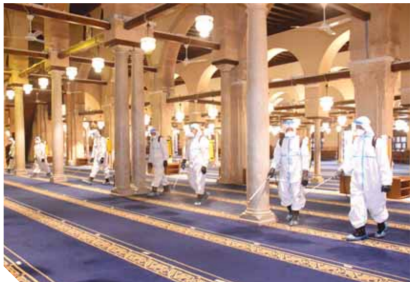
خلال عمليات تعقيم المساجد