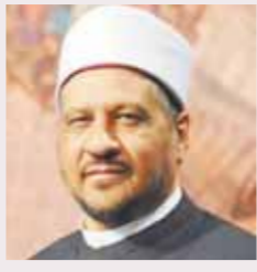
د. مجدى عاشور مستشار مفتي الجمهورية

● يحرض الناس في صلاة التراويح في رمضان على الصلاة والسلام على سيدنا رسول الله بعد صلاة العشاء وبين الركعات، فانكر عليهم بعض الناس وقال: إنها بدعة، فما الحكم؟ أولاً: أمر الله تعالى بالصلاة والسلام على النبي على جهة الإطلاق في قوله سبحانه: ﴿إِنَّ اللَّهَ وَمَلَائِكَتَهُ يُصَلُّونَ عَلَى النَّبِيِّ يَا أَيُّهَا الَّذِينَ آمَنُوا صَلُّوا عَلَيْهِ وَسَلِّمُوا تَسْلِيمًا﴾ [الأحزاب: ٥٦]، والأمر المطلق يستلزم عموم الأشخاص والأحوال والأزمنة والأمكنة، أي أنه لا يتقيد بزمان دون زمان في مسائلنا هذه. ثانياً: من هذه الأدلة التي وردت وعمومها أخذ الفقهاء بأن أمر الذكر والدعاء على السعة، وأن المنكر في هذه المسألة قد ضيق واسعاً، وخالف هُدْيَ النبي من توسعته في أمر الذكر والدعاء، فضلاً عن إنكاره ما حثَّ عليه الشرع من كثرة الصلاة والسلام على النبي صلى الله عليه وآله وسلم في كل وقت وحال. والخلاصة: إن ما يفعله الناس من الصلاة والسلام على النبي بين ركعات صلاة التراويح جائز، بل مستحب لعموم الأدلة في ذلك.