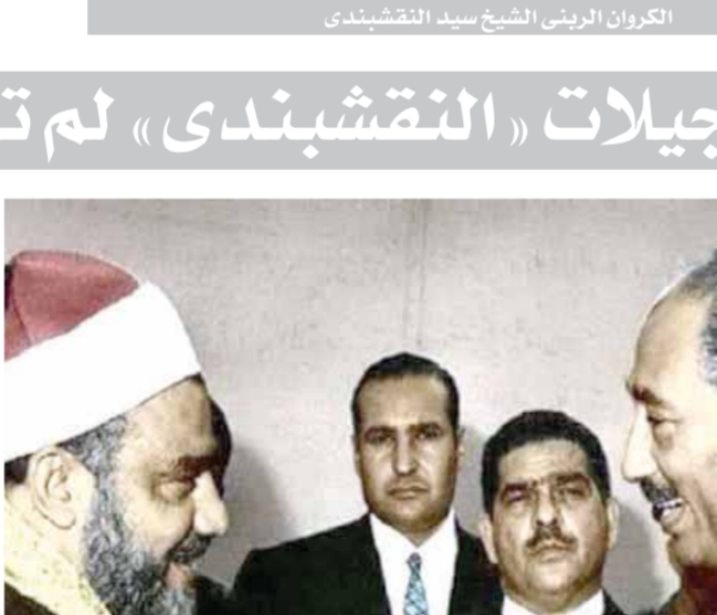
الشيخ النقشبندى فى مصيف بلدة دمشق ١٩٦٠

والتنسبة للإذاعة بدأت التسجيلات ٢٠ أغسطس ١٩٦٧م بأدعية الباحث عن الحقيقة سيدنا سلمان الفارسى قصة محمد عبدالحليم عبد الله العنان الموسيقار محمد الموجى وتوات التسجيلات الإذاعية المتعددة جدًا حتى عام ١٩٧٥م، سواء لإذاعة البرنامج العام وصوت العرب والشرق الأوسط وكذلك التسجيلات القرآنية وبدانيتها بمسجد مولانا الإمام الحسين عام ١٩٦٨م وتعامل الشيخ- رحمه الله- مع كبار الملحنين أمثال الموسيقار الموجى.. وحلمى أمين وعبدالعظيم محمد ومحمود الشريف وأحمد عبدالقادر وحسين صديقى، ويلج حمدي، وإبراهيم رجب وغيرهم الكثير. ● هل واجهتمكم معوقات فى جمع تراث الشيخ النقشبندى؟ ● المعاناة الحقيقية التى نعيشها إن لدى بعض الشيخ رحمه الله غالبية تسجيلاته مدونة بمفكراته للإذاعة والتلفاز، واعتقد أن أكثر من ٨٠% من هذه التسجيلات لم تر النور وكثيرًا ما تحدثنا ومطالبنا من خلال البرامج التليفزيونية ولكن بكل أسف لم نجد العمون أو الاتجاه أساسًا للبحث عن هذا التراث العالى وللإيضاح