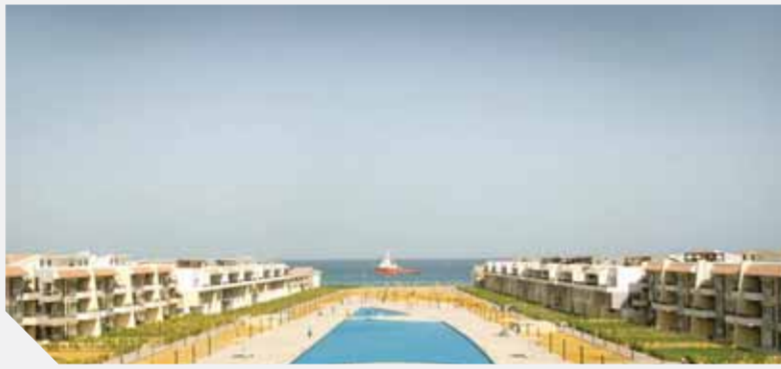
جزء من مشروع وادي دجلة فى العين السخنة

ويضم المشروع نحو ٢٠٠٠ وحدة، بالإضافة إلى فندق سياحى ٤ نجوم، به ١١٠ غرف إلى جانب المطاعم والكافيتريات، وحمامات السباحة، نادى صحي وشاطئ خاص، ويتكون المشروع من ٣ مراحل، تم البدء فى تسليم المرحلة الأولى للمشروع، ويتم استكمال أعمال الإنشاء فى المرحلة الثانية للمشروع، وتستعد الشركة لإطلاق المرحلة الثالثة خلال العام الجارى. واستطاع «بولمار السخنة»، أن يلفت أنظار العديد من العملاء والمطورين لما يقدمه من العديد من الخدمات وكذلك تصميمه المختلف والمتميز، يقع