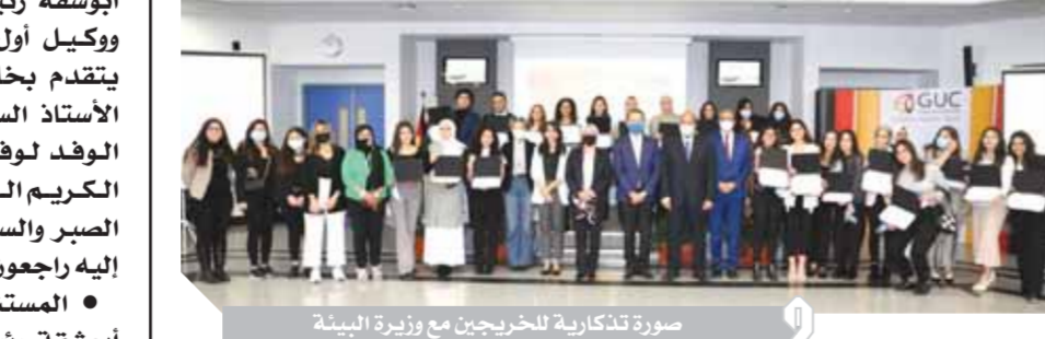
صورة تذكارية للخريجين مع وزيرة البيئة