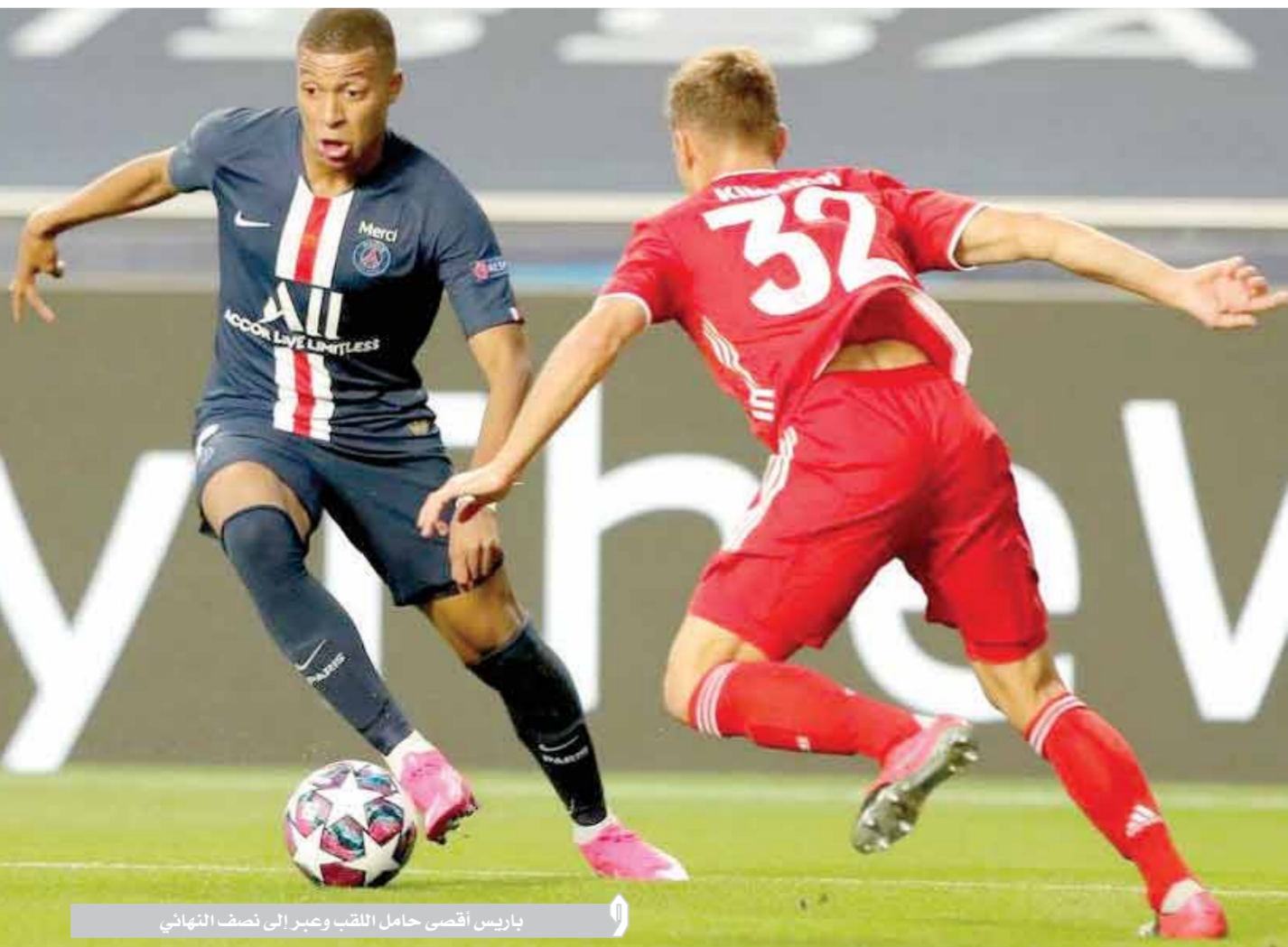
باريس أقصى حامل اللقب وعبر إلى نصف النهائي