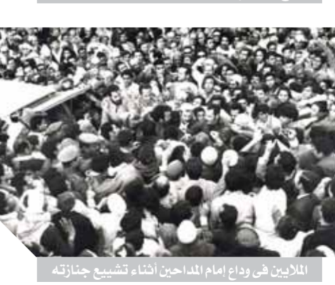
البرانيين فى وداع إمام المداحين أثناء تشييع جنازته