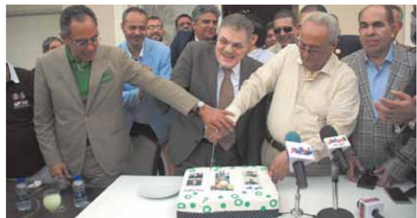
أثناء تقطيع التورتة