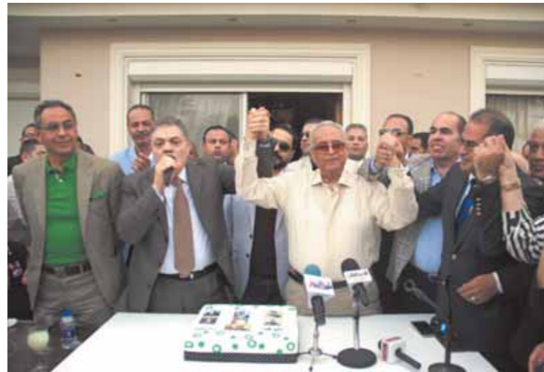
أبو شقة والبدوي أيد واحدة