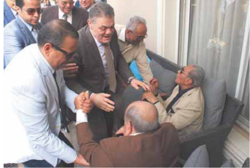
البدوي يسلم على عز العرب وعوده