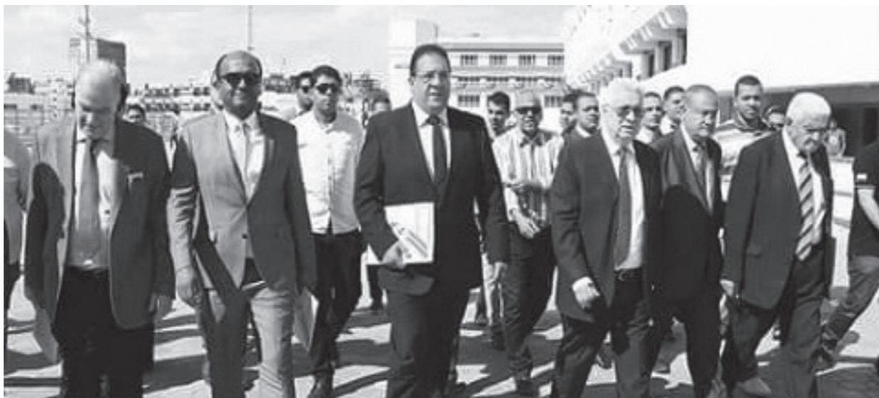
مجلس الزمالك يتعرض لأزمات بسبب اللجنة المالية