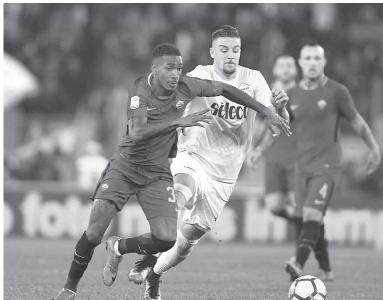
مواجهة ساخنة في ديربي العاصمة بين روما ولاتسيو

ويدخل الروسونيري اللقاء متأثراً بتعادله الأخير ضد ساسولو بنتيجة (1-1)، حيث يحتل المركز السادس برصيد 52 نقطة وسيستضيف نابولي الذي يملك 77 نقطة الذي يحاول اللحاق بيوفنتوس المتصدر برصيد 81 نقطة. ويسعى نابولي لحطفت نقاط اللقاء أسوة باليوفى لمواصلة السعي وراء أهدافهم رغم اختلافها، فيما يحاول ميلان جاهداً اللحاق بالإنتر صاحب الـ 59 نقطة، ومن ثم منافسة روما ولاتسيو أصحاب الـ 60 نقطة والذي سيجتمع بينهما لقاء ناري ضمن مواجهات نفس الجولة الحالية. ويحاول الميلان اقتناص الفرص للرجوع والمنافسة على المركز الثالث، بينما يسعى نابولي لمواصلة تحقيق الثلاث نقاط في مبارياته القادمة أملاً في سقوط يوفنتوس في أي من مبارياته ليتصدر الدوري من جديد، حيث لا يفرق بينهما سوى 4 نقاط فقط. ويخوض اليوفى المتأثر بالطريقة الدرامية التي ودع بها دوري الأبطال مؤخراً على يد ريال مدريد، مباراة سهلة نظرياً على الورق أمام سامبدوريا التاسع، على ملعب تورينو في محاولة لمصاحبه جماهيره الحزبية رغم الفوز الذي حققه على