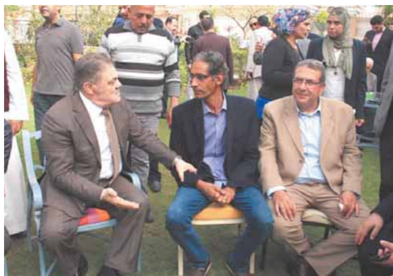
حوار بين البدوي وتهامى ومنصور