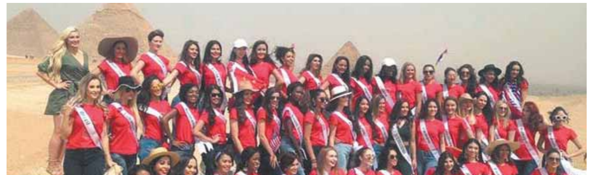
صورة للملكات الجمال عند سفح الهرم