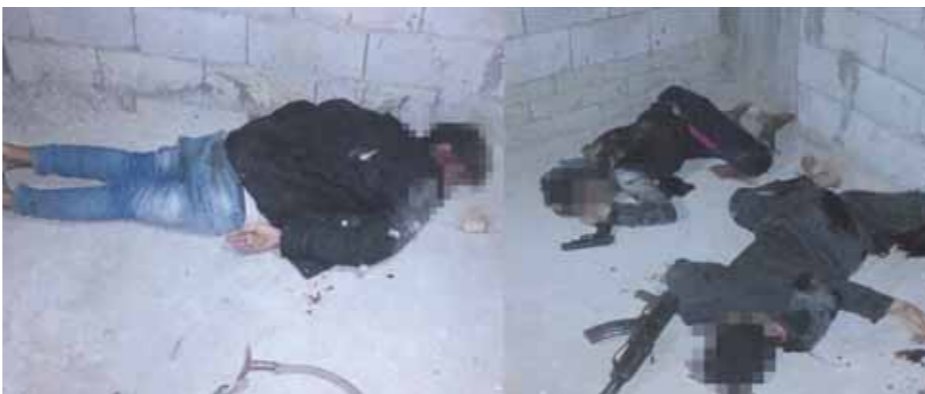
بعض الارهابيين الذين تم تصفيتهم

استشهاد 8 جنود وإصابة 15 وتصفية 14 إرهابياً العملية سيناء: مقتل 27 تكفيرياً وضبط 125 وتدمير وكر للمتطرفين