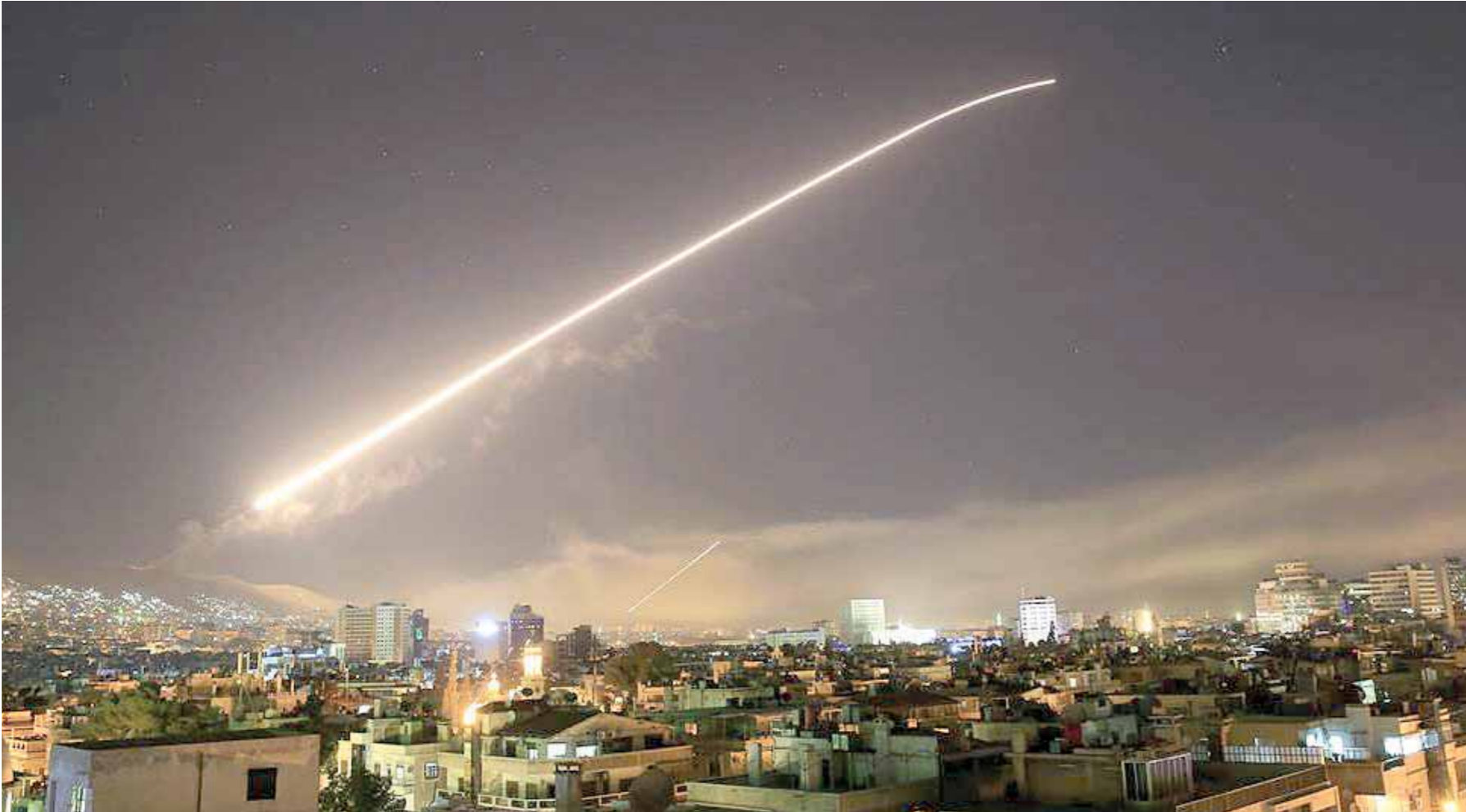
صاروخ اطلقتته البارجة الامريكية على دمشق