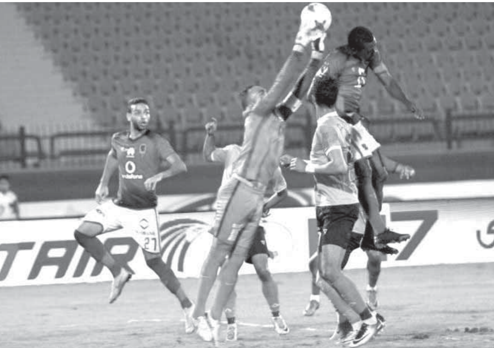
الأهلي تخطف عقبة الداخلية