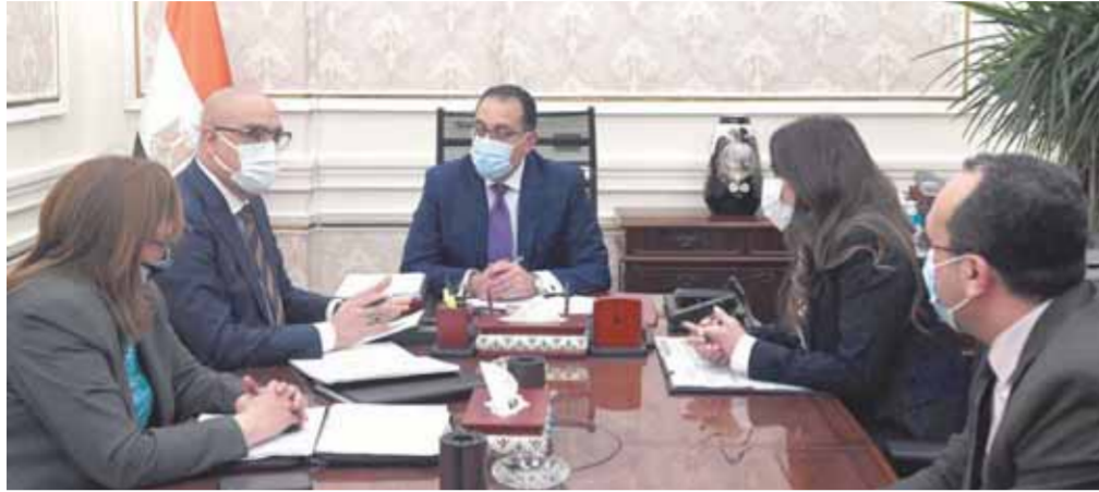
مدبولي خلال اجتماعه أمس مع وزير الإسكان

٤٤٢٥ ألف طن، خلال الفترة منذ يوليو ٢٠٢١ حتى الآن، موضحة أنه من المتوقع أن يبلغ إنتاج مصر من القمح ١٠ ملايين طن عام ٢٠٢٢، مقارنة بـ ٩ ملايين طن عام ٢٠٢١، بنسبة زيادة ١١.١٪، فضلاً عن زيادة مساحة القمح المزروعة بـ ٤.٤ مليون فدان في ٢٠٢١. من ناحية أخرى أكد الدكتور مصطفى مدبولي رئيس مجلس الوزراء، أهمية مشروعات الإسكان التي تنفذها الدولة لتلبية مطالب المواطنين من مختلف شرائح الدخل في الحصول على الوحدات السكنية. وأشار رئيس الوزراء إلى أهمية ما تحهذه هذه المشروعات من انتعاش اقتصادي، وتوفير فرص العمل، مؤكداً ضرورة المتابعة الدورية للبرامج الزمنية لتنفيذ هذه المشروعات، وجودة التنفيذ. جاء ذلك خلال اجتماع عقدته رئيس الوزراء مع الدكتور عاصم الجزار، وزير الإسكان والمرافق والمجمعات العمرانية، لمتابعة موقف تنفيذ المبادرة الرئاسية «سكن لكل المصريين»، وخطط الإسكان المتوسط، بحضور مي عبدالحميد، الرئيس