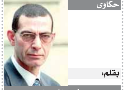
بقلم: د. وجدى زين الدين