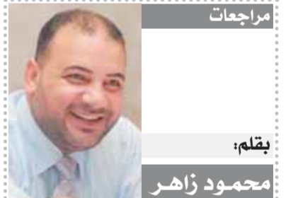
بقلم: محمود زاهر

الحمد لله أنا حاليًا أبدأ مشروعًا فكريًا جديدًا أتمنى من الله أن يوفقني فيه ويعينني عليه. wagdyzeineldeen@yahoo.com