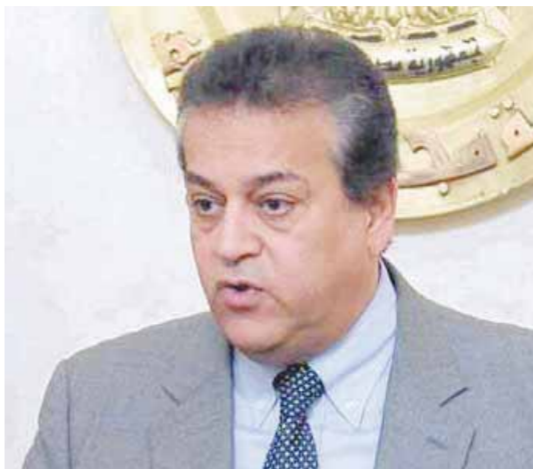
د. خالد عبدالغفار