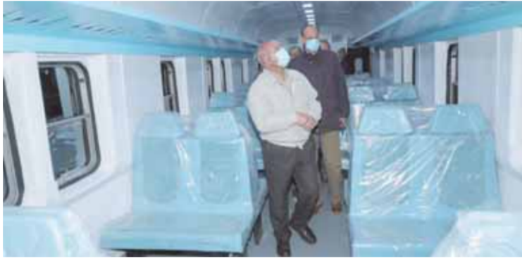
الوزير خلال تفقده تطوير عربات الركاب

الصيانة الدورية لها، وأضاف الوزير، أن هناك أنشطة عديدة أخرى مطروحة للاستثمار في مجال السكك الحديدية وندعو كافة المستثمرين للاستثمار بها مثل (إنشاء شركة لإدارة وتشغيل نقل البضائع - إنشاء شركة لإدارة وتشغيل القطارات السياحية - إنشاء شركة للخدمات المتكاملة - إنشاء شركة للنقل المتميز (قطارات تالجو - العربات المكيفة الروسي) - إنشاء شركة لإصلاح وعمرة وتطوير عربات الركاب- إنشاء شركة لإصلاح وعمرة وتطوير عربات البضائع - إنشاء شركة جديدة لإصلاح وعمرة وتطوير الجراررات الجديدة - إنشاء شركة لإصلاح وعمرة وتطوير الجراررات القديمة - مشاركة شركة إيرتراك في أعمال تجديد وصيانة الخطوط الحديدية - إنشاء شركة جديدة لتجديد وصيانة الخطوط الحديدية).