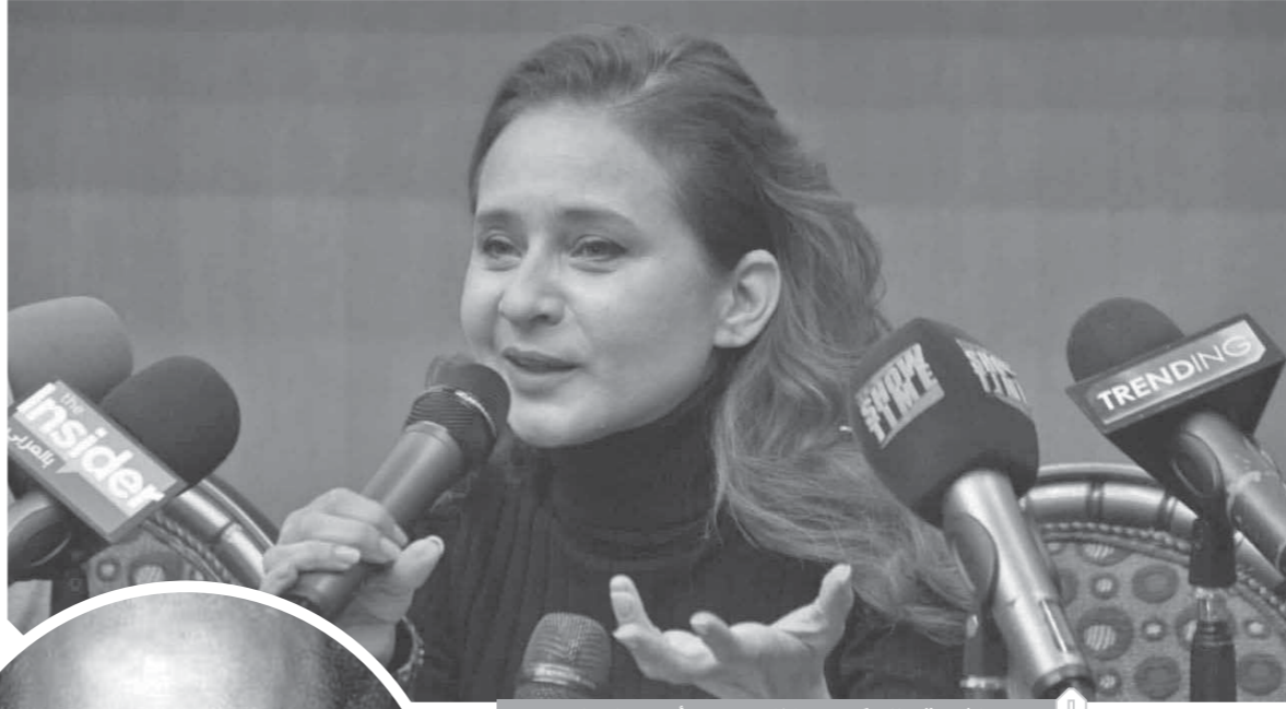
الفنانة نيللى كريم خلال مهرجان أسوان الدولى

إننى نسخة مشوهة من نيللى وشريهان. وأضافت نيللى: « فى هذا التوقيت لم يكن يضرق عندى التمثيل إلى أن عرض على بعد ذلك العمل فى الدراما مع الأستاذة الكبيرة فاتن حمامة ووافقت فوراً ولم أفكر أو أسأل عن الدور أو الأجر وقت بتقديم شخصية فتاة أكاديمية الفنون وكانت محطة الفوازير بوابتي لما أنا عليه الآن». كتبت - أمجد مصباح: