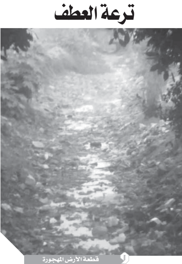
قطة الأرض المهجورة

انقطاع المياه طوال هذه الفترة ووعدهم المسئولون بتوصيل المياه التى هلكت بسبب تأخر المياه بما ليست بسبب نقص المياه فى هذه التركة ممتدة من قرية المستمر وقعاى المسئولين عن منطقة العطف والقرى المجاورة وهذه التركة بها مئات الأفدنة وجميعها يعتمد على مياه هذه التركة التى لم تات منذ أكثر من شهر، وقد توجه المزارعون إلى رى العياط لتقديم شكواى بسبب