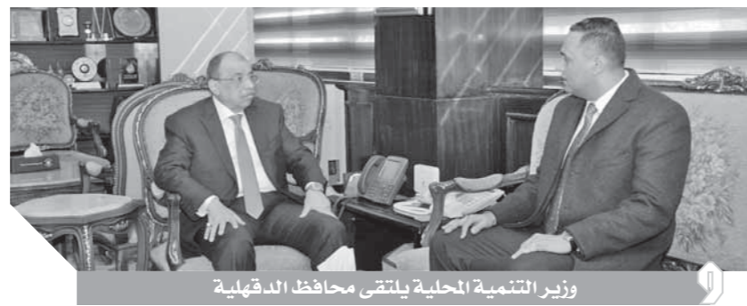
وزير التنمية المحلية يلتقى محافظ الدقهلية

كما تم خلال اللقاء أيضاً مناقشة إجراءات طرح كراسة الشروط لعملية المعالجة وتأهيل المصانع الموجودة فى ٥ مواقع بالمحافظة، والتعاقد مع الهيئة العربية للتصنيع لنقل القمامة إلى مركز بلقاس لحين الانتهاء من أعمال تطوير المصانع فى المواقع الموجودة على أرض المحافظة. ووجه وزير التنمية المحلية بتشكيل لجنة فنية من الوحدة التنفيذية لإدارة المخلفات بالوزارة والمختصين بالمحافظة ووزارة البيئة والهيئة العربية للتصنيع لوضع خطة مستدامة لتطوير المنظومة