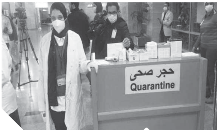
استعدادات الحجر الصحي

بدء الدراسة به الفصل الدراسي الثاني» في المدارس والجامعات.