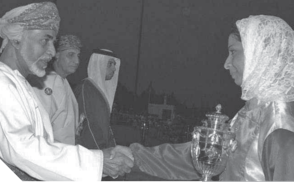
المغفور له السلطان قابوس بن سعيد طيب الله ثراه أعطى المرأة مكانة بارزة في المجتمع

السباق التاريخي حضور المرأة في السياق التاريخي، يفسر اهتمام السلطان الراحل بها في بناء الدولة المدنية الحديثة، باعتبار مكانتها امتداداً تاريخياً، وليست مكانة فرضتها ظروف آنية واتفاقات أممية.. لكن لا شك أن المرحلة التاريخية التي سبقت انطلاق الدولة الحديثة في سلطنة عُمان عكست ظلالتها على واقع المجتمع بعناحيه، وكان جناح المرأة الأكثر تضرباً، وكان لا بد من استعادة دور الجناحين ليستطيع المجتمع التحليق بالدولة عالياً بشكل متوازن. فالتاريخ العماني يكشف عن مكانة للمرأة تعادل مكان الرجل، فأقدم ملك تحفظه كتب التاريخ لعُمان كان امرأة هي الملكة شمسة التي ذكرها عبدالله الطائي في كتابه تاريخ عُمان السياسي، وكانت المرأة في سياق التاريخ العماني فتيهة وعاملة ومقتية ومرحبا لحل الخلافات السياسية إبان التورات، بل إنها كانت وصية على الحكم كما كان الحال مع السيدة موزة ابنة الإمام أحمد بن سعيد البوسعيدي. وكان فكر التورتا، بل إنها كانت وصية على طيب الله ثراه، وأياً لكل تلك التفاصيل التاريخية التي راكمها المجتمع العماني، وكذلك أكد عليها منذ خطاباته الأولى واهتمامه العملي الذي لم يفرق بين الرجل والمرأة. ولأن أهم ما يميز به فكر السلطان