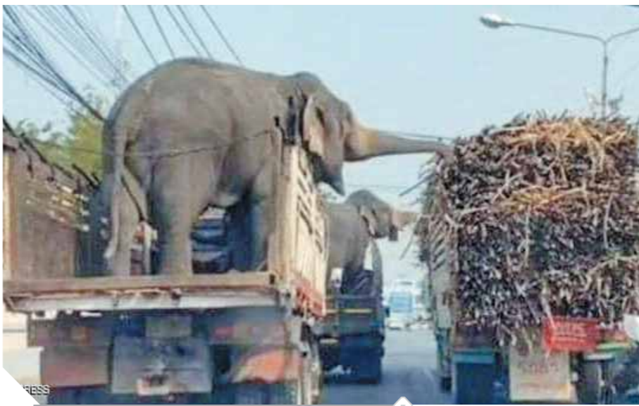
الفيل يلتهم القصب اثناء التوقف في إشارة المرور