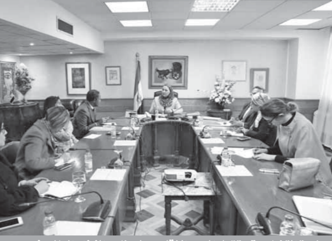
وزيرة التضامن تستقبل المدير الإقليمي لبرنامج الغذاء العالى فى مصر

من خلال البرنامج القومى للتغذية المدرسية الذى يعد إحدى آليات الحماية الاجتماعية، وتقود منظومته وزارة التربية والتعليم مع وزارات التضامن والصحة والتموين، إضافة إلى هيئة سلامة الأغذية. وفى إطار التمكين الاقتصادى اعرب المدير الإقليمي لبرنامج الأغذية العالمى فى مصر عن دعم سيل التعاون مع الوزارة خاصة بما يملكه برنامج الأغذية العالمى من خبرات وقدرة على العمل بمحافظات الصعيد والمحافظات الحدودية، كذلك إمكانية تقديم سيل الدعم فى مجال بناء قدرات جمعيات تنمية المجتمع وبرامج الشمول المالى. وقد أسفر اللقاء عن الاتفاق على عقد ورشة عمل بمحافظة الأقصر خلال فبراير الجارى تضم عدداً من ممثلى الوزارات المعنية لدراسة سيل التعاون فى مجال التوظيف من خلال برنامجى حياة كريمة وفقرصة.