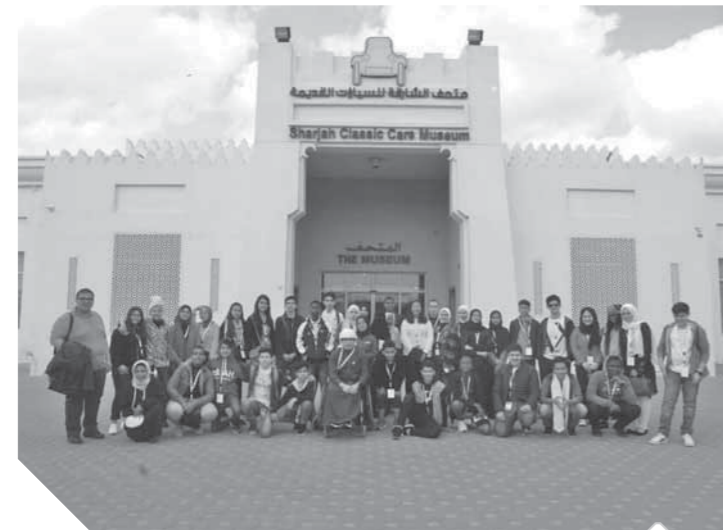
أعضاء البرلمان العربي للطفل يواصلون جولاتهم

الراحل السياسي والاجتماعي والاقتصادي والثقافي، يمكن في فهمه العميق للتاريخ وقراءته الدقيقة له في سياق تحولات الإنسان وتطوره، فقد كان تعامله مع المرأة منذ الأيام الأولى للنهضة الحديثة تعامل جناح في جسد طائر، فقد قال: «الوطن في مسيرته المباركة، يحتاج إلى كل من الرجل والمرأة فهو بلا رب، كالطائر الذي يعتمد على جناحيه في التحليق إلى آفاق السماوات، فكيف تكون حاله إذا كان أحد هذين الجناحين مهيضاً منكسراً؟ هل يقوى على هذا التحليق..» وفي هذا التشبيه بلاغة كبيرة تعكس فهم مكانة المرأة، فليست هي النصف الثاني، هي جناح، وعند الحديث عن الأجنحة لا يمكن أن تعطي أحد الجناحين أهمية أقل من الجناح الآخر.. وبهذا المعنى حضرت المرأة في المشهد العماني منذ اليوم الأول، فعندما فتحت المدارس تحت ظلال الأشجار كانت للجميع دون استثناء، بل إن التركيز كان على المرأة أكثر من غيرها