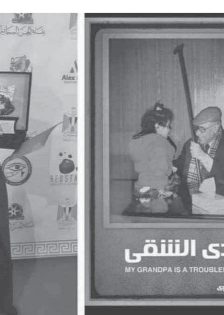
إخراج: مئة البراقوة

جدو وعازونى تتكلم عن مرحلة المنفى فى حياة جدو.. واندنشت لاختيار مئة هذه الفترة الحرجة فى حياتنا بكاملها. هى أسوأ ألف مرة من سنوات الاعتقال والسجن، وهى أفسى على النفس من كل ما مر بحياتنا من أحداث مريرة. فهى السنوات التى تم فيها.. انتشار أسرة السعدنى من الطينة التى نشأت فيها وهى ليست طينة عادية ولكنها طينة الأرض الشديدة الخصوبة فى كل بقاع المحروسة، إنها أرض الجيزة الطيبة وناسها الودودون، متحف