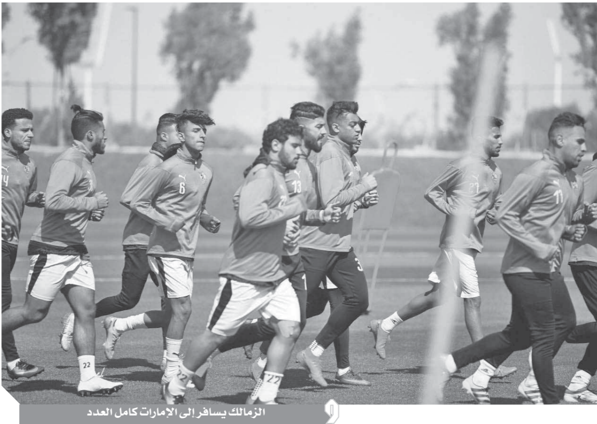
الزمالك يسافر إلى الإمارات كامل العدد