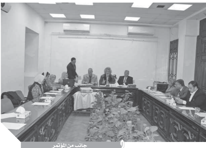
جانب من المؤتمر

أما الأعراض فهي ارتفاع درجة الحرارة فوق ٣٨ درجة، وضغوية في التنفس، مع الأخذ