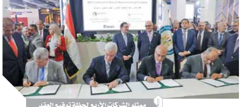
ممثلو الشركات الأربع لحظة توقيع العقد

ومن المقرر أن يلبى المشروع احتياجات صعيد مصر من المنتجات البترولية الأمر الذى سيكون له أكبر الأثر فى تقليص حجم الاستيراد لهذه المنتجات والإسهام فى توفير العملة الأجنبية، كما سيؤدى المشروع إلى فتح آفاق جديدة للتنمية وخلق فرص عمل جديدة فى منطقة الصعيد.