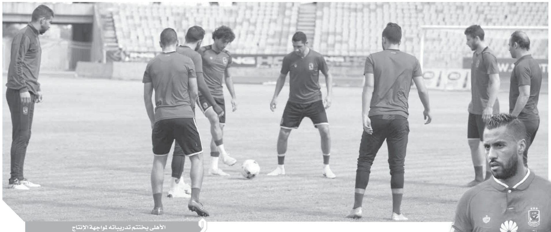
الأهلى يختم تدريباته لمواجهة الإنتاج