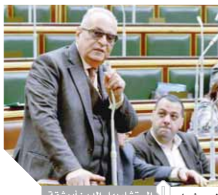
المستشار بهاء الدين أبوشقة

لاحتفال بمئوية ثورة 1919 ومئوية تأسيس حزب الوفد