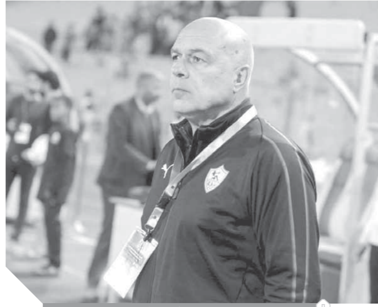
جروس في ورطة