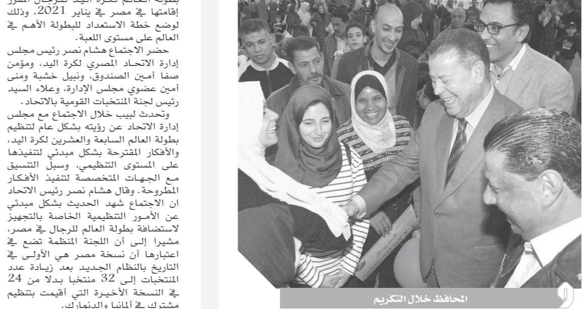
الحافظ خلال التكريم

كتب- محسن عبدالكريم: تضمن الاحتفال تكريم 150 من المتفوقين رياضياً من أبناء نادي بنى سويف و90 من أبناء نادي متحدى الإعاقة، الذين حصلوا على مراكز متقدمة فى عدد من المسابقات والبطولات التي شاركوا فيها سواء على مستوى المحافظة أو على مستوى الجمهورية، فى بعض الألعاب والرياضات المتنوعة، بجانب تكريم بعض النماذج الشبابية الناجحة الذين مثّلوا بنى سويف فى مؤتمرات الشباب الرئاسية، حيث سلم المحافظ المكرمين ميداليات وشهادات تقدير. تضمن الاحتفال تكريم 150 من المتفوقين رياضياً من أبناء نادي بنى سويف و90 من أبناء نادي متحدى الإعاقة، الذين حصلوا على مراكز متقدمة فى عدد من المسابقات والبطولات التي شاركوا فيها سواء على مستوى المحافظة أو على مستوى الجمهورية، فى بعض الألعاب والرياضات المتنوعة، بجانب تكريم بعض النماذج الشبابية الناجحة الذين مثّلوا بنى سويف فى مؤتمرات الشباب الرئاسية، حيث سلم المحافظ المكرمين ميداليات وشهادات تقدير.