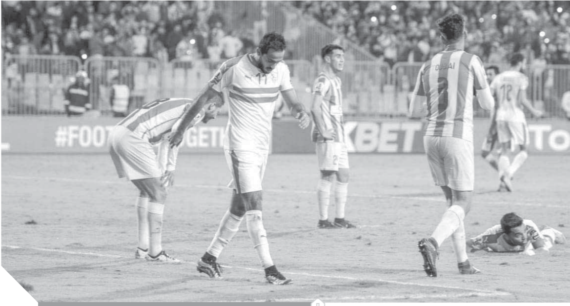
كهريا خرج ولم يعد!