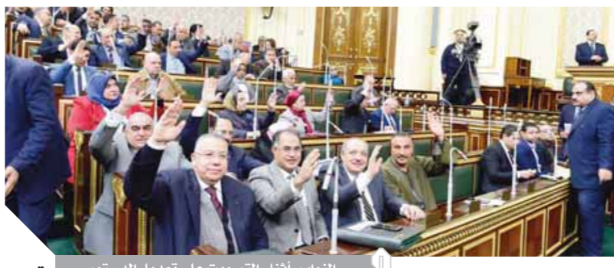
الوفد، أثناء التصويت على تعديل الدستور